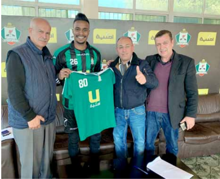
جانب من التوقيع