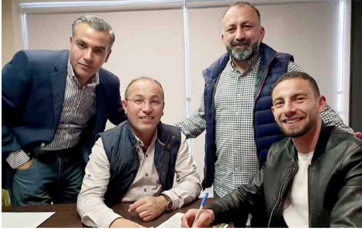
جانب من التوقيع