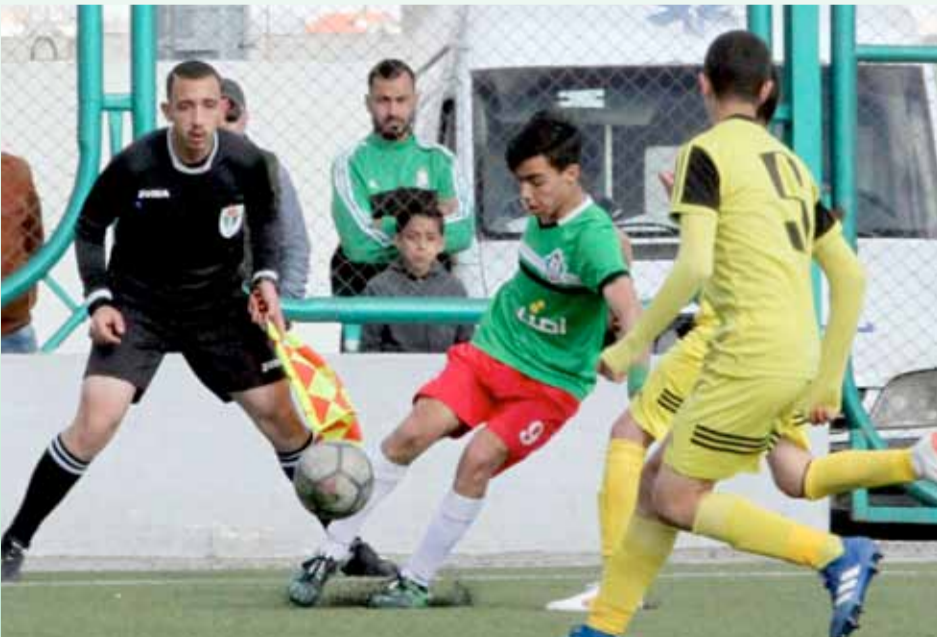
قوة الوحدات الهجومية كانت صاحبة الكلمة الفصل في اللقاء

استحق فريق "وحداتي 15" أن يكون بطلاً للدوري وذلك بعدما استطاع أن يحقق ٤٥ نقطة من ١٨ لقاء خاضه، حيث حقق الفوز في ١٤ لقاء، وتعادل في ثلاث مباريات، وخسارة واحدة فقط، ليكون البطل بلا منازع، في الوقت الذي حصده به الفريق أيضاً لقب أفضل خط هجوم برصيد ٤٧ هدف، وأقوى خط دفاع حيث دخل مرماه ٨ أهداف فقط.