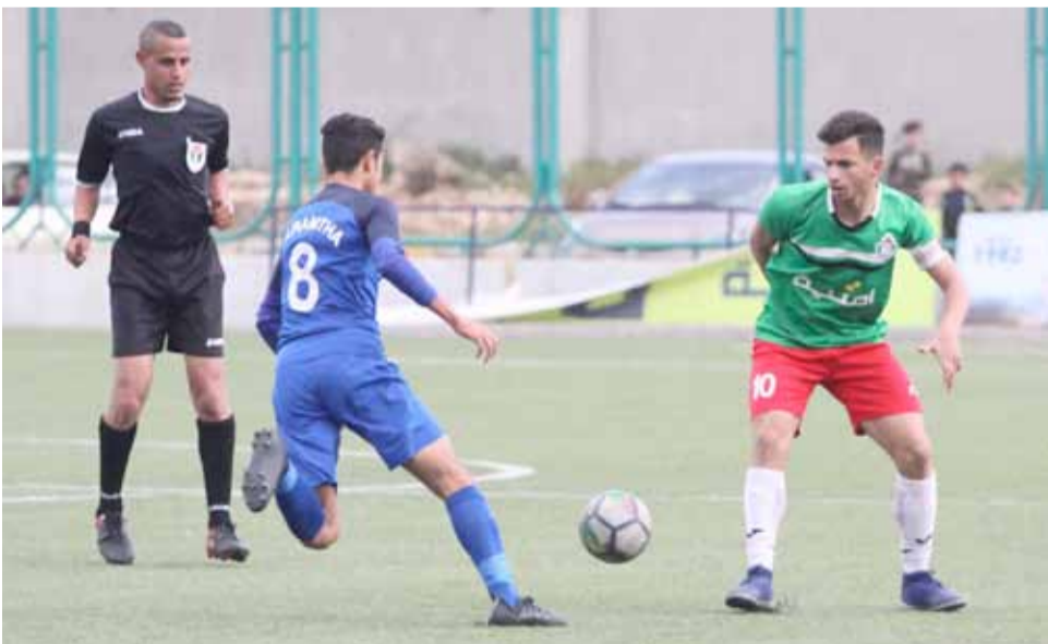
"وحداتي 17" وقع في مصيدة الغزلان

الوحدات لم يتمكن فريق الوحدات سن 17 من مواصلة حصده للانتصارات ووقع لأول مرة في شرك الخسارة أمام شقيقه الرمثا بنتيجة (2-1)، وذلك في اللقاء الذي جمع الفريقين لحساب الجولة قبل الأخيرة من بطولة دوري سن 17 لأندية المحترفين "البنك العربي" على ملعب النادي في منطقة عمدان. ليخرجوا فائزين في اللقاء. وبهذه النتيجة بقي رصيد الوحدات 02 نقطة في المركز الأول، فيما ارتفع رصيد الرمثا إلى 40 نقطة في المركز الثاني، الجدير ذكره أن الخسارة لن تؤثر على الوحدات الذي توج نفسه بطلاً لبطولة الدوري قبل النهائية بأربع جولات، مع بقاء الجولة الأخيرة يوم السبت المقبل.