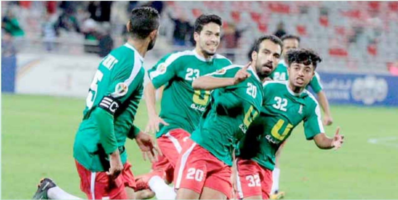
هذا ما نريده في صفوف فريق الكرة الأول... صنع في الوحدات

يقاس على عدد اللاعبين الذين يتم رفق صفوف الكرة الأول والمنتخبات الوطنية بمواهبهم، لذا نجد أن اهم البطولات تتلخص في فئة ١٤ سنة، كونها تنقل لاعب الاكاديمية الى تكتيك وأجواء الملعب الكبير، ونجاح المدرب في ذلك، يعني أسست لقاعدة كروية لسنوات، وكذلك القب فئة ١٩ سنة باعتبارها بوابة العبور الى صفوف فريق الكرة الأول.