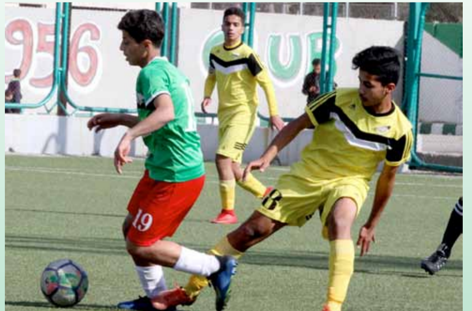
دفاعات الحسين عجزت عن إيقاف الهدير الهجومي للوحدات الاب "الخشونة المفرطة"