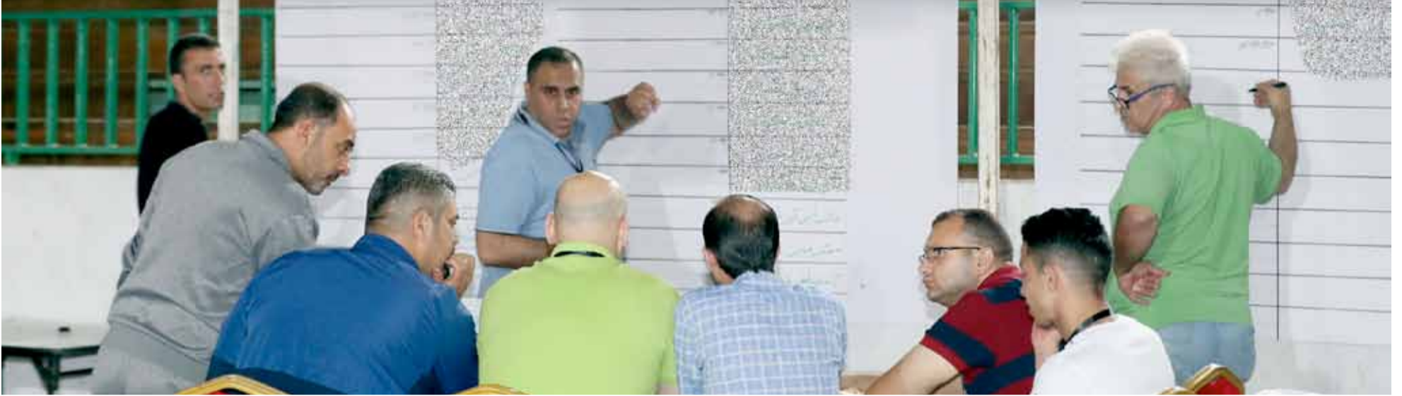
جانب من العملية الانتخابية الماضية في نادي الوحدات