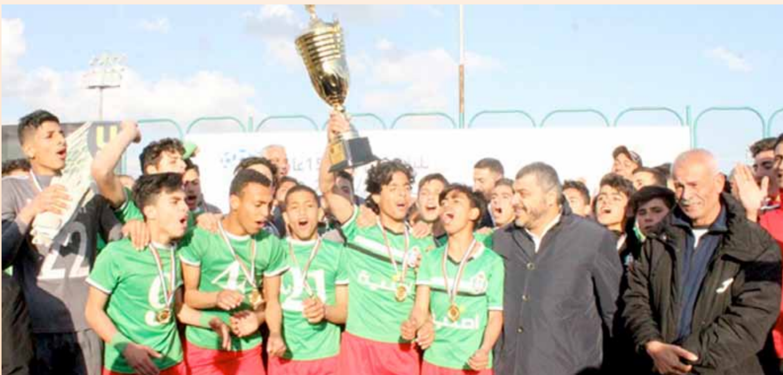
فريق الوحدات سن 15 حصد اللقب... عن جدارة واستحقاق

شاملة وطموحة لمجلس الإدارة حتى تكون الاستفادة أكبر من هذا القطاع الذي تستفيد منه الاندية الأخرى أكثر من نادينا.