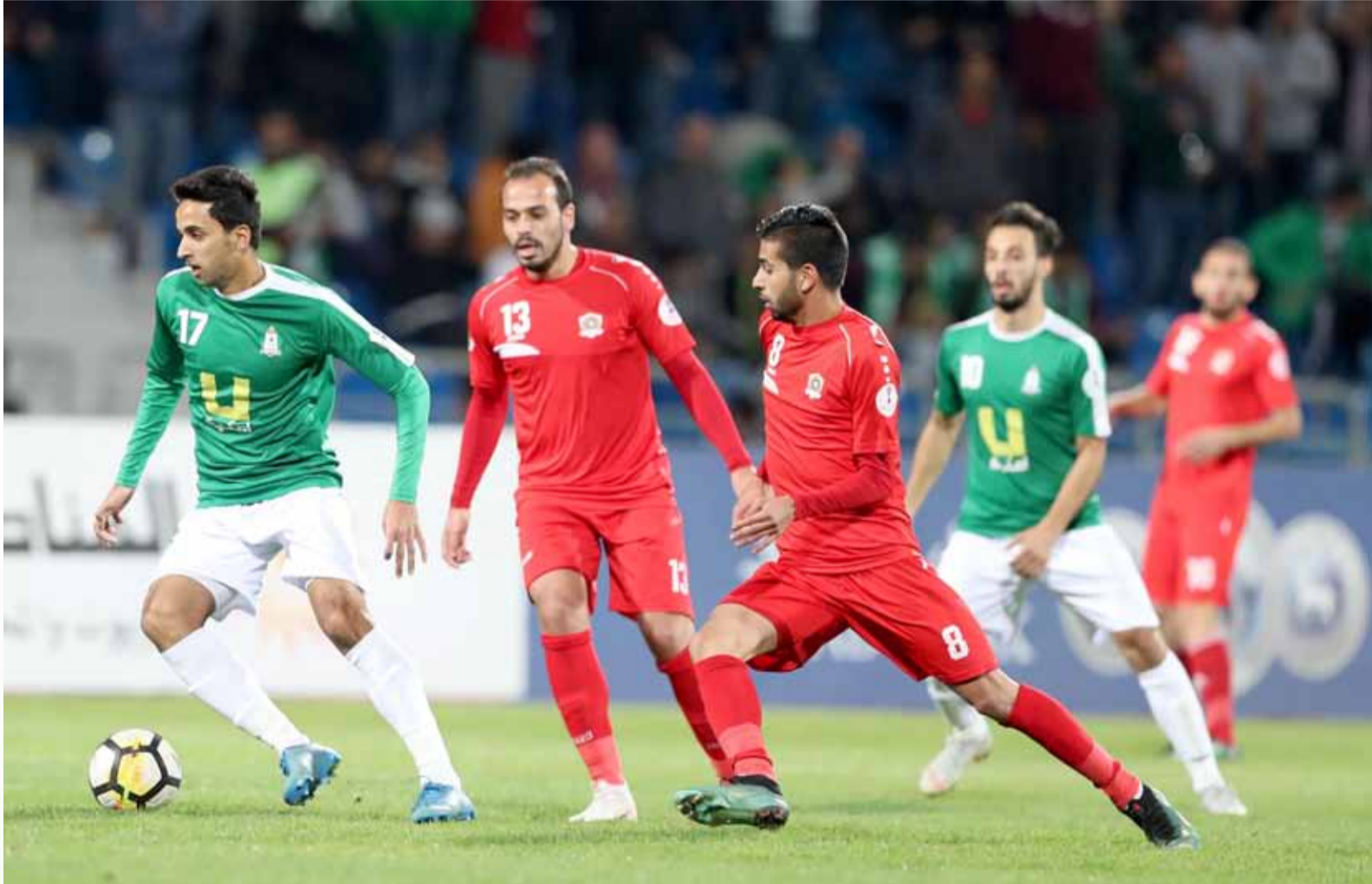
جانب من لقاء الوحدات والجزيرة في مرحلة الذهاب

تحمل مواجهات الوحدات والجزيرة رائحة القوة