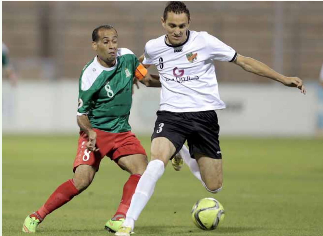
جانب من لقاء الوحدات الأهلي موسم 2015-2016