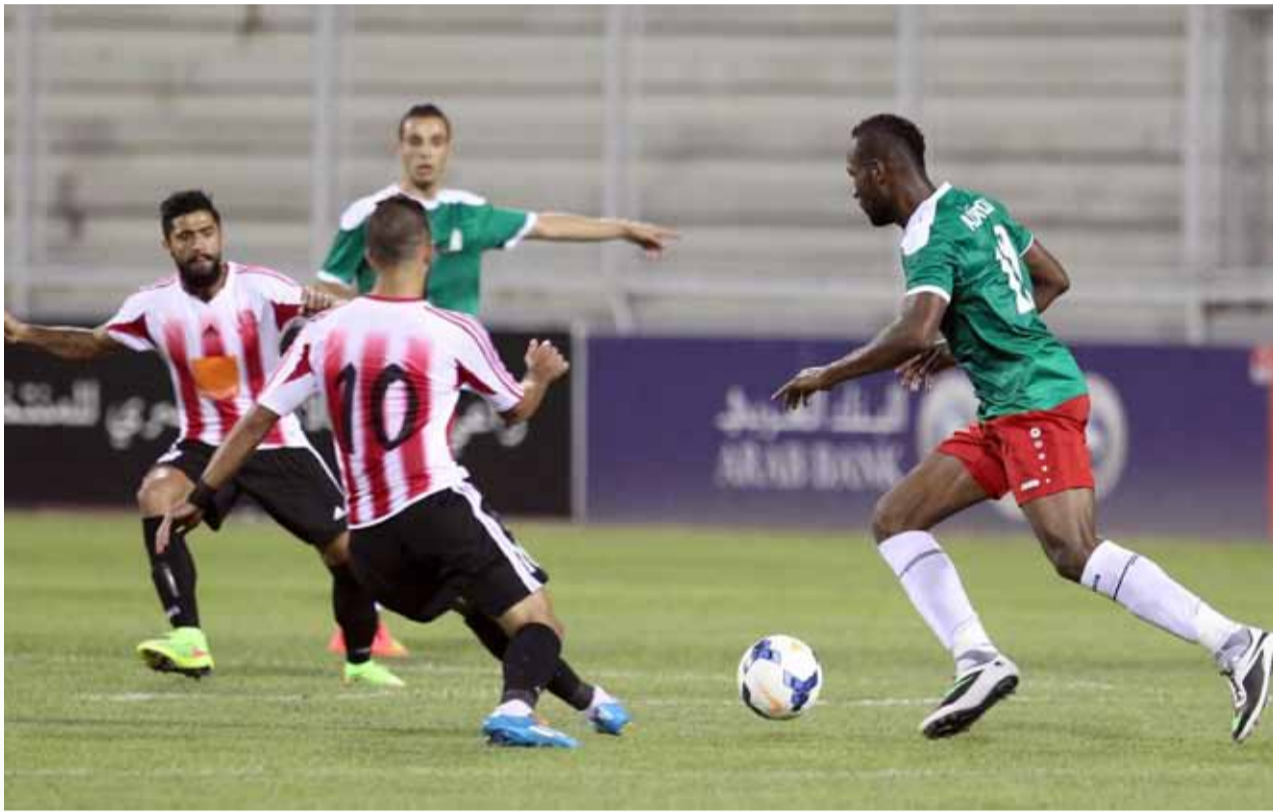
جانب من لقاء الوحدات وشباب الأردن موسم 2014-2015