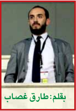
بقلم: طارق غصاب

في المغرب كان المجتمع الكروي مشتاقاً للعودة إلى مكانته في القارة السمراء، بدأ رونار مشروعه بتأسيس منتخب قوي فبدأ العمل والبحث عن اللاعبين المحترفين واقتناعهم باللعب مع المغرب بالإضافة إلى إكتشاف مواهب في الدوري المحلي، كان الهدف الأول هو العودة لكأس الأمم الأفريقية وتجاوز الدور الأول وهو ما تحقق في العام ٢٠١٧ بتجاوز الدور الأول، قبل أن يتحقق الحلم المغربي بالتأهل لكأس العالم بجدارة على حساب منتخب ساحل العاج محققاً حلم المغربيين وحلمه الشخصي بالتواجد في كأس العالم حيث قدم كرة قدم جميلة عابها الحظ السيئ حيث خرج بعد تقديم مستويات كبيرة أمام العملاقة الإسبانية والبرتغاليين مثبتاً بأنه يستحق لقب ثعلب الكرة الأفريقية ومكافئاً نفسه على صبره وتعبه فيما قدمه في البدايات! ليس معيباً أن تعمل لتعيل نفسك، لكن المعيب هو التخلي عن أحلامك والإستسلام لروتين وهمي خلقتة لنفسك فجعلته حاجزاً بينك وبين ما تحب... فما نيل المطالب بالتمني !!