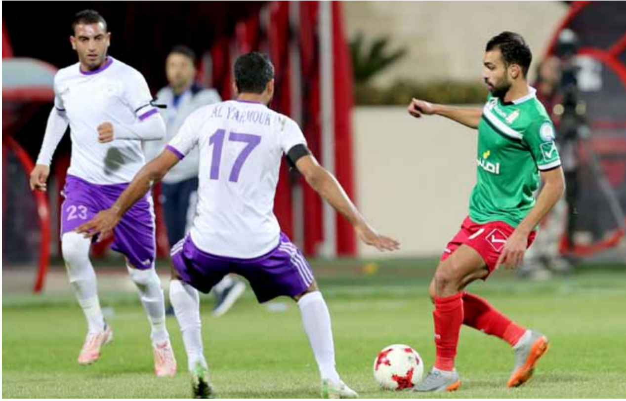
جانب من لقاء الوحدات واليرموك موسم 2017-2018