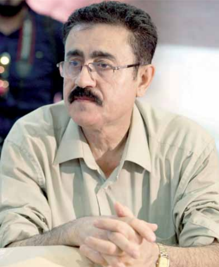
أمين السر الناطق الرسمي خضر صوان