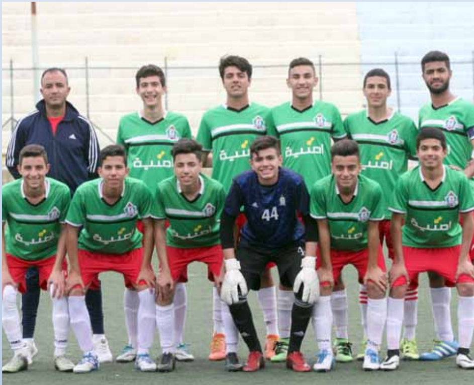
فريق الوحدات سن 17 يحطم الأرقام القياسية في دوري فئته