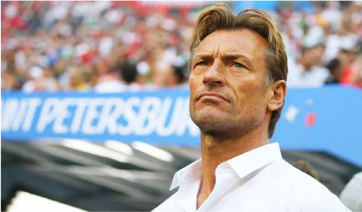
الفرنسي هيري رونار

الفشل فيها فكانت العودة لقارته الكروية الأم هي الحل لكن هذه المرة مع ساحل العاج التي حاولت كثيراً نيل البطولة بعد غياب دون نتيجة، قاد رونار ساحل العاج لتحقيق اللقب القاري أخيراً بعد غياب ٢٣ عاماً ليصبح بعمر ٤٥ أول مدرب يحقق لقب كأس أمم أفريقيا مع منتخبين ليعود مرة أخرى إلى فرنسا مع ليل إلا أن الغربة عن القارة الأفريقية كانت صعبة فعاد سريعاً لكن هذه المرة مع منتخب أسود أطلس المغربي!