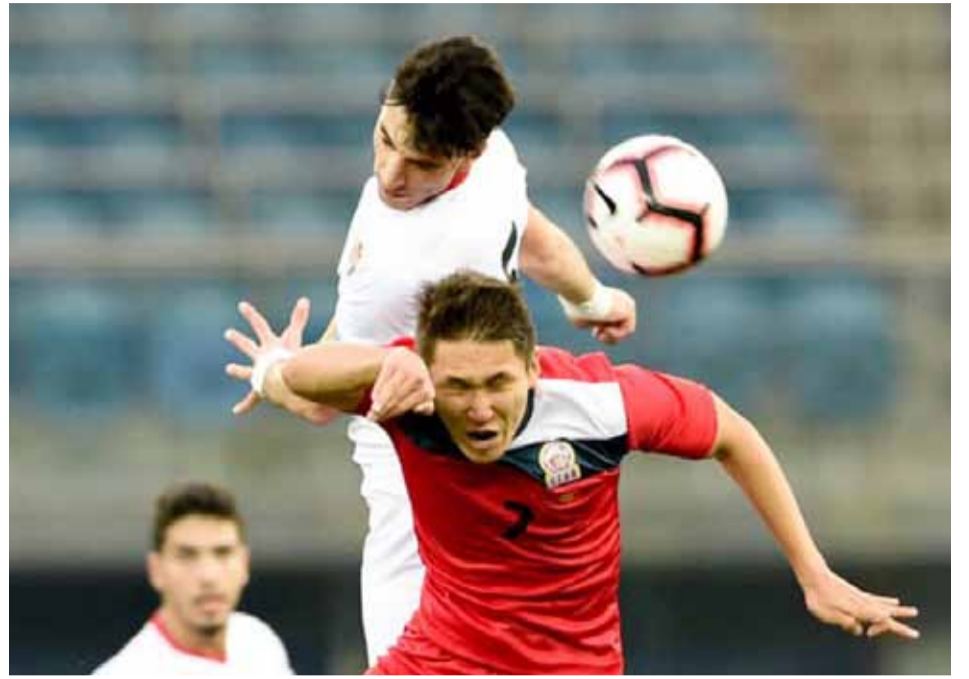
جانب من لقاء المنتخب الاولمبي وقيرغيزستان