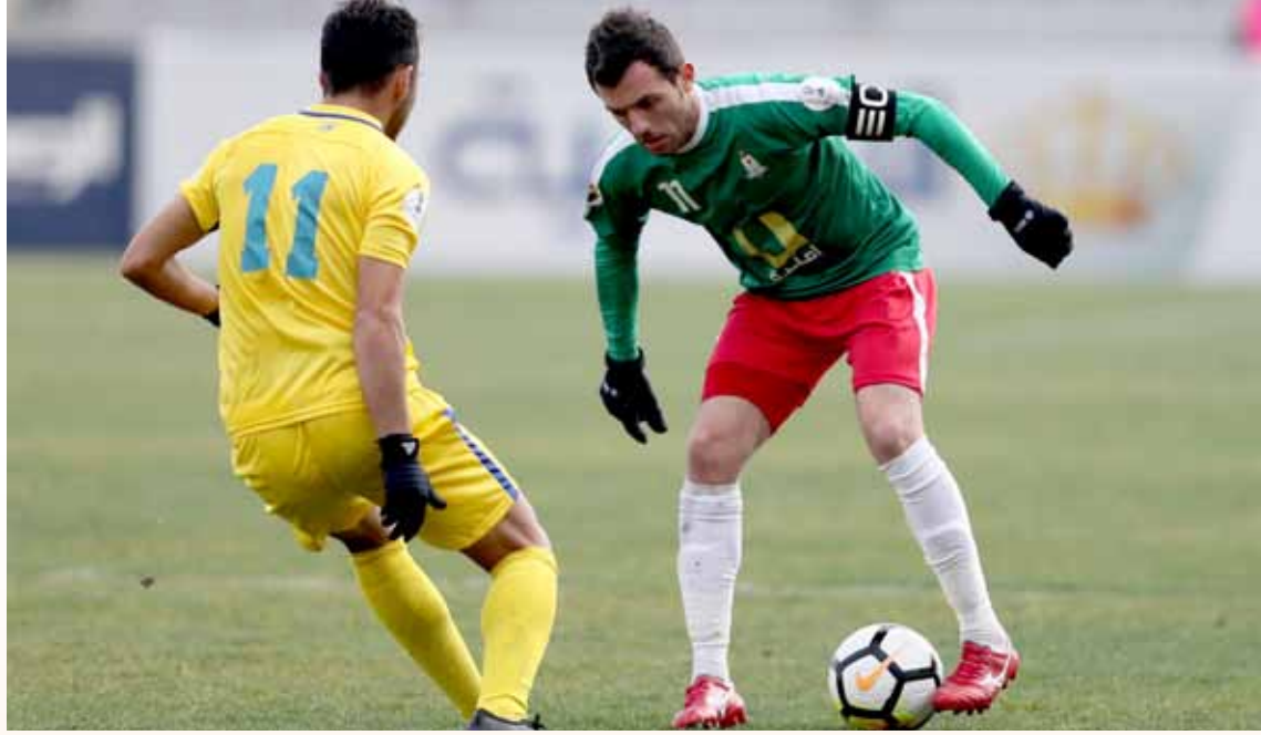
الوحدات عاقب الحسين إربد على جراته برباعية مدوية

تنطلق مباريات الاسبوع الرابع عشر في الرابعة من مساء يوم بعد غد الخميس، حيث يلتقي الحسين مع الجزيرة على ستاد الحسن، وفي السادسة والنصف وعلى ستاد عمان يلتقي الأهلي مع ذات راس، وفي الرابعة من مساء يوم الجمعة، يلتقي الصريح مع الوحدات على ستاد الحسن، وفي السادسة والنصف يلتقي البقة مع العقبة على ستاد عمان الدولي، وفي الرابعة من مساء يوم السبت المقبل، يلتقي شباب الأردن مع السلط على ستاد الملك عبدالله الثاني، وفي السادسة والنصف يلتقي الفيصلي مع الرمثا على ستاد عمان الدولي.