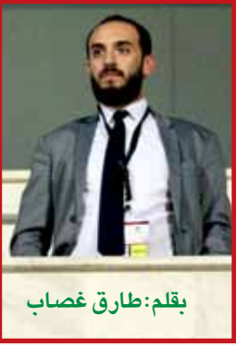
بقلم: طارق غصاب

القصة بأجمل أشكالها فإن بيتزارو سجل في مواجهة فريقه أمام هيرتا برلين ليصبح أكبر لاعب في تاريخ الدوري الألماني يسجل هدفا بعمر ٤٠ عام و ١٣٦ يوم بعد أن سبقها بنجاحه بتسجيل هدف في الدوري الألماني في كل عام بدءاً من العام ١٩٩٩.