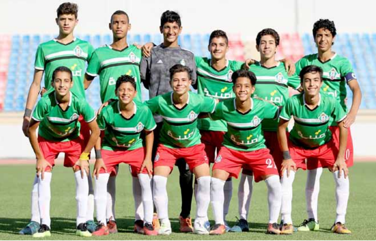
وحداتي 15 بطل بكافة المواصفات والمقاييس