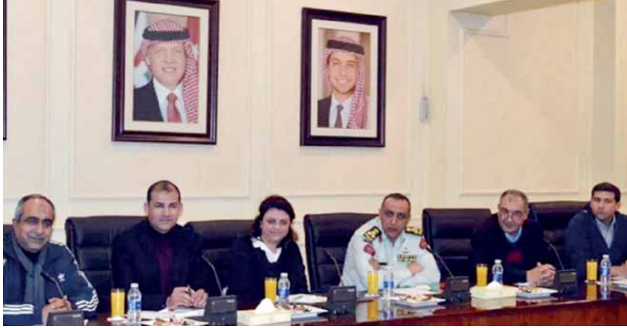
جانب من اجتماع اللجنة المؤقتة لاتحاد الكرة الطائرة