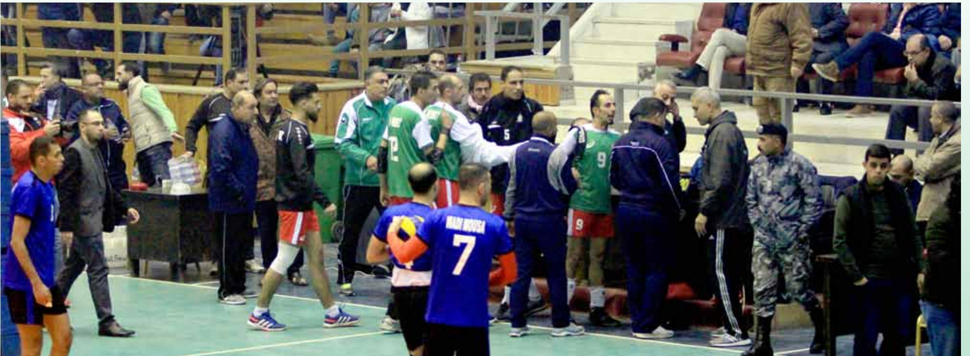
اعتراض نادي الوحدات لم يلقي اهتمام من الاتحاد السابق، وهو ما عجل برحيله

يهديكم رئيس وأعضاء مجلس إدارة نادي الوحدات تحياته لكم وأمنيته لكم بالتوفيق في مهمتكم الحالية بقيادة اتحاد اللعبة من خلال اللجنة المؤقتة، بناءً على ما تم عرضه في الاجتماع الأخير مع سمو الأميرة آية بنت الفيصل، وبحضور الأعضاء تم الاتفاق على القيام بتشكيل لجنة تحقيق لتدارس الأحداث التي رافقت مبارياتي الوحدات ووادي موسى ذهاباً وإياباً، وإننا إذ نضع بين أيديكم بعض الأحداث التي رافقت مجريات اللقاء بالتفصيل، مطالبين حضرتكم بالرجوع إلى تقرير مراقب المباراة التي جمعت الوحدات ووادي موسى في ذهاب بطولة الدوري، وتقديم تقريره للاتحاد مع تحفظنا على ما ورد به من بعض المغالطات وننتسأل، لماذا لم يجتمع الاتحاد لدراسة