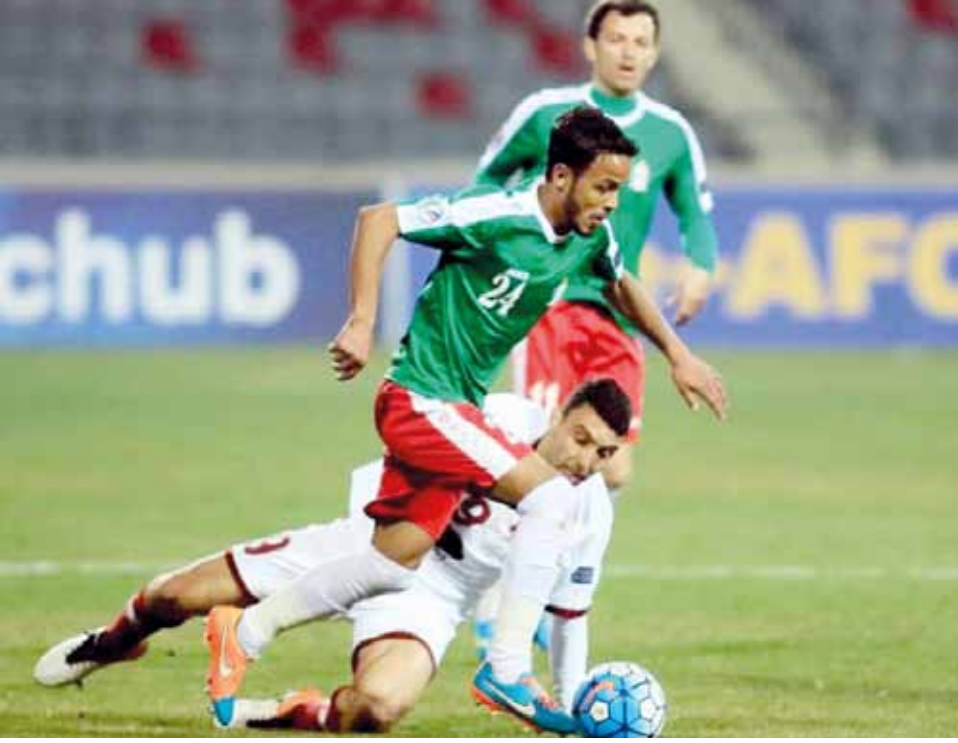
جانب من لقاء سابق لفريق الوحدات بالكأس الآسيوية