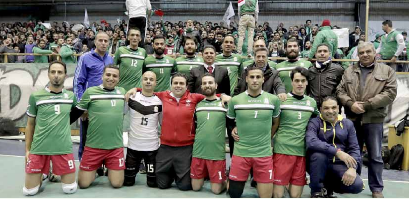
فريق الوحدات بطل اخر نسخة للدوري 2017