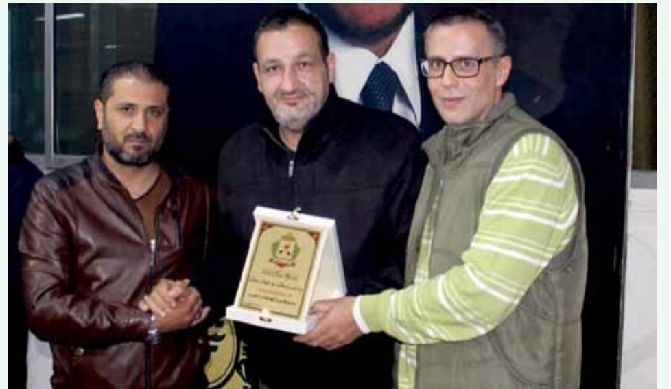
تكريم رابطة المشجعين