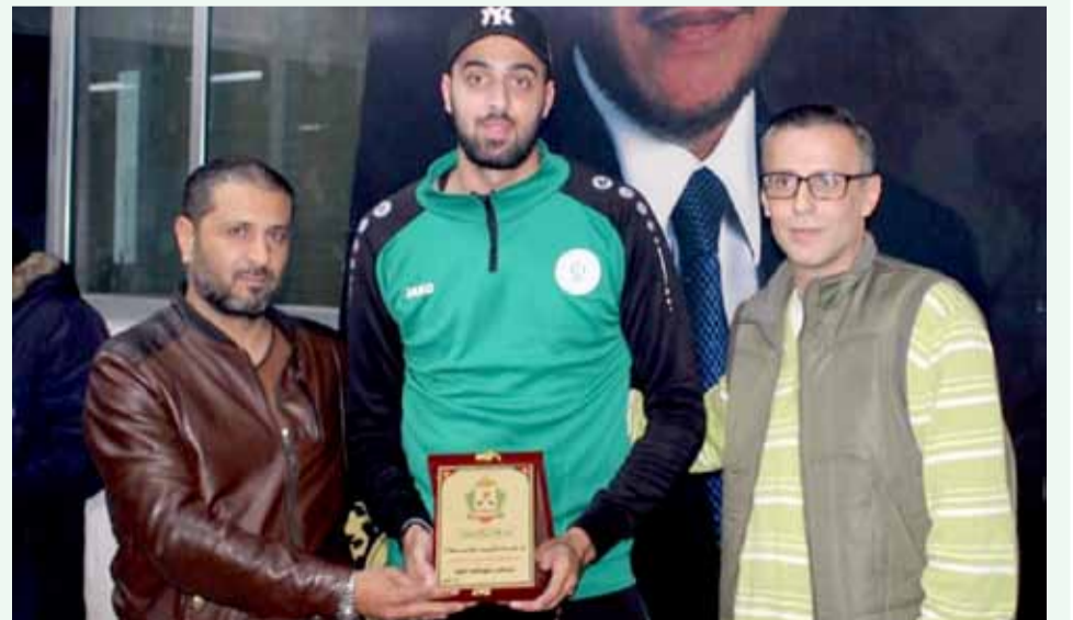
تكريم رابطة مشجعي الفئات العمرية