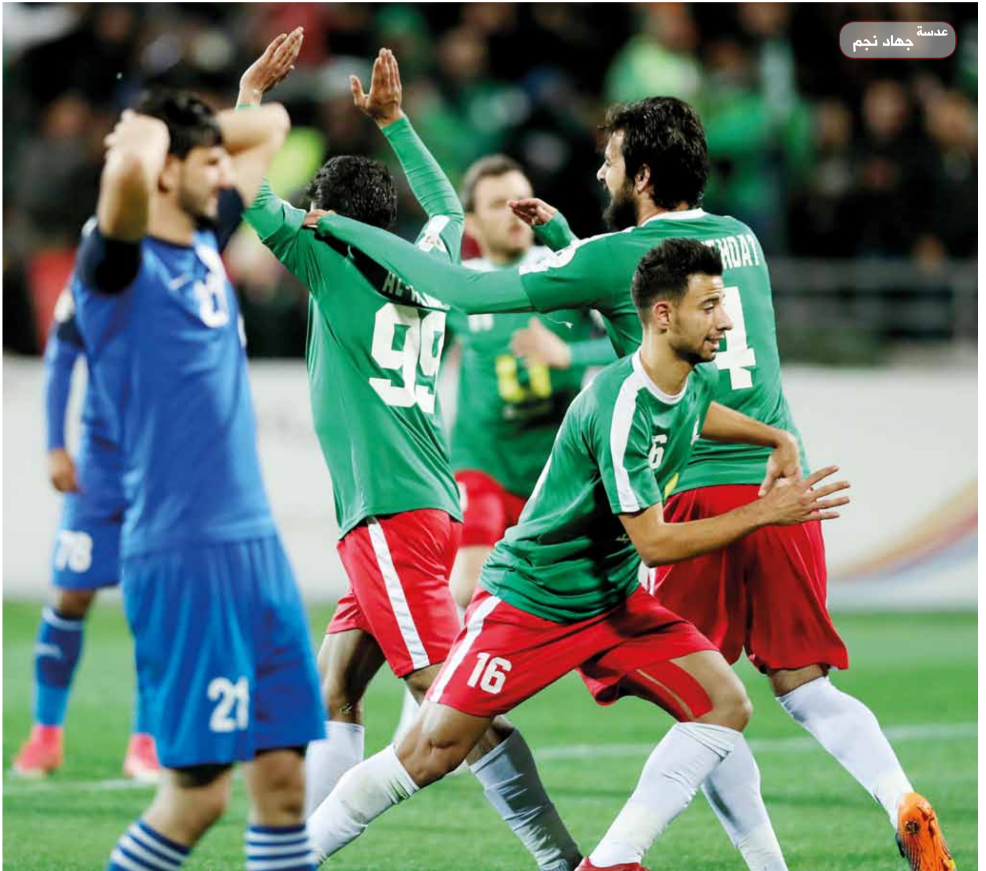
عدسة جهاد نجم