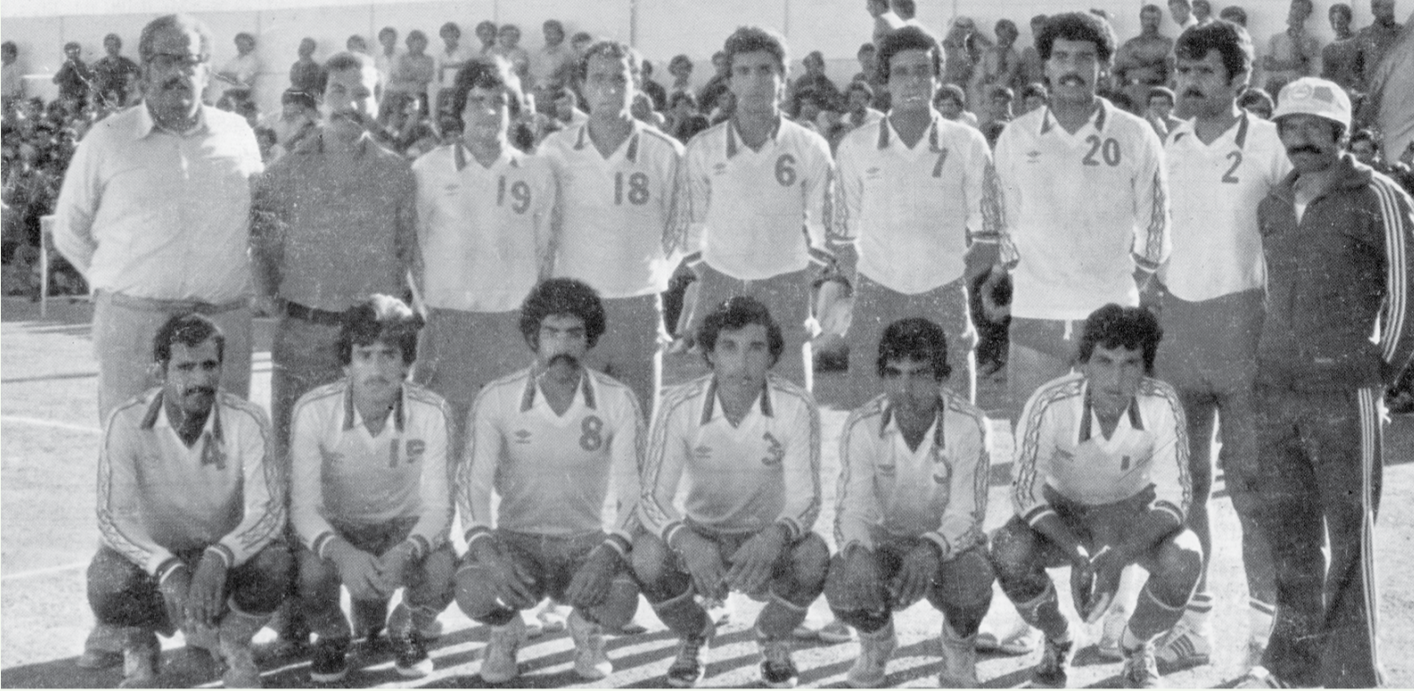
أول فريق للوحدات بالكرة الطائرة 1974