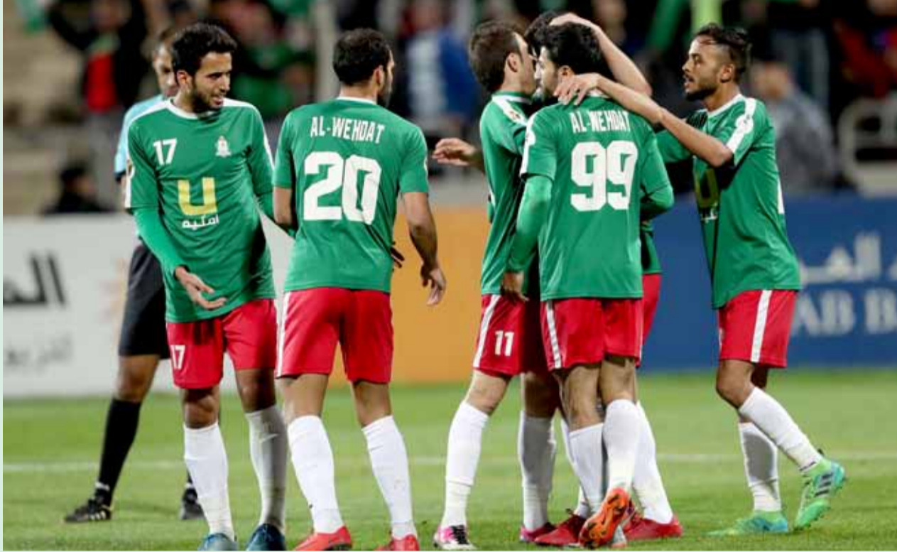
فرحة لاعبي الوحدات بعد التسجيل في مرمى الرمثا

كل وحداتي متأكد أن فترة التوقف ومدتها "65" يوم حتى تاريخه 5 شباط من العام المقبل لترتيب البيت الوحداتي وإعادة فريق الكرة إلى الواجهة من جديد عبر التقدم أكثر وصولاً إلى صدارة الدوري في أقرب وقت والمحافظة عليه للموسم الثاني على التوالي وهذا ليس بالأمر السهل أو حتى الصعب إذا ما بقيت النتائج التي يحققها الفريق مميزة إلى جانب تعثر الأندية التي تسبق "الأخضر" تقطياً.