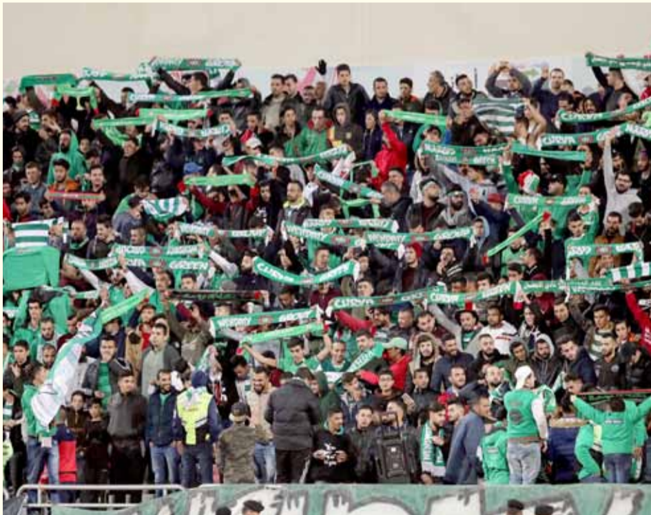
جماهير الوحدات تعود تدريجيا إلى المدرجات

مرجان، يزن ثلجي وبهاء فيصل، وربما يذهب ٤-٣ لاعبين نحو المنتخب الأولمبي، وهو ما يعني أن بداية التدريبات للمرحلة المقبلة التي يحارب فيها الفريق على "٣" جبهات ستكون منقوصة من "١٠" لاعبين على أقل تقدير، إلا أن الأمر الإيجابي أن الصفوف ستشهد استقطاب ٣-٤ لاعبين من بينهم ثنائي محترف حسب رؤية الجهاز الفني خلال