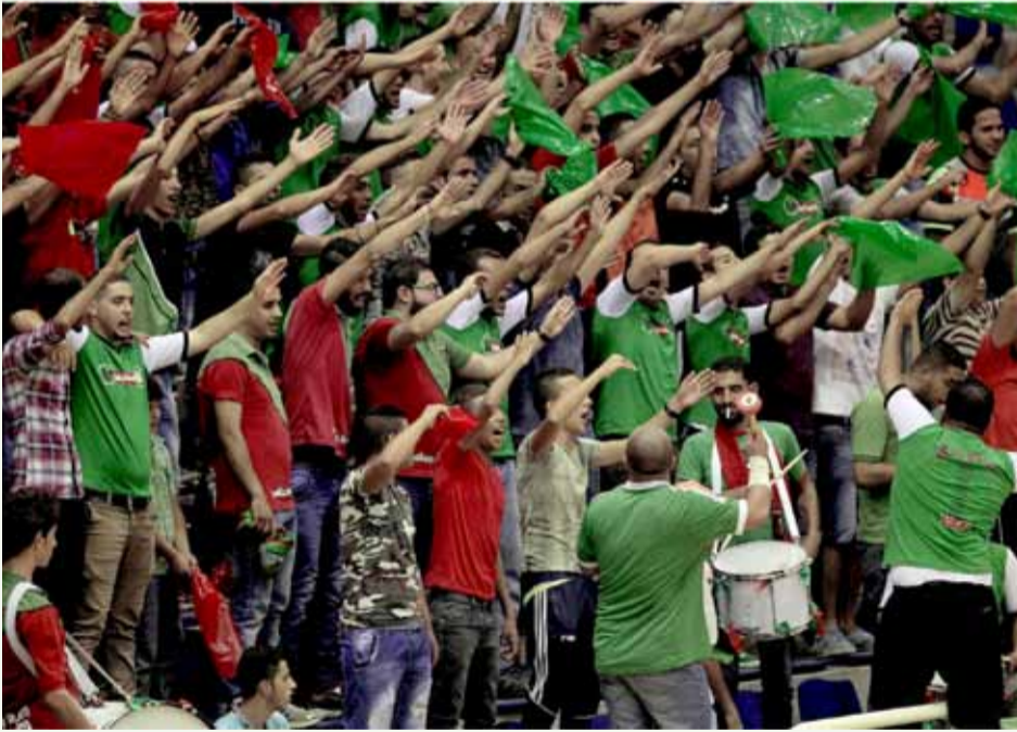
جماهير الوحدات مطالبة بالحضور ومساندة الفريق