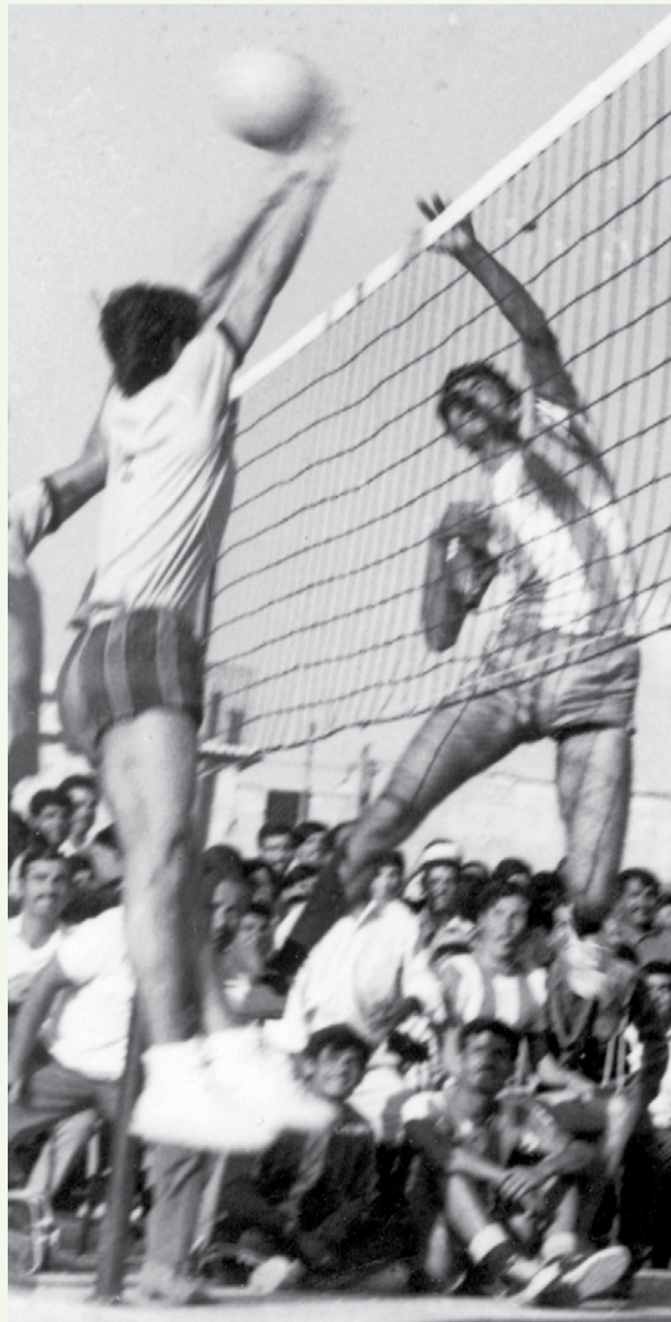
ساحقة ناصر الحوراني تجتاز ملعب شباب الحسين