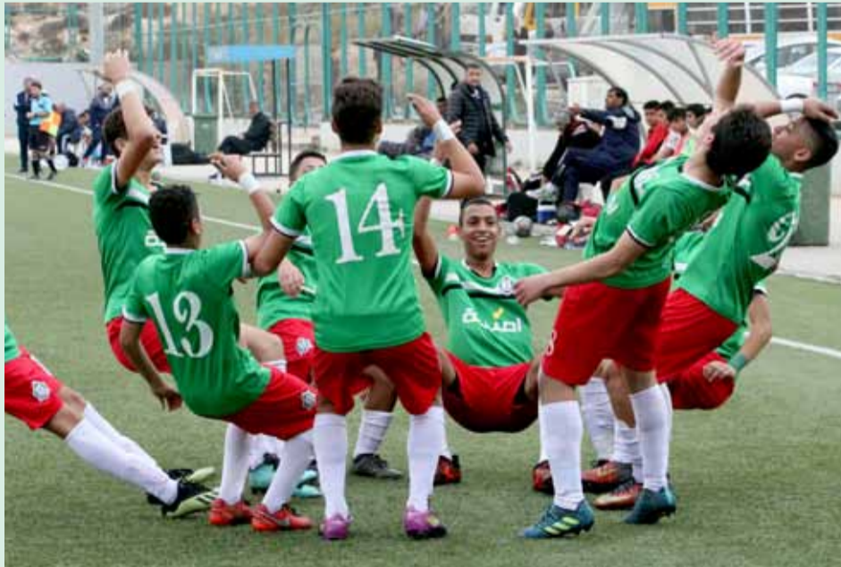
نجوم الفئات العمرية كنز لا ينضب

وينتظر أن يلتقي فريقنا نظيره الصريح في المباراة التي تبدأ عند الساعة الثانية والنصف من عصر يوم الخميس المقبل على ملعب النادي في منطقة غمدان.