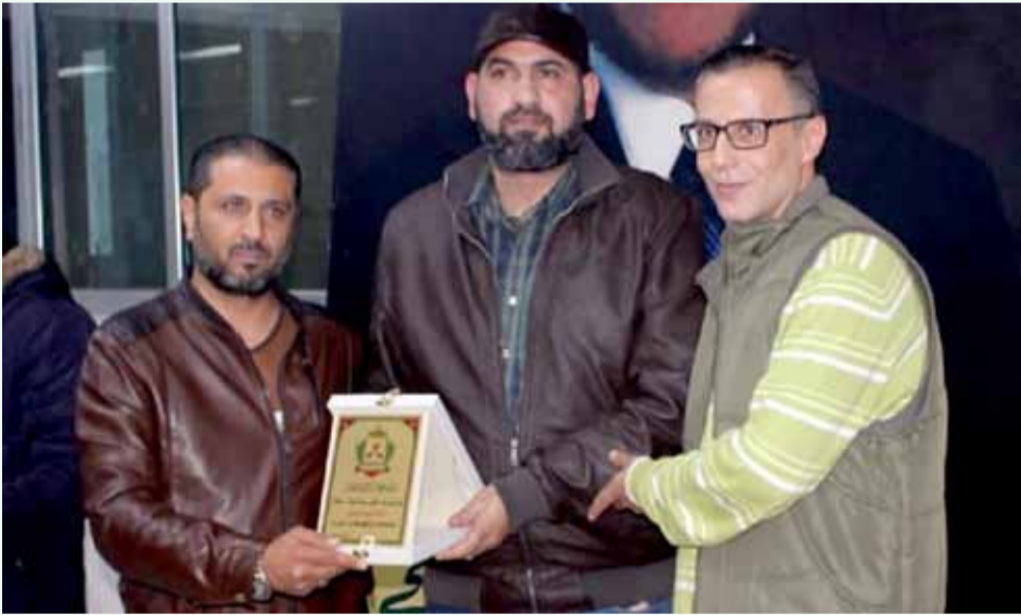
تكريم مجموعة وحداتي

الحفل الذي جاء بسيطاً في مفرداته عميقاً في كلماته وخاصة لدى الحاضرين والذين ارتسمت على محياهم رسائل عديدة تؤكد بأنهم كانوا وما يزالون على العهد والوعد خلف الوحدات في