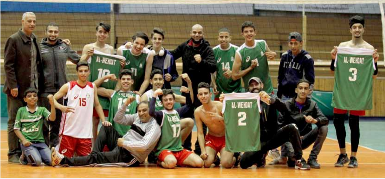
فريق الوحدات الشاب 2018

تدرجوا في صفوف النادي خلال فريق الناشئين، والآن نحن أمام محطة مهمة لقطف ثمار تعب السنوات الماضية من خلال الاهتمام بهذه الفئة من اللاعبين وتطويرها لضمان أن تكون خير ممثل للفريق الأول في المواسم المقبلة ان شاء الله.