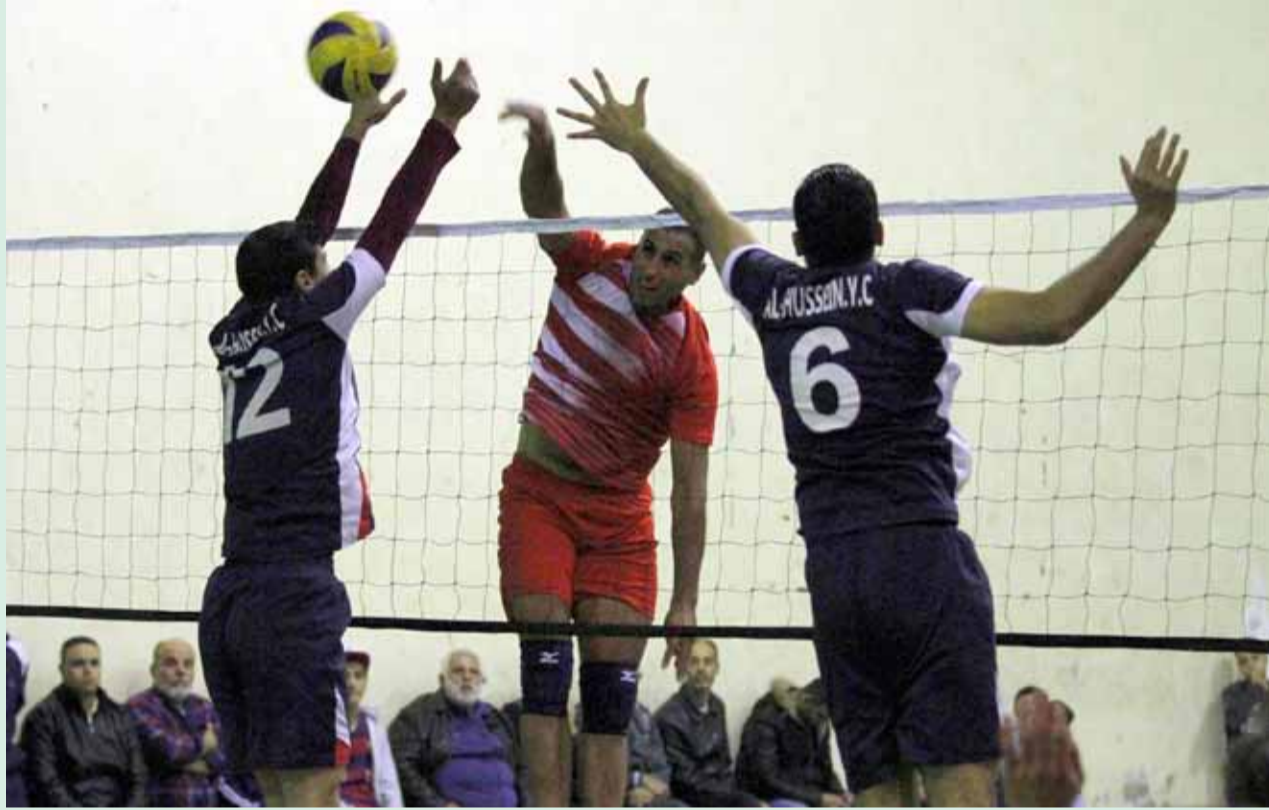
جانب من لقاء الوحدات وشباب الحسين وديا

أبو حميد وبتصريح خص به "الوحدات الرياضي" أكد عدم رضاه التام عن الأداء الذي ظهر عليه اللاعبين، مشيراً إلى عدم أهمية نتيجة اللقاء الودي، إلا أنه اعتبر أن مثل هذه اللقاءات تكشف وعلى أرض الواقع المستوى الهزيل الذي ظهر به عدد من اللاعبين، وهو ما سيعجل بإمكانية الاستغناء عن بعضهم في قادم الأيام في حالة لم يثبتوا حضورهم الفني والبدني، معرجاً على أن هناك أكثر من لاعب من فريق الشباب سيتم ترفيعهم بعيد انتهاء بطولة دوري الشباب وسيكونوا ضمن حساباته الفنية في اللقاءات التي سيخوضها الفريق الأول ببطولة الدوري.