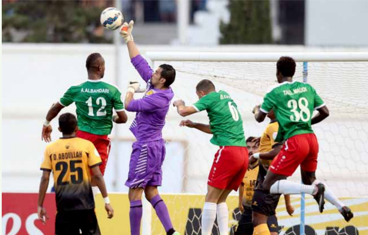
جانب من لقاء الوحدات والقادسية الكويتي