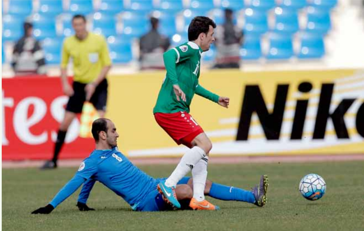
جانب من لقاء الوحدات والحد البحريني