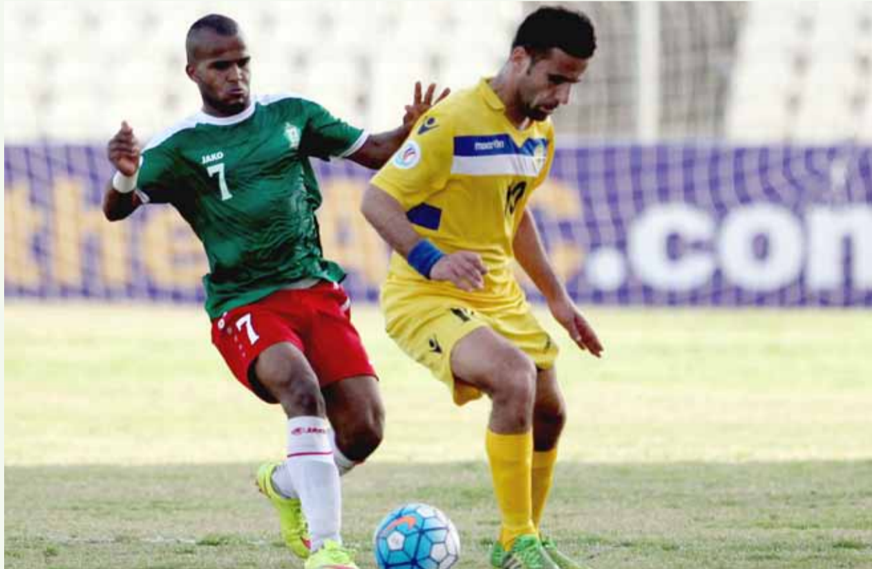
جانب من لقاء الوحدات والتين أسير التركماتي

إلى جانب فرق الكويت الكويتي والكرامة السوري وموهان باغان الهندي حيث حقق الفوز في ثلاث لقاءات وتعادل في لقاء واحد وخسر لقاوتين سجل ١٢ هدف ودخل مرماه ٧ أهداف وحل بالمركز الثالث برصيد ١٠ نقط.