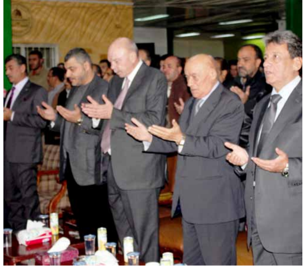
قراءة الفاتحة على أرواح الشهداء