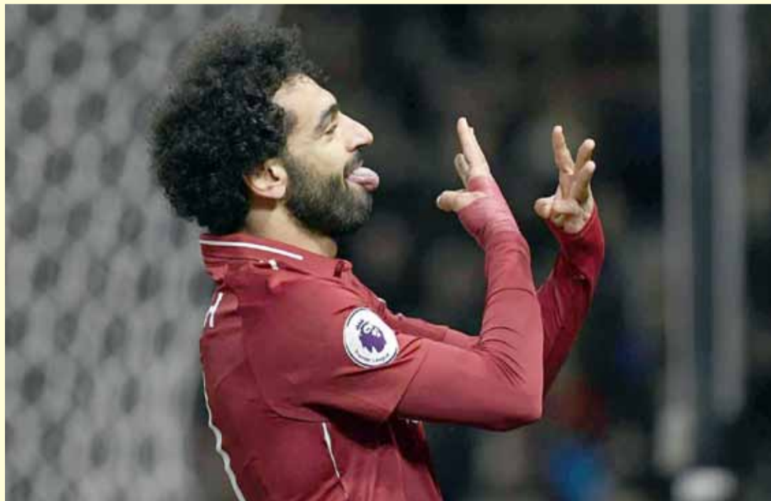
محمد صلاح يحتفل على طريقته الخاصة

عقب المباراة سئل المدرب يورغن كلوب عن احتفال صلاح المثير للجدل، فأدعى أنه لم يشاهده.