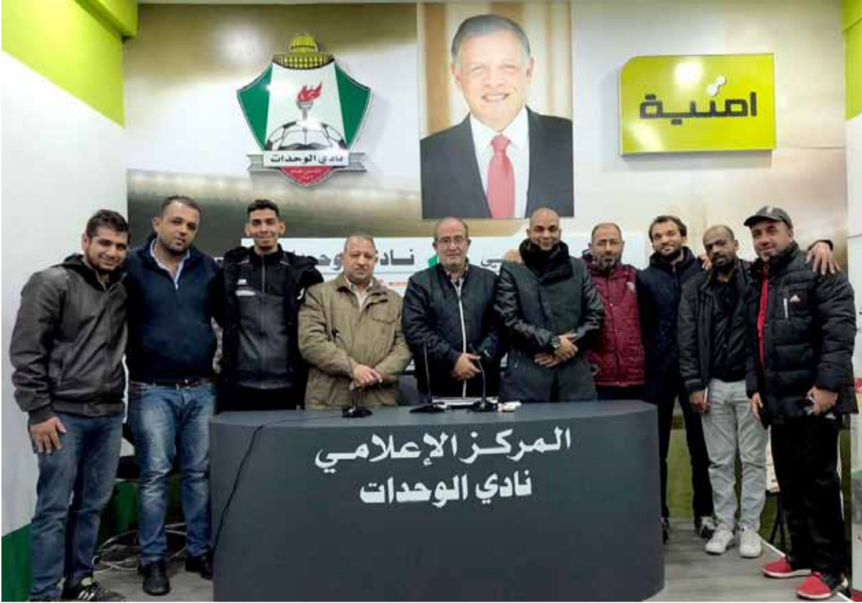
لقطة جامعة لاسرة لاسرة المركز الإعلامي في نادي الوحدات