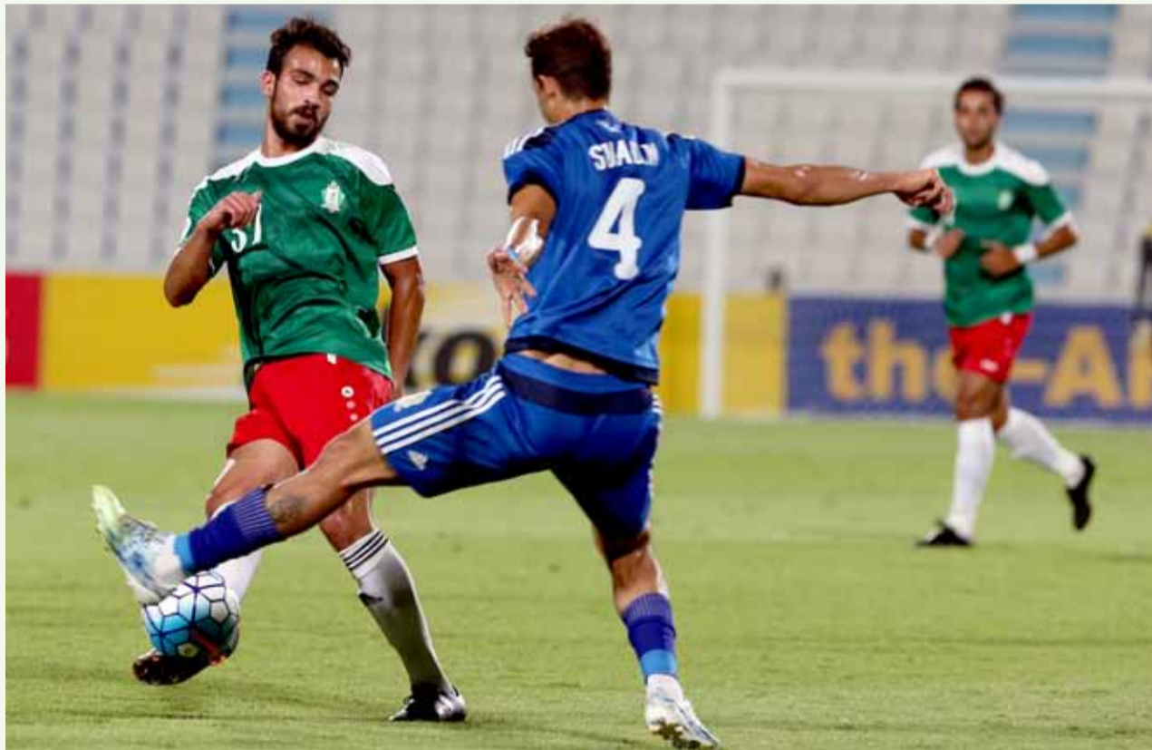
جانب من لقاء الوحدات والقوة الجوية العراقي

الآسيوية وتحديداً في كأس الاتحاد الآسيوي سبع مرات كان أولها في عام ٢٠٠٦ وأخرها في عام ٢٠١٧