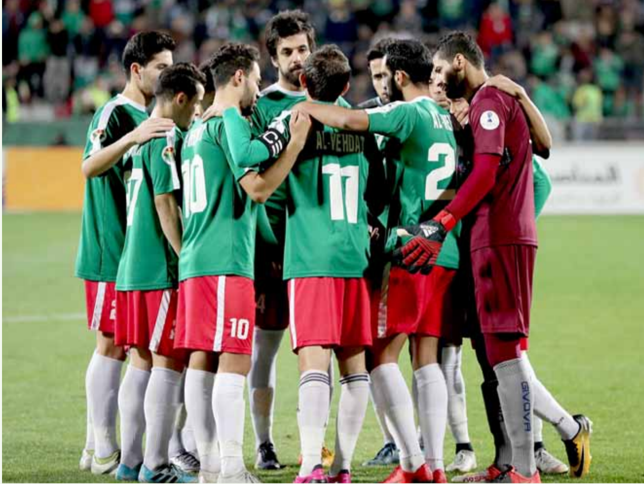
"المارد الأخضر" عينه على الإنتصارات بالمباريات المقبلة

وأشياء كثيرة وجدتها سيلفي في الإتصال الهاتفي، ومنها يأتي رسم صورة ذهنية عن جاهزية اللاعبين، طيبا وبدنيا وفنيا لفهم أفكاره التكتيكية التي يجتهد وجهازه المعاون، في زرعها باللاعبين المتواجدين بالتدريبات الحالية، بما يسهل من الإندماج مباشرة بأفكاره التكتيكية التحضيرية لمواجهة ذات راس، والتي تأتي بعد فترة بسيطة من التحاق لاعبيه القادمين من صفوف المنتخب الوطنية، بتدريبات الفريق الذي ينظر الى الانتصارات في قادم الجولات.