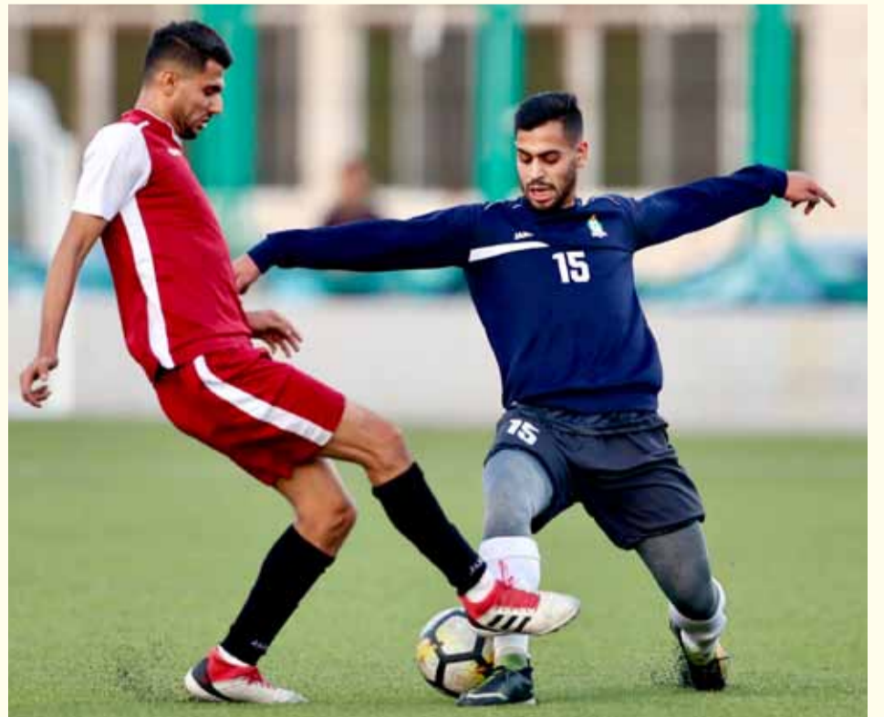
جانبا من اللقاء الودي