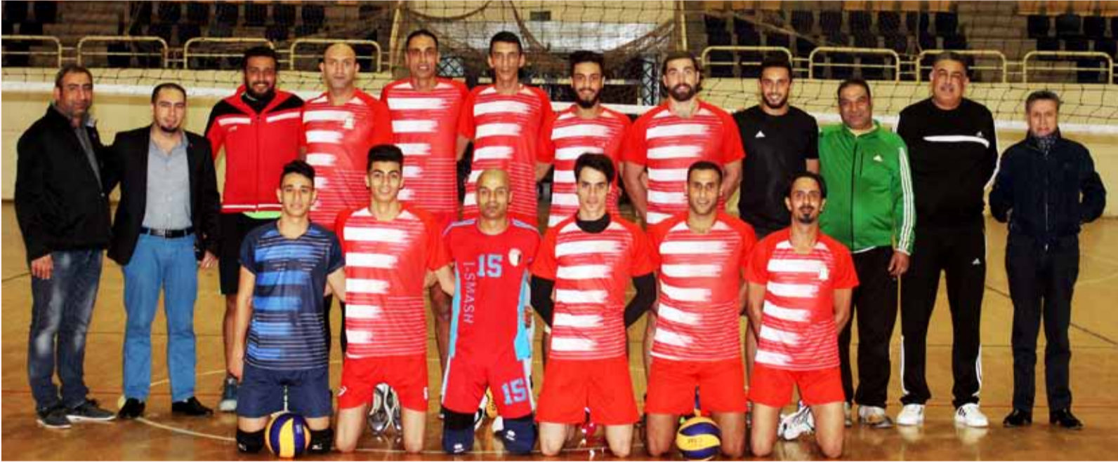
فريق الوحدات بالكرة الطائرة 2018