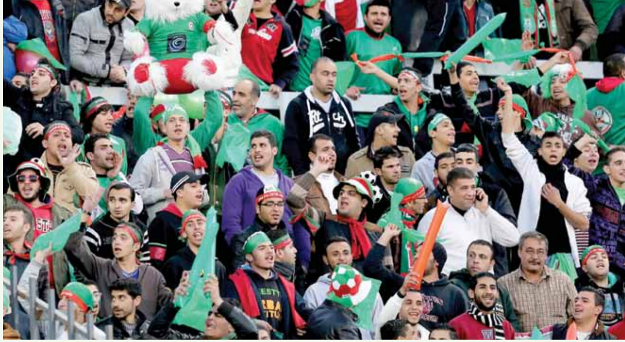
جماهير الوحدات تشكل الوقود الحقيقي لانجازات وانتصارات المارد الأخضر

أخيرا أتمنى من جماهير الوحدات أن تحضر بكثافة في المواجهتين المقبلتين أمام ذات راس يوم السبت ٢٤ الحالي والرمثا ١ من الشهر المقبل والحصول على النقاط كاملة، ومن المؤكد أن هناك مرحلة تقييم شاملة من قبل الجهاز الفني وعلى أثرها سيخرج عدد من اللاعبين ويلتحق بالفريق عدد آخر قادر أن يعيد الوحدات إلى وضعه الطبيعي بالسرعة الممكنة