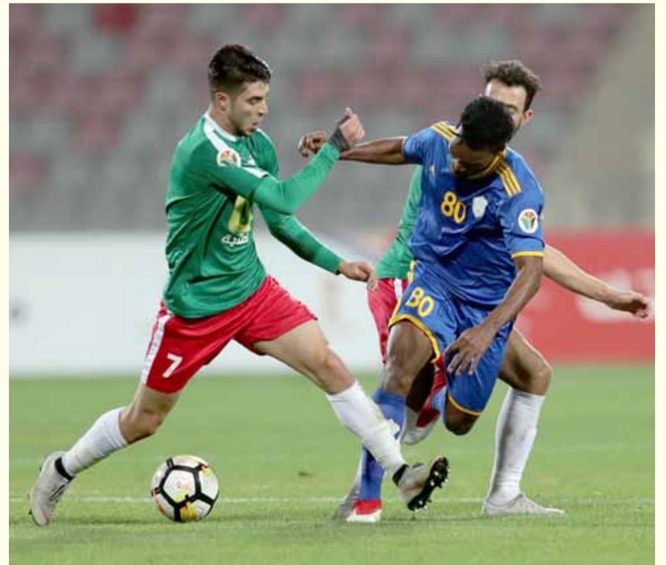
عبدة السمارنة يعود بقوة إلى مشاركة زملائه أمام العقبة