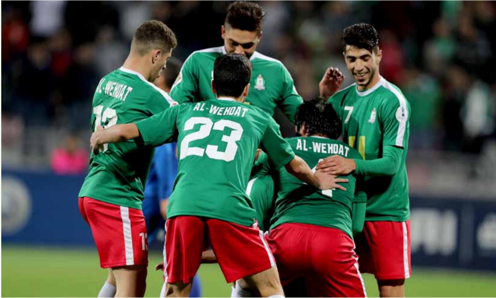
فرحة لاعبي الوحدات بعد تسجيل الهدف الأول في مرمى العقبة

الإنتصار لمواهب الشباب، وهو ما آمن فيه اليعقوبي منذ قدومه الى الوحدات، ومن خلال عمليات تنقيبه عن المواهب في فرق الفئات العمرية، ووجد أن الوحدات يمتلك منجماً من الخامات، سواء ممن وجدها ضمن صفوف الفريق من المواهب الشاببة، أو تلك التي استدعاها