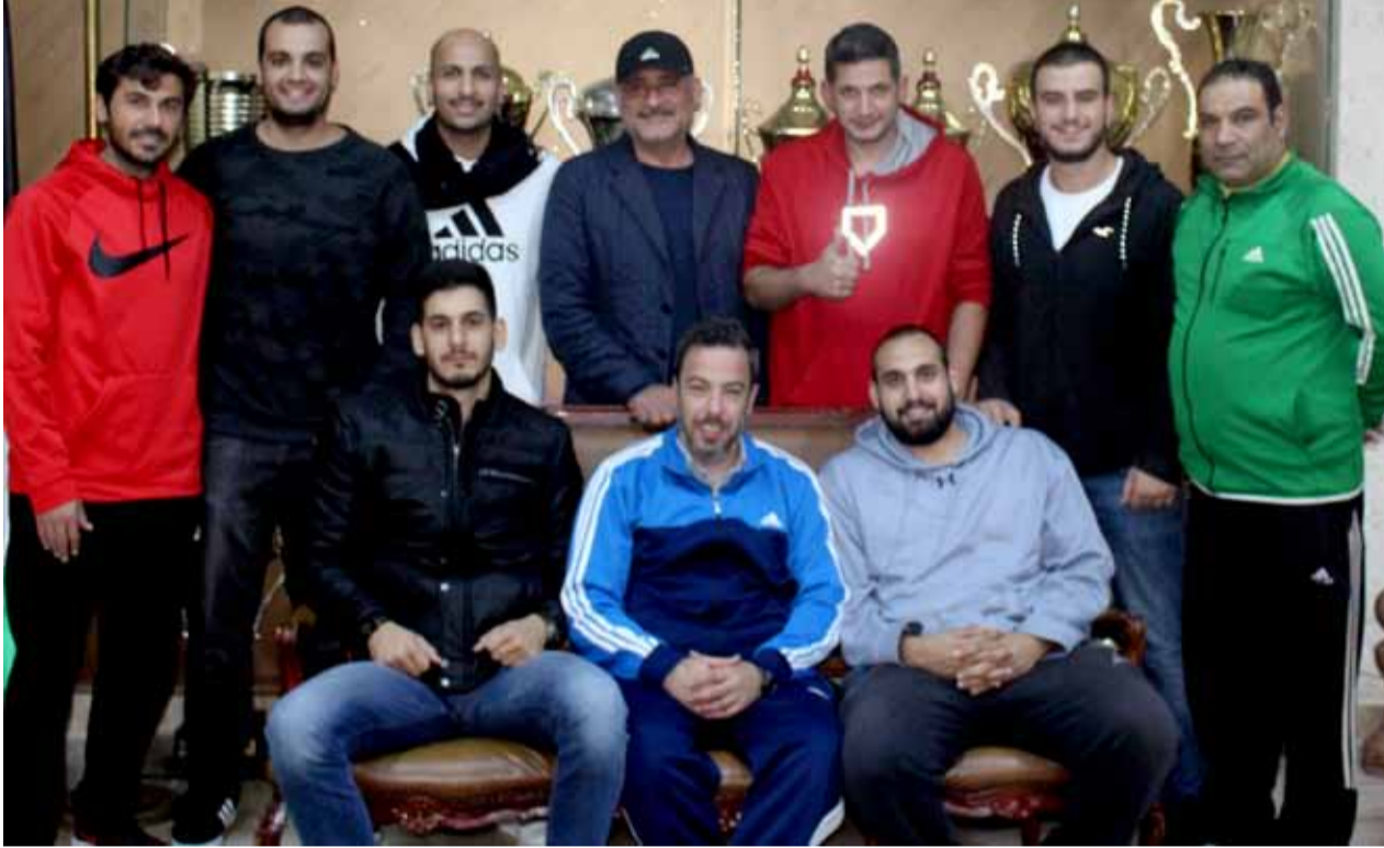
لقطة جامعة للجهازين الفني والاداري وفريق سلة الوحدات

الفني الأمريكي أريك خطط الأندية واللاعبين كافة.