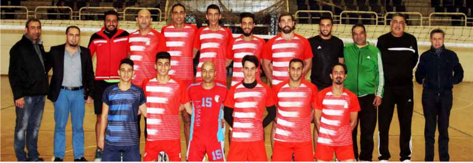
لقطة جامعة للجهازين الفني والاداري وفريق الكرة الطائرة لنادي الوحدات