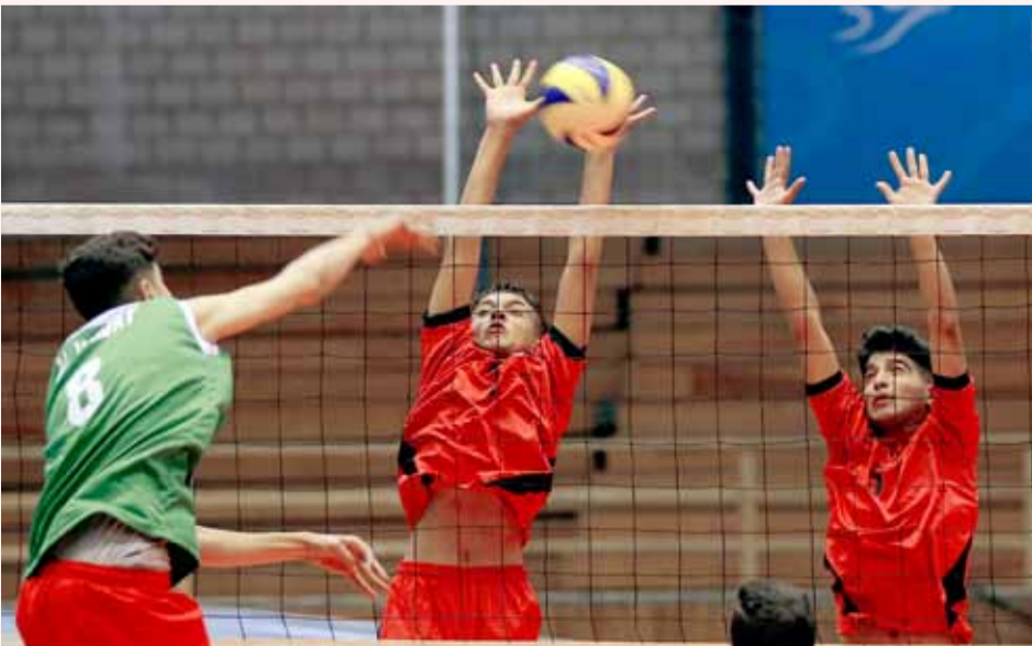
جانب من لقاء الوحدات والكرمل في دوري الشباب لكرة الطائرة