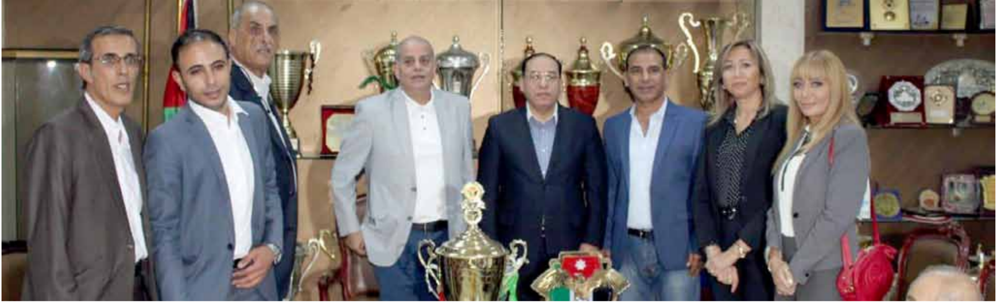
لقطة جماعية قبل بداية الندوة