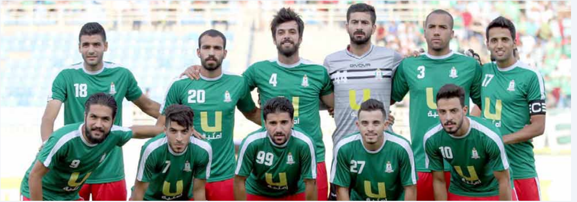
فريق الوحدات لكرة القدم