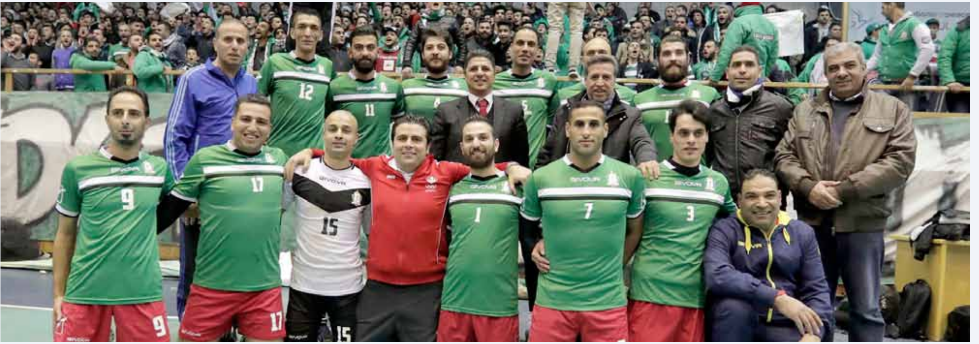
فريق الوحدات الأول لكرة الطائرة