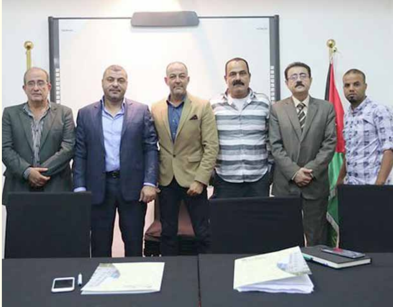
لقطة جامعة لرئيس و أعضاء مجلس ادارة نادي الوحدات والجهاز الفني الجديد بعد توقيع العقد