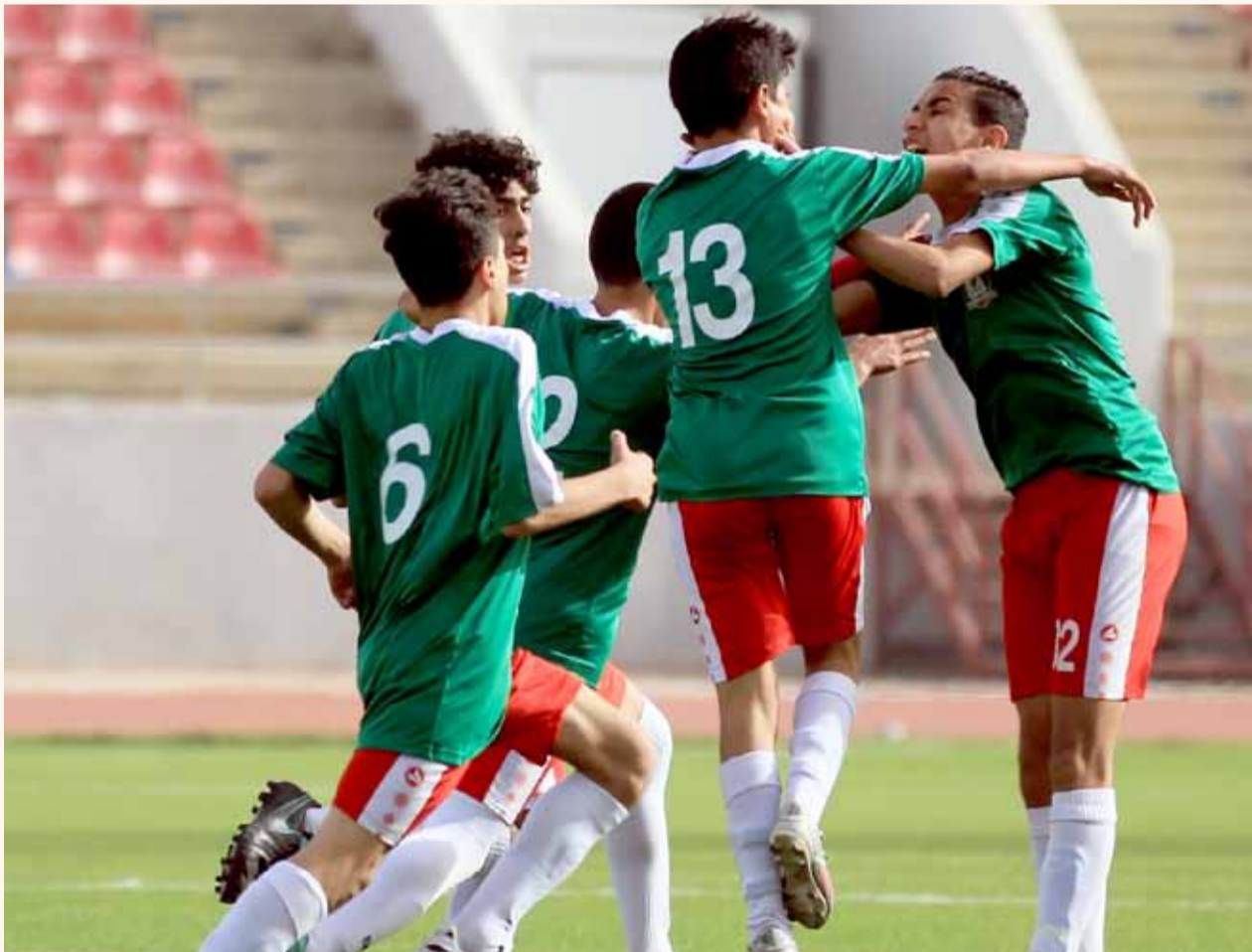
فرحة لاعبي الناشئ الأخضر بتسجيلهم هدفا بمرمى الفيصلي في مباراة سابقة