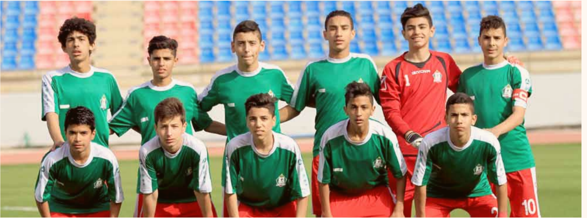
فريق الوحدات سن 15