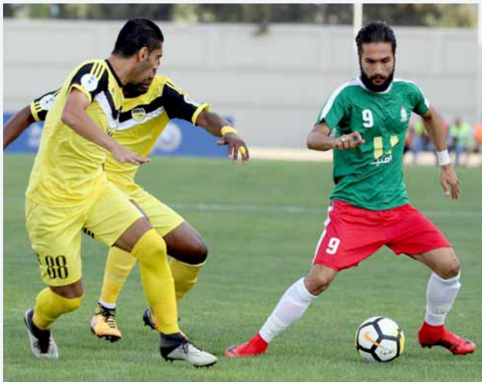
ورد سلامة علامة فارقة في منطقة العمليات الخضراء

ومما لا شك فيه أن تجاوز محطة "الغزاة" على أرضهم وبين جماهيرهم، شكلت حالة من الفرح والسعادة ليس لطبيعة المنافس، ولكن للظروف الصعبة التي واجهت الجهاز الفني والإداري واللاعبين قبل بدء هذه المباراة لأن التعثر فيها يعني دون أدنى شك ولادة حالة من الاحباط لكل وحداتي عاشق للنادي وفريق كرة القدم على وجه التحديد.