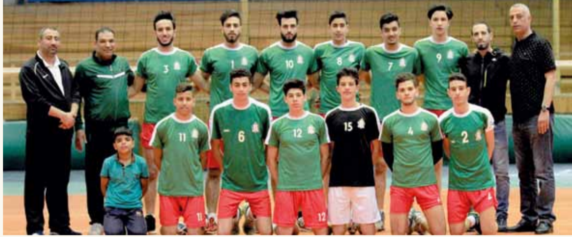
فريق الوحدات الشاب يطمح باللقب