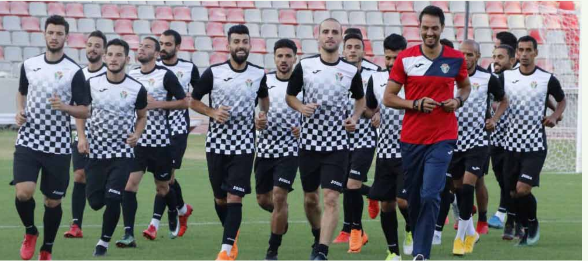
تدريبات المنتخب الوطني لكرة القدم استعداداً للقاء لبنان وعمان ودياً