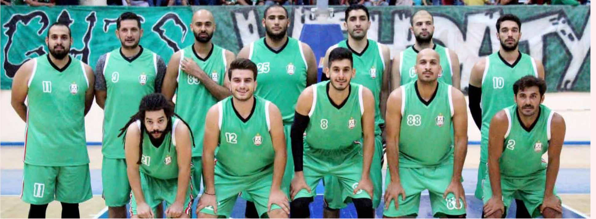
فريق الوحدات لكرة السلة.. بطل مرحلة ذهاب الدوري، فهل يكرر الإنجاز في الإياب؟