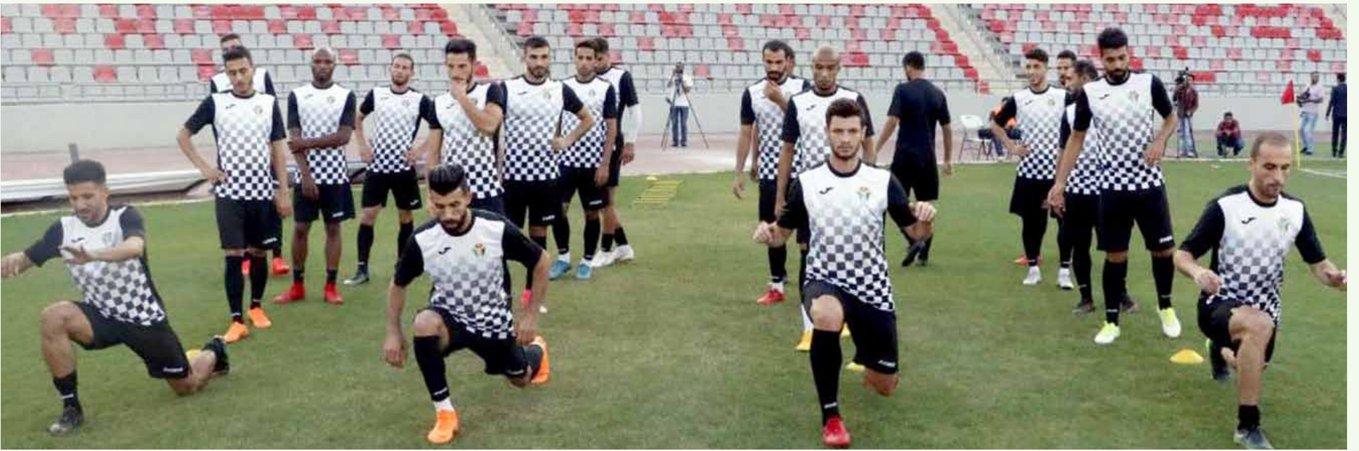
جانب من تدريبات المنتخب الوطني لملاقاة عمان