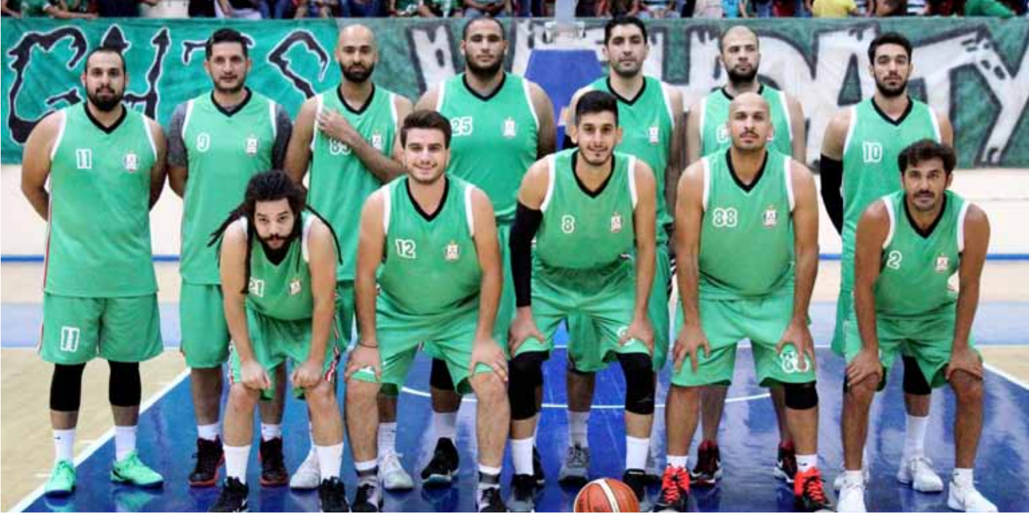
فريق الوحدات لكرة السلة