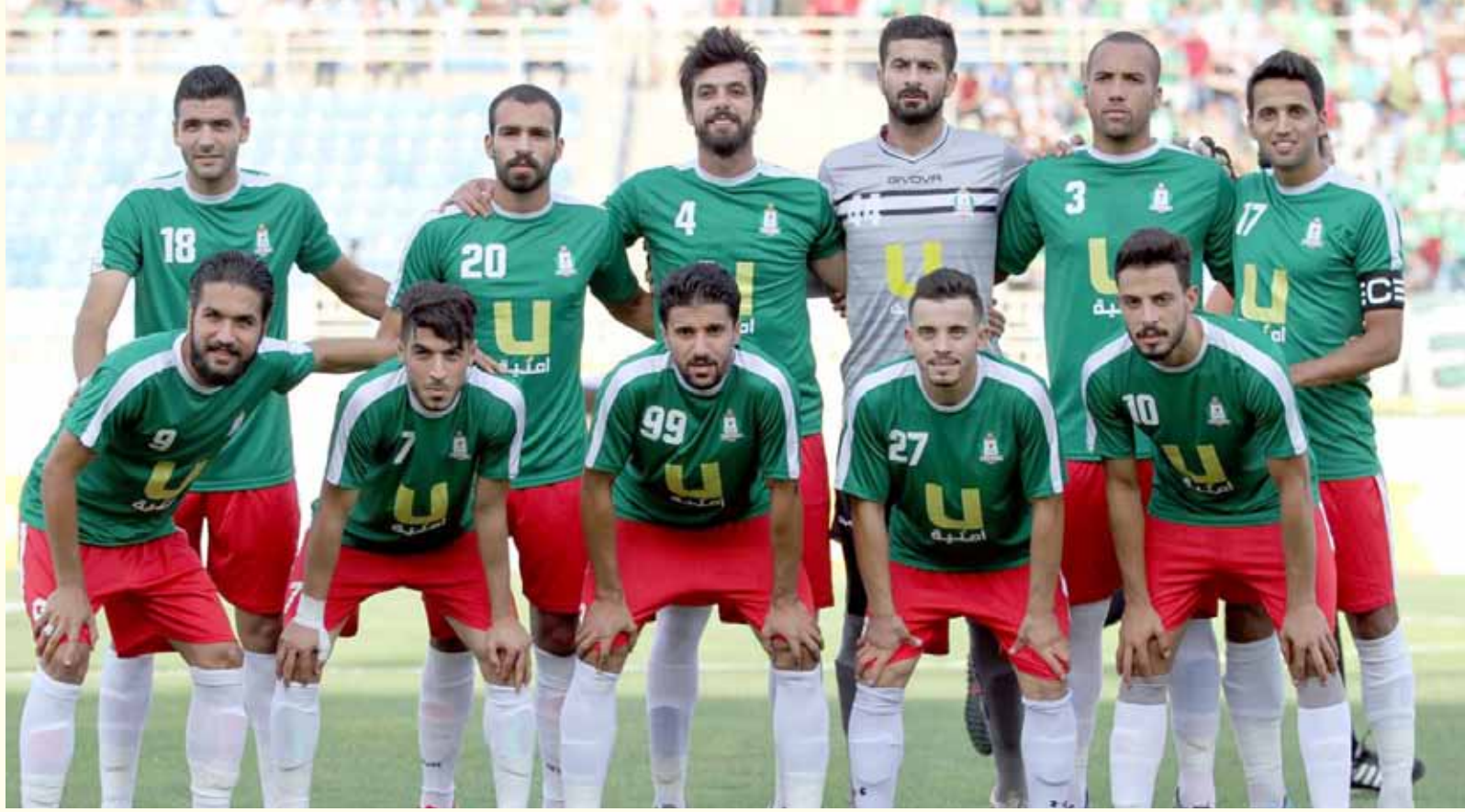
فريق الوحدات لكرة القدم