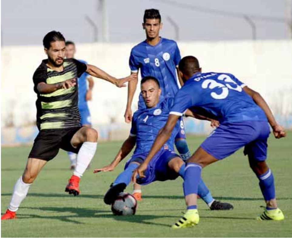
مدافعو الرمثا يخطفون الكرة من امام السوري ورد السلامة