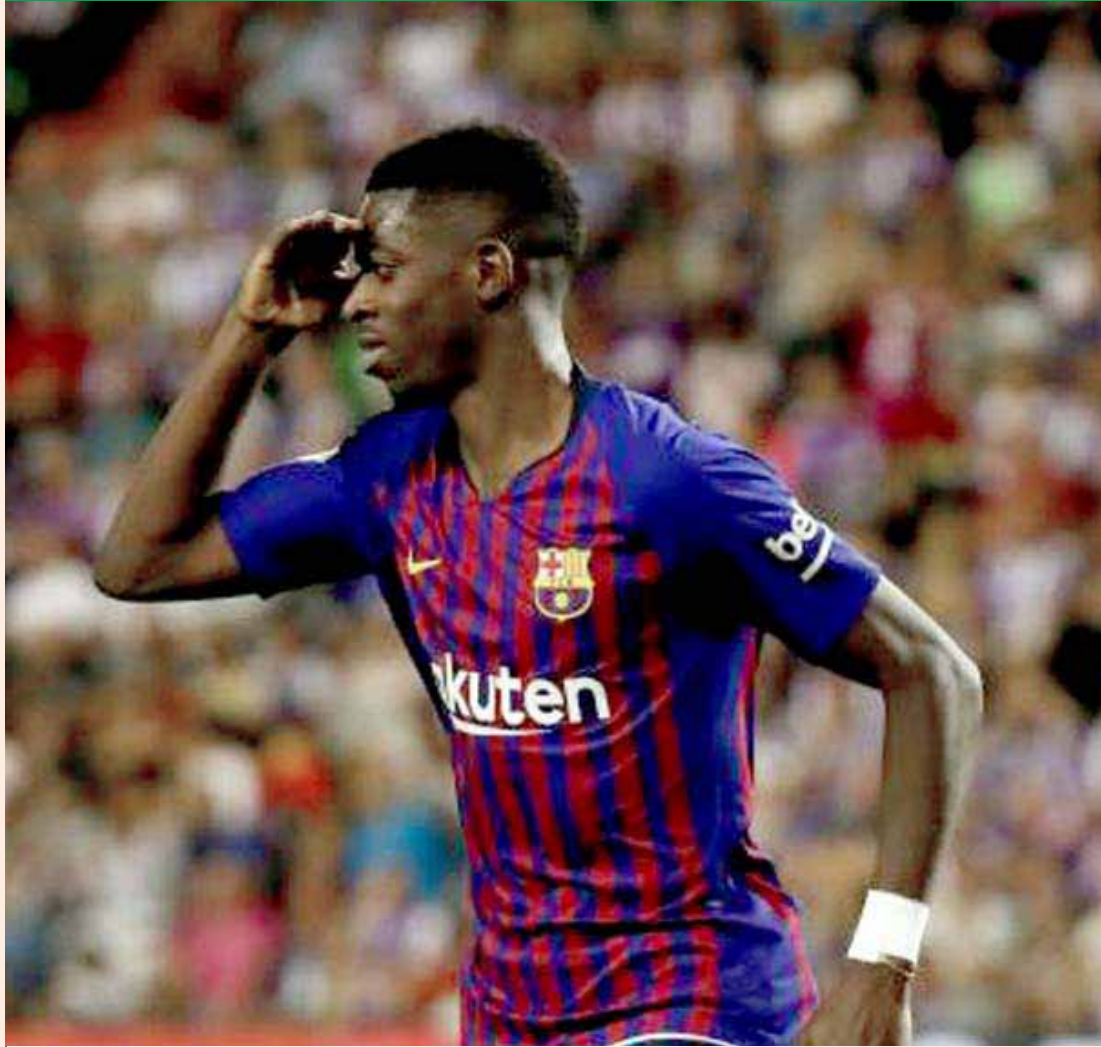
في أقل من أسبوعين منح الفرنسي عثمان ديمبلي، نجم برشلونة، هديتين ثمينتين لجمهور الفريق الكتالوني، الأولى بمساهمته في تحقيق لقب السوبر الإسباني في مباراة صعبة أمام إشبيلية، بعد أن أحرز هدف الفوز، ثم تسجيله لهدف فريقه الوحيد في مباراة بلد الوليد، السبت، بالليغا

إلى ذلك كانت جماهير الوحدات تضرب أروع أمثلة الوفاء والانتماء لفريقها من خلال التشجيع المثالي والحضور الرائع على ملعب السلط، وهو ما يفسر عشق هذه الجماهير لناديهما وماردها الأخضر.