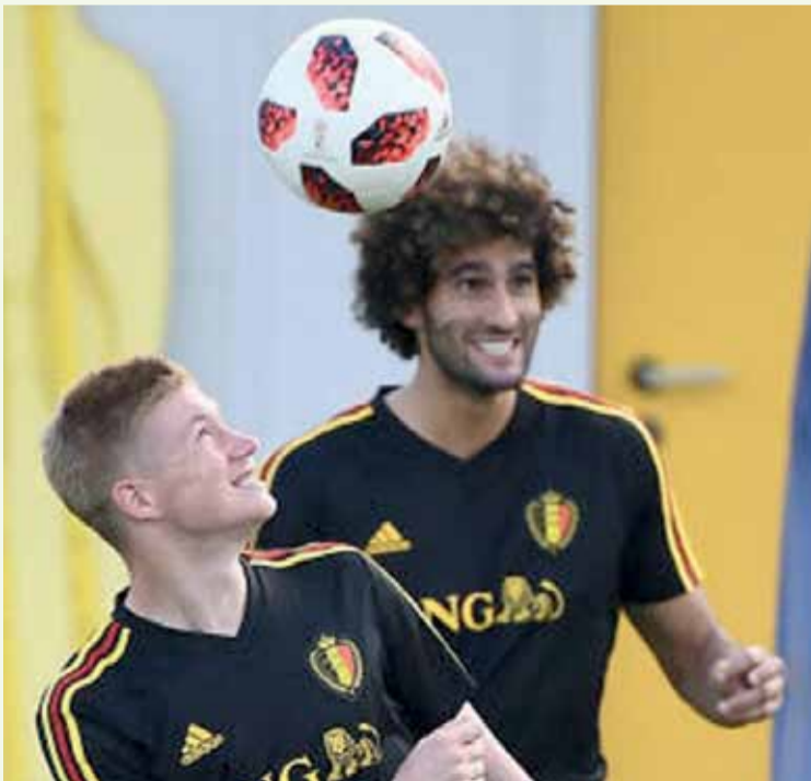
بلجيكا 2 البرازيل 1

رغم انها المشاركة الثانية للمنتخب الكرواتي في بطولات كأس العالم، بيد انه بلغ آمالا كبيرة، عندما تمكنت من التغلب على المنتخب المضيف (روسيا) بفارق ركلات الترجيح 4-3 بعد ان انتهى الوقت الاصلي بالتعادل 1-1 والوقت الاضائي بالتعادل 2-2، إلا ان خبرة راكيدنتش حسنت الامور في الركلة الحاسمة للكروات، بعد ان فشل لاعب كرواتيا ماتيو كوفاسيتش،