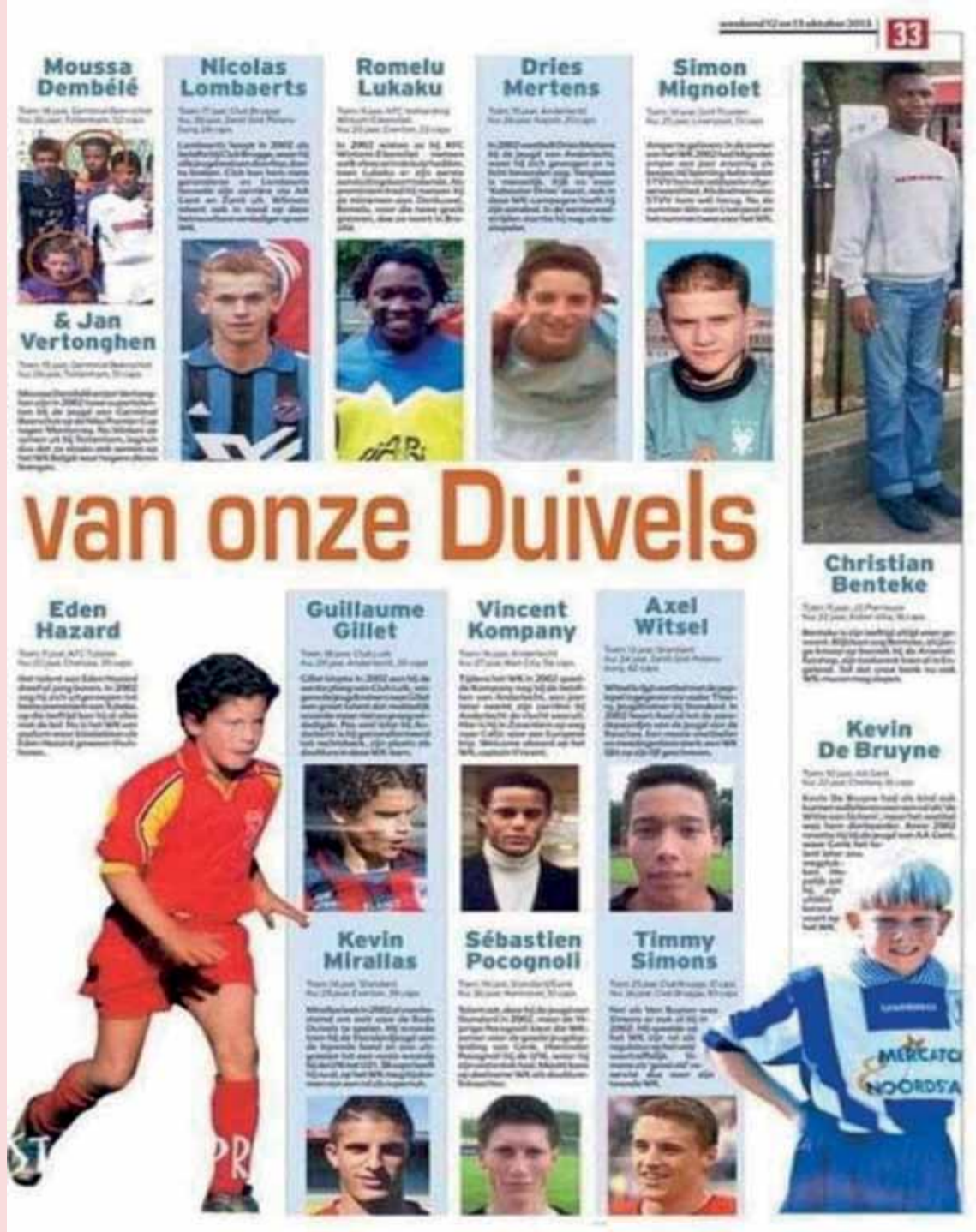
صغار بلجيكا يصنعون المجد لبلادهم في مونديال روسيا حاليا