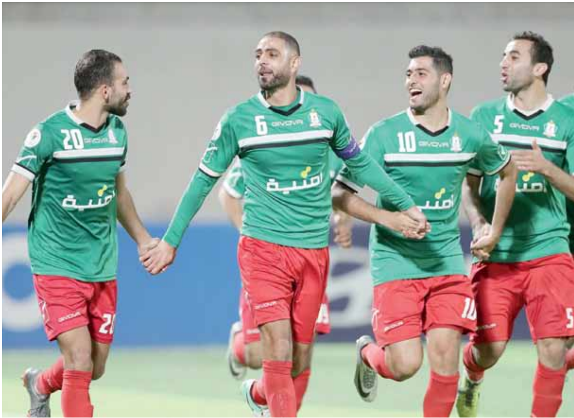
فرحة وحدانية نريدها ان تتكرر الجمعة