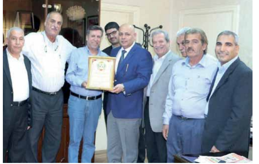
اللجنة الإجتماعية خلال الزيارة لثقافة المقاولين