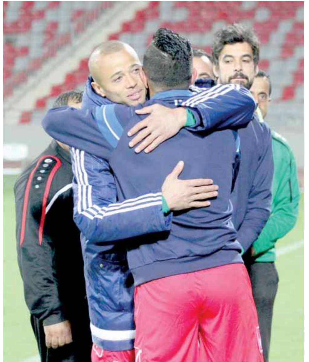
المحارمة يودع زملاءه من ارض الملعب