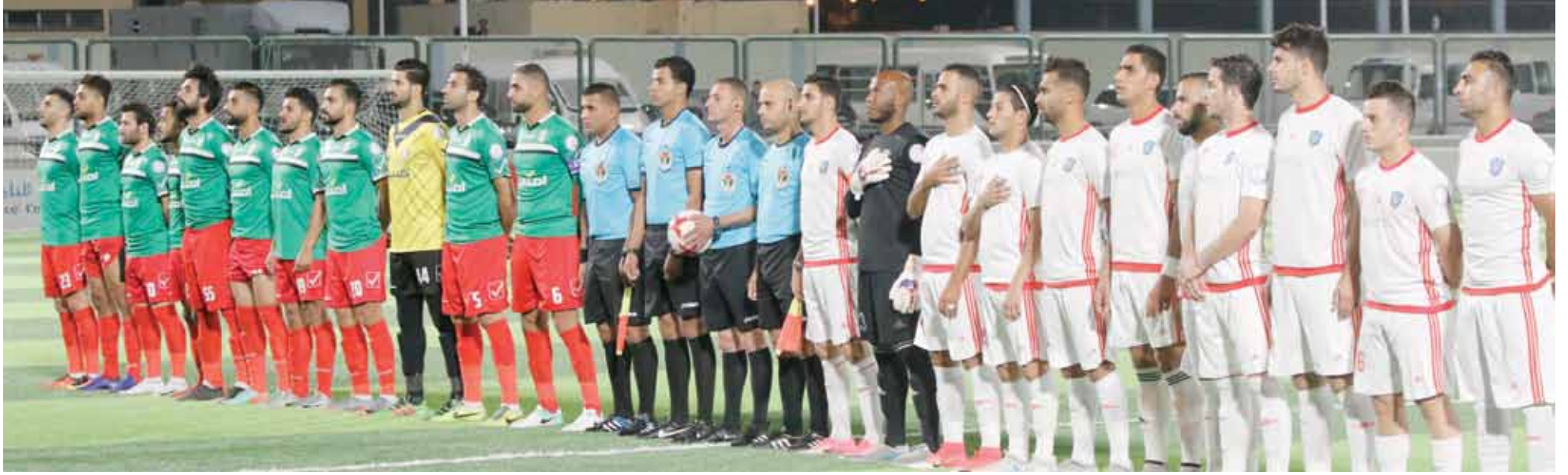
الوحدات خطوة نحو اللقب