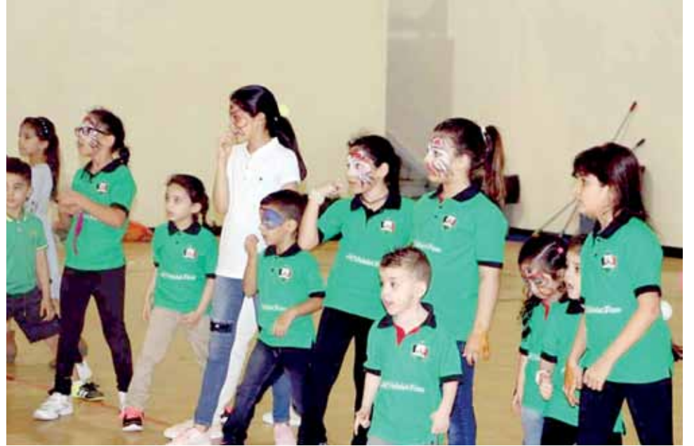
جانبا من الكرنفال التي اقامته الرابطة