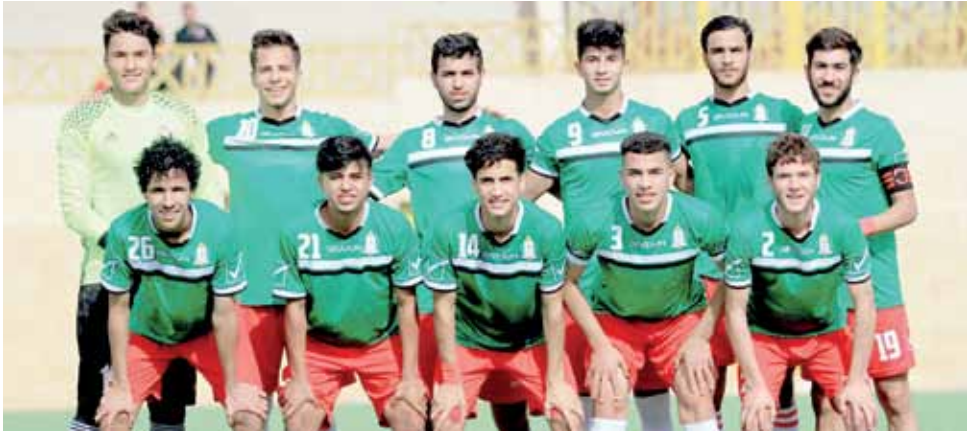
فريق سن 19 يخسر البطولة في توقيت حساس