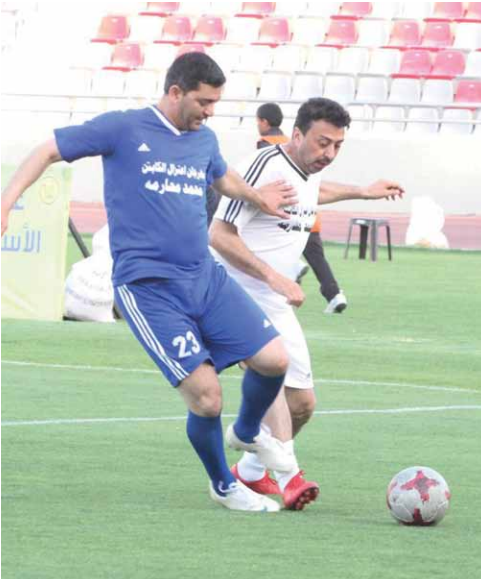
جانب من لقاء قدامى الكرة الأردنية وسحاب