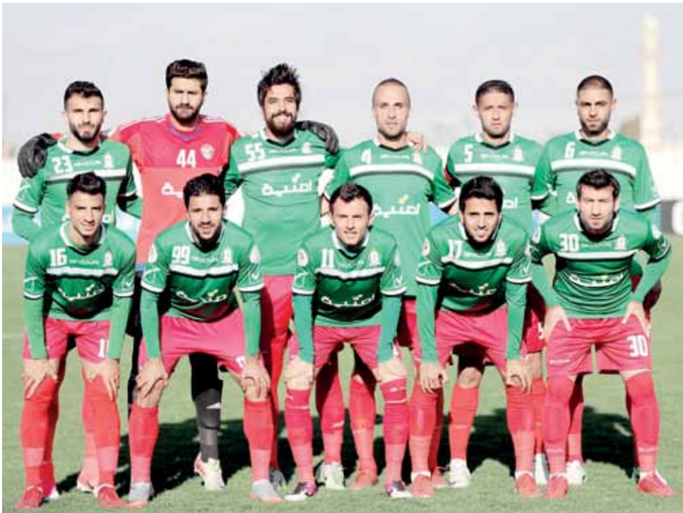
فريق الوحدات لكرة القدم

بعيدا عن المشاكل التي يعيشها نادي الوحدات وهنا أقصد الجانب المادي، لا بد أن تكون هناك طريقة مناسبة للخروج من المأزق، والتفرغ للموسم الجديد الذي سيكون أصعب من الموسم الحالي بدرجات، عبر إنجاز تعاقدات مهمة وحيوية تضمن لـ "الأخضر" المنافسة بقوة على الألقاب المحلية، وتحقيق حلم جماهيره بالحصول على لقب كأس الاتحاد الآسيوي وهو قادر على ذلك بمشيئة الله.