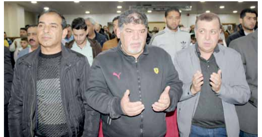
جانبا من الحضور في افتتاح أكاديمية الوحدات في غرفة تجارة الزرقاء