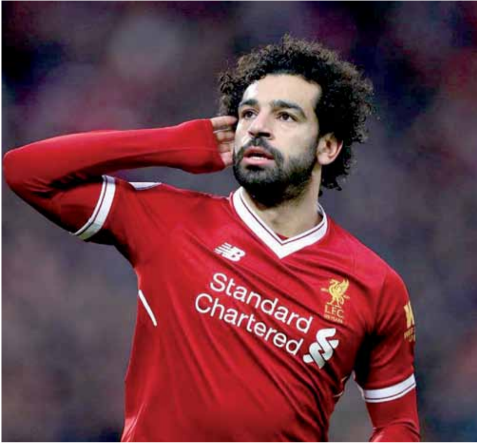
لاعب ليفربول محمد صلاح