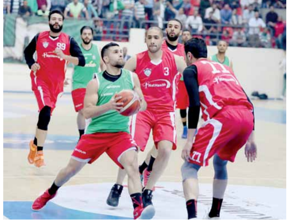
محاولات نجوم الوجدات لكرة السلة لم تجد نفعا في ظل الخبرات الكبيرة لنادي الأرثوذكسي