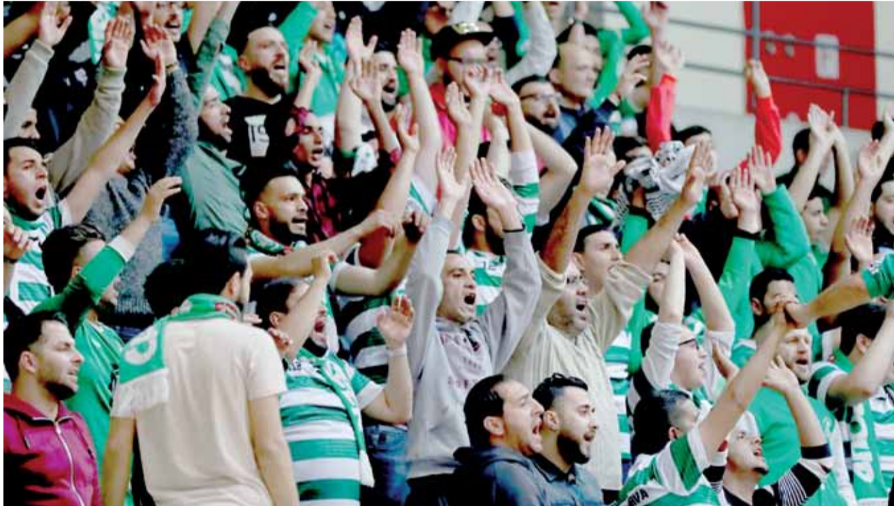
كالعادة جماهير الوجدات تقف خلف فرقها في كل النشاطات