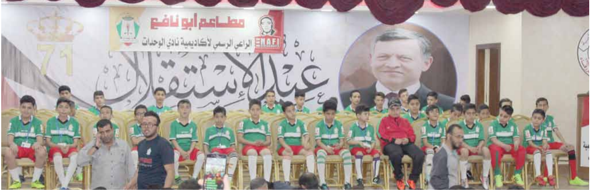
نجوم واعدة تنتظر اكتساب الخبرات في أكاديمية الوحدات