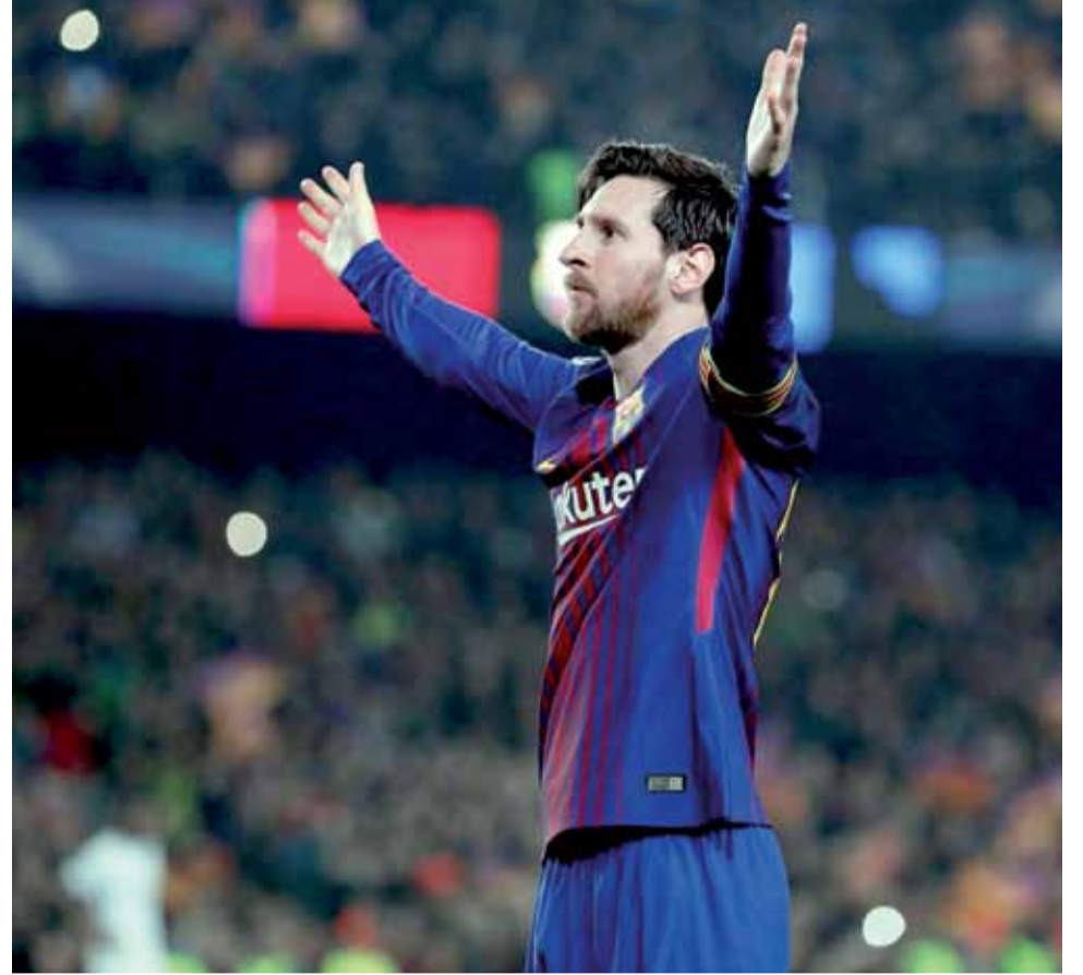
لاعب برشلونة ليونيل ميسي