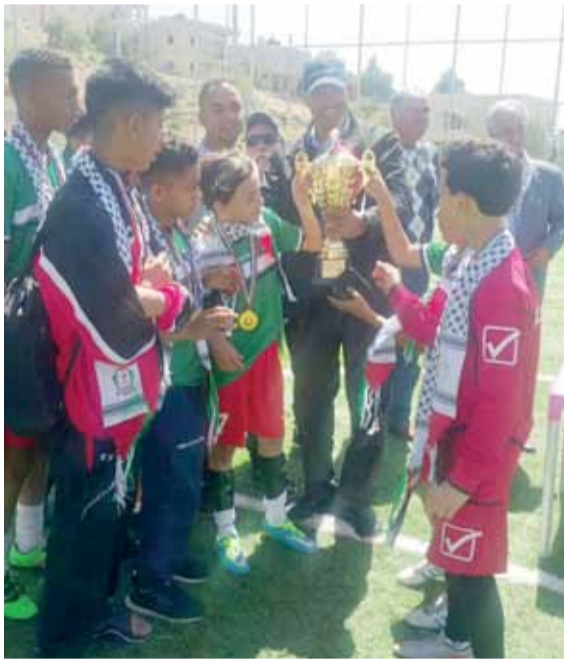
جانب من تتويج فريق الوحدات مواليد 2004 في السموع

وشاءت الأقدار أن يعيش الموقف الاعلامي فعاليات احياء ذكرى الأرض بتفاصيل فلسطينية، ومتابعتها في مختلف اراضي فلسطين، وما تبعها من مواجهات مباشرة مع جيش الاحتلال، وسقوط الشهداء دفاعاً عن الثرى الفلسطيني الطاهر، لاسيما في قطاع غزة بعد مواجهات دامية مع الصهاينة، وإعلان يوم اضراب شامل في باقي مناطق فلسطين وعديد الفعاليات إحياء للذكرى يوم الأرض ولسان حال الفلسطينيين في مواجهاتهم يقول: "اعلنها يا شعبي... دولة فلسطين اعلنها... وبملكك زينها".