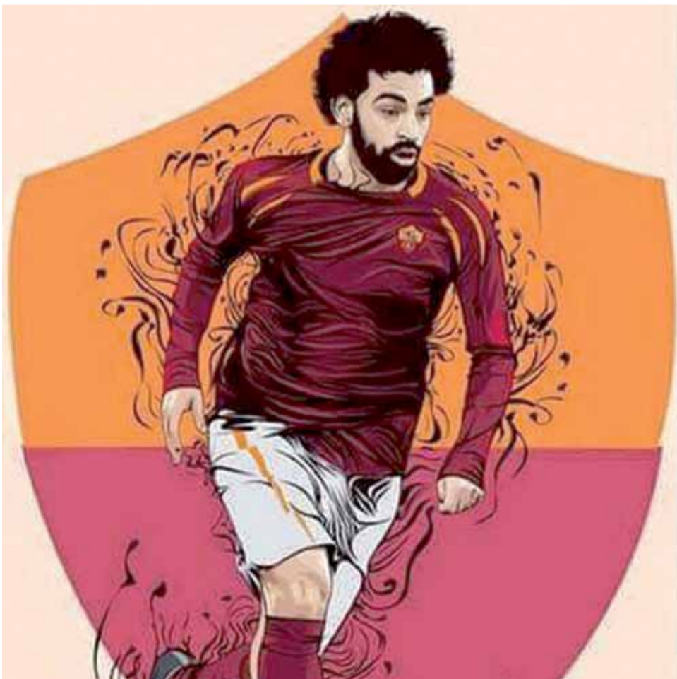
لاعب ليفربول محمد صلاح

روتردام الهولندي ٥-٠ و١-٠، وعلى سختر دونيتسيك ٢-٠، وعلى نابولي ٢-١ و٤-٢، وخسر امام سختر ١-٢. وفي الدور الثاني تغلب على بازل السويسري ٤-٠ وخسر اياها ١-٢، مسجلا ١٩ هدفا و٧ كرات في مرماه، ويعتبر هدافه رحيم ستريليج افضل مسجل برصيد ٤ اهداف الى جانب سيرجيو اغويرو بذات الرصيد.