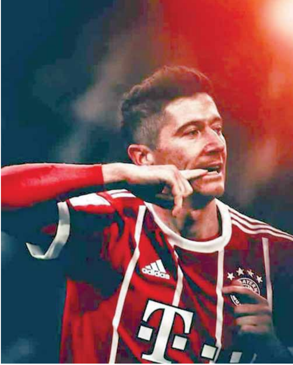
لاعب بايرن ميونخ ليفاندوفسكي