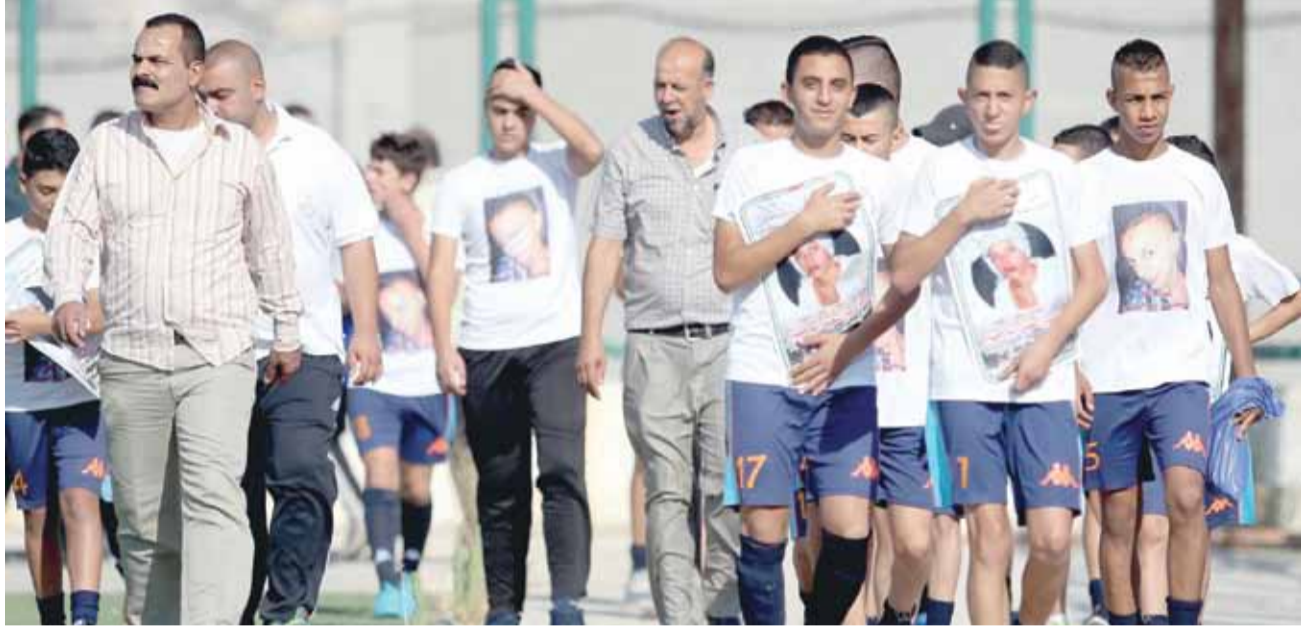
جانب من استضافة نادي الوحدات لبطولة الشهيد محمد أبو خضير في عمان

وتابع: " نحل أهلا على الأشقاء في فلسطين عامة والاكاديمية الفلسطينية للموهوبين كرويا خاصة، وحرصنا على استقبالهم وتبادل الزيارات، وتصدي نادي الوحدات لتنظيم بطولة الشهيد محمد أبو خضير -أحد لاعبي الأكاديمية الفلسطينية- في عمان، والإحتفاء بعرض الشهيد بمشاركة عديد الجهات والأندية المحلية على الطريقة الأردنية بما يخدم الرياضة الفلسطينية لإسقاط كل ممارسات الاحتلال ضد الرياضة والرياضيين والأهل في فلسطين".