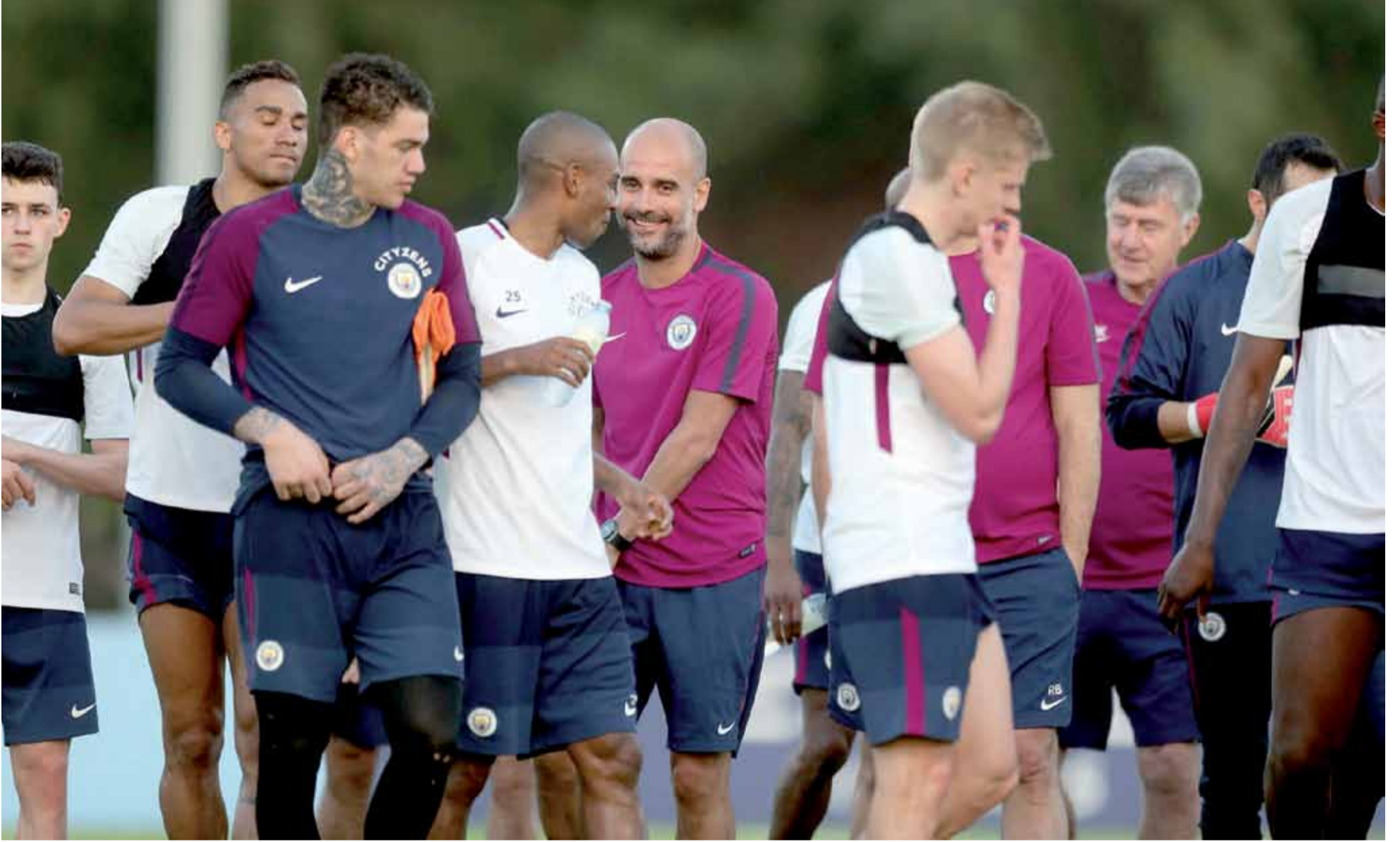
جوارديولا مع فريق المان ستي خلال وجبة تدريبية