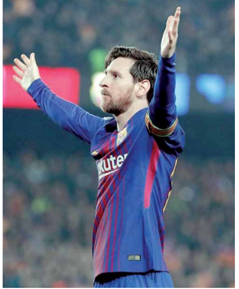
نجم برشلونة ليونيل ميسي