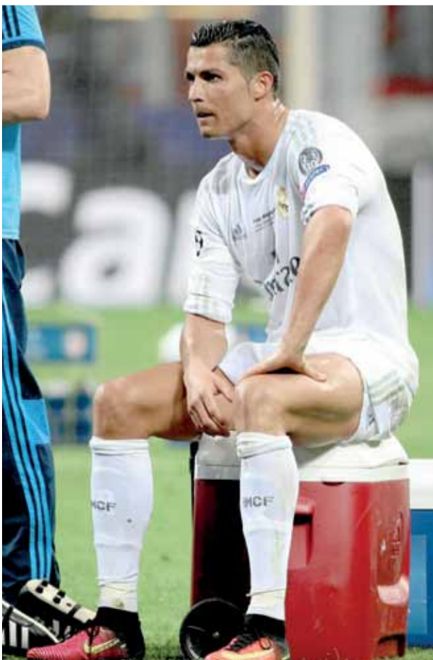
لاعب ريال مدريد كريستيانو رونالدو

باريس سان جيرمان ٣-١ وخسر في الذهاب ٠-٣، وفي الدور الثاني سحق بشكتاش التركي ذهاباً في انقره ٥-٠، وفي الاياب ٣-١، وسجل الفريق ٢١ هدفاً ودخل مرماه ٧ اهداف، ويعتبر لاعبه روبرت ليفاندوفسكي هداف الفريق برصيد ٥ اهداف