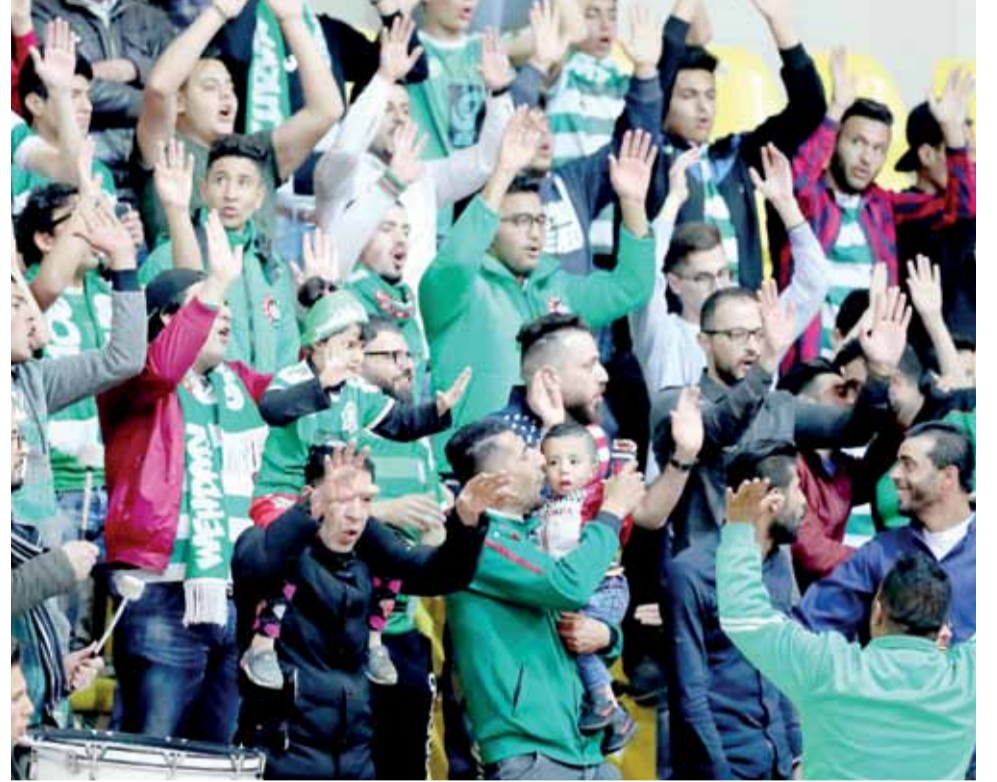
في كل زمان ومكان جمهور الوحدات يحكي قصة "عاشق ومعشوق"