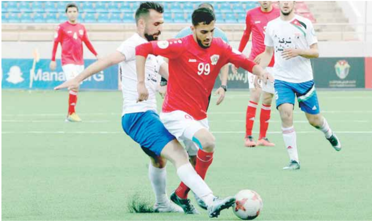
جانب من لقاء الجزيرة والمنشية

تنطلق في الرابعة من مساء يوم بعد غد الخميس مباريات الاسبوع التاسع عشر، حيث يلتقي ذات راس مع اليرموك، على ستاد الكرك، وفي السادسة والنصف يلتقي الاهلي مع شباب الأردن على ستاد الأمير محمد وفي الرابعة من مساء يوم الجمعة، يلتقي المنشية مع الوحدات على ستاد المفرق، وفي السادسة والنصف يلتقي الرمثا مع الحسين على ستاد الحسن، وفي السادسة والنصف من مساء يوم السبت، يلتقي العقبة مع الجزيرة على ستاد تطوير العقبة، والبقعة مع الفيصلي على ستاد عمان الدولي.