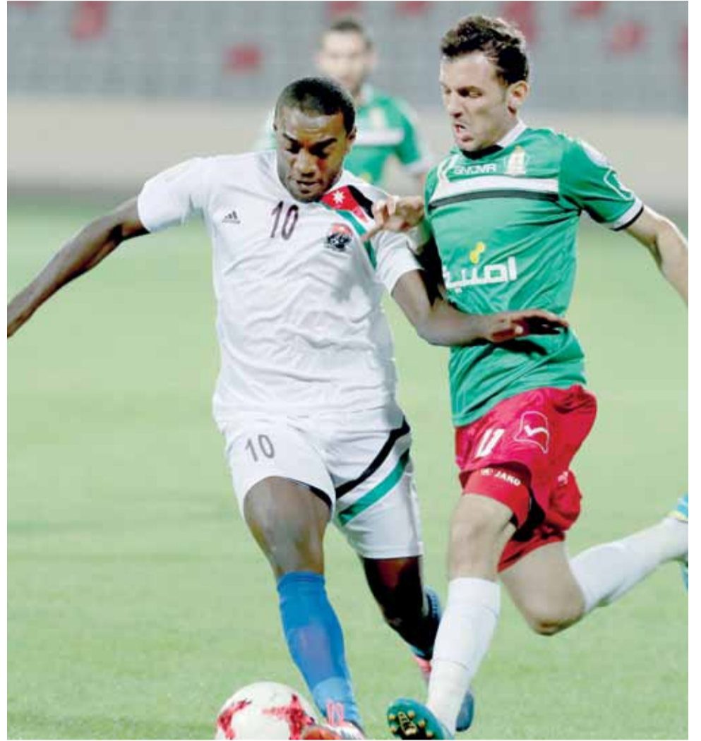
جانب من لقاء الذهاب بين الوحدات والمنشية