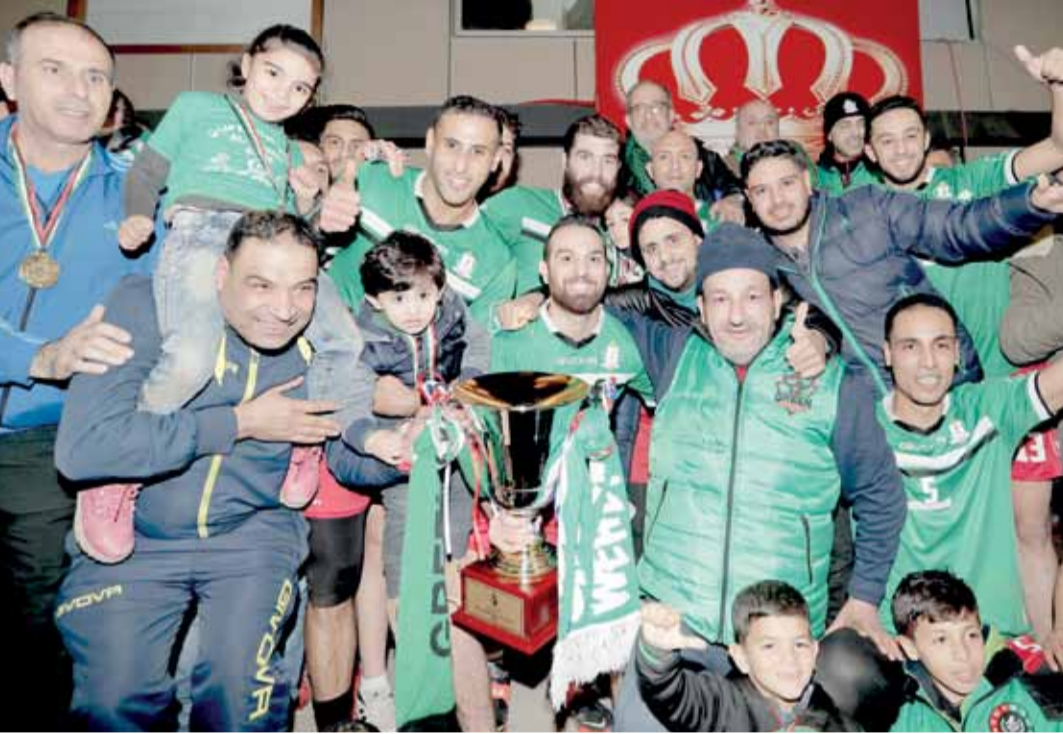
فريق الكرة الطائرة يعود إلى التدريبات