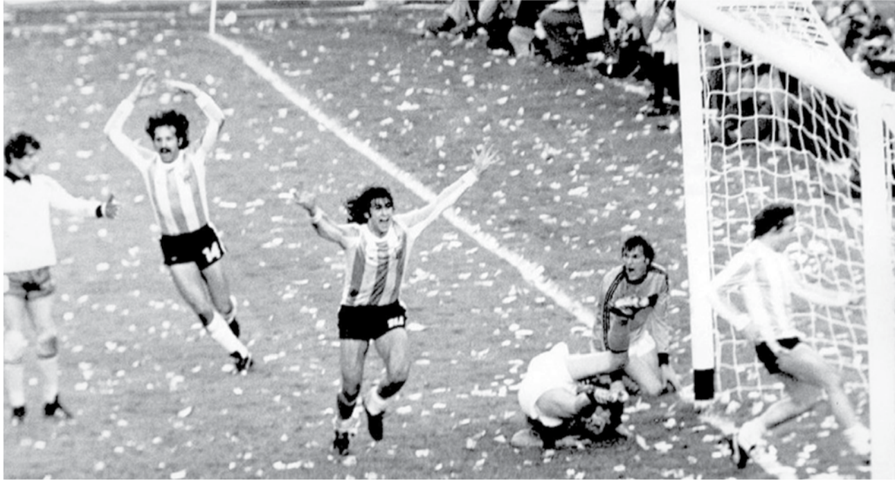
ماريو كمبيس الفتى الذهبي لراقصو التانغو بعد الفوز على هولندا

الأرجنتين في المجموعة الثالثة إلى جانب منتخبات بلجيكا والمجر والسلفادور، اللقاء الأول خسرت الأرجنتين بهدف نظيف حمل توقيع ايروين فاندنميرغث د.٦٢، وفي