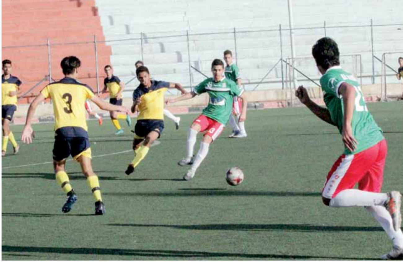
الأخضر الشاب خسر أمام الحسين إربد بهدف