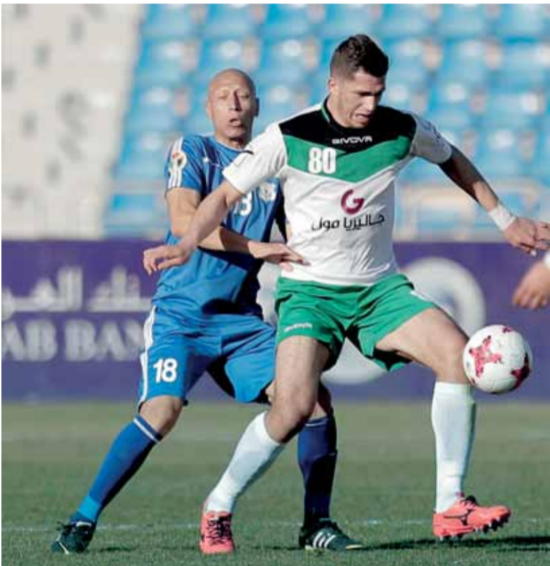
الأهلي وذات راس "حباب"