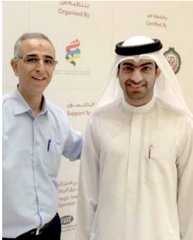
الأمير طلال بن بدر بن عبد العزيز بن سعود يتحدث الى الوحدات الرياضي

بدوره اكد النائب الأول لرئيس اتحاد اللجان الأولمبية الوطنية العربية الشيخ عيسى بن راشد آل خليفة، إن أي شيء في الحياة يبدأ صغيراً ثم يكبر مع الأيام إذا وجد الجد والإخلاص وتذليل الصعاب، وهذه الدورة انطلقت ناجحة لأنها وجدت الرعاية والدعم الكاملين من صاحب السمو الشيخ الدكتور سلطان بن محمد بن محمد القاسمي، عضو المجلس الأعلى حاكم الشارقة، وقرينته سمو الشخة جواهر بنت محمد القاسمي، رئيسة