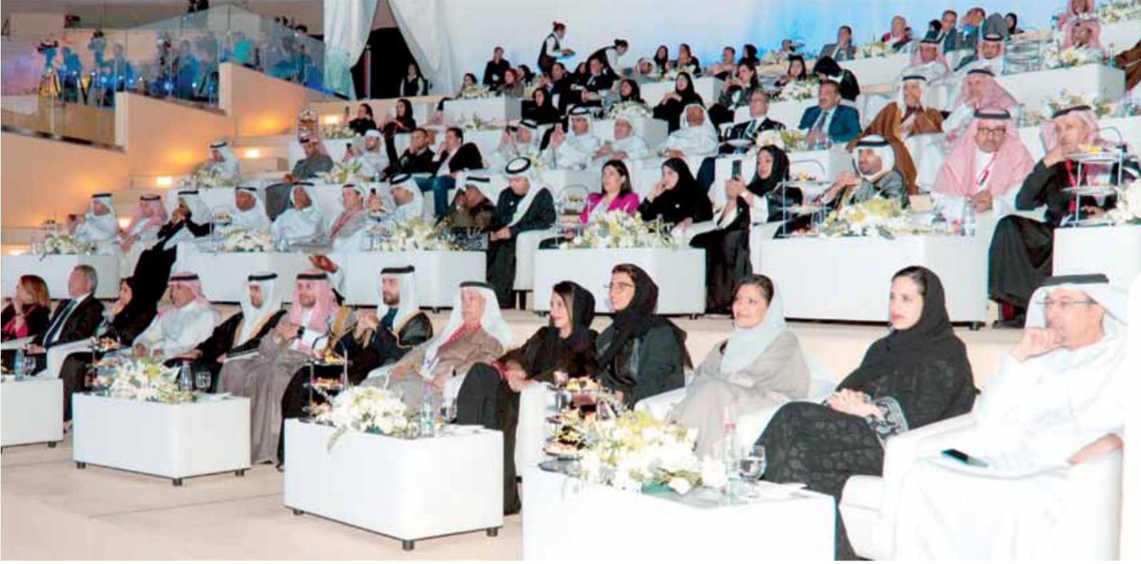
كبار الحضور في حفل الافتتاح

الآن تقدّم تنافساً كبيراً بين لاعبات العالم تقاضت اعدادهن عن الدورات السابقة، كما أنها تطرح في حلتها هذا العام تسعة ألعاب، ناهيك عن التطور اللافت الذي تشهده على صعيد النواحي الإدارية والتنظيمية، إذ أننا هذا العام في دورة خضراء، تنسجم مع التفاعلات والدعوات العالمية لحماية البيئة، إلى جانب التزامها الكبير في إرساء دعائم اللعب النظيف في جميع المنافسات."