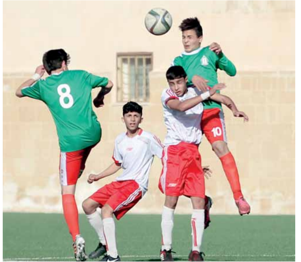
الهدير الهجومي الأخضر ارقق دفاعات المنشية

ناشئونا يحافظون على الوصافة وعينهم على الصدارة