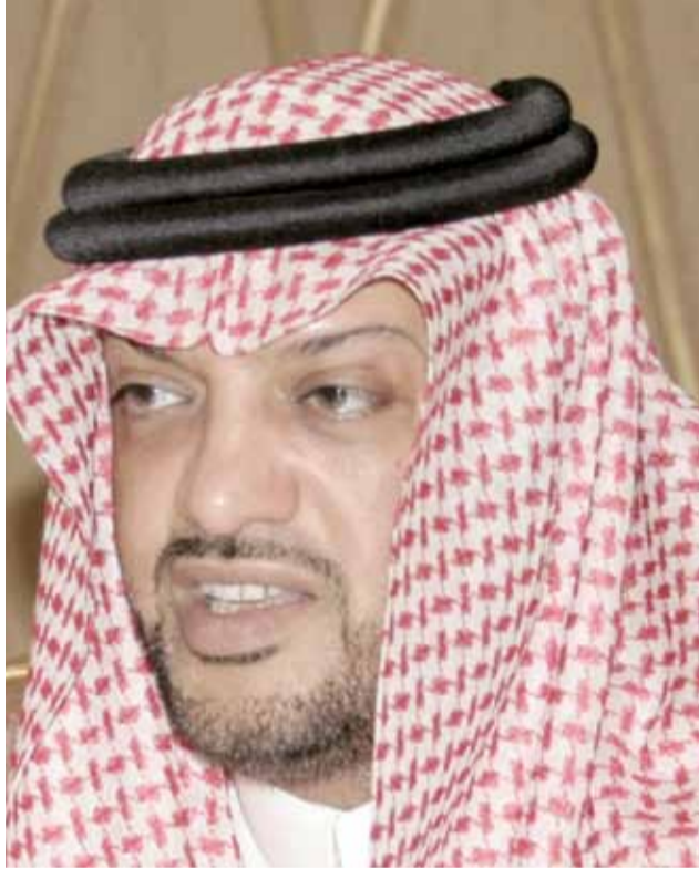
رئيس اللجنة المنظمة العليا للدورة الشيخ خالد القاسمي

وقالت الشبيخة حياة آل خليفة: "تشهد دورة الألعاب التي تعكس في حضورها مكانة الرياضة النسوية في الوطن العربي نقلة تلو الأخرى فهي