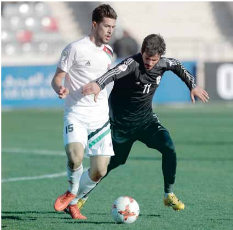
البقعة يتقدم خطوة من بوابة المنتشية

المنتشية يدخل في عمق الرعب وبخسارته امام البقعة، انضم المنتشية لفرق المنافسه للهروب من شبح الهبوط، وبات الفارق ضئيلا، فالمنتشية بالمركز الثامن برصيد ١٢ نقطة متقدما على البقعة بفارق الاهداف، يليهما الحسين بفارق نقطة، وفي المركز الحادي