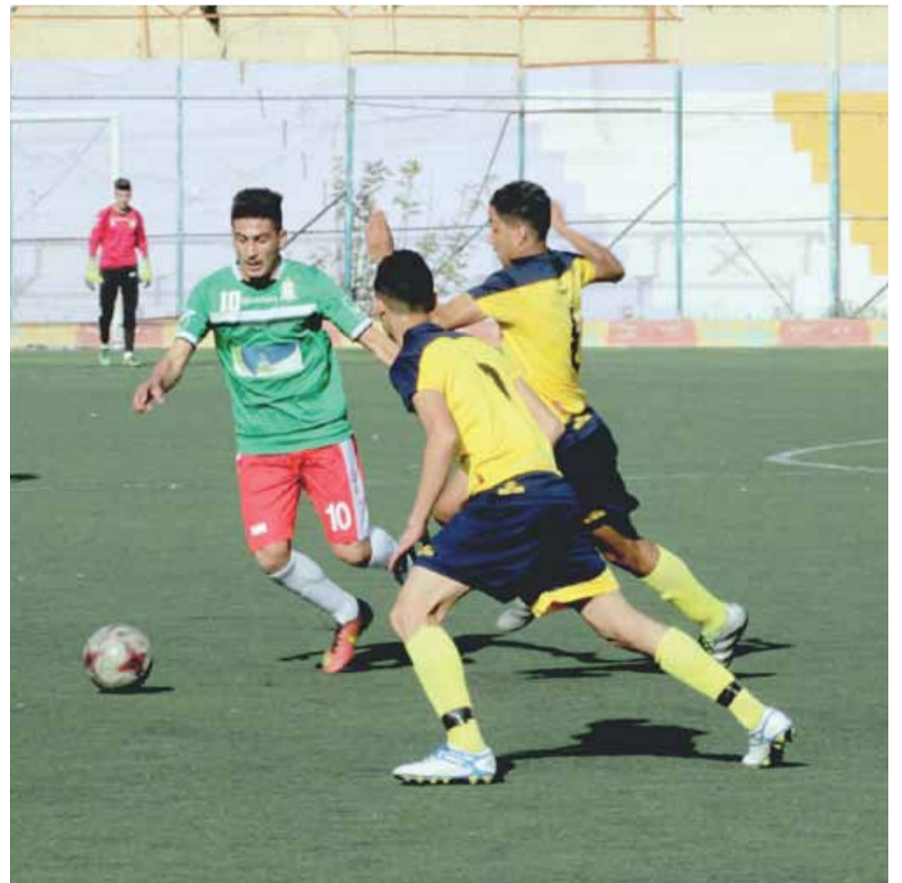
محاولات الوحدات الهجومية بائت بالفشل أمام دفاعات "الغزاة"