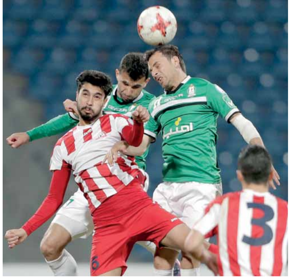
صراع هوائي مشترك على الكرة بين لاعبي الوحدات والشباب