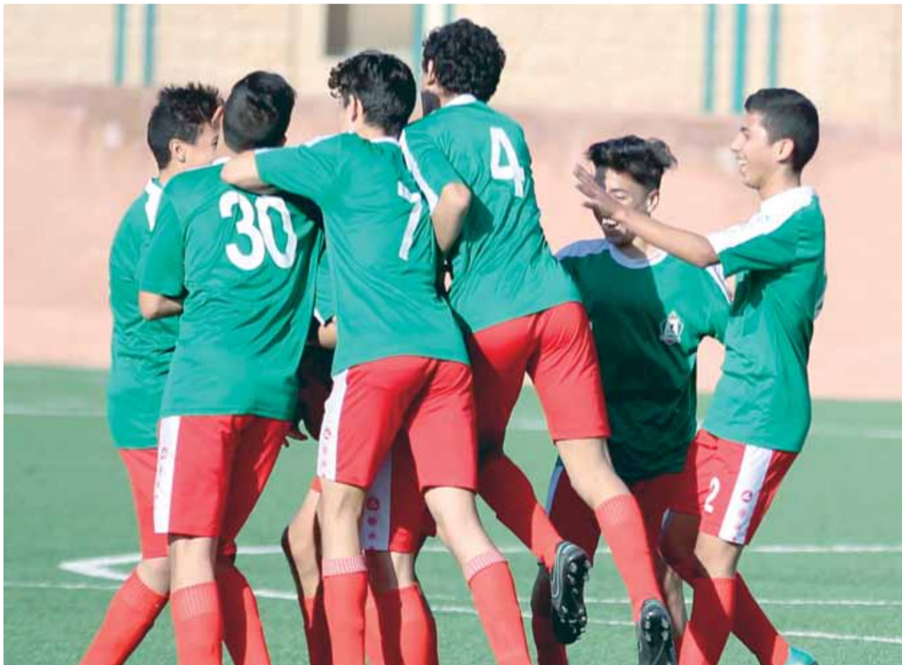
فرحة وحدائية بالفوز المستحق

أضاع الوحدات أكثر من فرصة لتوسيع الفارق، قبل أن يجد المنشية نفسه قادراً على تقليص الفارق بهدف "شرقي" لم يقدم أو يؤخر شيئاً في منح فريقنا نقاط المباراة كاملة.