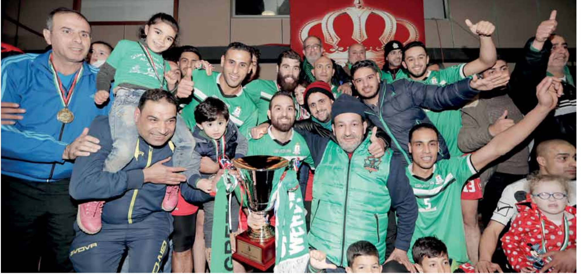
لقطة جامعة لفريق الوحدات لحظة التتويج باللقب