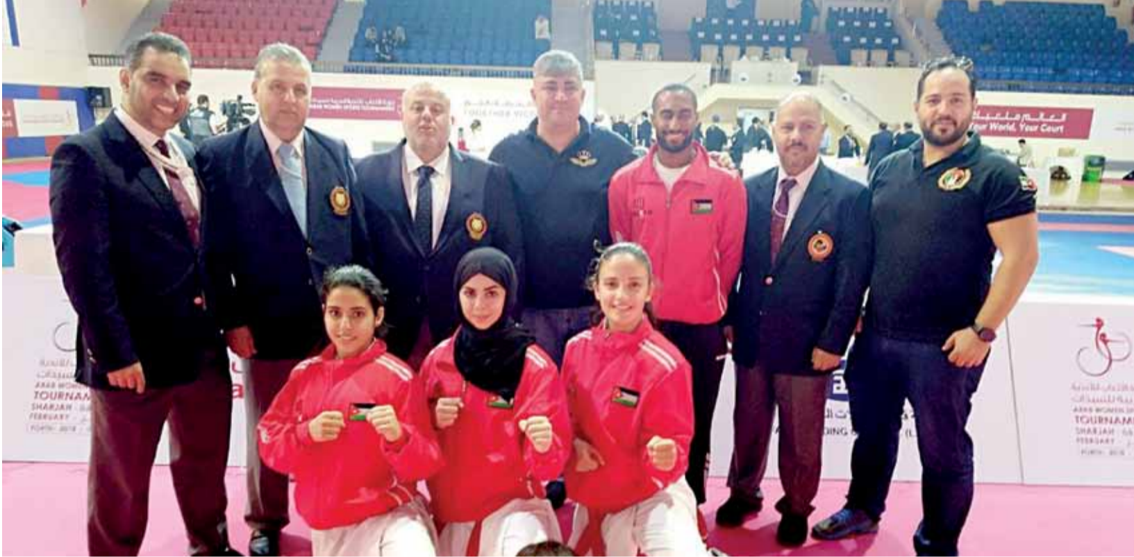
الوفد الأردني المشارك بالبطولة

المجلس الأعلى لشؤون الأسرة، رئيسة مؤسسة الشارقة لرياضة المرأة، التي كان لجهودها الفضل في تعزيز مسيرة رياضة المرأة محلياً وعربياً، وما حققتها الدورة من نجاحات باهرة."