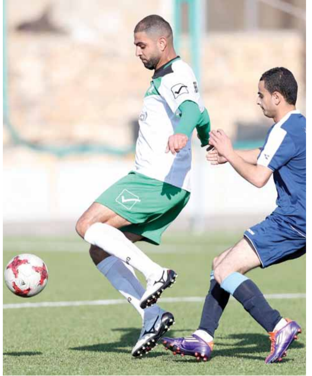
جانب من لقاءات الوحدات الودية استعدادا لإنطلاق مرحلة اياب دوري المناصير لكرة القدم