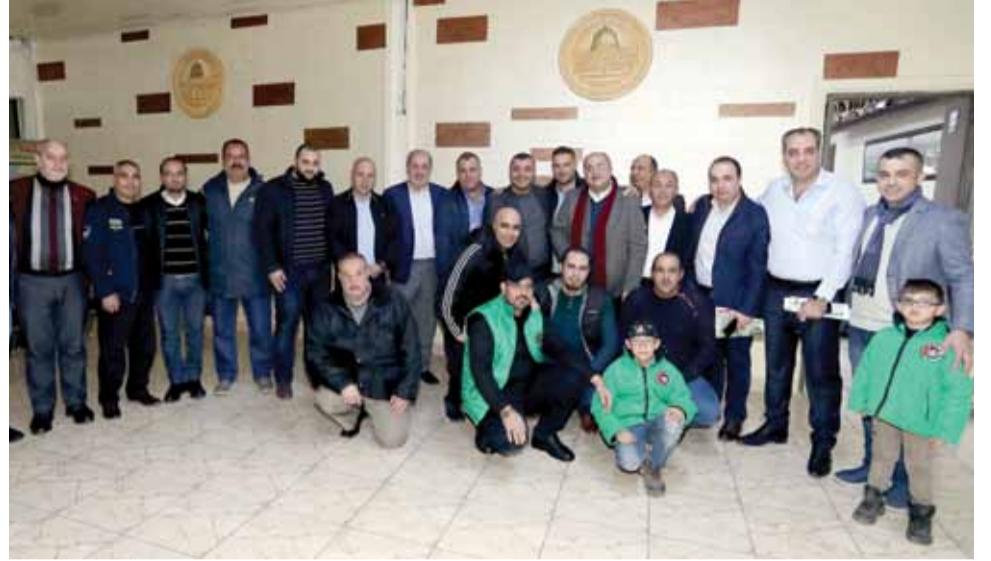
جانب من زيارة وفد جامعة الاستقلال وهلال القدس لنادي الوحدات