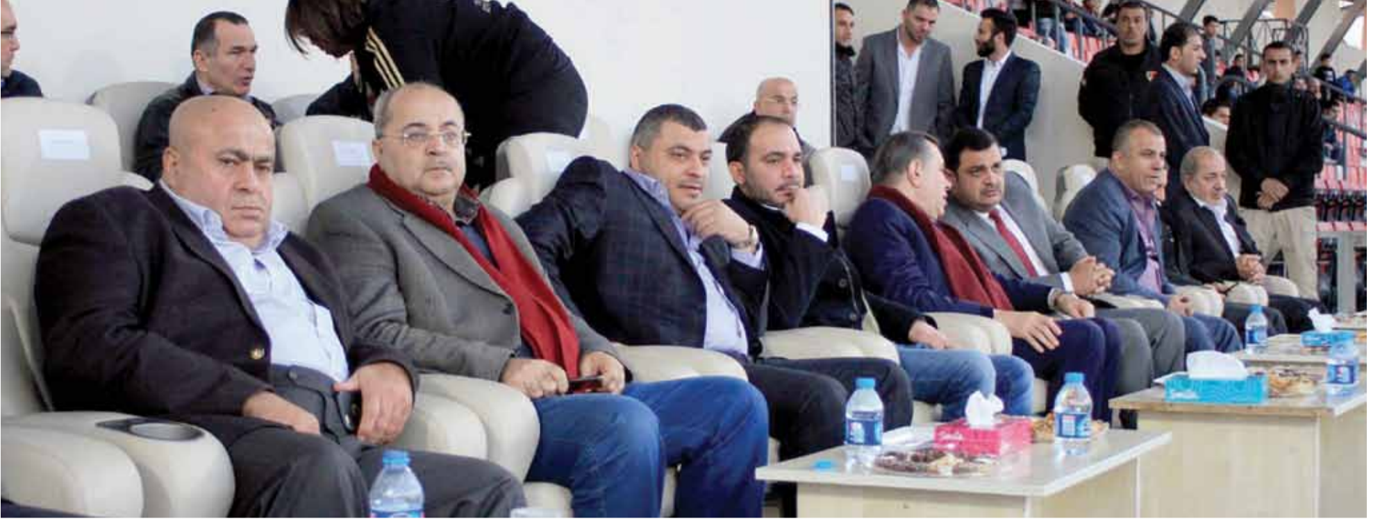
رئيس الهيئة التنفيذية لاتحاد الكرة سمو الأمير علي بن الحسين وكبار الشخصيات خلال مباراة الوحدات وهلال القدس