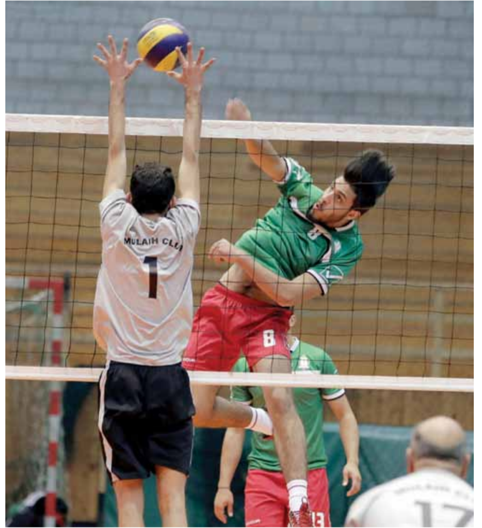
طائرة الوحدات تحلق بنجاح في اجواء مليح والمهندسين