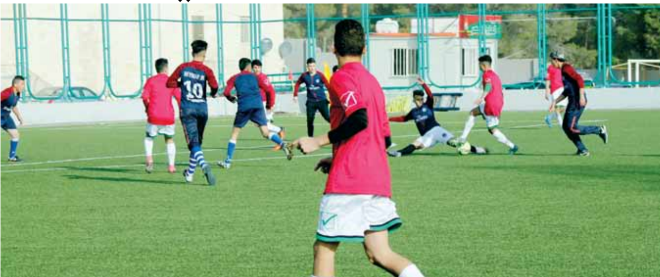
جانب من لقاء الوحدات وأكاديمية باريس سان جيرمان