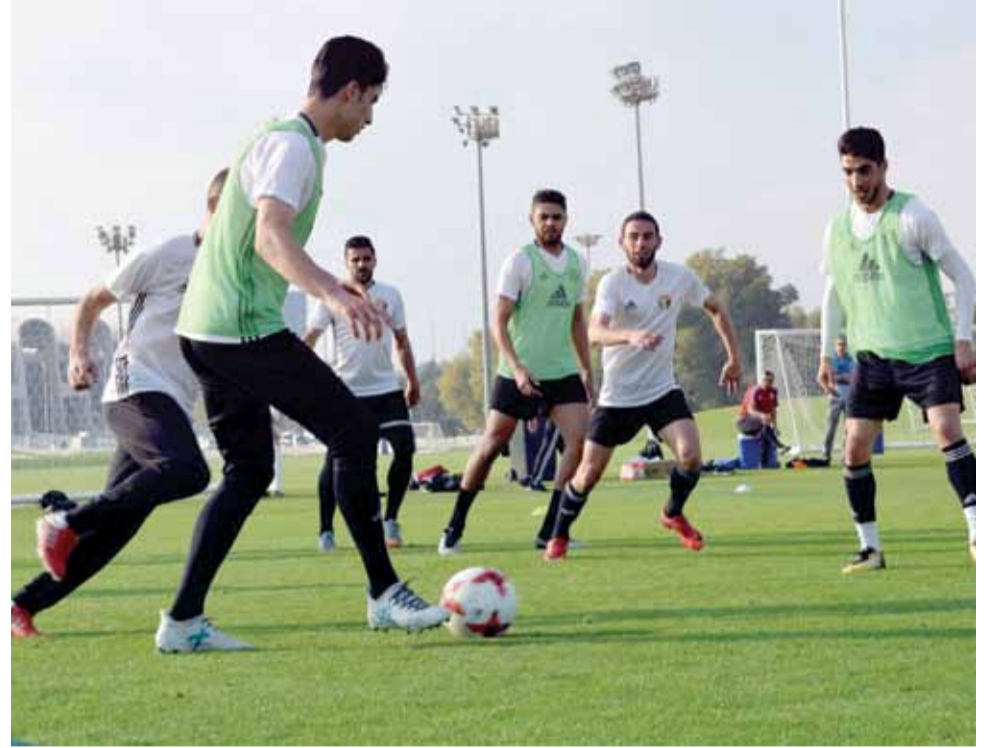
عدد من لاعبي المنتخب الوطني الأول خلال إحدى التدريبات في معسكر أبو ظبي