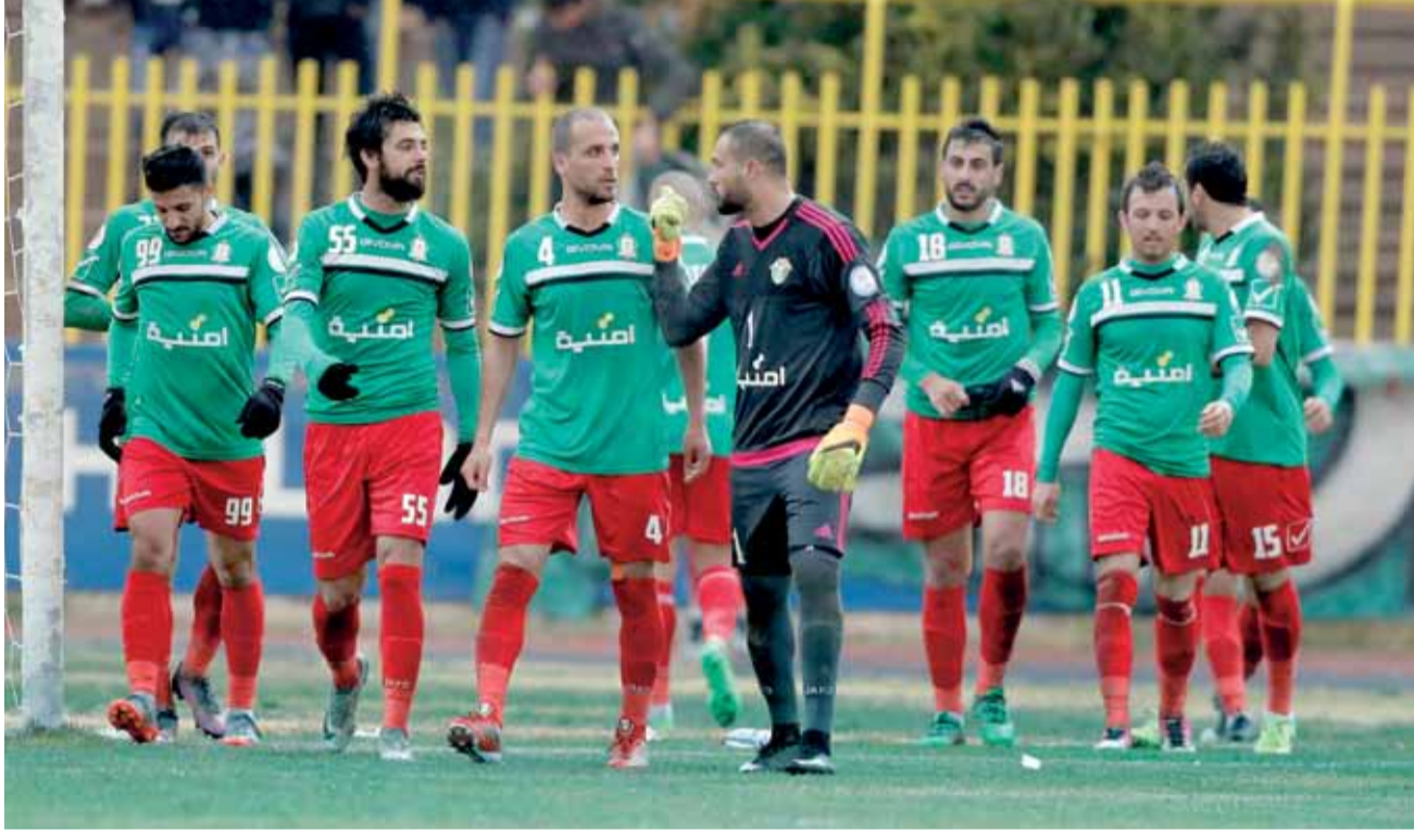
فريق الوحدات عاد من الكرك بالنقاط الثلاث

علينا وضع نتيجة لقاء ذات راس جانبا، والتفكير المنطقي والإيجابي في اللقاء المقبل أمام شباب الأردن الجمعة المقبل حتى نتواصل الانتصارات وتبقى الصدارة في عهدة الوحدات.