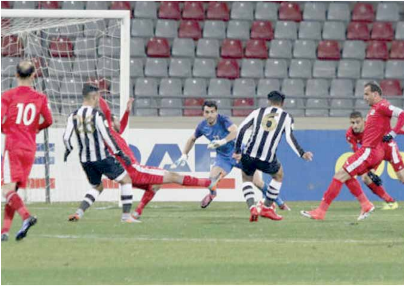
جانب من لقاء الجزيرة وشباب الأردن

تقدم مهاجم الاهلي محمود الوادي لصدارة ترتيب الهادفين بتسجيله هدف فريقه امام البقعة، مشتركا مع مهاجم المنشية ميشيل صدارة الترتيب برصيد ٩ اهداف، بعيدا بفارق هدفين عن مهاجم الفيصلي لوكاس على اعتبار ان مطارده بهاء فيصل