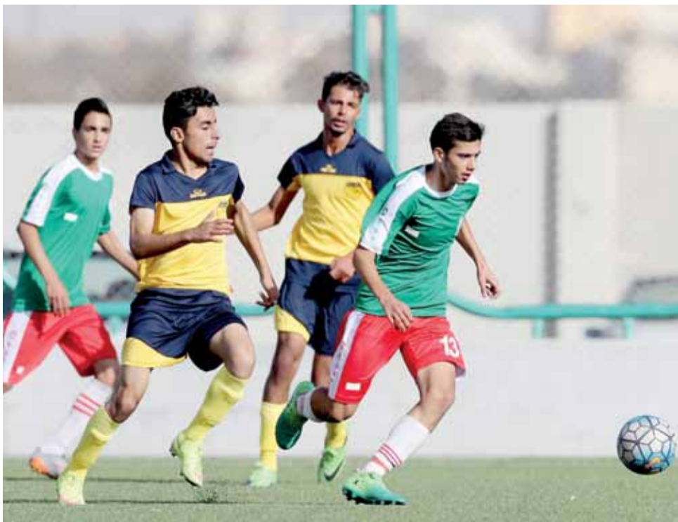
الوحدات والحسين إريد... لقاء مثير في دوري الشباب