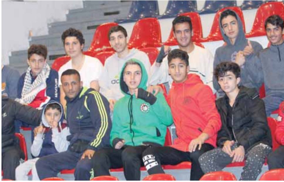
فريق الوحدات نجح في حصد ميداليات بطولة المملكة للكيك بوكسنگ