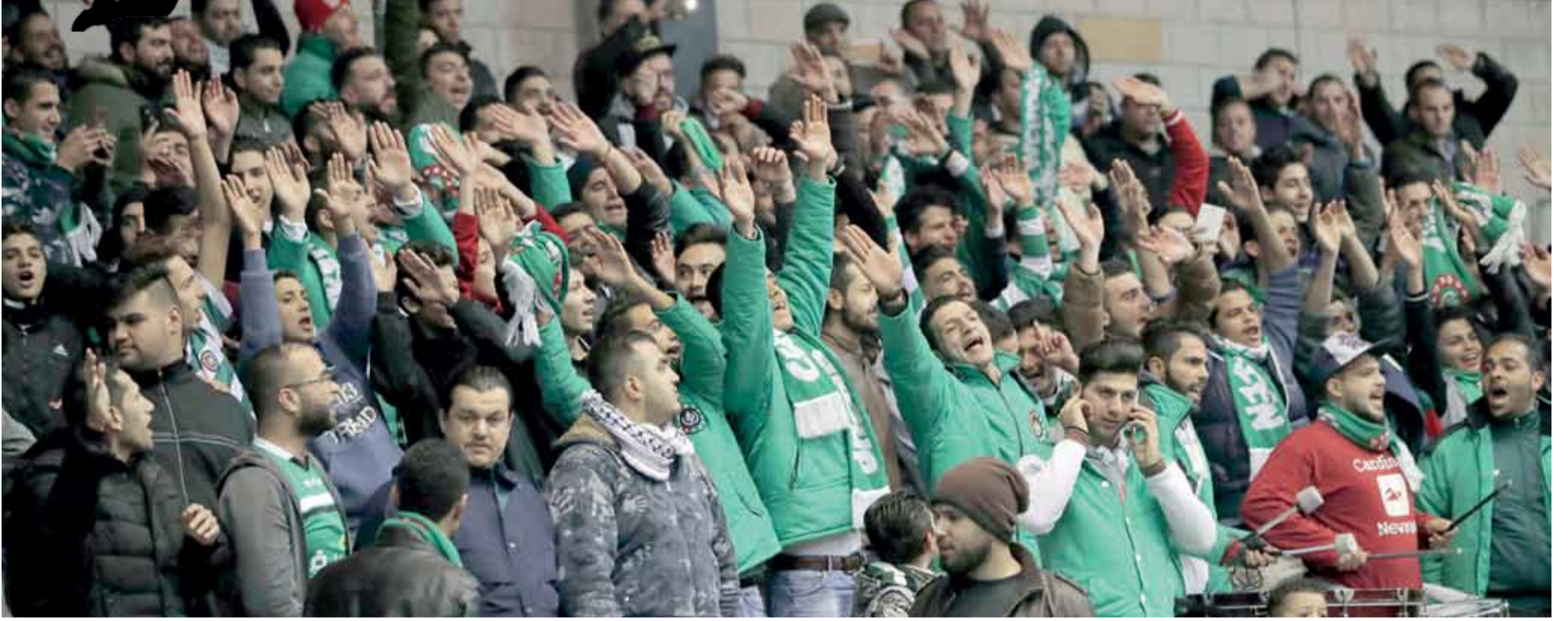
ال جماهير الوحداتية الغفيرة زينت اللقاء