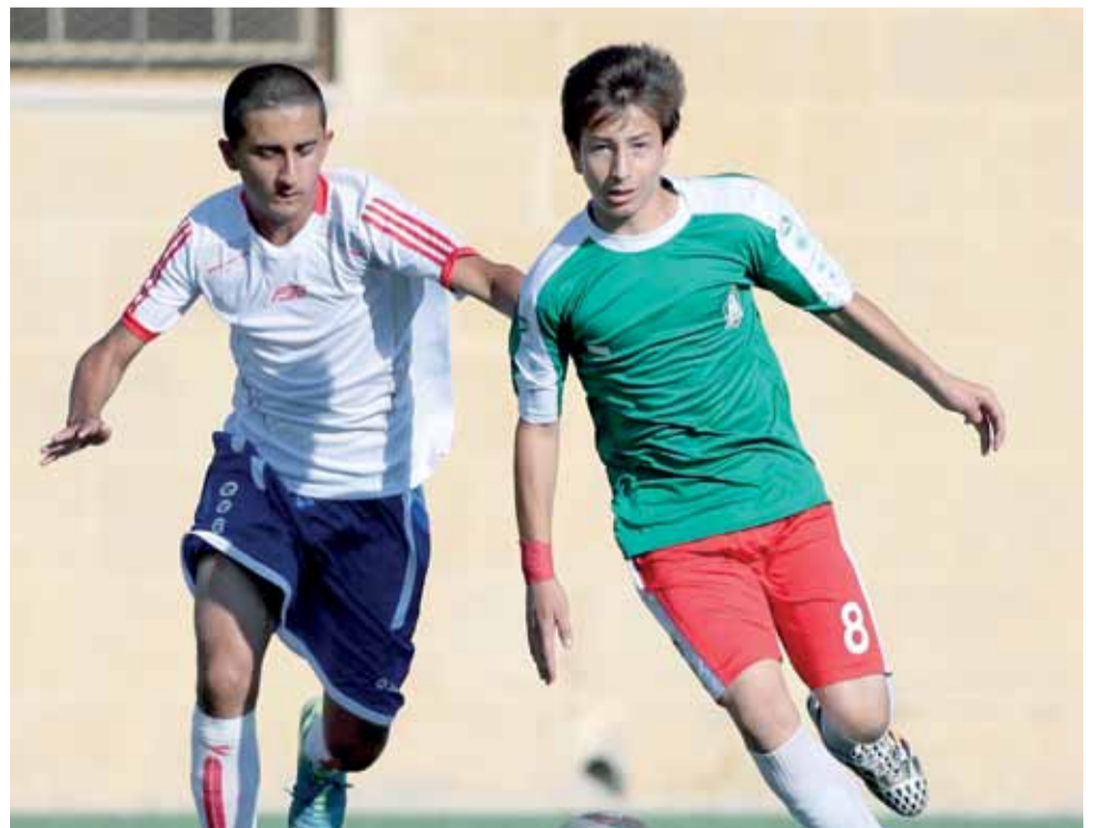
الوحدات والمنشية.. لقاء يتجدد في دوري الناشئين