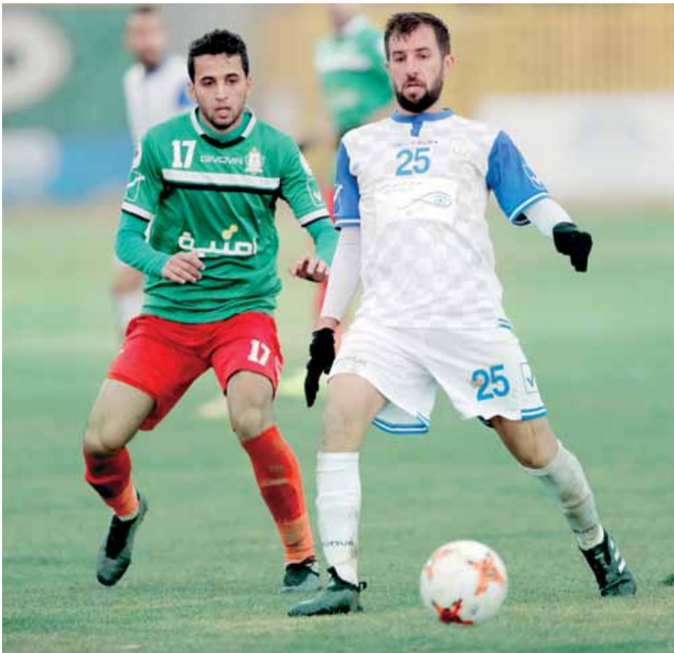
رجائي عايد ضبط العمليات الوحدانية بنجاح

ثلاثة أهداف ومثلها ضاعت وهدف وحيد سجله ذات راس في وقت متأخر، والحصيلة العودية إلى العاصمة بانتصار أقل ما يوصف