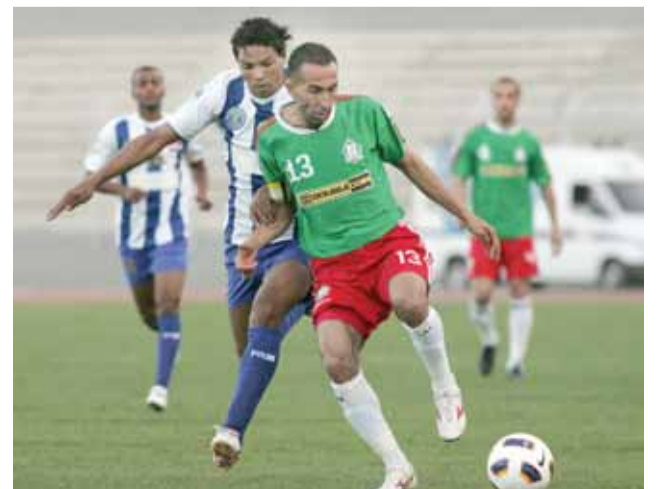
نجم النجوم رأفت علي