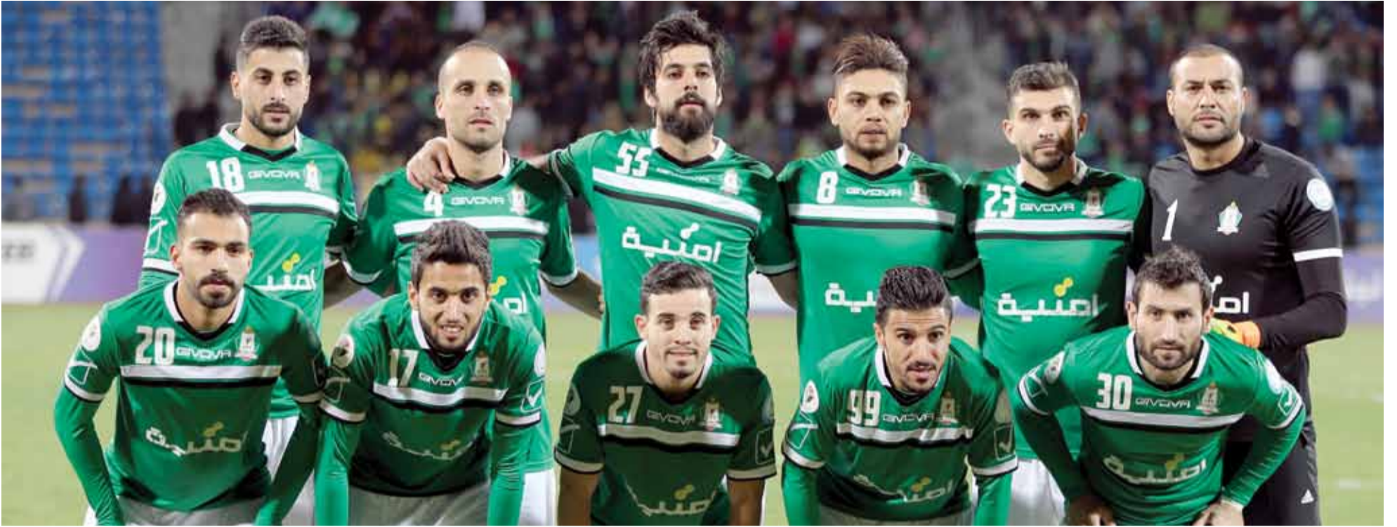
فريق الوحدات يتحضر داخليا وخارجيا لظهور مميز في ايام الدوري

تدريبات "منقوصة" .. ومعسكر دبي فرصة لالتقاط الأنفاس