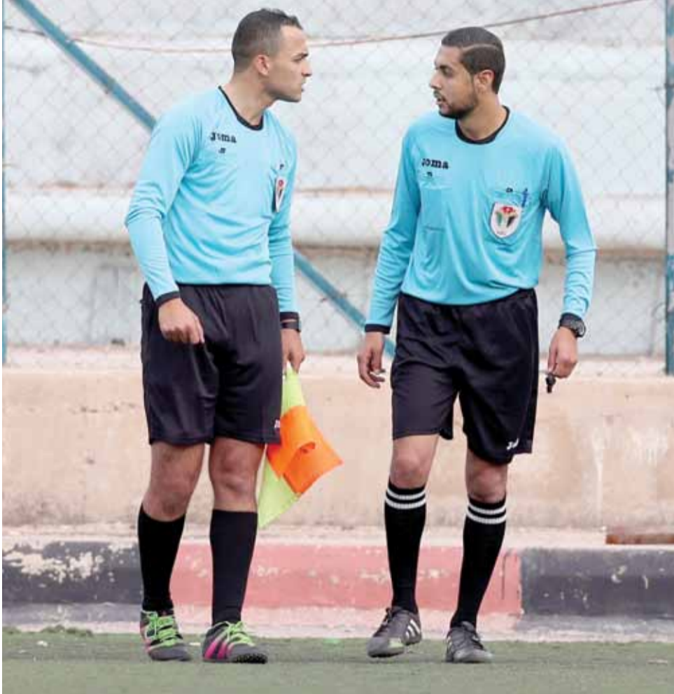
الحكم المساعد يوجه حكم الساحة بتجاوز الوقت المحدد للمباراة

هل تقبل دائرة الحكام يمثل هذا القرار الظالم؟ وماذا لو كان هناك ناديا غير الوحدات تعرض لهذا الموقف؟ هل ستكون ردة فعله هادئة ومنضبطة؟ ربما والقرار الأرجح حتى لو اعترض الوحدات أن تثبت النتيجة، وتعتبره دائرة الحكام خطأ للحكم وتمضي الأمور بعد ذلك بكل سلاسة، لكن كيف لنا أن نقنع المواهب الصغيرة أن هذا خطأ بشري لا يمكن لأي حكم حتى لو كان مبتدئا أن يضع نفسه في هذا الموقف المحرج؟!.