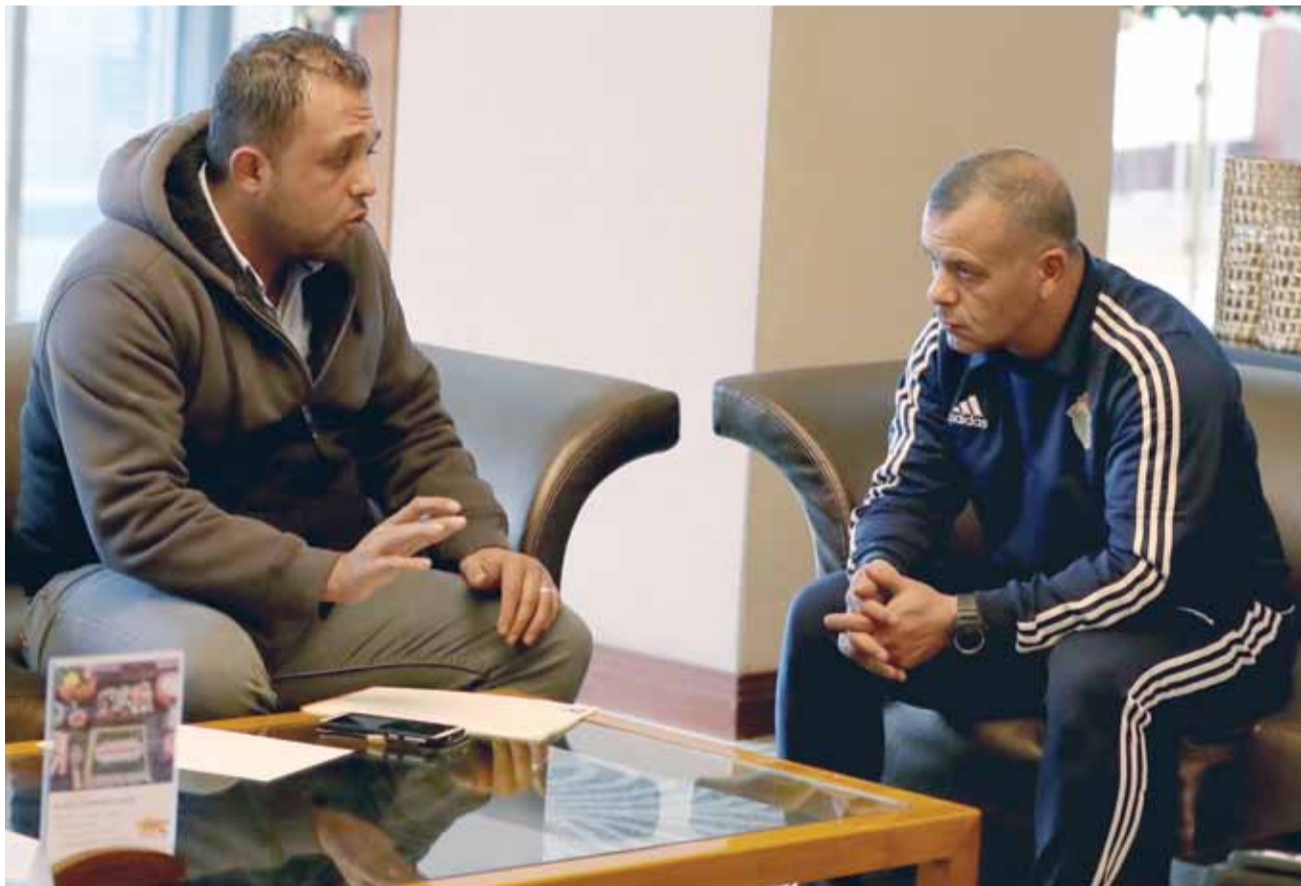
المدير الفني للمنتخب جمال أبو عابد يتحدث للوحدات الرياضي

عبر المدير الفني للمنتخب الوطني الكابتن جمال أبو عابد عن سعادته الكبيرة بثقة سمو الأمير علي بن الحسين رئيس