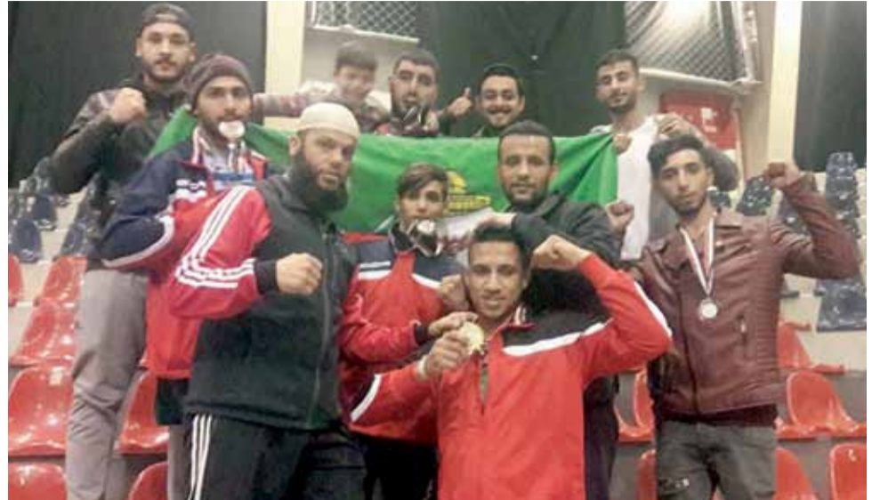
نجوم الوحدات في لعبة الكيك بوكسينغ يقدمون مستويات مميزة ويعانقون الذهب