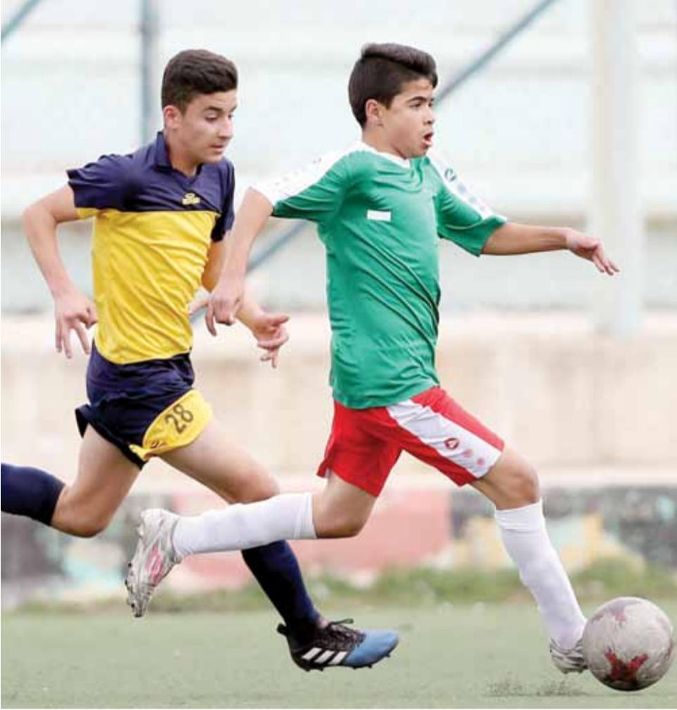
عمر صلاح في طريقه لبناء هجمة وحداتية