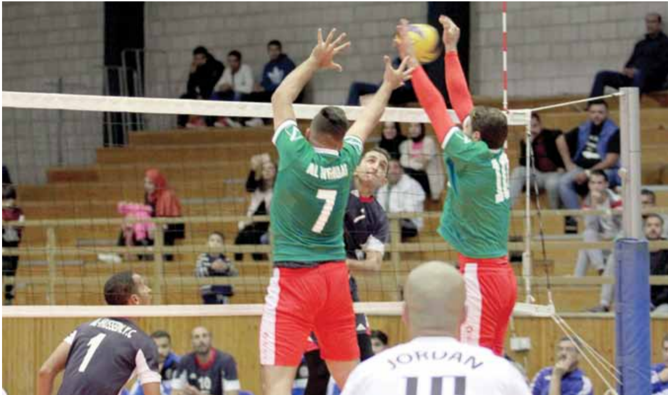
قويدهم دفاعات الوحدات بساحقات لاترد

فاجئ شباب الحسين الوحدات مبكراً وهو يتقدم سريعاً (5-3)، بعدما جاءت النقاط الثلاث الأولى