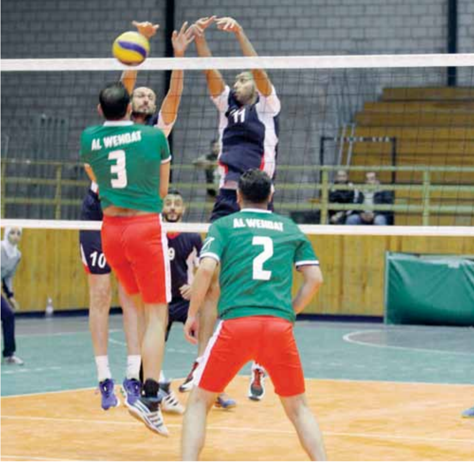
انعدام اللياقة البدنية اثر على لاعبي الوحدات