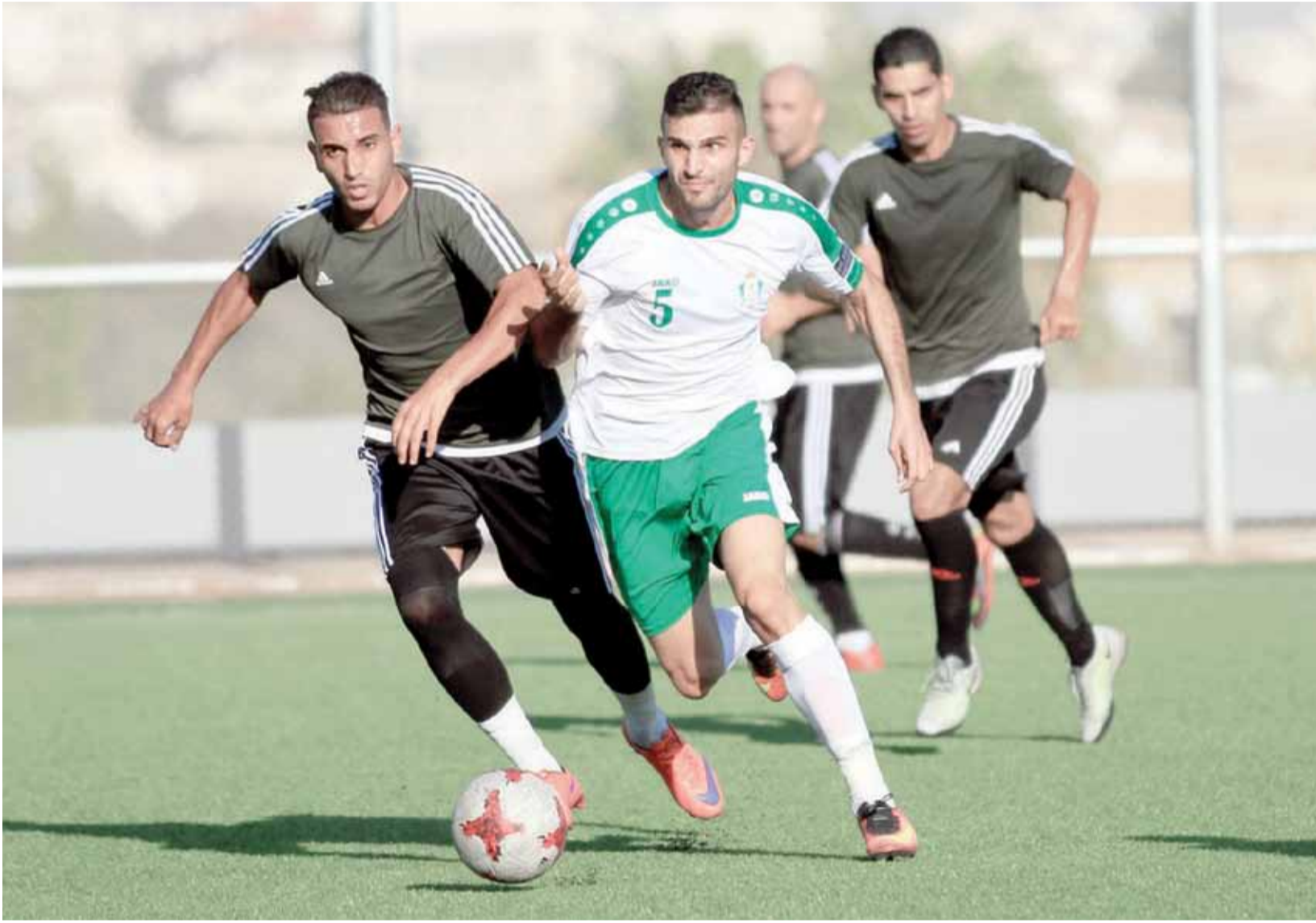
الوحدات يحذر من اليرموك الغريق

الخطر من جميع الإتجاهات، وهو يقابل فريق متخم بالنجوم، ويبحث عن النقاط الثلاث للتوغل في صدارة الترتيب، وتجعله المساحة بين القمة والقاع، يقلب في خياراته ويقدمها بالثوب الدفاعي حذار من الخسارة، الى جانب الاوراق الاكثر فاعلية هجومية، تفيد منطق الهجوم المرتد والسريع الذي ينشده امام خصمه العنيد.