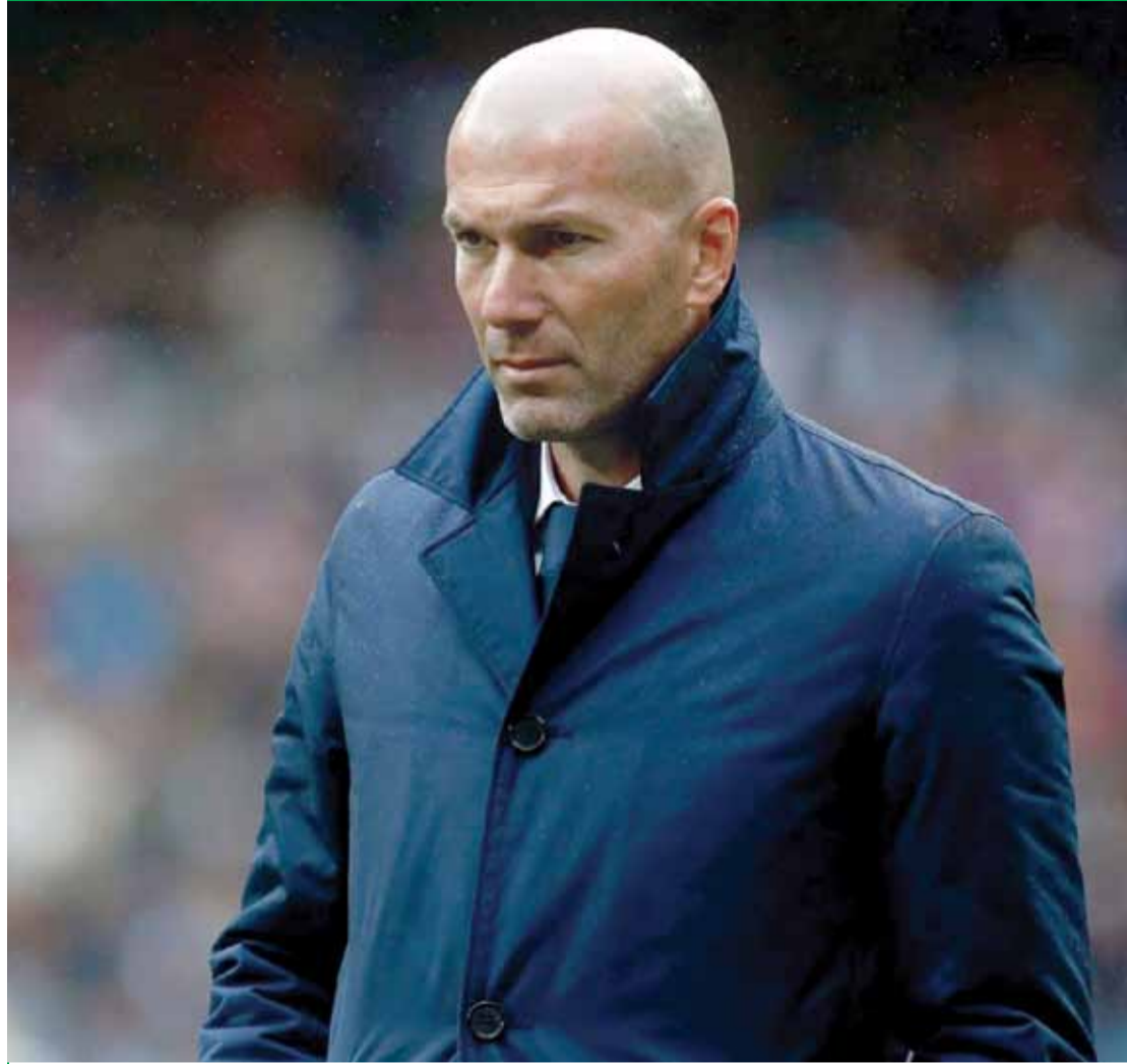
زيدان الحائر: ما يزال المدير الفني لفريق ريال مدريد الإسباني زين الدين زيدان، حائراً في نتائج واداء فريقه في الليغا الإسباني و ايجاد الحلول لوقف النزيف النقطي خاصة بعد ان تعثر بالتعادل السلبي امام الجار اتلتيكو مدريد ، وقدم الهدية لمنافسه التقليدي فريق برشلوطة ليتوغل بالصدارة.

أحدى المحللين عبر مواقع التواصل الاجتماعي علق على طفرة المحللين الرياضيين في المملكة الأردنية الهاشمية، الأمر الذي يراه المحلل بعدم ايجابية الفعالية وإخراج محللين من الأجيال الصاعدة بالإضافة إلى التهميش من الجهات المختصة وعدم إعطاء المحلل الداخلي حقوقه وتلاشي الخطط المدروسة للأعوام القادمة، خصوصاً أن المحلل يعتبر عنصر فعال في عالم الرياضة العالمية منقوص بشكل كلي للرياضة الأردنية.