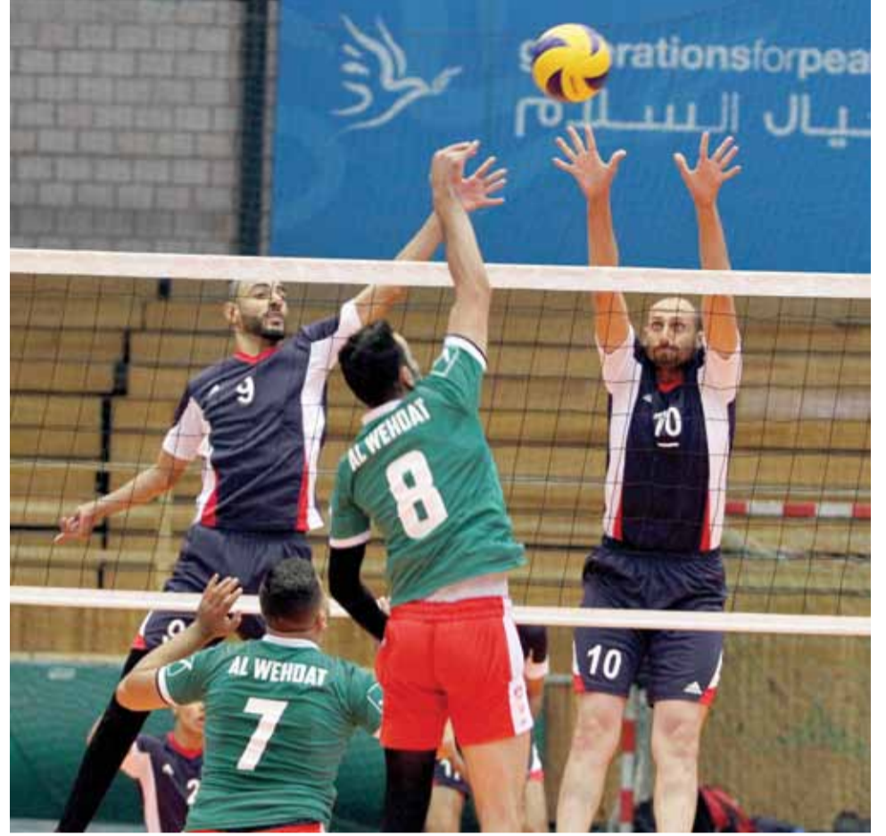
حيوية شباب الحسين كشفت وهن مهاجمي الوحدات

"الوحدات الرياضي" تنفرد.. انهيار واضح في