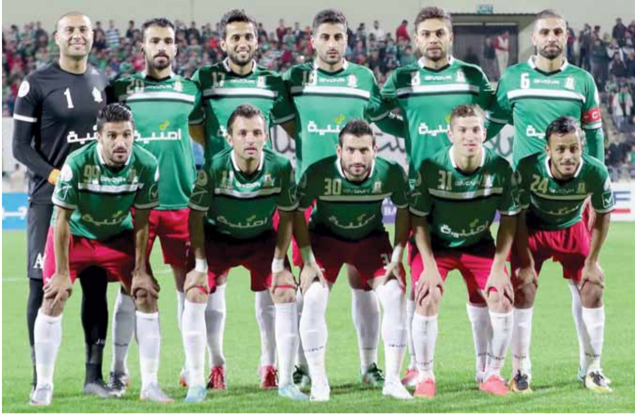
فريق الوحدات لكرة القدم