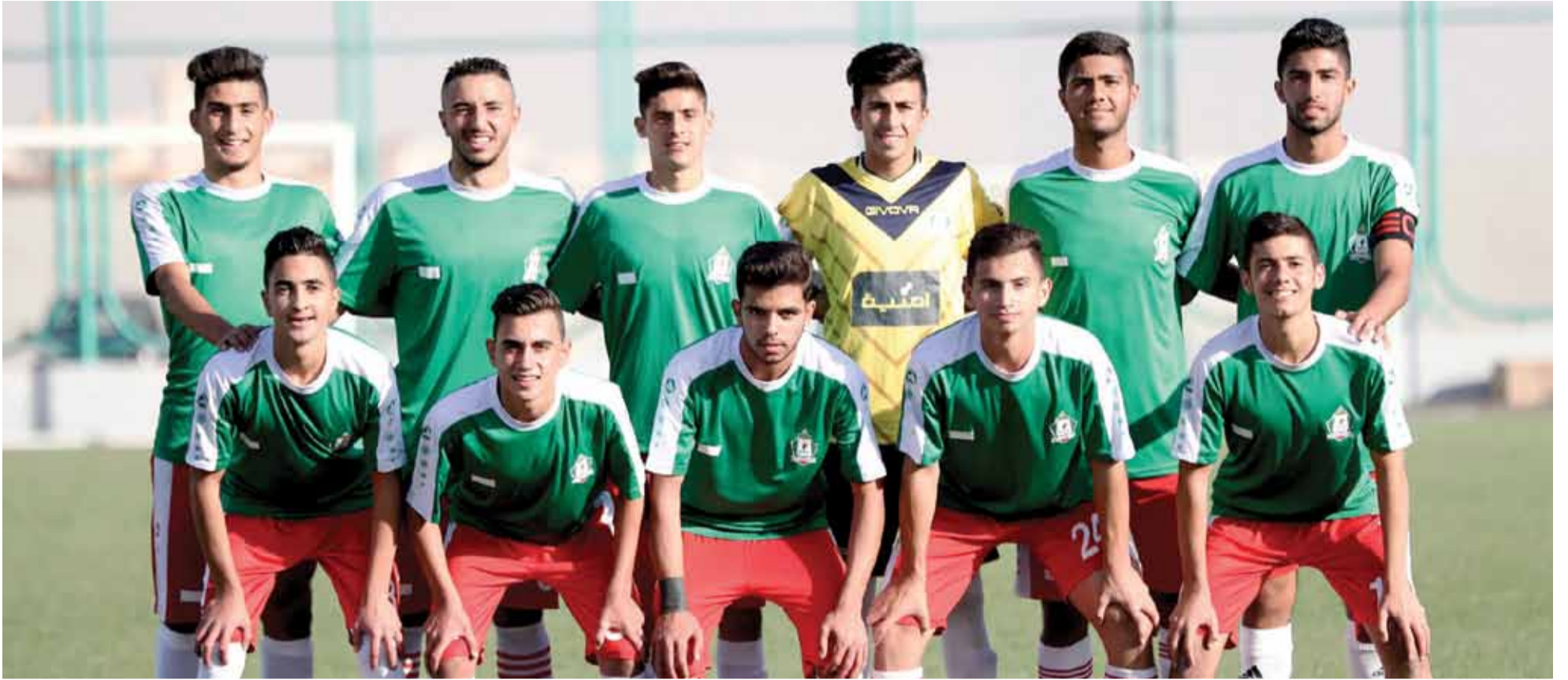
فريق الوحدات الشاب يطمح لاسترداد الصدارة