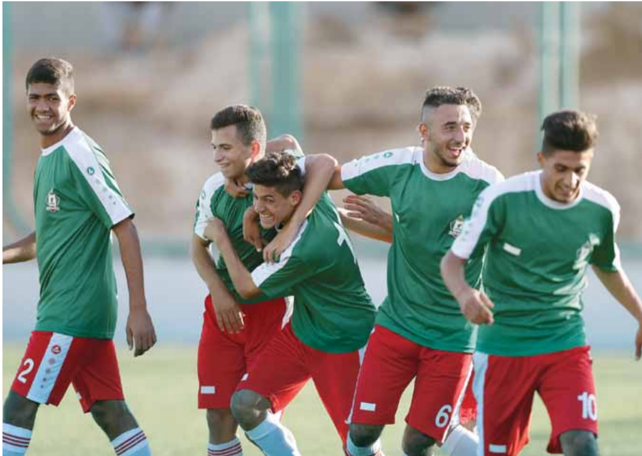
فرحة وحدانية بالهدف الثالث

هنا لم تنتهي المباراة والأهلي لم يستسلم أو يرفع الراية بل بقي مصمما أن يقلص الفارق ويعود إلى التعادل إن ساعده الوقت في ذلك، قبل أن يضيف الهدف الثاني بعد دربكة داخل منطقة الجزاء، ومرة الدقائق الأخيرة صعبة على الوحدات في ظل احتساب أكثر من "٦" دقائق وقت بدل ضائع استطاع فيها الوحدات الحفاظ على تماسكه الدفاعي تحديدا في رد كل الكرات التي كانت توجه إليه.