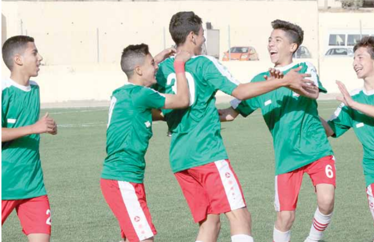
احتفال ناشئي الوحدات بالأهداف تكرر مرات ومرات

الجهاز الفني للوحدات الذي نحترم ونقدر عمله خلال الفترة الماضية نريده أن يضاعف مجهوده مع اللاعبين في الفترة المقبلة التي لا تحتمل أبدا المزيد من النزيف النقطي.