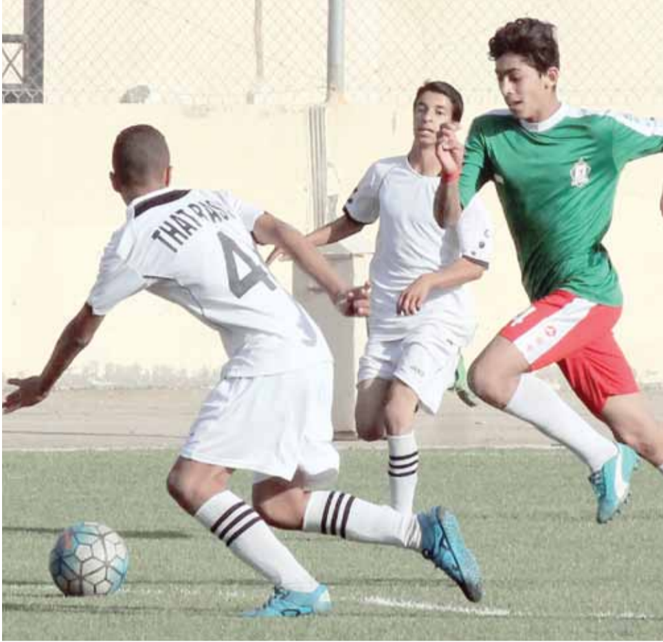
سيطرة نجوم الوحدات على منطقة الوسط ساعدتهم بتحقيق نتيجة قياسية