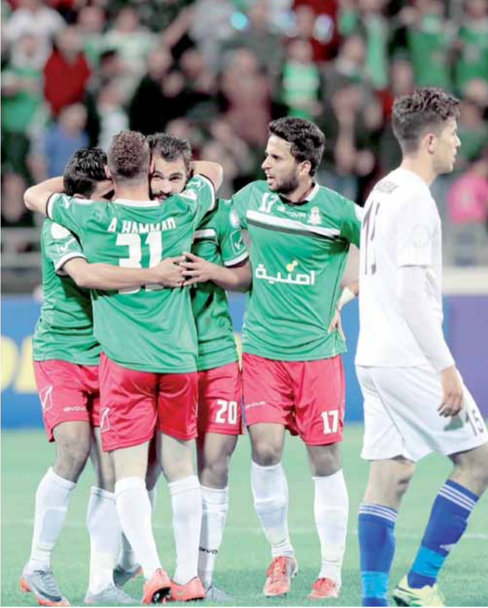
الفرحة الوحداتية أمام المنشية تكررت خمس مرات