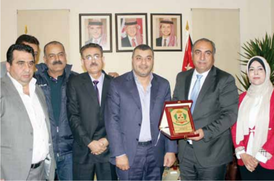
لقطة جامعة لاعضاء ادارة نادي الوحدات مع الشواربة