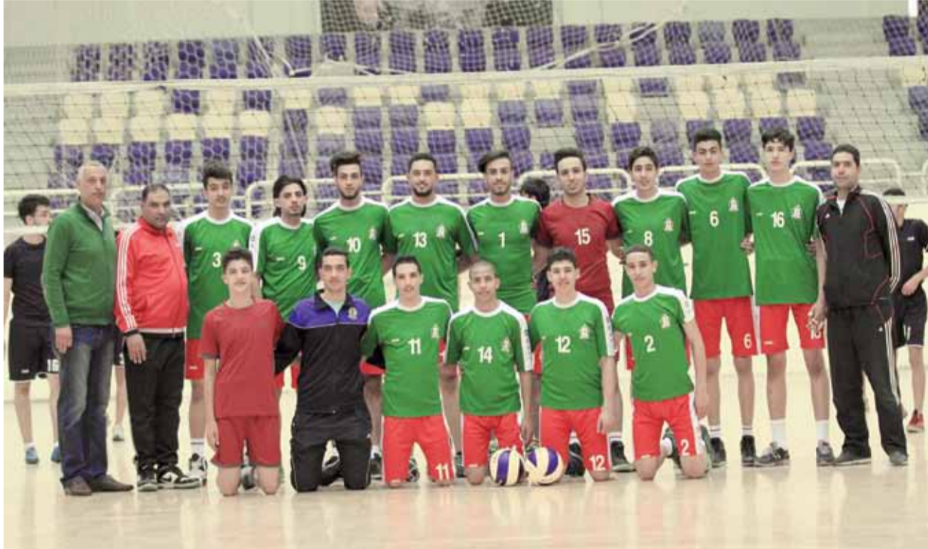
طائرة الشباب تبدأ مشوار الدوري بانتصار هام

الوحدات انهى اللقاء كما أراد وطوع طموح بيت إيديس لصالحه وهو ينهي الشوط الثالث واللقاء بنتيجة (٢٥-١٢).