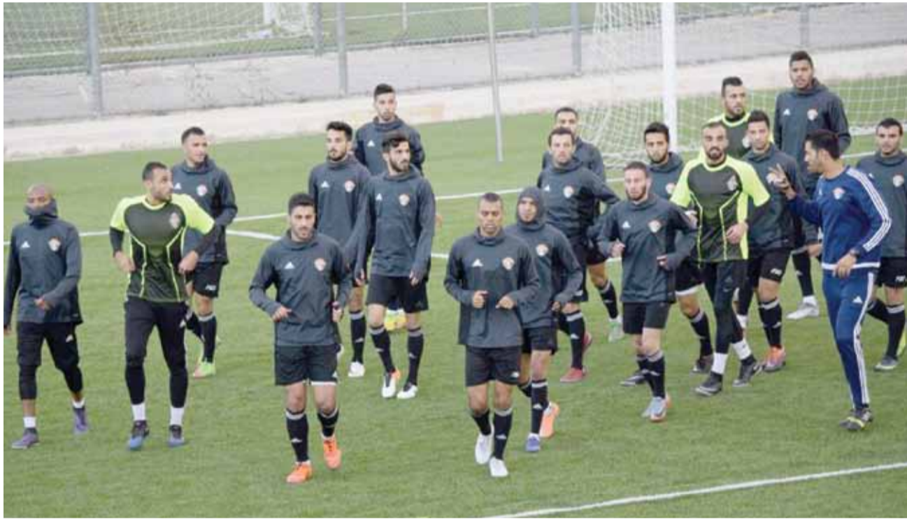
جانب من استعدادات منتخب الكرة للقاء كمبوديا