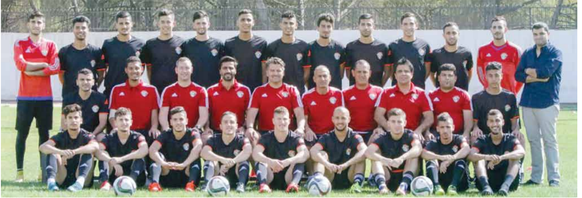
لقطة جامعة لتشكيلة منتخب "النشامى"