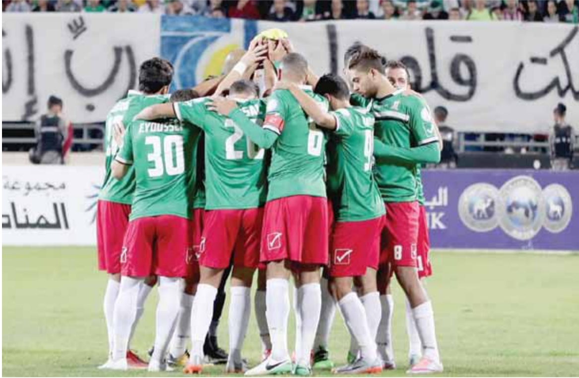
لاعبو الوحدات تعاهدوا على مواصلة الانتصارات