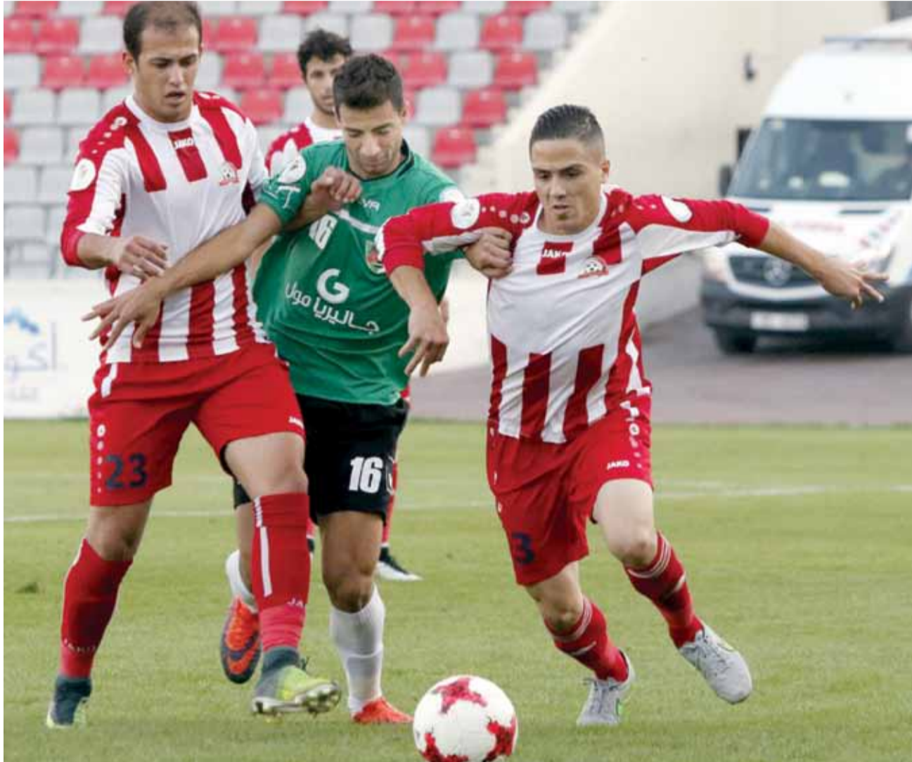
الأهلي تلقى خسارته الثانية على التوالي أمام شباب الأردن

مباريات الاسبوع التاسع تنطلق مساء يوم الخميس المقبل 16 الشهر الحالي، حيث يلتقي في السادسة والنصف البقعة مع الحسين على ستاد الملك عبدالله، ويوم الجمعة يلتقي المنشية مع شباب الأردن في الرابعة على ستاد المفرق، وفي ذات التوقيت يلتقي الرمثا مع ذات راس على ستاد الحسن، وفي السادسة والنصف يلتقي الأهلي مع الفيصلي على ستاد عمان الدولي، ويوم السبت يلتقي في الرابعة الجزيرة مع اليرموك على ستاد عمان الدولي، وفي السادسة والنصف يرتحل الوحدات لملاقاة شباب العقبة على ملعب العقبة.