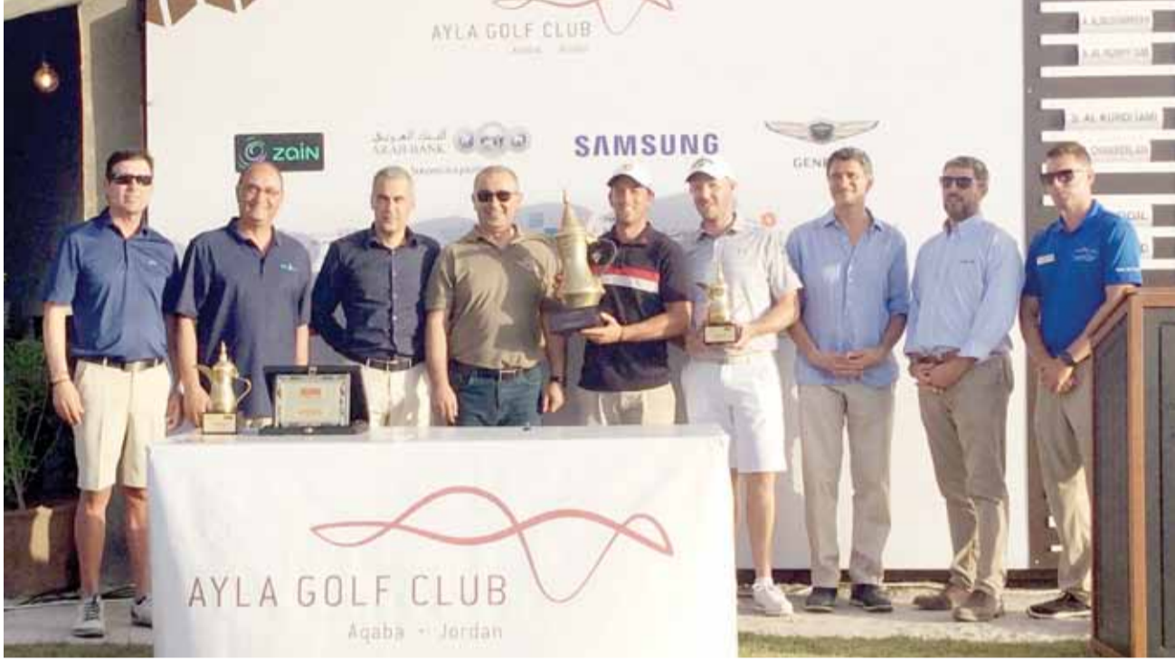
لقطة تذكارية للفائزين بالبطولة

اقامة بطولة الجولف بمشاركة لاعبين من اكثر من 28 دولة، وسباق آسيا للترايثلون بمشاركة 22 دولة، وفتحت تلك الأحداث والفعاليات مشوارا جديدا في سلسلة من الرياضيات المتنوعة وغير التقليدية، وتضيف للعقبة والأردن لمسات ابداعية في تنوع منتجها السياحي، واعطت زخما سياحيا اضافيا للاردن، من خلال فتح المساحات للمشاركة لزيارة البترا ووادي رم، وهو ما لم تسطيع تحقيقه العديد من المؤسسات الرسمية التي تعمل على ترويج الاردن سياحيا.