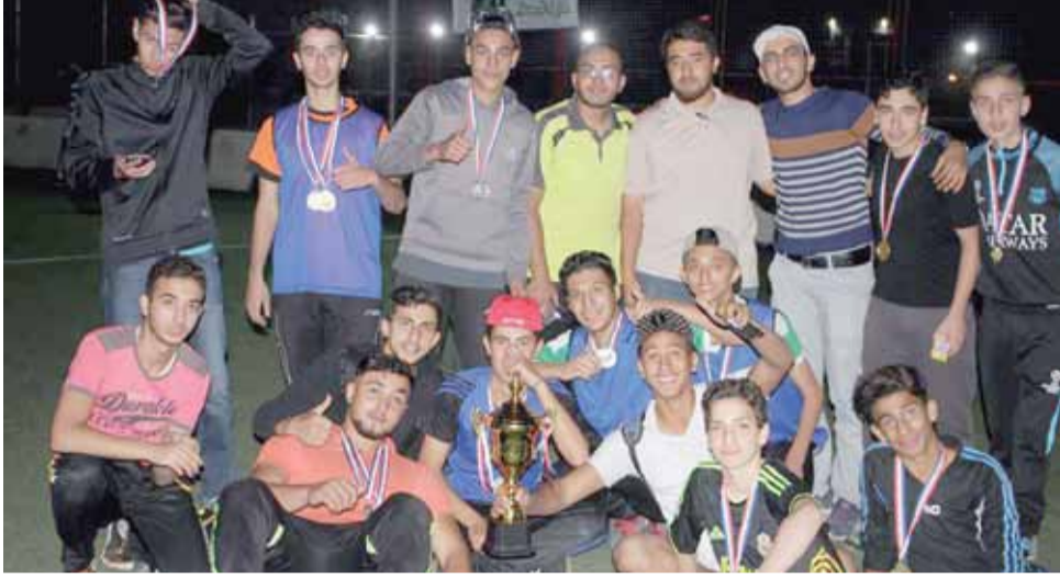
فريق "المريخ والنظيف" صاحب اللقب