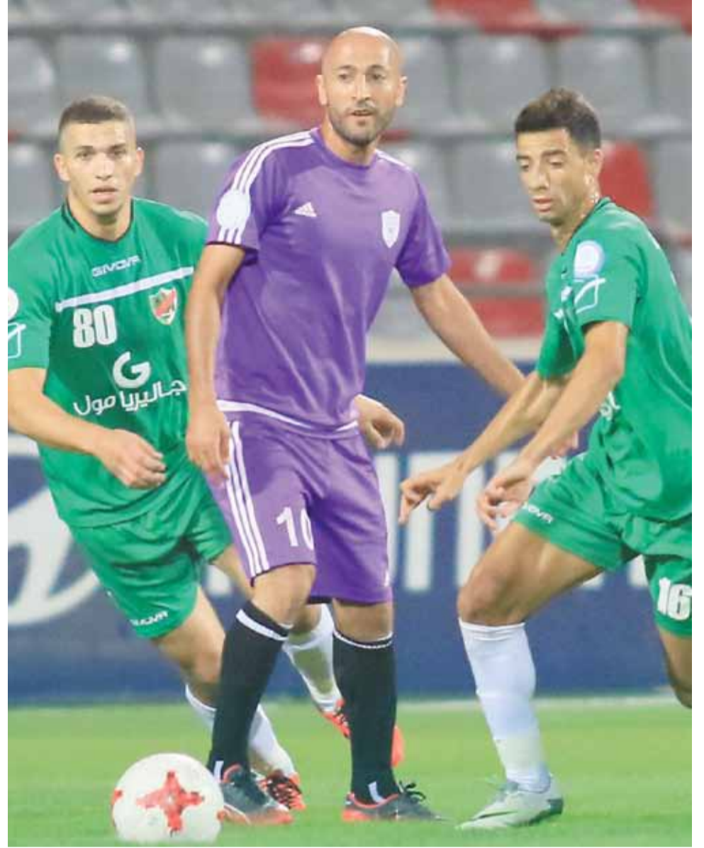
جانب من لقاء الأهلي واليرموك