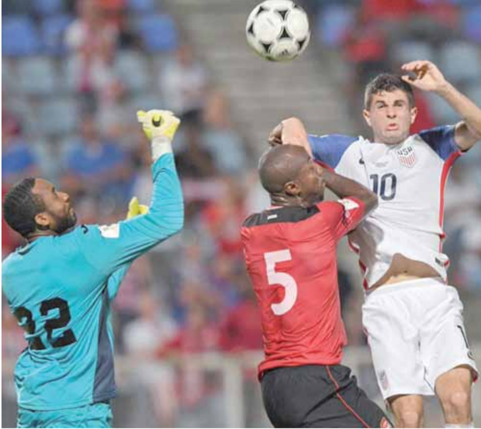
المنتخب الإنجليزي بدون عناء يصل للمونديال