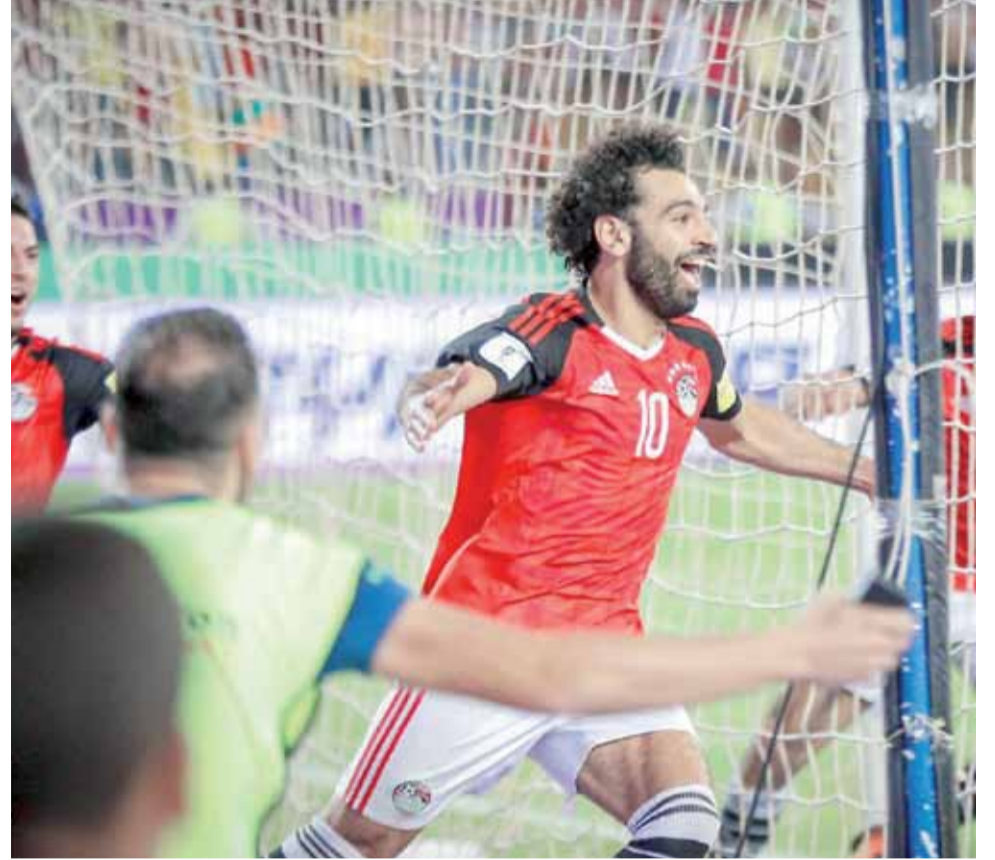
محمد صلاح رسم الفرحة على وجوه المصريين