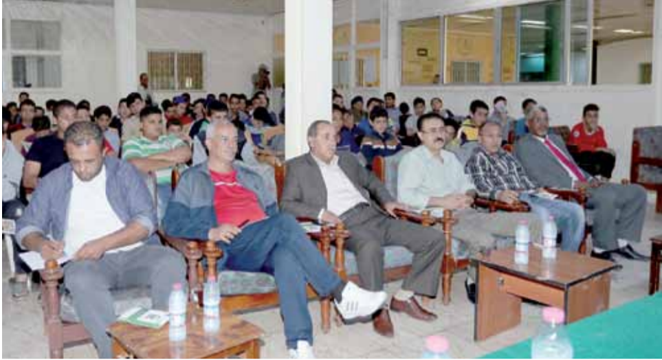
حضور واهتمام رسمي بالندوة