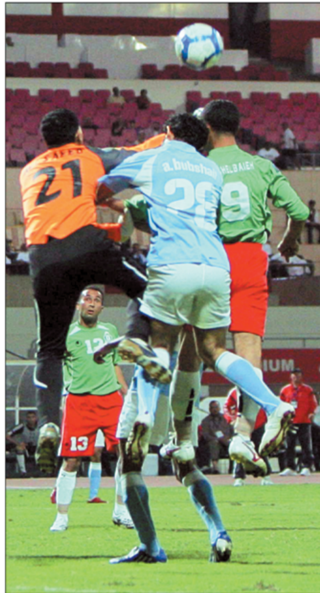
○ نجح دفاع الرفاع في عدم خسارة فريقه.

لا نريد أن نخسر ثقة المشجعين ، خصوصا أننا مقبلون على مباريات حساسة وحاسمة ، لأنها العصب القوي للأخضر ، ويفقد أغلب مزاياه بدونها والتي لا غنى عنها كذلك.