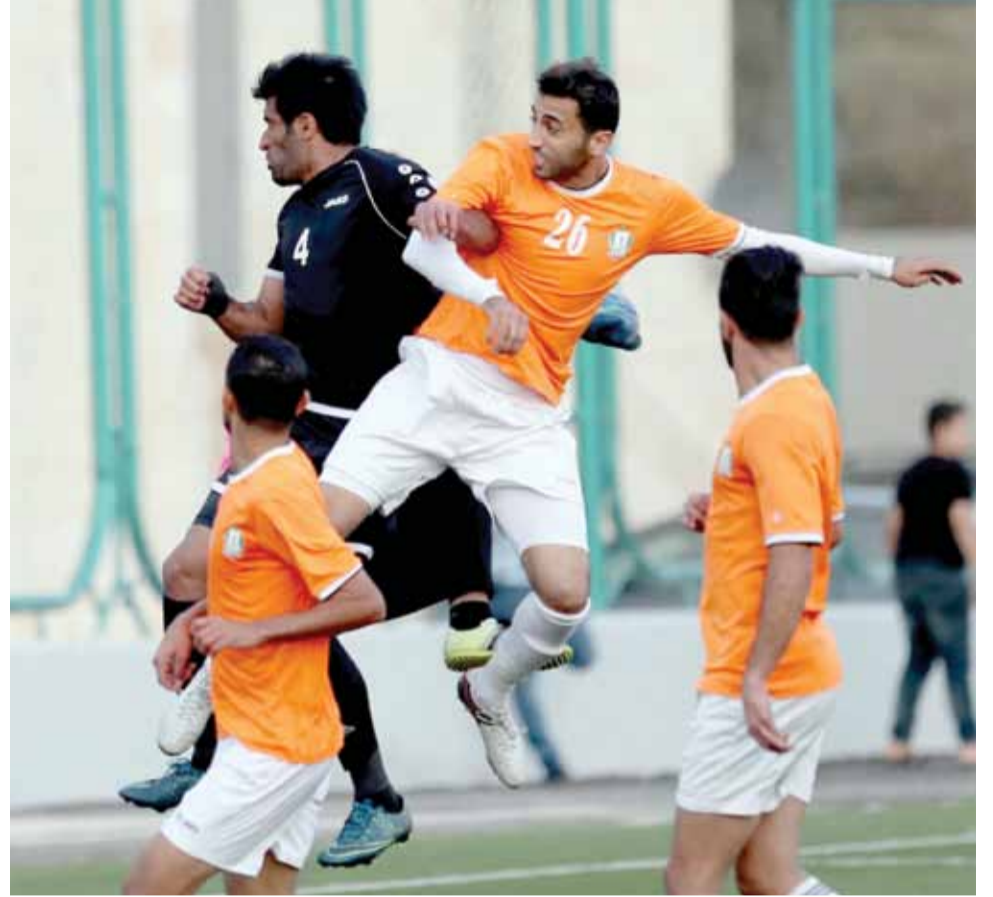
جانب من لقاء ودي سابق جمع الفريقين