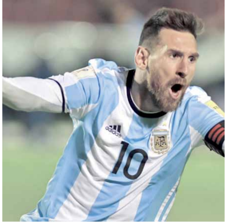
الساحر ميسي نقل الأرجنتين الى المونديال بهاترك تاريخي