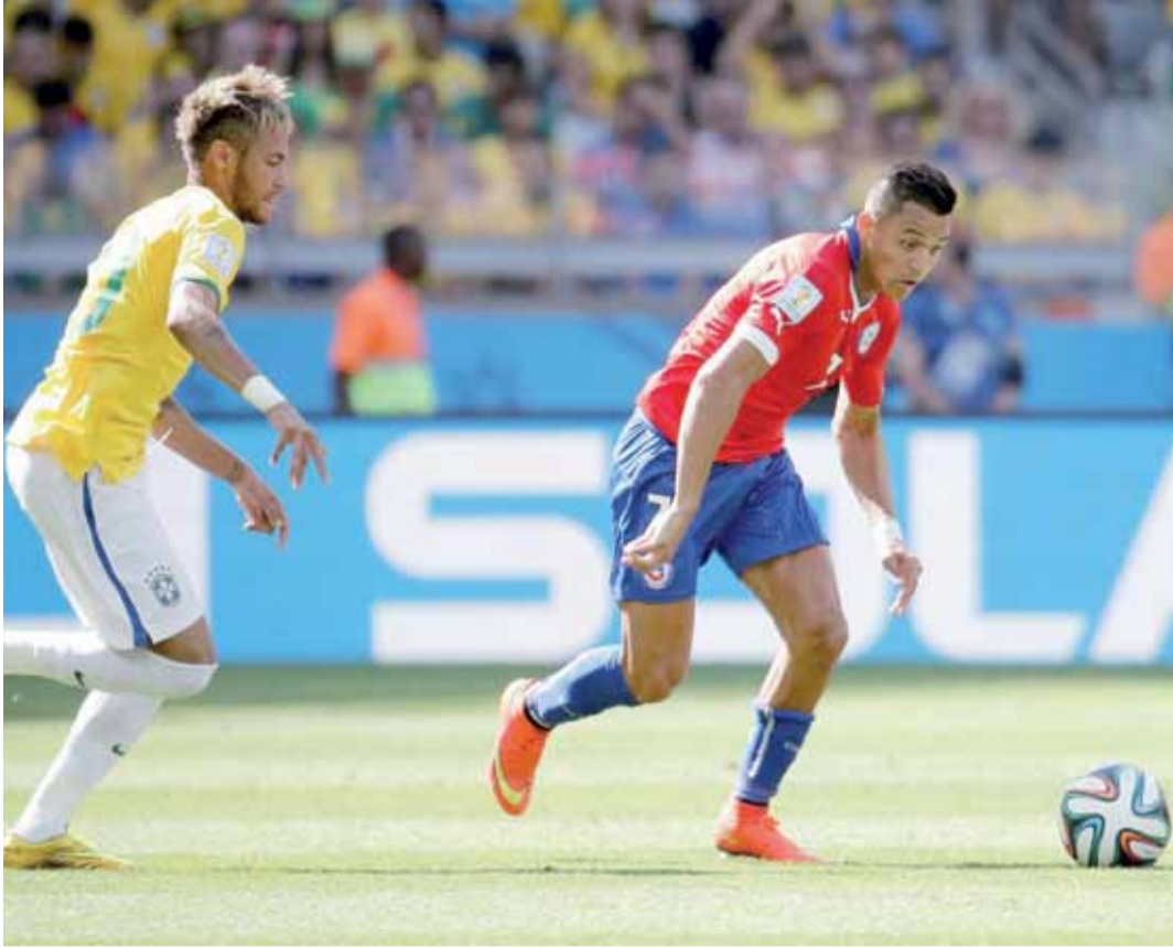
البرازيل اخرجت تشيلي واخرجتها من سباق المونديال