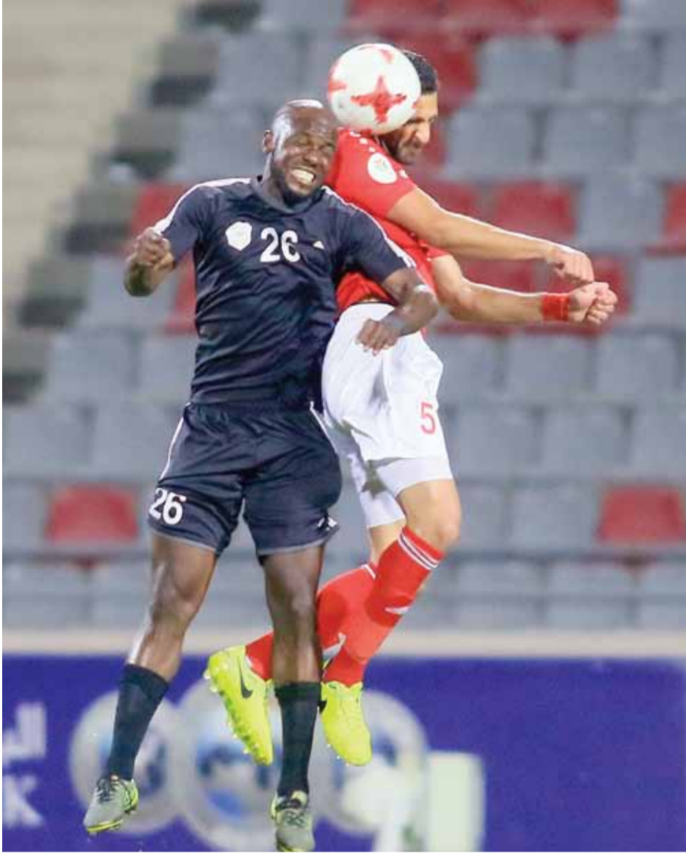
جانب من لقاء البقعة والجزيرة