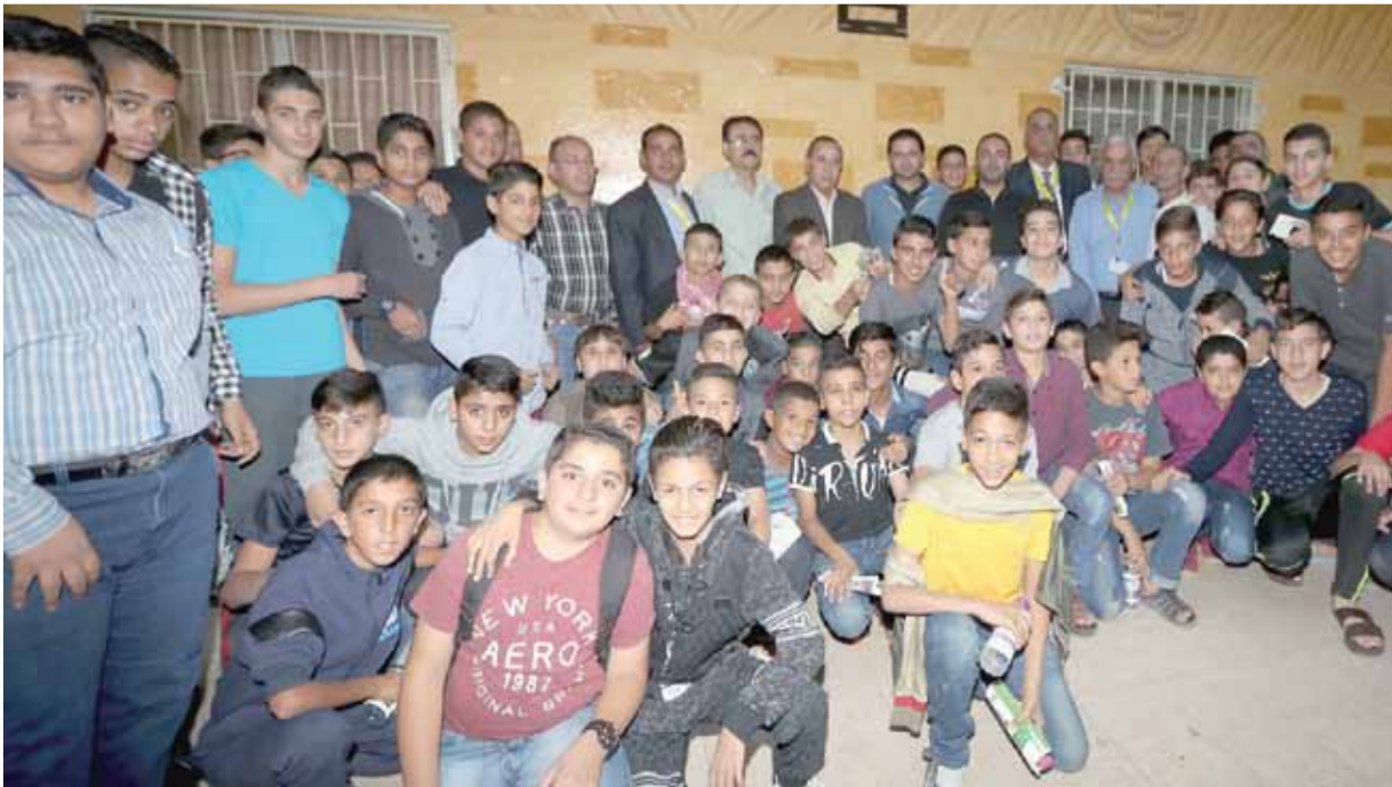
لقطة جامعة للحضور