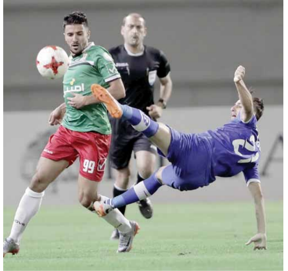
دفاعات الرمثا قيدت تحركات "الكوبرا" نحو مرمى الشطناوي