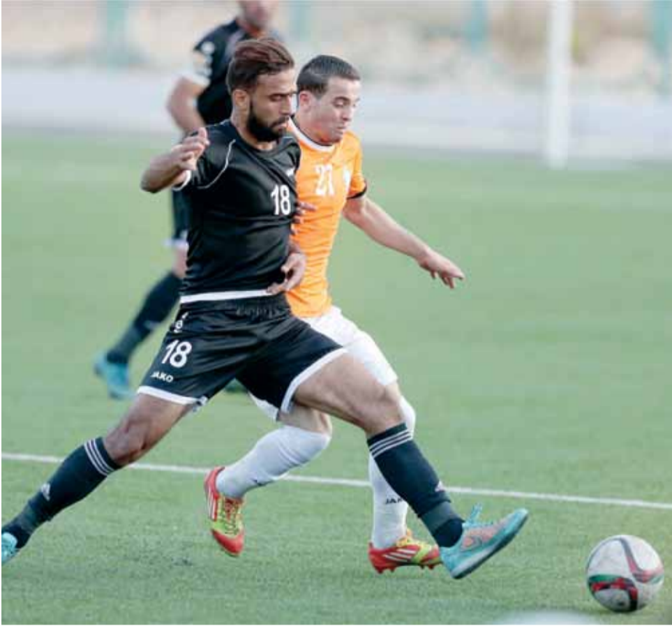
الوحدات خسر أمام الرمثا وينشد التعويض أمام البقعة