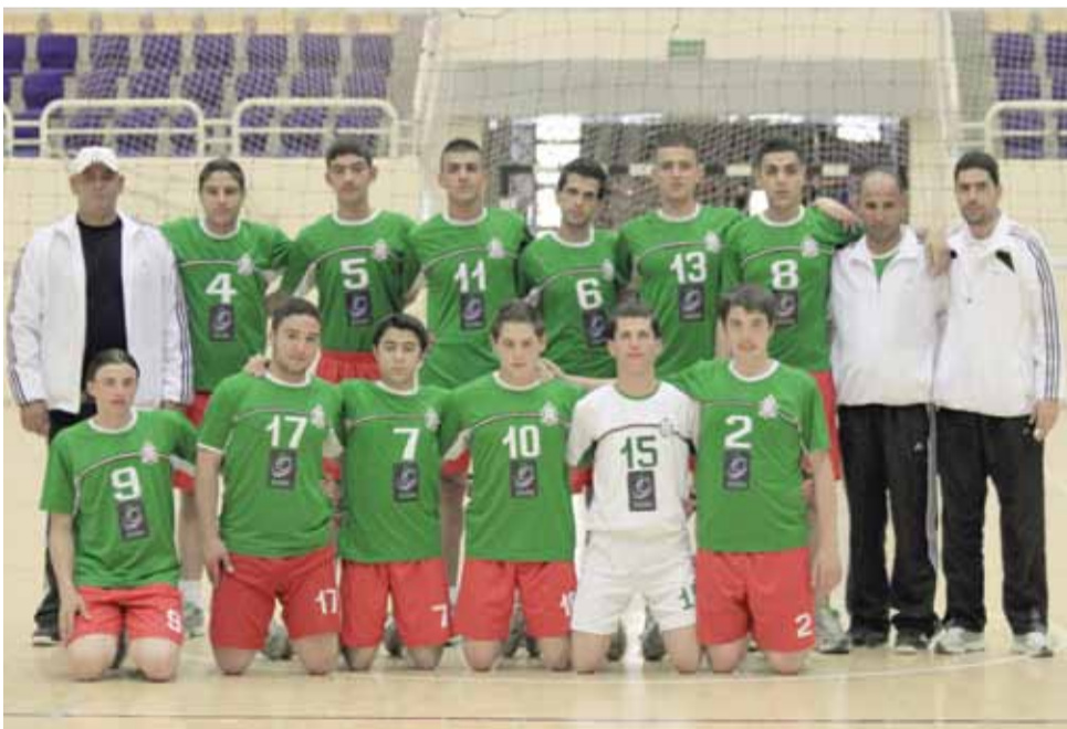
فريق الوحدات الناشئ بأخر ظهور له قبل 6 مواسم

الدوري مبيناً أنها لن تكون مفروشة بالورود خاصة وأن كافة الفرق المشاركة استعدت جيداً معرجاً على أن لكل مجتهد نصيب، ومؤكداً في ذات الوقت على ان الوحدات يبحث عن اقتناص اللقب والعودة إلى المكان الطبيعي بطلاً على منصات التتويج. ويخوض الوحدات لقاءه الثاني عصر الأربعاء المقبل أمام شقيقه الكرمل حينما يحل ضيفاً على صالة الأمير حسن في إربد عند الساعة الخامسة مساءً، فيما يختتم مشواره بدوري المجموعات بلقاء فريق بيت أيدس الثلاثاء عند الساعة السادسة على صالة الأمير فيصل.