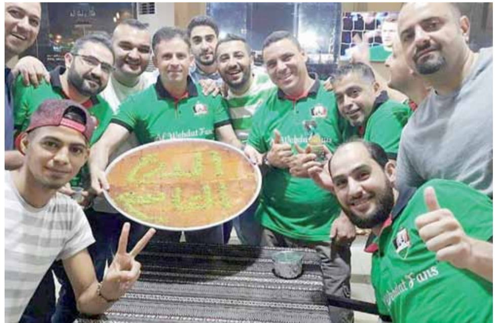
رابطة جماهير الوحدات تحتفي بالفوز بلقب الدرع