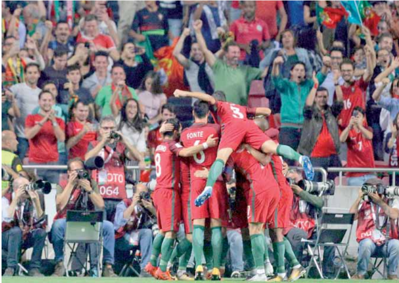
البرتغال... في الرمي الأخير الى روسيا

على صعيد المنتخبات الاوروبية المتأهلة مباشرة، فقد كانت المانيا قد خطفت البطاقة الاولى قبل مواجهات الجولة الأخيرة عن المجموعة الثالثة، وانجلترا عن المجموعة السادسة، واسبانيا عن السابعة وبلجيكا عن الثامنة، فيما حسمت مباريات الجولة مسألة فرنسا بفوزها على روسيا البيضاء 2-1 بهدفي جيزمان وجيرو، لتتصدر فرنسا ترتيب المجموعة برصيد 23 نقطة، فيما لم ينفذ هولندا الفوز على السويد 2-0، لتذهب السويد الى الملحق بفارق الاهداف عن هولندا. وفي المجموعة الثانية تمكن رفاق