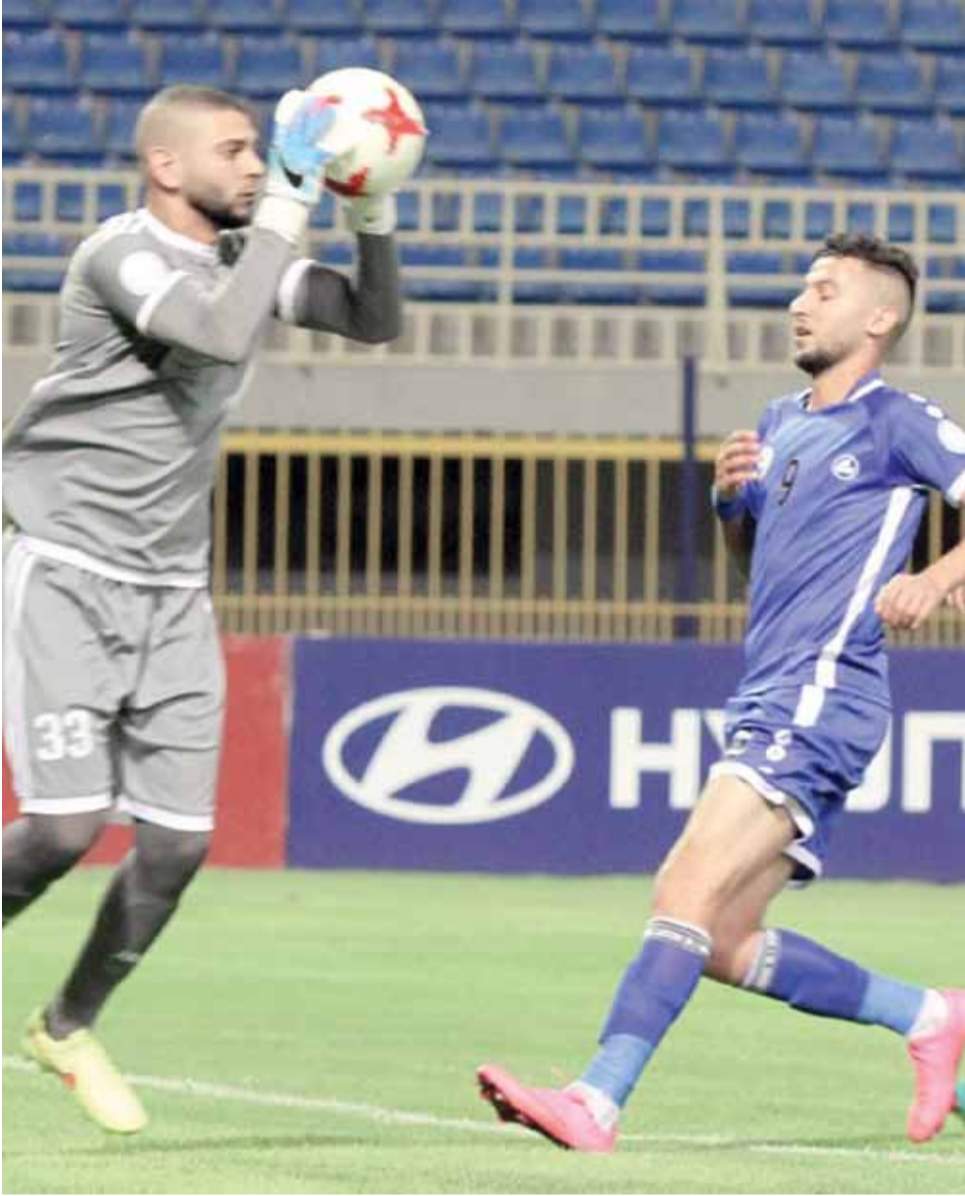
جانب من لقاء الرمثا والمنشية