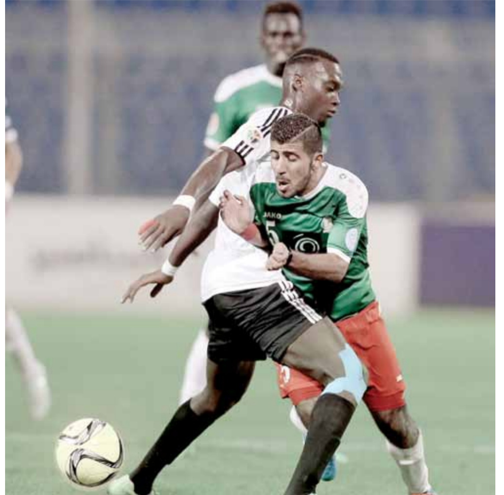
جانب من لقاء سابق بين الوحدات وشباب الأردن - (ارشيفية)