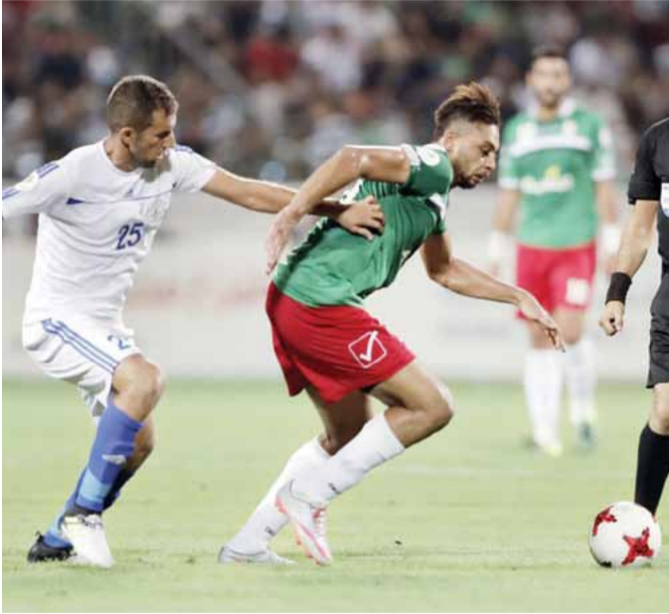
فريق الوحدات مطالب بتحسين الصورة في المباريات المقبلة

وكلنا حرص أن تكون سمعتنا ليس في الأردن بل العالم كله عطرة جدا. الجميع له حق الانتقاد بـ"أدب" دون إساءة، فكما ينتقد كاتب هذه السطور الكثير من الحالات الخاطئة في النادي ونشاط كرة القدم تحديدا، أيضا للجماهير أن تعبر عن رأيها بحرية دون أن تتعدى الخطوط الحمراء في الاعتداء على مدرب أو لاعب أو شتمهما.