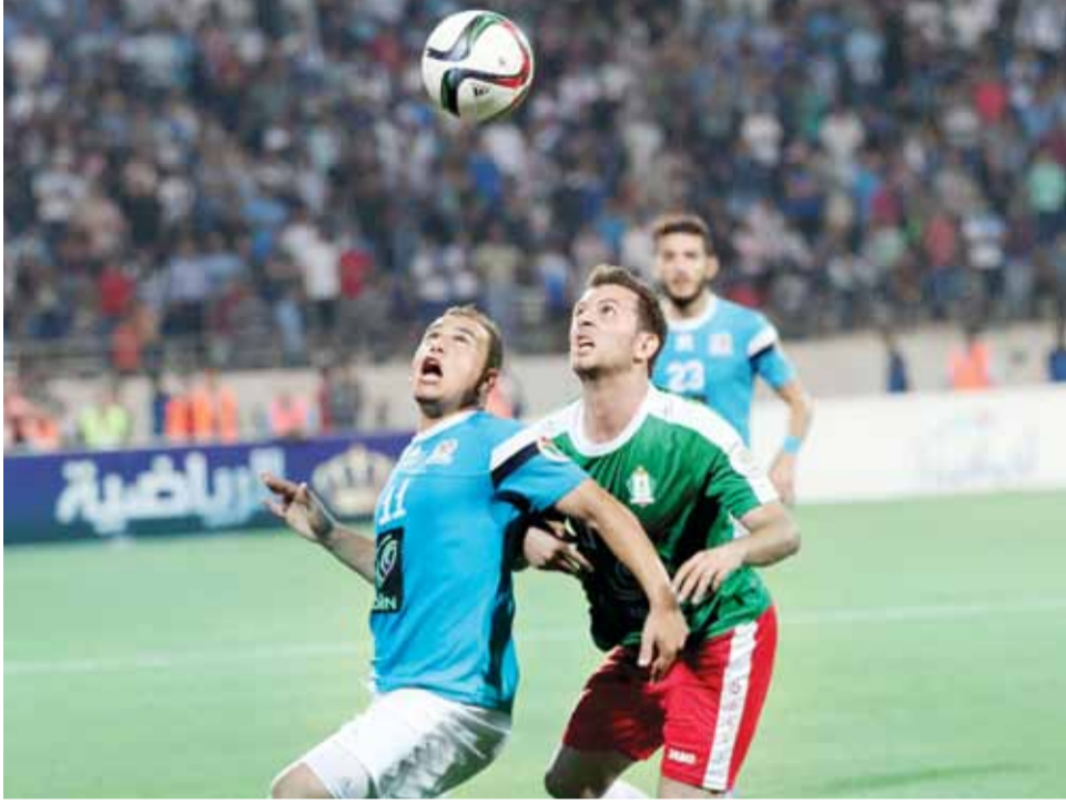
جانب من لقاء سابق بين الوحدات والفيصلي

للانجازات التي حققها الفريق خلال مشاركته في مختلف بطولات اتحاد اللعبة خلال الفترة الماضية، الى جانب تكليف لجنة العلاقات العامة بالنادي لتوزيع بوسترات على جماهير الوحدات بهدف تحفيزهم وتوجيههم الى التشجيع المثالي في الملاعب الكروية.