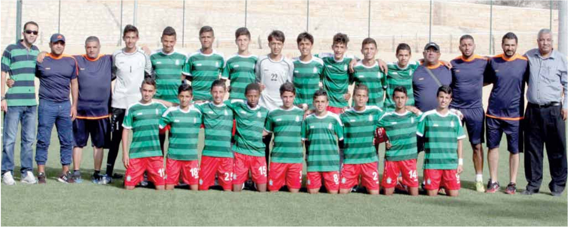
فريق سن 14 جاهز لبدء مشواره في بطولة الدوري

مدير دائرة المسابقات في اتحاد الكرة يوضح أسباب التأخير