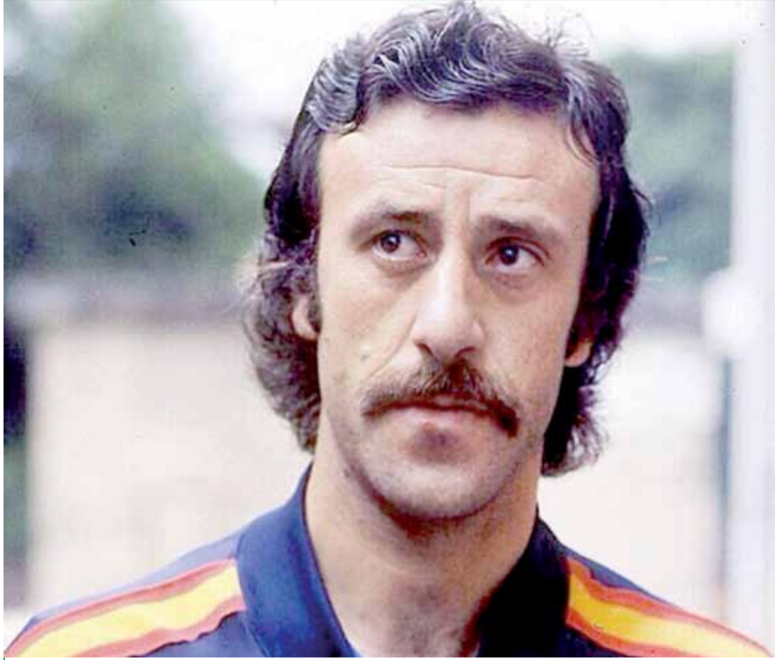
مدرب المنتخب الإسباني "فيسنتي ديل بوسكي" عندما كان لاعباً للمنتخب الإسباني في عام 1975

أحد المحللين عبر موقع التواصل الاجتماعي علق بعد المؤتمر الصحفي للمدير الفني الإماراتي للمنتخب الوطني عبد الله المسفر بأن المنتخب الوطني الأول يعاني من حالة فوبيا يزرعها المسفر في أنفس اللاعبين والجماهير بهدف إقناعهم بأن الوصول إلى نهائيات أم آسيا لن يكون سهلاً