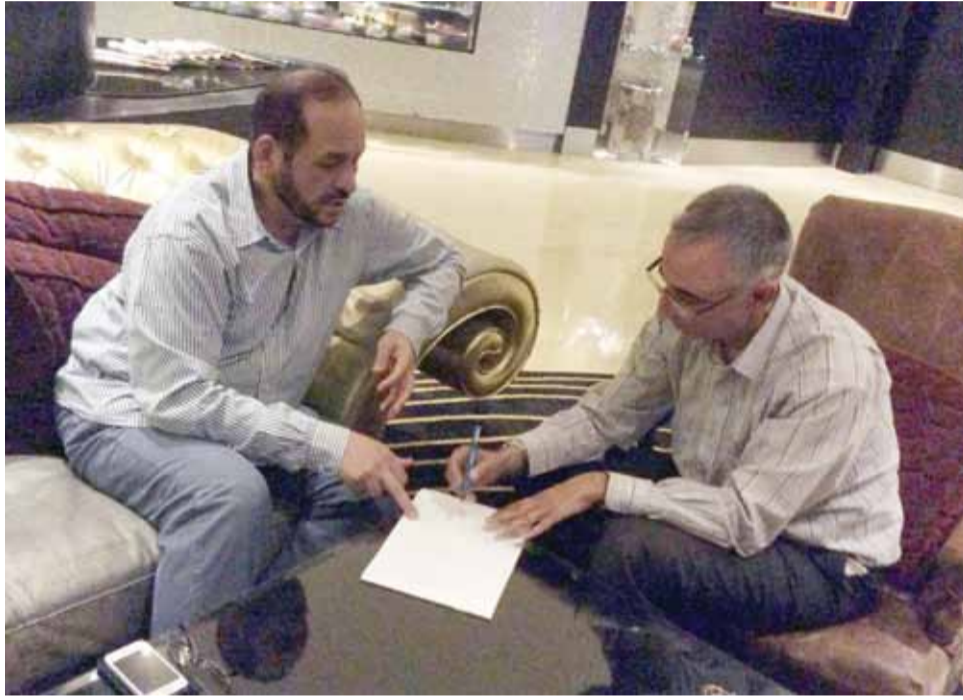
الشيخ فيصل القاسمي يتحدث لمندوب الوحدات الرياضي

واكد الشيخ القاسمي الى ان الاتحاد سيعمل على تنظيم بطولة الاندية العربية للمضمار،