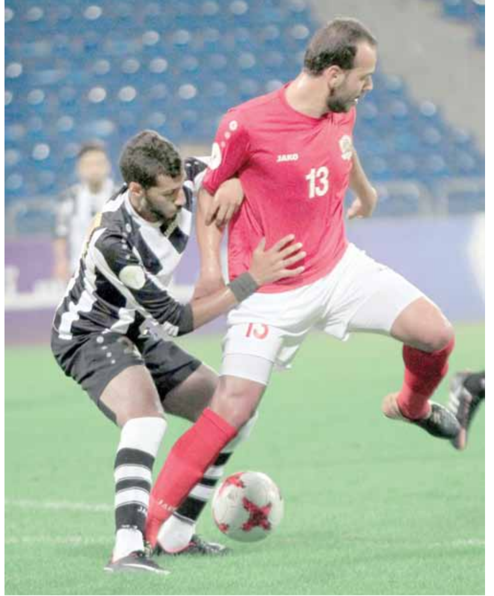
جانب من لقاء الجزيرة وشباب الأردن