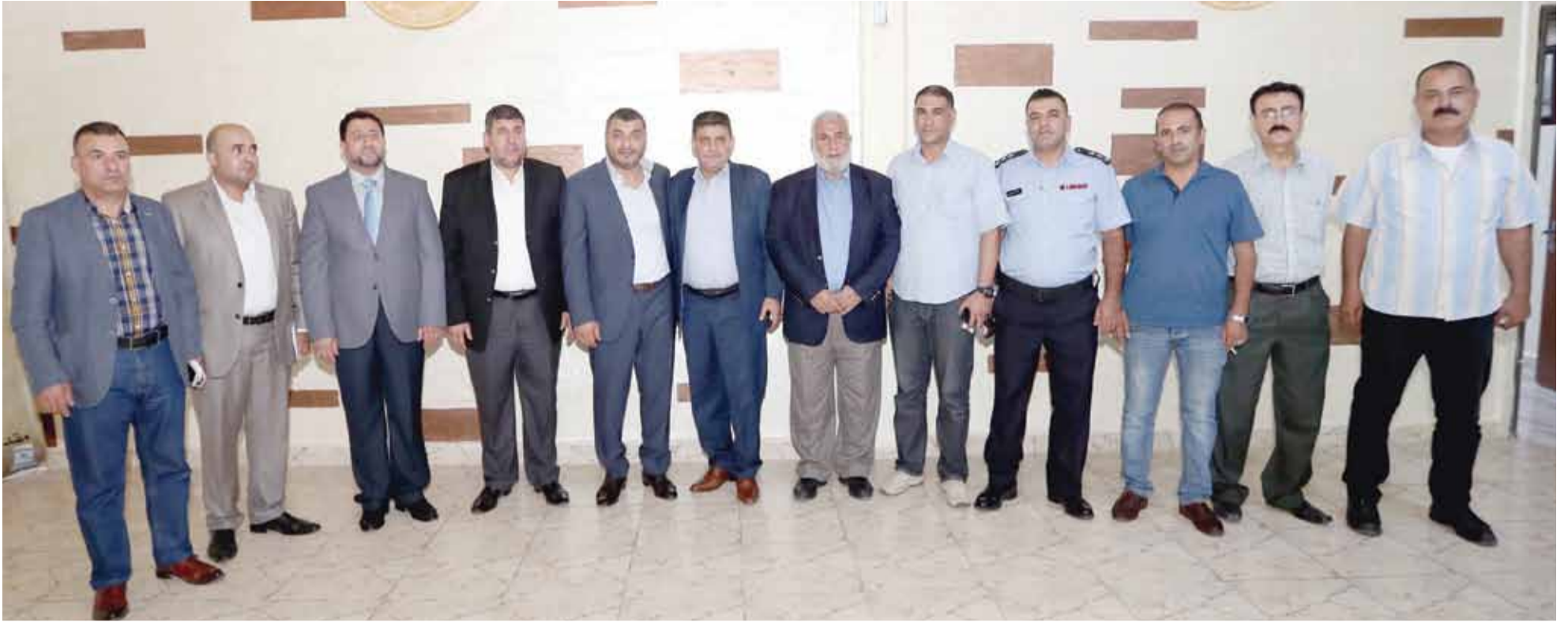
لقطة جامعة اللجنة فلسطين النيابية وإدارة نادي الوحدات