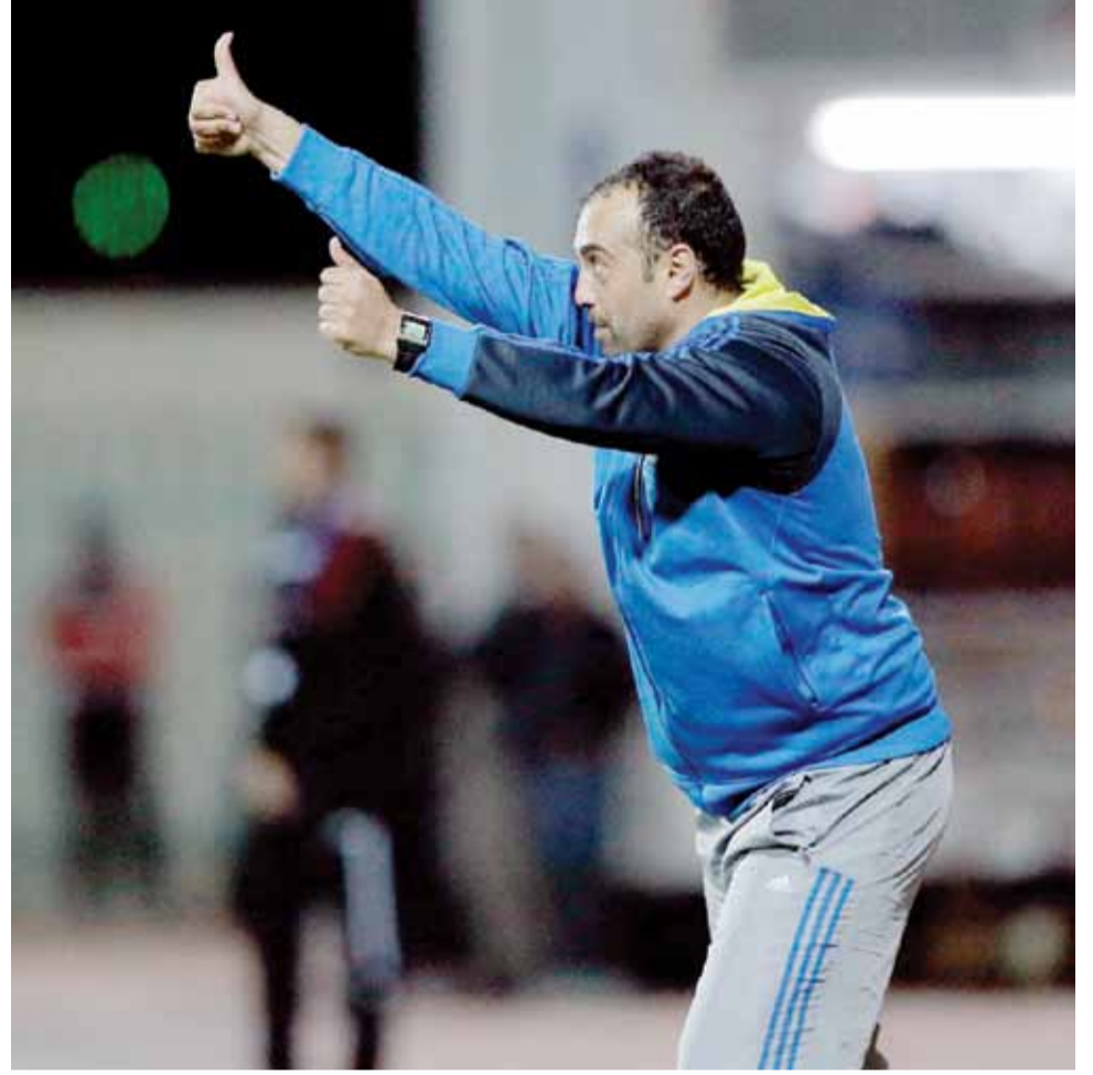
المدير الفني لفريق ذات راس هيثم الشبول