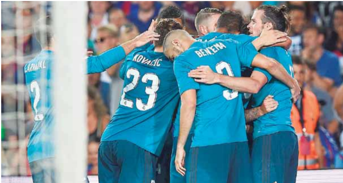
فرحة لاعبي ريال مدريد بتسجيل احد الاهداف خلال ذهاب السوبر الاسباني

مباريات الدوري الالمانى تنطلق في الساعة السابعة والنصف بلقاء بطل الدوري فريق بايرن ميونخ مع باير ليفركوزن، ويوم السبت يلتقي هامبورغ مع اوجسبورغ، هيرتا برلين مع شوتجارت، فولفسبورغ مع بروسيا دورتموند، ماينز ٠٥ مع هانوفر ٩٦، هوفنهايم مع فيردر بريمن وشالكة مع لايبزيغ، ويوم الاحد يلتقي فرايبورج مع اينتراخب فرانكفورت وبروسيا مونشنغلاذباخ مع كولن.