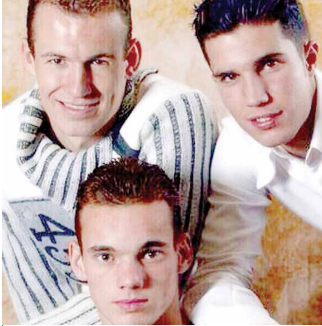
فان بيرسي وروبين وشنايدر في صورة ارشيفية تعود تاريخها لعام ٢٠٠٤

صفحات مواقع التواصل الاجتماعي (facebook) ما تزال تضح باخبار حول تعاقدات الوحدات مع المحترفين وهو الأمر الذي جعل اسم الوحدات من أكثر الأسماء المتداولة في الوقت الذي ينتهج البعض أسلوب غير اخلاقي بمحاولة التسلق والوصول إلى الجماهيرية من خلال نادي الوحدات، وبث إشاعات مغرضة بحق النادي. وفي ذات السياق عبرت جماهير الوحدات عن رفضهم التام لأي معلومة يتداولها البعض حول اعتراض جماهير الوحدات على أي حكم محلي مؤكدين بأن فريقهم قادر على تحقيق المطلوب منه بجهود لاعبيه فقط معبرين عن ثقتهم الكبيرة بلاعبي الأخضر. أحد المحللين عبر موقع التواصل الاجتماعي يرى بأن مسألة التحكيم هذا الموسم ستكون بمثابة العائق الكبير على فرق دوري المناصير للمحترفين وذلك في ظل الإخفاق الذي شهدناه جميعاً في مباراة كأس الكؤوس والتي جمعت فريقي الجزيرة والفيصلي.