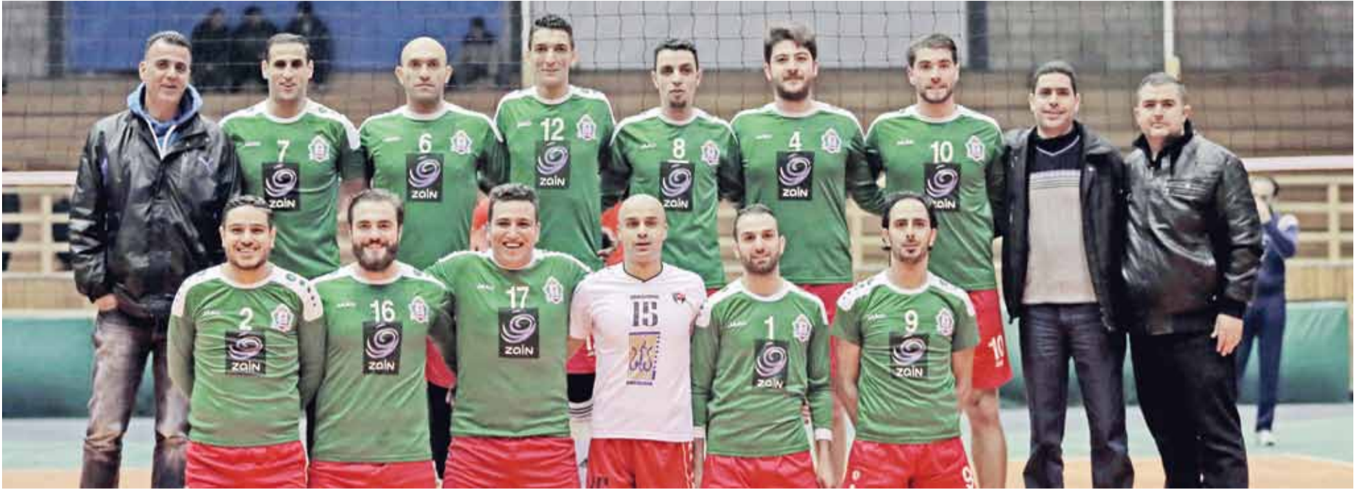
فريق الوحدات لكرة الطائرة يبدأ تدريباته خلال الشهر الحالي