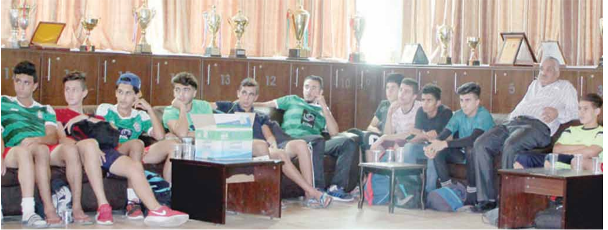
جانب من المحاضرة