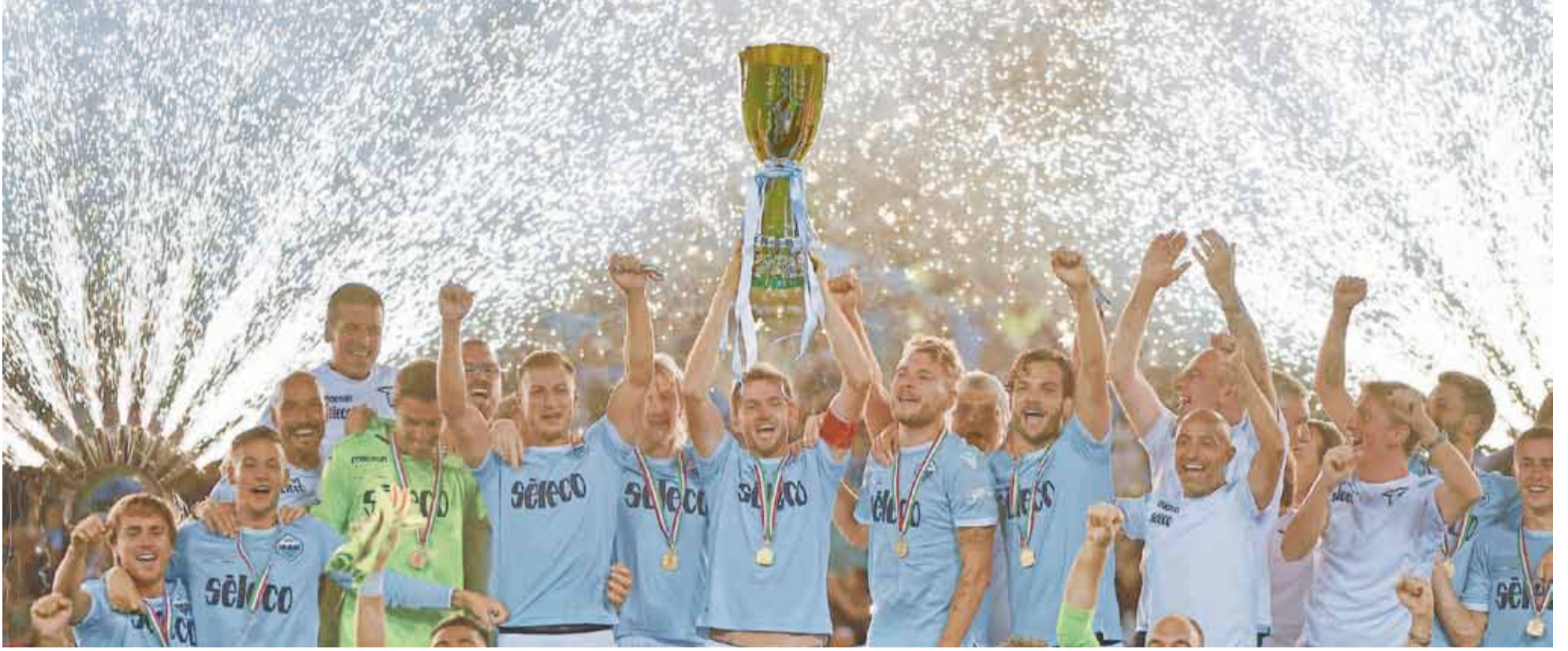
لاتسيو يخطف كأس السوبر الايطالي