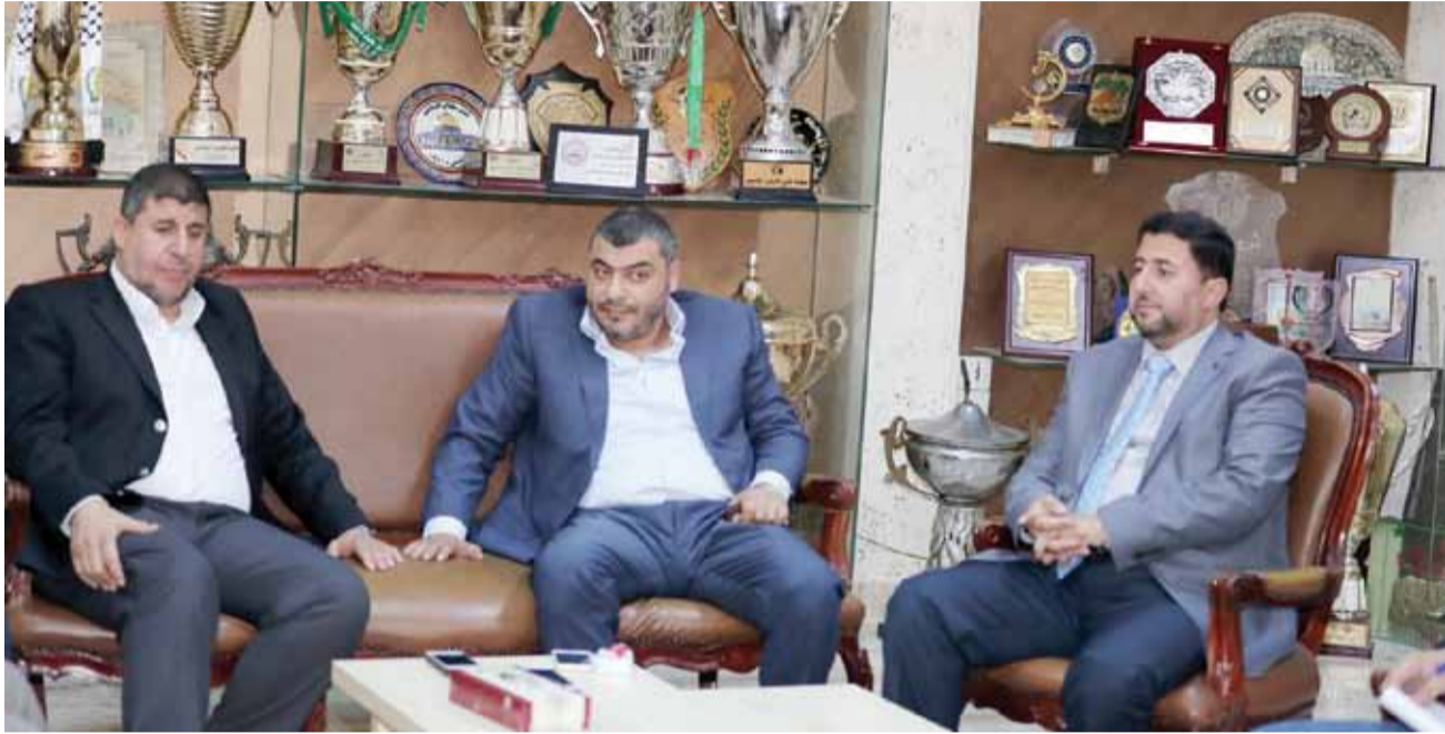
لجنة فلسطين النيابية في ضيافة نادي الوحدات

وأضاف: "نثمن للجنة الكريمة بزيارة لجنة فلسطين لمجلس النواب، والتي نثرت بسمات الفرح في اروقة النادي، من خلال تواجد اعضاء من المجلس التشريعي في "القلعة الخضراء"، والتي تعكس اهمية الوحدات كمؤسسة وطنية هادفة تعزز