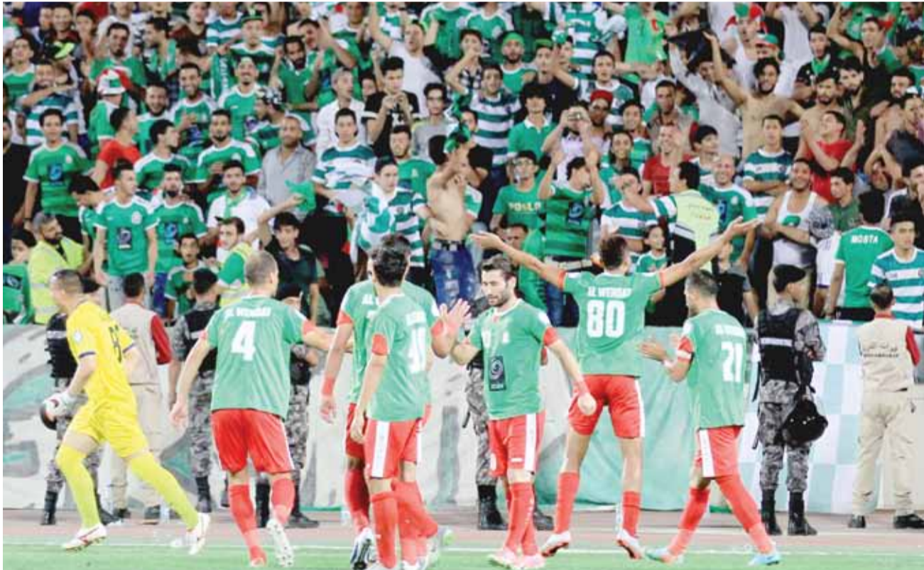
لاعبو الوحدات يحتفلون مع الجماهير مع نهاية المباراة

سيلفي وجدت في هذه اللقطة رسالة، تعبر عن سعادة الجماهير بهذا الانتصار الكبير، والأهم عودة الروح للفريق، وعودة الوهج الأخضر ليرعب المنافسين، وعودة الأداء الوحداني الذي يسحر ويغرب، وعودة الجمل التكتيكية والأهداف الجميلة، ووجدت الرغبة الاكيدة لدى اللاعبين بالانطلاق بقوة من المباراة الأولى، وصياغة رسالة تحذيرية للمنافسين بأن الوحدات قادم بقوة... احذروه.