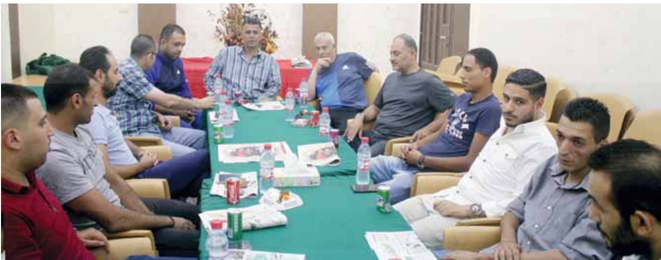
جانبا من الاجتماع

على سماع كافة متطلبات اللاعبين وتدوينها على كراسته لغاية دراستها وعرضها على مجلس الإدارة في أقرب فرصة بهدف إكمال المشوار والمضي قدماً نحو عودة الفريق إلى سابق عهده كما كان بطلاً بلامنازع. وغلف الاجتماع حماس كبير وواضح ظهرت على محيا اللاعبين والذين تعاهدوا على أن يكملوا المشوار بنفس الروح الأسرية التي يتمتعون بها والتأكيد على ضرورة العمل بشكل جاد لحصد لقب بطولة الدوري العام والذي من المزمع أن يقام في أول شهر أكتوبر المقبل.