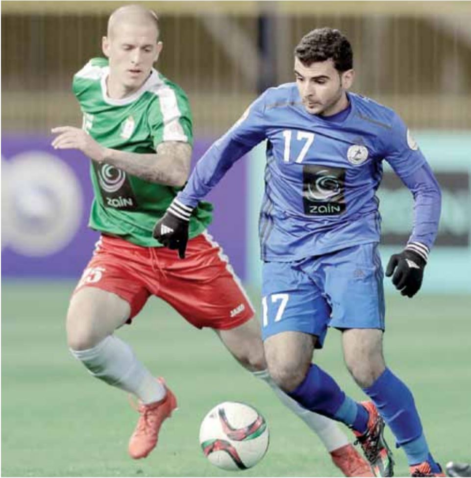
"الأخضر" يتحضر للقبض على "غزلان الشمال"