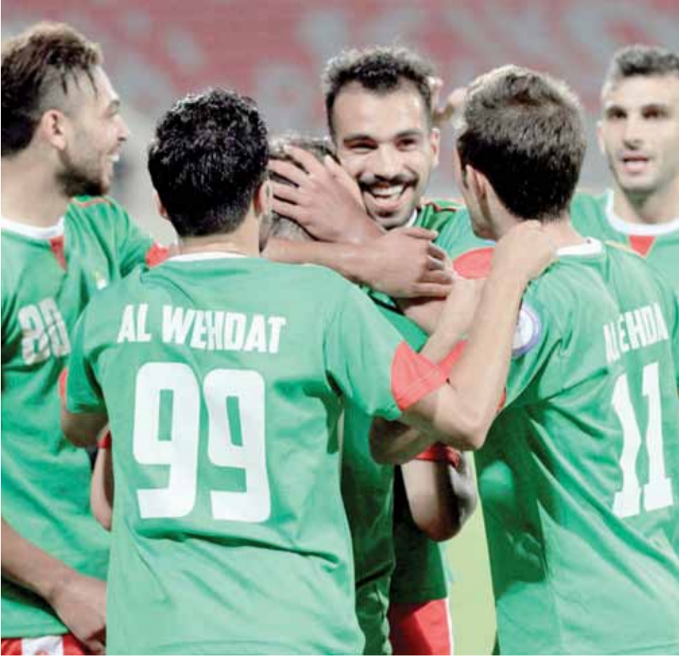
فرحة لاعبي الوحدات بالهدف الأول