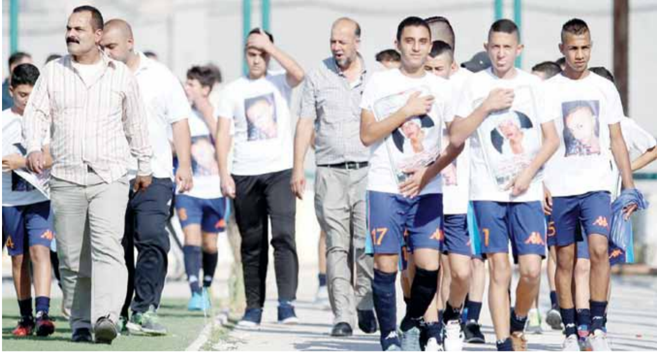
جانب من افتتاح البطولة السابقة

وأردف صوان قائلاً: " وافق المجلس على توقيع بروتوكول بين الاكاديمية الكروية للنادي مع الاكاديمية الدولية للموهوبين الفلسطينيين، كما قرر المجلس الموافقة على البدء بالتحضيرات اللازمة لانتخاب المكتب التنفيذي لرابطة قدامى لاعبي النادي وتكليف اللجنة المشكلة بهذا الخصوص باجراء اللازم".