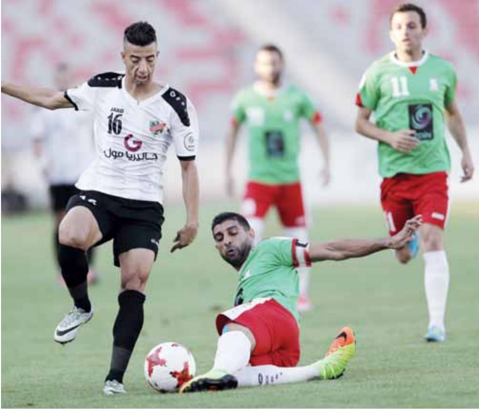
حوار كروي لاستخلاص الكرة بين لاعبي الوحدات والأهلي - (تصوير: أحمد الأمين)