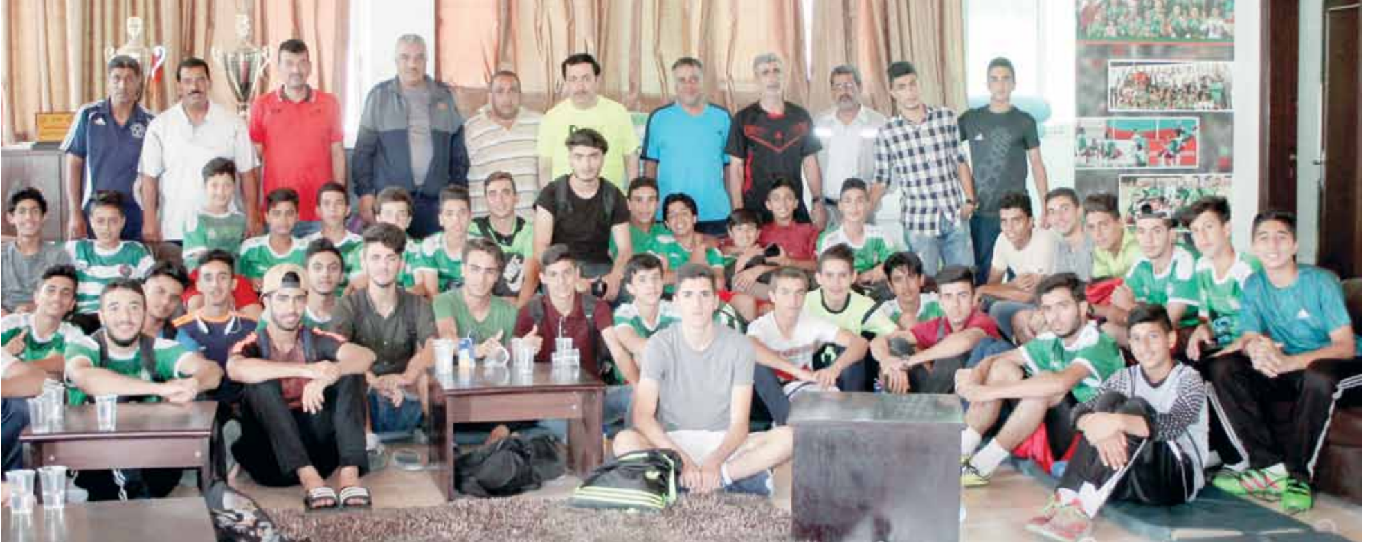
صورة جماعية لفريقي تحت 14 و16 سنة