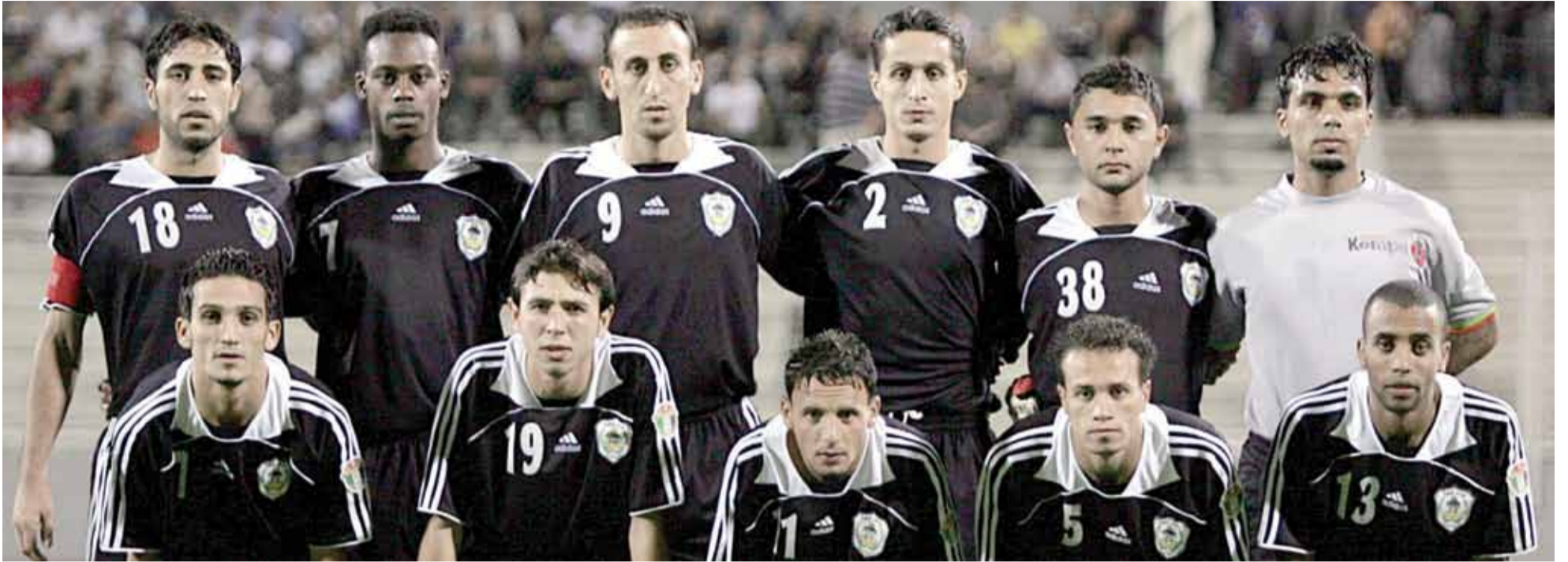
الجيل الذهبي لفريق البقعة يتساءل متى يعود بالحصان الأسود إلى مكانه الطبيعي