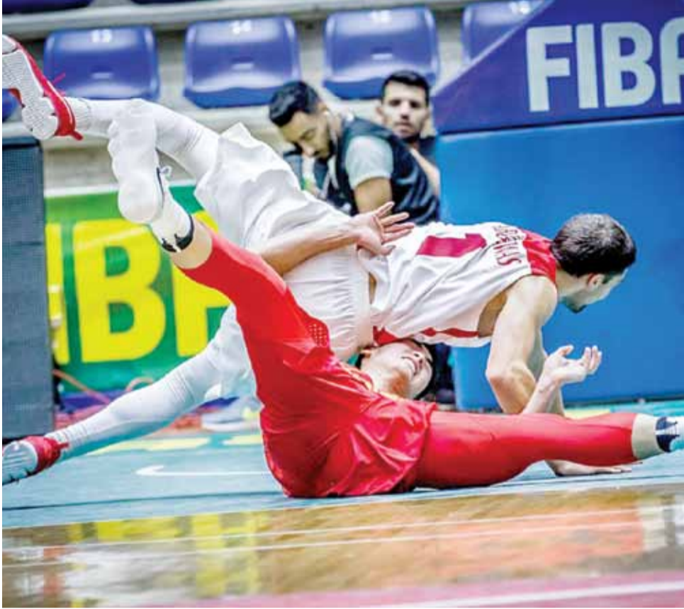
واقع الخسارة والمركز المتأخر باديا على لاعبي المنتخب