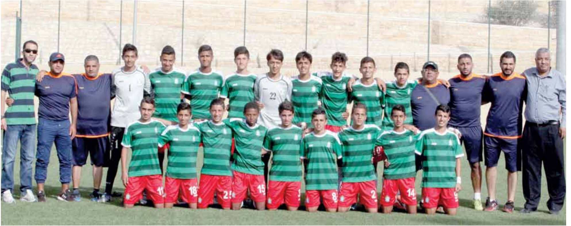
لقطة لفريق سن 14 الموسم الماضي