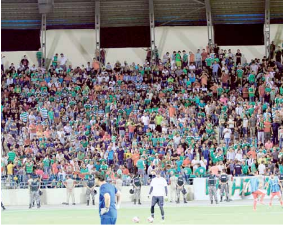
جماهير الوحدات .. أنتم الداعم الأول لفريق الكرة

هناك من يتربص بالنادي فعلا فلا تسلموه صيدا سهل لمن ينتظر أن "غلطة" منكم. أعتقد أن السواد الأعظم من جماهير الوحدات يمتلك أخلاق الفرسان، ولا يمكن لأي كان استغزاه لكان هناك قلة مندفعة لا تلقي بالا للأفعال التي تقوم بها على المدرجات، وهذا ما يدفعنا إلى الطلب منهم أن يتقوا الله فقط في ناديهم ولا يحملوه أكثر مما يحتمل.