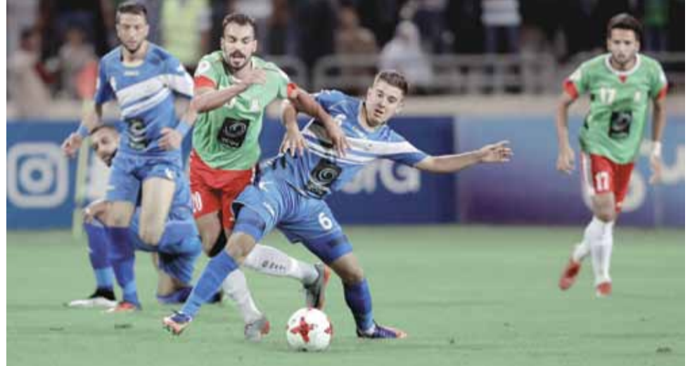
مواجهة الوحدات والرمثا تتكرر بذات البطولة الشهر المقبل