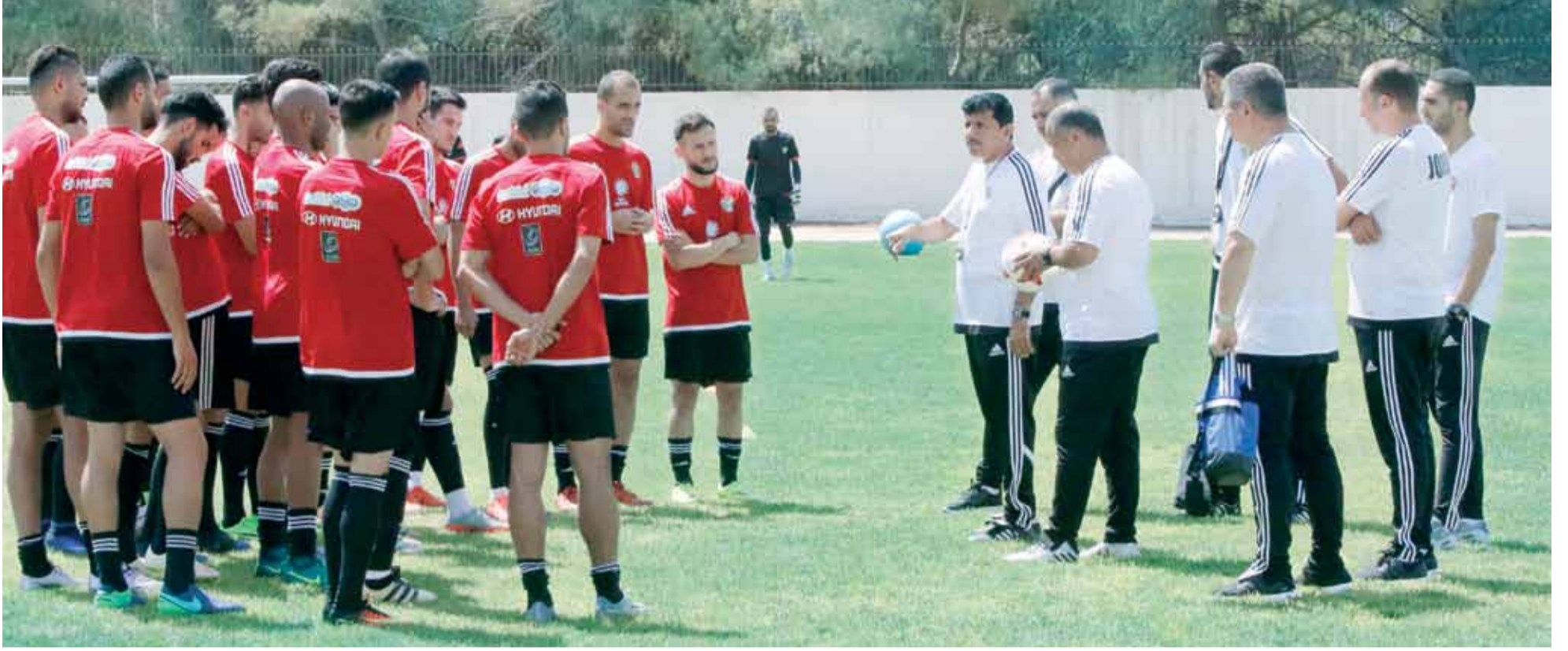
جانب من تدريبات المنتخب قبل اللقاء الودي أمام البحرين