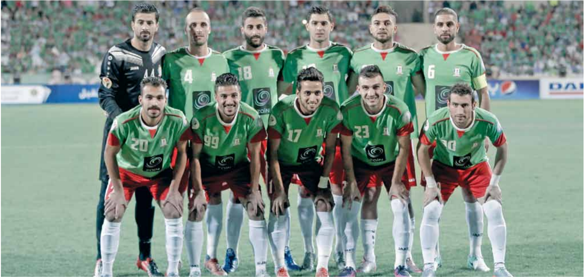
فريق الوحدات لكرة القدم