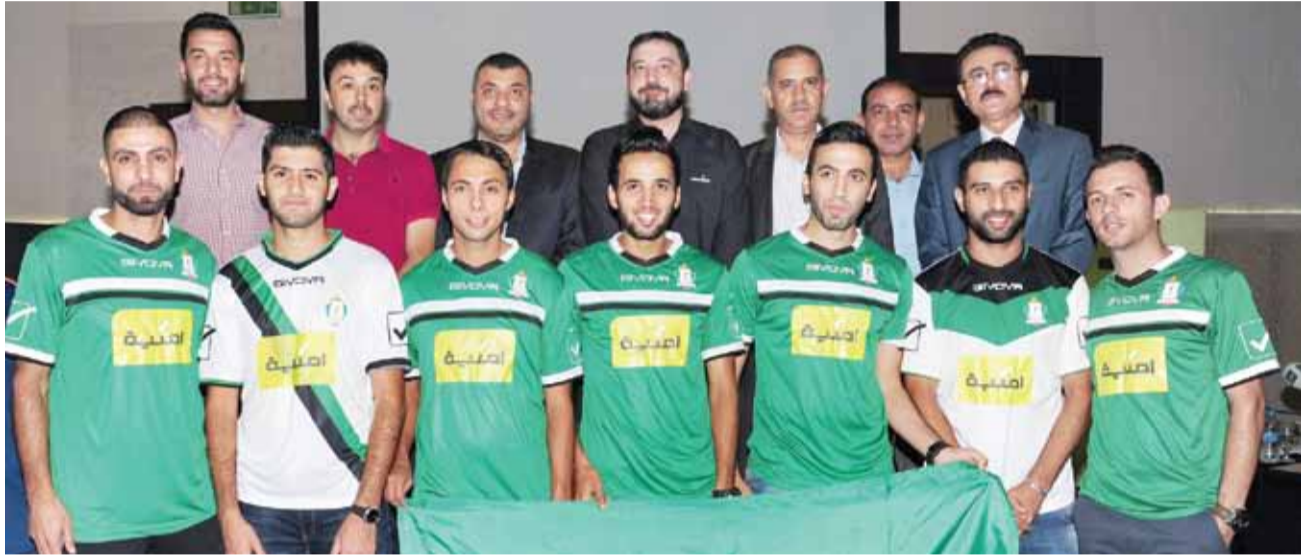
جانب من حفل توقيع الاتفاقية

عوائد البيع بشكل شهري الى النادي، "الجماهير فرس الرهان"، هذه الكلمات كانت رسالة تسويقية موجهة من الصقور الى جماهير نادي الوحدات وجميع محبي النادي، عندما أكد أن نجاح فكرة "خط الوحدات" وبيعه بشكل كبير يفوق التوقعات، من شأنه أن يزج الجماهير في رحلة الدعم غير المباشر لناديها من جانب، وسيوفر الدعم المالي الكبير والذي تأمل أن يتجاوز حدود التوقعات بما يلبي عراقية وتاريخ نادي الوحدات وانجازاته ويتناسب مع جماهيرية "المارد الأخضر" على أرض الواقع الوحداتي.