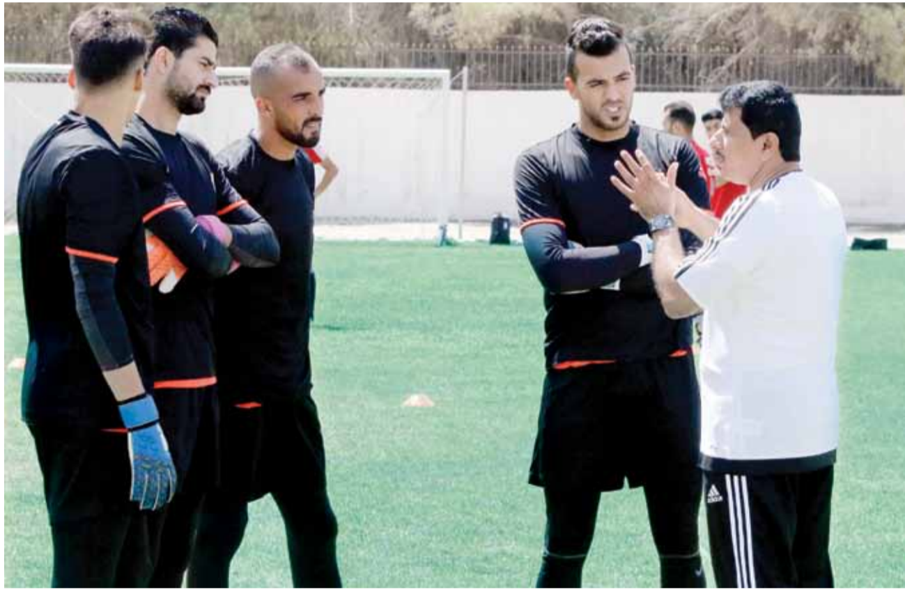
المدير الفني للمنتخب يتحدث الى حراس المرمى

يذكر ان المنتخب الوطني يتصدر مجموعته الثالثة من التصفيات الآسيوية برصيد (٤) نقاط، مقابل (٣) لكامبوديا، ثم فيتنام (٢)، واخيراً افغانستان بنقطة وحيدة