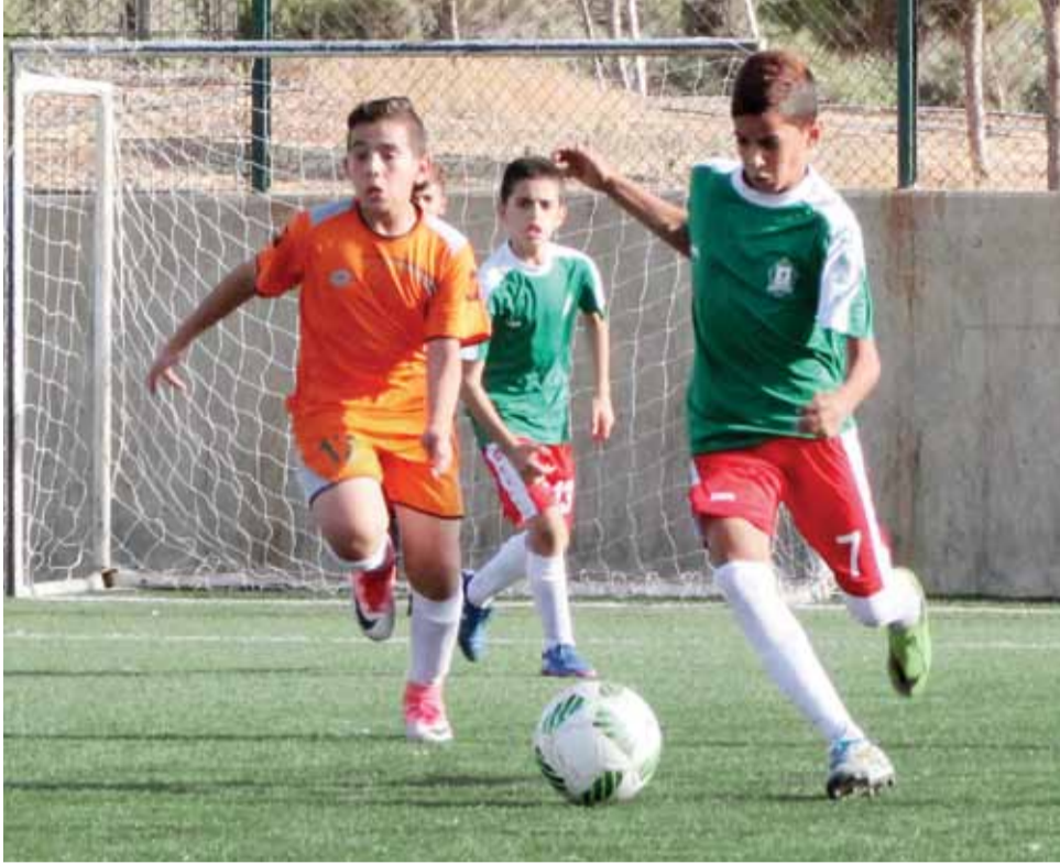
جانب من المباراة النهائية لبطولة الشهيد محمد ابو خضير