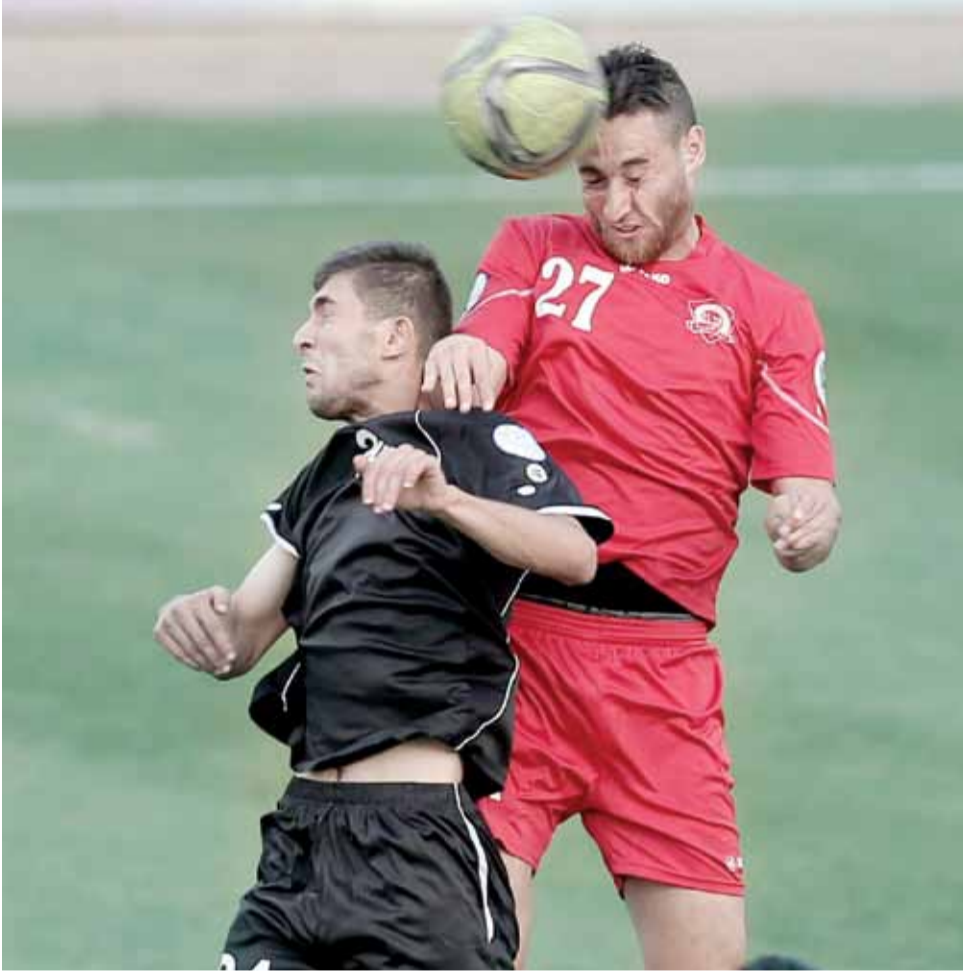
صراع على الكرة في حوار سابق بين الجزيرة والبقعة