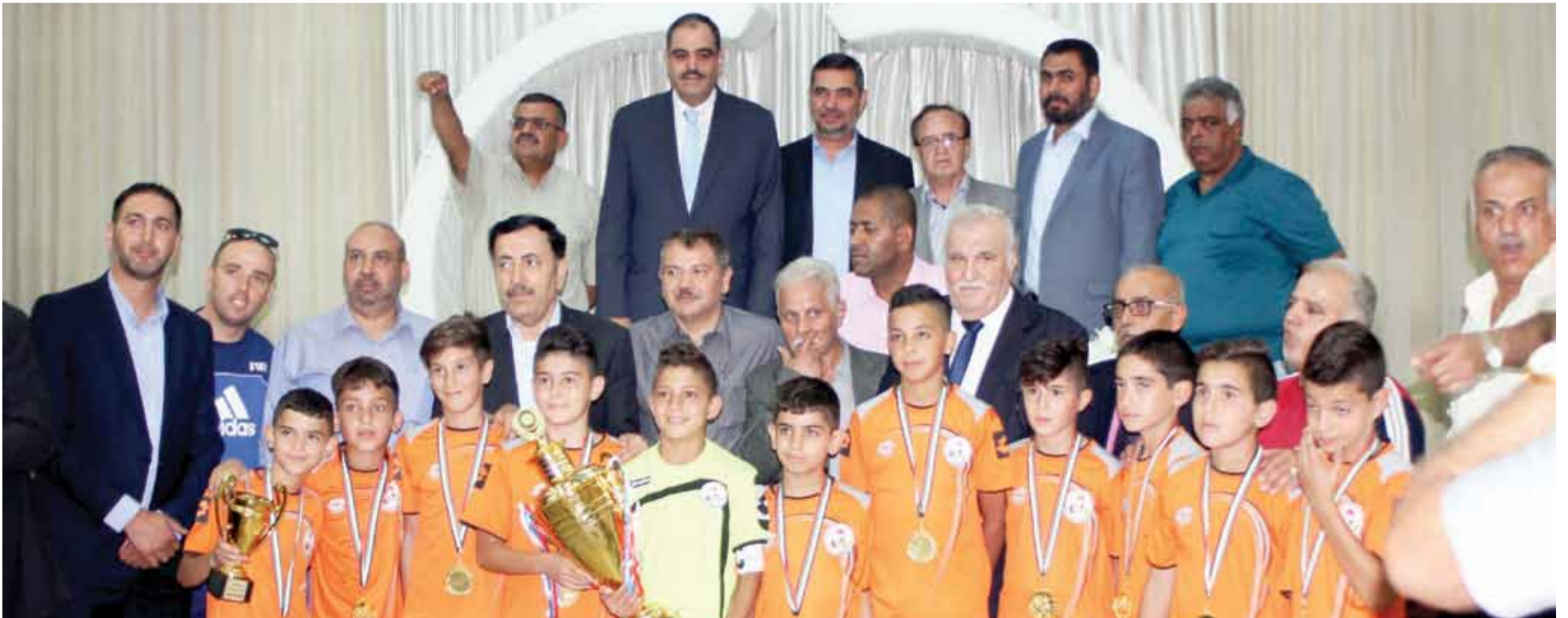
جانب من تتويج اكااديمية القدس للموهوبين في ديوان اهالي رابطة كفرعانة

في فلسطين بشكل عام والاكاديميات بشكل خاص في ميدان كرة القدم، ونستمر في رفدها وصقلها ومتابعتها، فضلا عن استمراريته بالأندية والمنتخبات الفلسطينية لمختلف الفئات، ونمضي بهم الى المشاركات الخارجية التي نطمح من خلالها لتقديم أفضل المستويات وعكس الصورة المشرفة عن الكرة والرياضة الفلسطينية في كل مكان رغم الصعوبات وتعنت الاجراءات التي تفرض علينا من قبل سلطات الاحتلال الصهيوني، ونبحث عن كسب الخبرات من خلال المشاركات المحلية والاوربية هو الساند الاساسي لمواصلت التطوير للمواهب الكروية في فلسطين والتي تحمل في كشوفاتها الكثير النجوم المقدرين بالذهب".