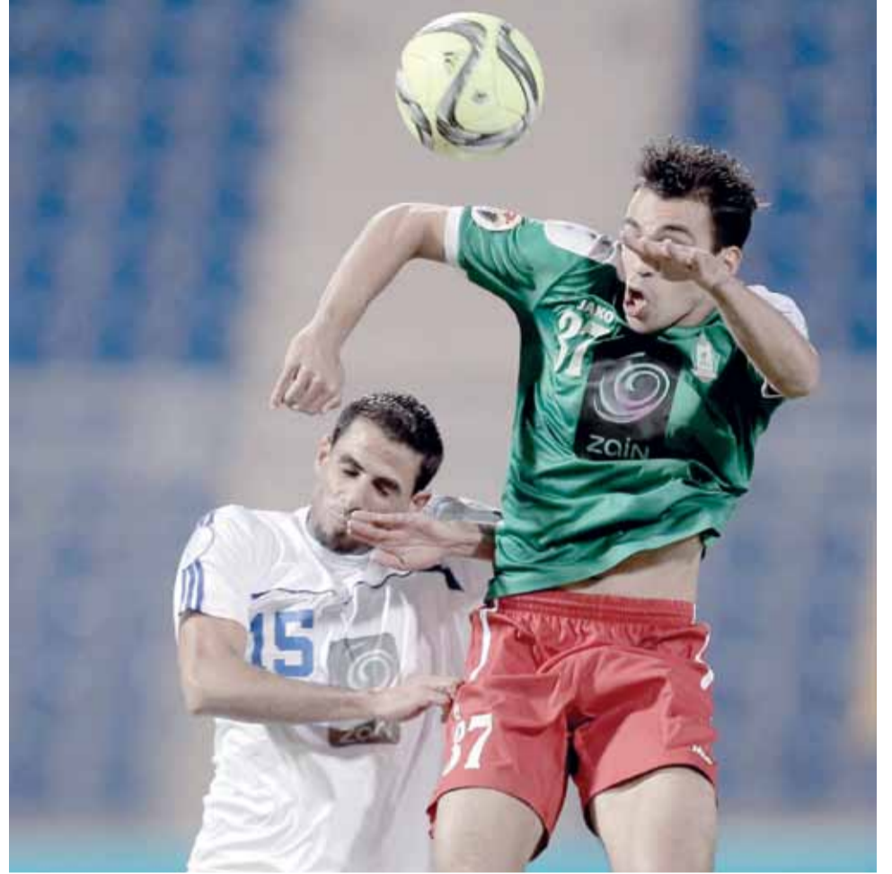
جانب من لقاء الوحدات وأذات راس في لقاء سابق