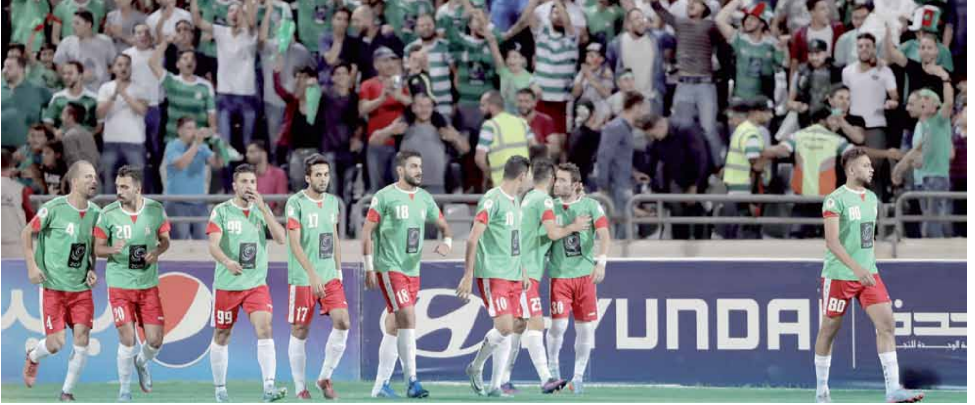
فرحة نجوم الوحدات أمام الرمثا تكررت 3 مرات