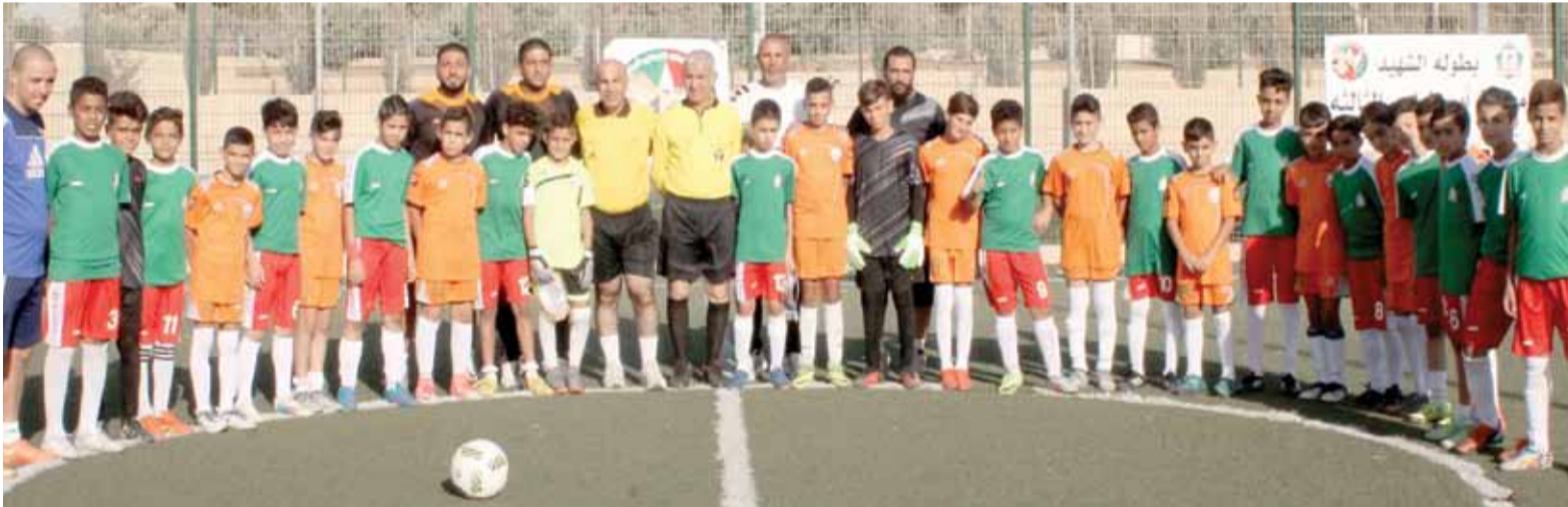
لقطة جامعة لأكاديمية الوحدات وأكاديمية القدس للموهوبين قبل بداية نهائي البطولة

أكاديمية القدس للموهوبين كرويا اياها قدسي عمق العلاقات التي تربط الأهل شرقي وغربي النهر عامة، ونادي الوحدات والنادية الفلسطينية خاصة، مشيرا الى منانة تلك الروابط على جميع الأصعدة، شاكرًا الوحدات على حسن الاستقبال وكرم الضيافة وحفاوتها والذي يعجز الكلام عن وصفه - على حد تعبيره -.