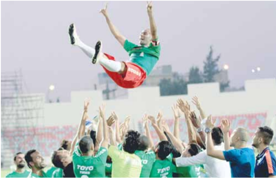
نجوم الوحدات ولفتة جميلة مع قائدهم المعتزل

مندوبي النادي الفيصلي، كلمات قالها ذيب قبل أن يغادر الملعب إلى المنصة حيث تلقى العديد من الدروع التقديرية من الحضور.