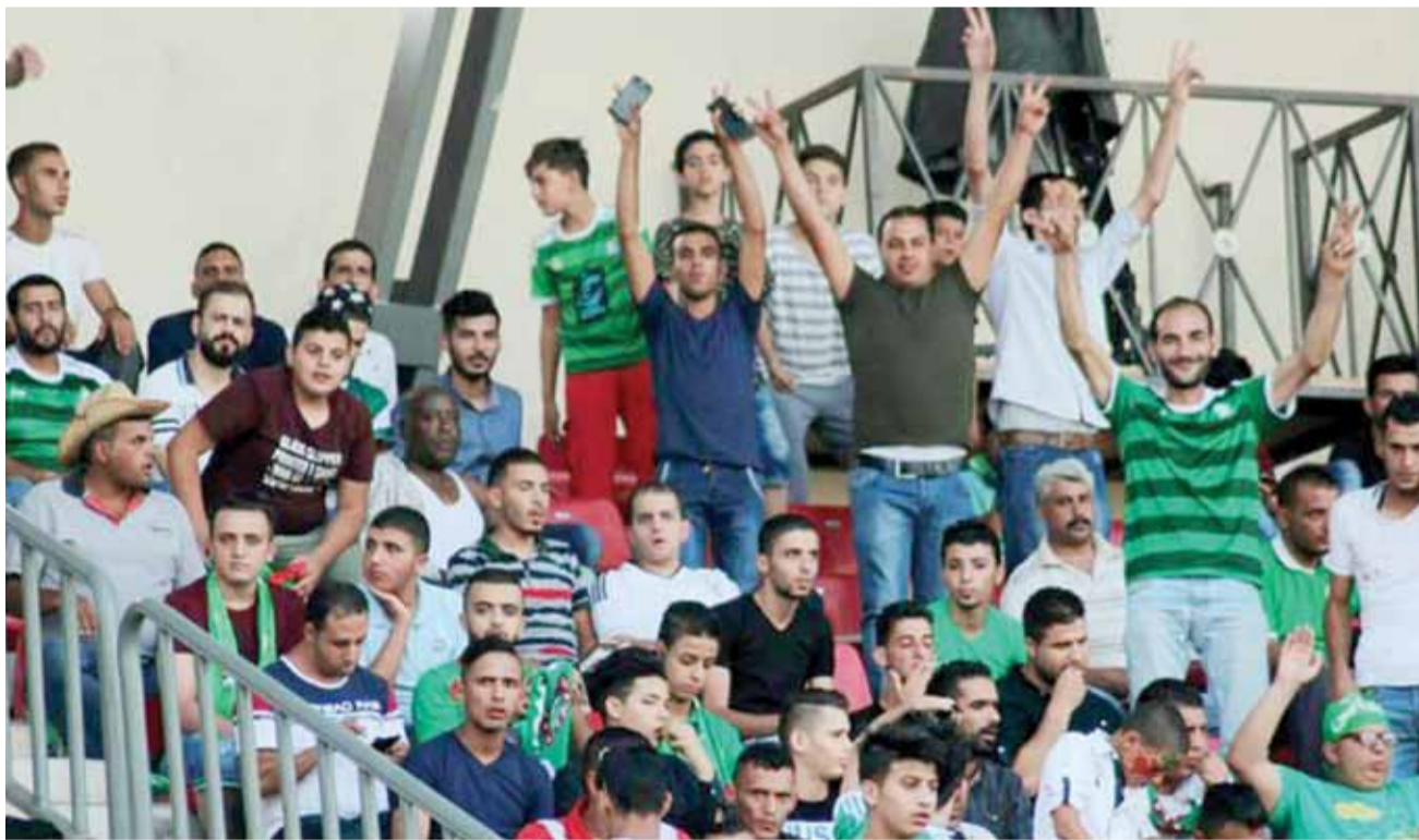
الحضور الجماهيري الكبير ساعد فريق الكرة على تقديم الأداء الأمتع

أتمنى أن تكون فترة التوقف الحالية إيجابية وليست سلبية على الفريق، وأتمنى من الجهاز الفني رفع مستوى عدد كبير من اللاعبين خاصة المصابين منهم والذين يحتاجون إلى فترة للاستشفاء، لعل وعسى أن يكون القادم أجمل للوحدات النادي وجماهيره.