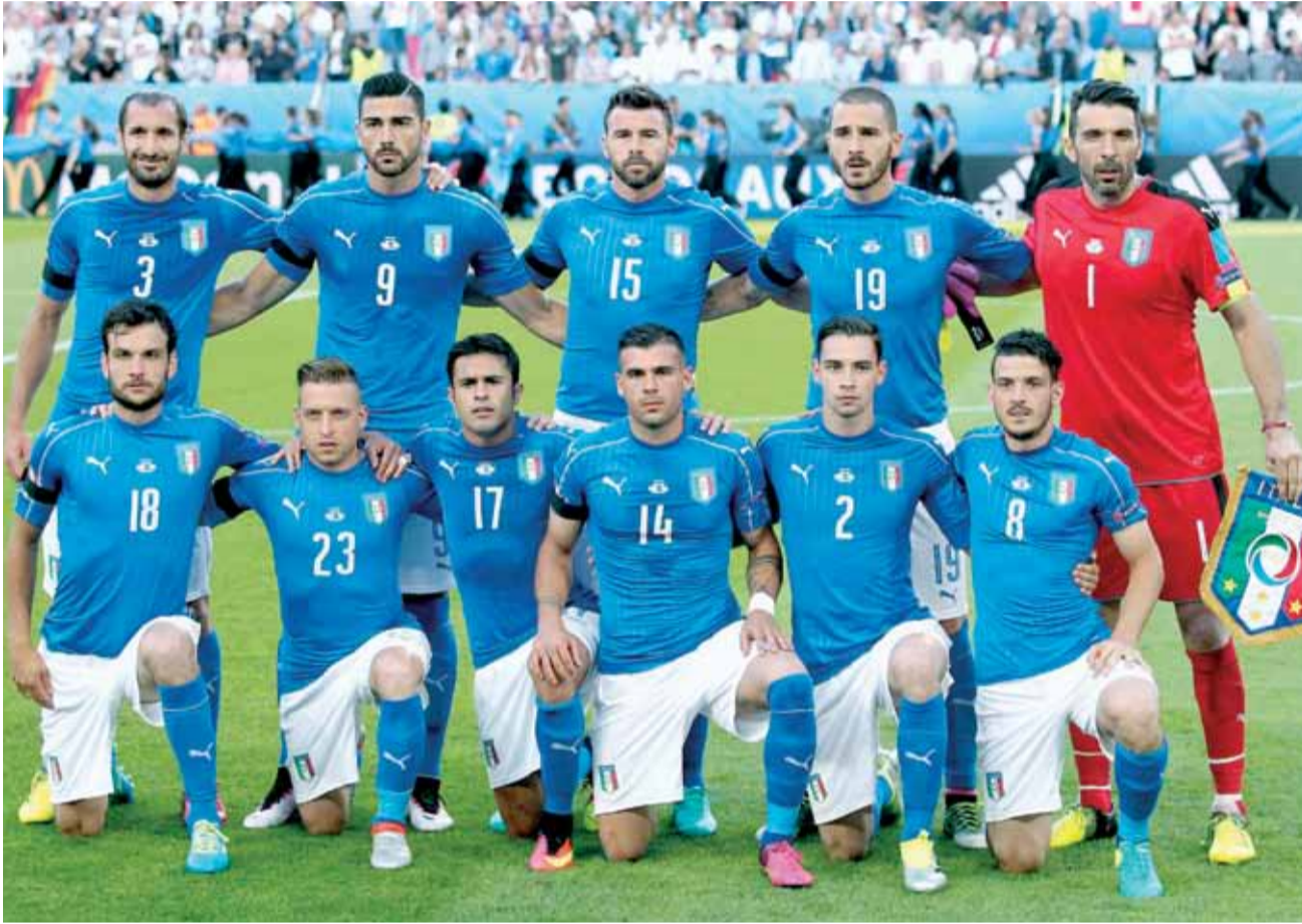
إيطاليا تستعد للحفاظ على صدارة مجموعتها