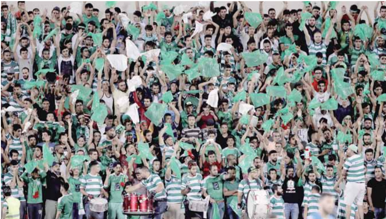
جماهيرنا الوفية .. كونوا كما عهدناكم

فيهم الأمثال بالأخلاق، وهو ما يعني أن هناك منغصات ستقف في طريق الوحدات مستقبلا، سواء من شتائم جماهير الأندية الأخرى وهي معروفة، إضافة إلى بعض القرارات التحكيمية الجائرة، وهو ما يحتم علينا عدم الانجرار خلف أي إساءات، ونطالب جماهيرنا أيضا أن تبعد "الشاتم" مهما كان، لأن لجنة العقوبات في اتحاد الكرة جاهزة لإيقاع عقوبة مالية مقدارها "500" دينار في المرة الأولى، على أن تتضاعف في المرة الثانية والثالثة وهكذا.