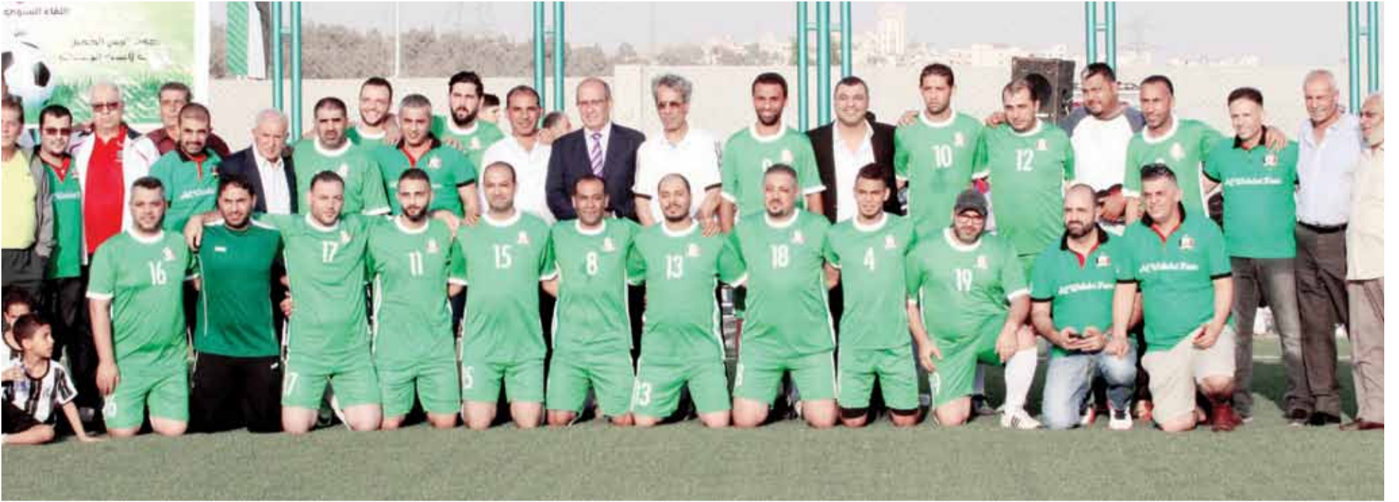
لقطة جامعة لرئيس و أعضاء مجلس الإدارة مع لاعبي رابطة مشجعي الوحدات بالإمارات وقدامى لاعبي النادي