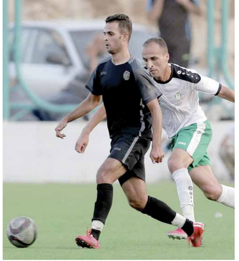
محمد الدميري ينتظر ان يقدم الاداء المعهود عنه