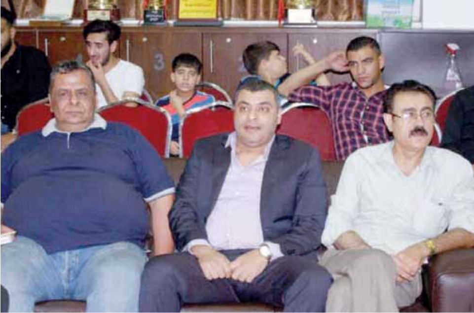
لقطة جامعة لرئيس النادي وأمين السر وراعي الحفل