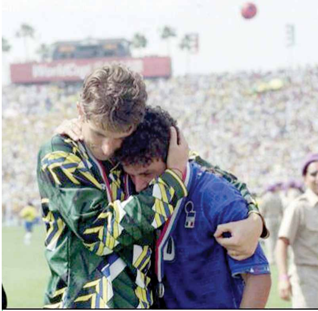
قمة بشرف "الخصومة": الحارس الاحتياطي للبرازيل "زيتي" لم يحتفل مع زملائه في التتويج بمونديال ١٩٩٤ لانه ذهب لمواساة باجيو

أحد المحللين عبر مواقع التواصل الاجتماعي يرى (نادي الوحدات) بين الاندية المحلية الذي يعطي الفئات العمرية الاهتمام الكبير من خلال المدرسة الكروية التي تعتبر بوابة الحقيقة وراس مالها والدليل انه يتواجد في الفريق الاول قرابة ١٥ لاعبي من ابناء الفئات العمرية.