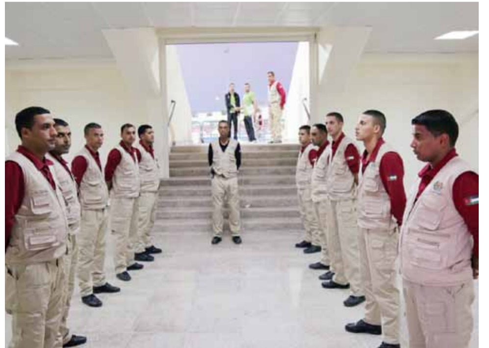
عناصر قوات الدرك تقوم بواجبها في حماية اركان اللعبة على الوجه الأكمل