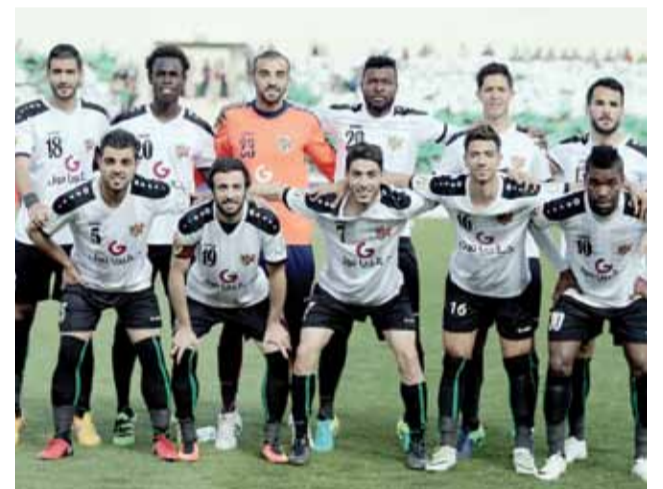
فريق الأهلي كان نشطاً في سوق الانتقالات الصيفية

حالياً أفضل استعداد لأنه يلعب مع أندية عريقة جداً وقوية من قبيل الأهلي المصري والوحدة الإماراتي ونصر حسين داي الجزائري، فيما الجزيرة غادر إلى تركيا لإقامة معسكر تدريبي يمتد لـ 10 أيام قريباً والأخبار تتحدث عن مباراة ودية تجمعهم مع الاتفاق السعودي، ويبقى معسكر الوحدات في فلسطين مرشحاً للإلغاء نظراً للأوضاع الراهنة في القدس، أما بقية الأندية فإنها ستحاول اللجوء إلى معسكرات داخلية في فنادق العاصمة على غرار اليرموك والعقبة الوافدان الجديان لكرة المحترف.