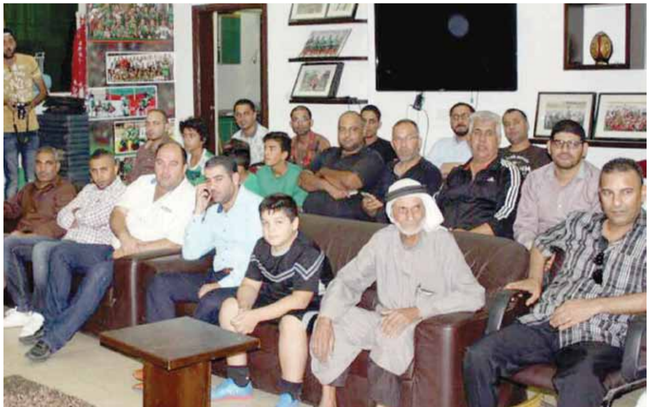
جانبا من الحضور