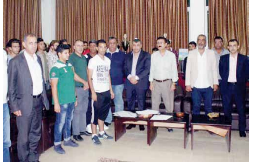
ادارة الوحدات توي فرق الفئات العمرية لكرة القدم اهتماما كبيرا