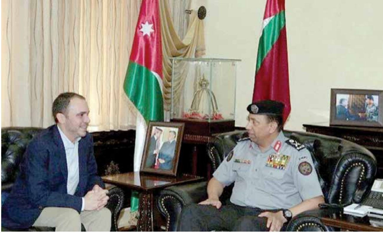
رئيس الهيئة التنفيذية لاتحاد الكرة سمو الأمير علي ابن الحسين يتحدث الى المدير العام لقوات الدرك اللواء الركن حسين الحواتمة في زيارة سابقة