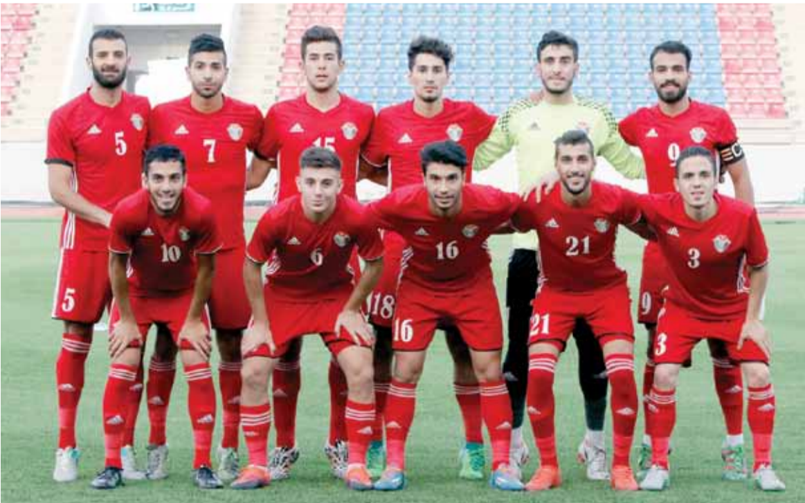
المنتخب الأولمبي تأهل إلى نهائيات كأس آسيا لكن ادائه غير مقنع