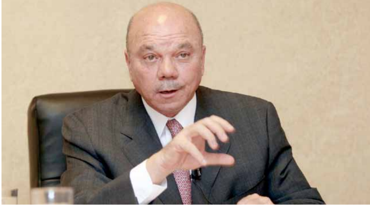
دولة رئيس مجلس الأعيان فيصل الفايز

حضر رئيس مجلس الأعيان دولة فيصل الفايز، الأسرة الوحدانية الأردنية، بمقال تحدث فيه عن شجون الوطن، ووجه انظار أبناء المجتمع الأردني الواحد، الى ممارسات وسلوكيات خارجة عن قيمنا وأخلاقنا، وعاداتنا وتقاليدنا الراسخة، التي نعتز ونفتخر بها، والتي أكد انها باتت تهدد سلمنا الأهلي والمجتمعي، ونسيجنا الاجتماعي المتناسك، واصبحت عنوانا للفتنة، وتغذية الكراهية والعنصرية والجهوية، مطالباً الجميع وأدماً واقتلاعها من جذورها من تراب الأردن الغالي عبر السطور التالية: