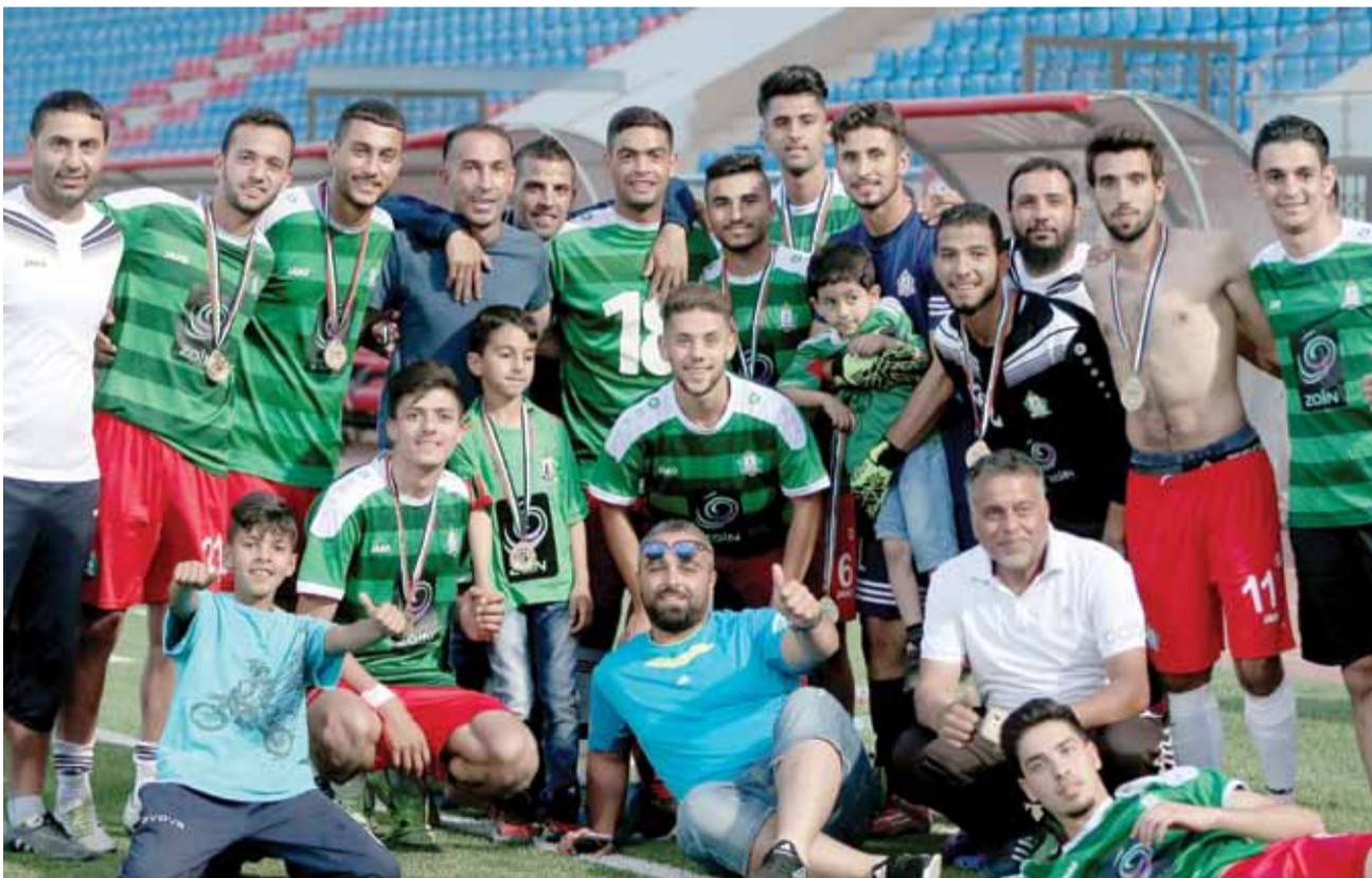
فريق الوحدات بطل سن 20