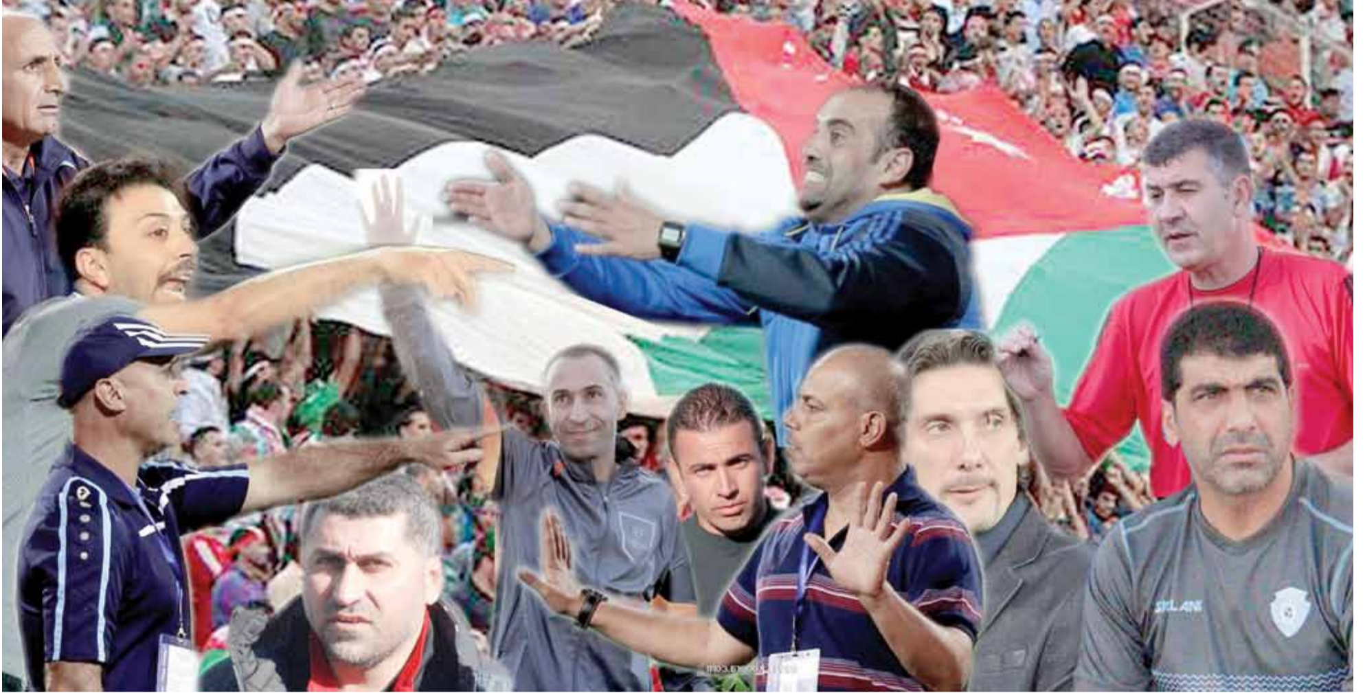
مدربو فرق دوري المحترفين على المحك