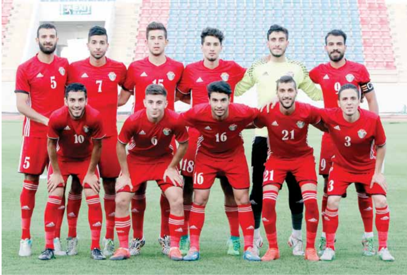
المنتخب الأولمبي لكرة القدم

واضاف ذيابات : استطعنا ان نرفض اسلوبنا في المباراة بالرغم من قوة المنافس العراقي والنقص العددي الذي عانى منه المنتخب مطلع الشوط الثاني، وكنا الاكثر استحواداً طوال فترات اللقاء.