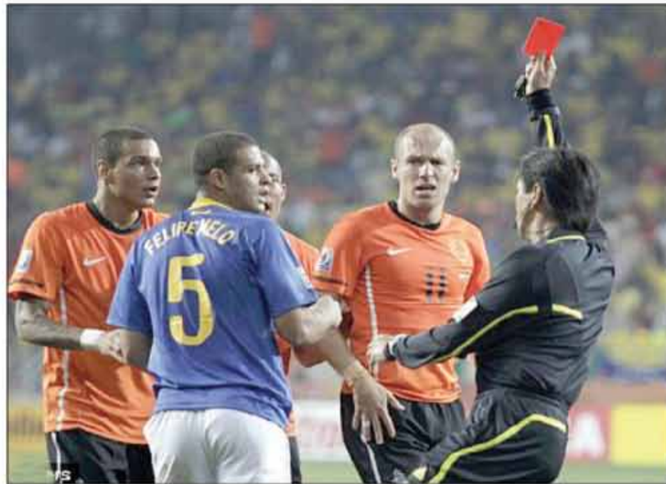
○ البرازيلي فابيو ميلو استحرق البطاقة الحمراء في مباراة هولندا .. ومع ذلك «يحتج» على قرار الحكم!

بالنتيجة (٦ - ١) ، أول لاعب يُطرد بالبطاقة الحمراء في مباراة نهائية بكأس العالم هو الأرجنتيني (مونزون) في المونديال الإيطالي الثاني عام ١٩٩٠ ، أمام المانيا التي فازت بهدف وحقت اللقب ، وحدثت حالة الطرد في الدقيقة ٦٨ بعد أربع دقائق من مشاركة مونزون كبديل ، ثم ما لبث الحكم المكسيكي (كوموسال) وأن أتبعه بطرد زميله (تروخيليو) ، يُذكر بأن هذا المونديال (٩٠) قد شهد أكثر حالات طرد في تاريخ كأس العالم ، إذ بلغ عدد البطاقات الحمراء خلاله (١٦) .