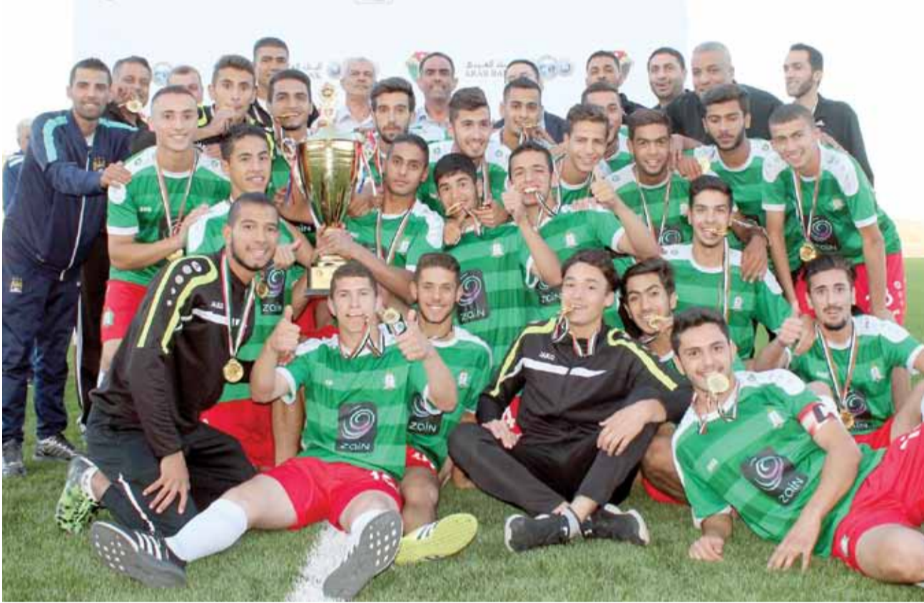
فريق الوحدات بطل سن 18

ووجه الحكيم رسالة الى جميع لاعبي فرق الفئات العمرية بالنادي بقوله: "امام لاعبي فرق الفئات العمرية فرصة كبيرة للوصول الى فريق الكرة الأول، ونيل شرف ارتداء القميص الاخضر والمحافظة على توجهه بالانجازات، وعليهم الاقتداء بنظرائهم الـ 10 الذين ترفيعهم من مدرتهم السابق رأفت علي في الموسم الماضي، ولدى اغلبهم فرصة ذهبية بالوصول الى فريق الكرة الأول والدخول الى عالم النجومية والاحتراف".