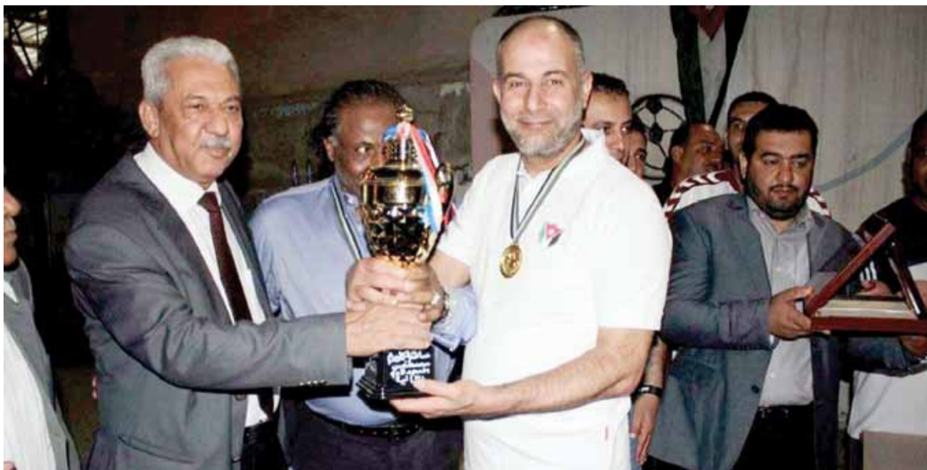
جانب من تكريم الفرق الفائزة

قصص النجاح لا تنتهي بحوار أو أخر لكن اعتادت جريدة «الوحدات الرياضي» على متابعة هذه الانجازات التي سطرت من زمن قديم على لوحات التاريخ المشرف التي خرجت من رحم المعاناة ليكون أبناءها الذين رسموا لواقعهم أحلاماً كان من المستحيل تحقيقها ونراها اليوم تعلق كل العلو على هامات العراقة والإبداع.