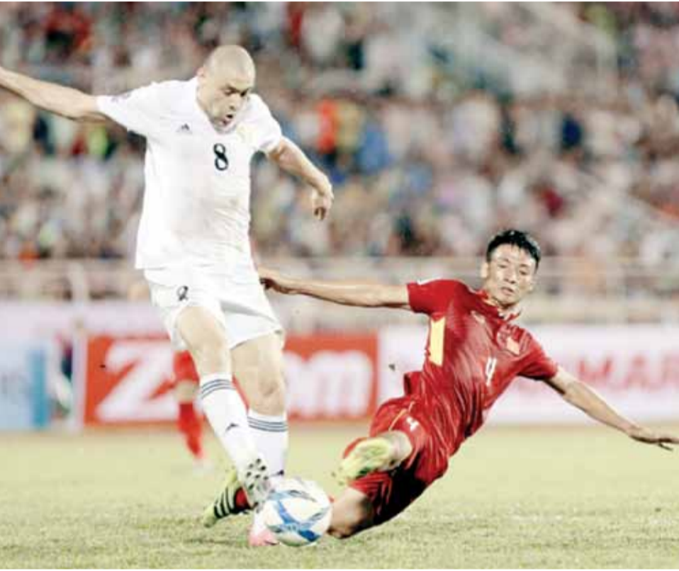
جانب من لقاء الأردن وفيتنام

يعود إلى قدرة العراق بالتعادل أمام اليابان وقدرة سوريا أن تعود أمام الصين وفوز منتخب فلسطين على عمان في رام الله، فيما المنتخب الوطني عاجز عن تسجيل هدف واحد أمام فيتنام، لذا فإن ما يحصل الآن لمنتخب الكرة غير مقبول والمطلوب من الكادر الفني والإداري أن يفكر ملياً في كيفية الخروج من المأزق الحالي بسرعة، فنحن لا نبحث عن نتائج بقدر ما يهمنا مشاهدة منتخب وطني مقنع على أرض الواقع.