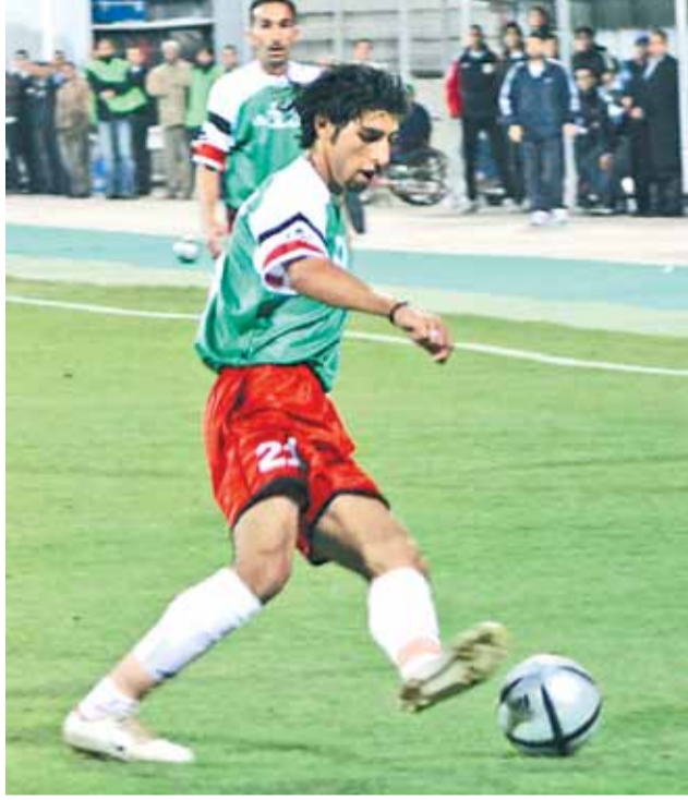
العندليب أحمد عبدالحليم... اشتقتك

سيلفي وجدت عدستها تتوقف عند صورة واحدة، للنجوم المنوي التعاقد معهم من اللاعبين المحليين والمحترفين، وتجدهم سيلفي للأمانة نجوما كبيرا ومؤثرين في مراكز اللعب المطلوبة، وتدمجهم سيلفي الى جانب اللاعبين الذين سيحدد الوحدات عقودهم من ابناء النادي ولاعبيه المميزين، لتركب اللقطة الأجل لفريق الاحلام-فريق كرة الوحدات- للموسم المقبل، وهو الذي تنطلق تدريباته مساء اليوم، في سهرة رمضانية على ملعب النادي بمنطقة غمدان بقيادة المدير الفني جمال محمود وجهازه المعاون، بحثا عن الاستعداد الامثل والمنافسة بقوة على القاب الموسم المحلي، التي تنطلق اولي مسابقاته بطولة درع اتحاد الكرة خلال شهر آب المقبل.