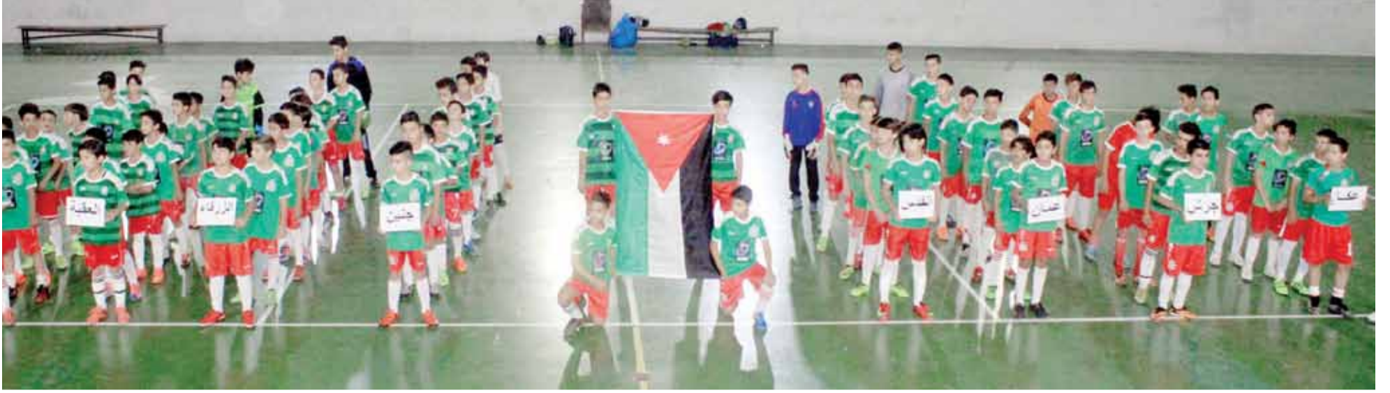
جانب من افتتاح البطولة