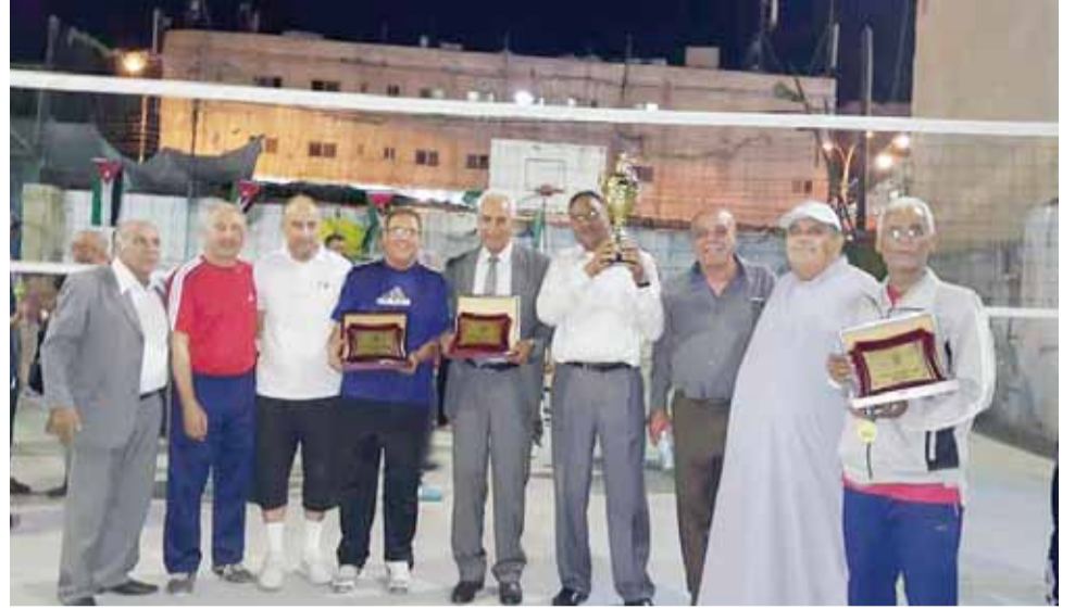
جانب لعدد من نجوم الزمن الجميل بالكرة الطائرة