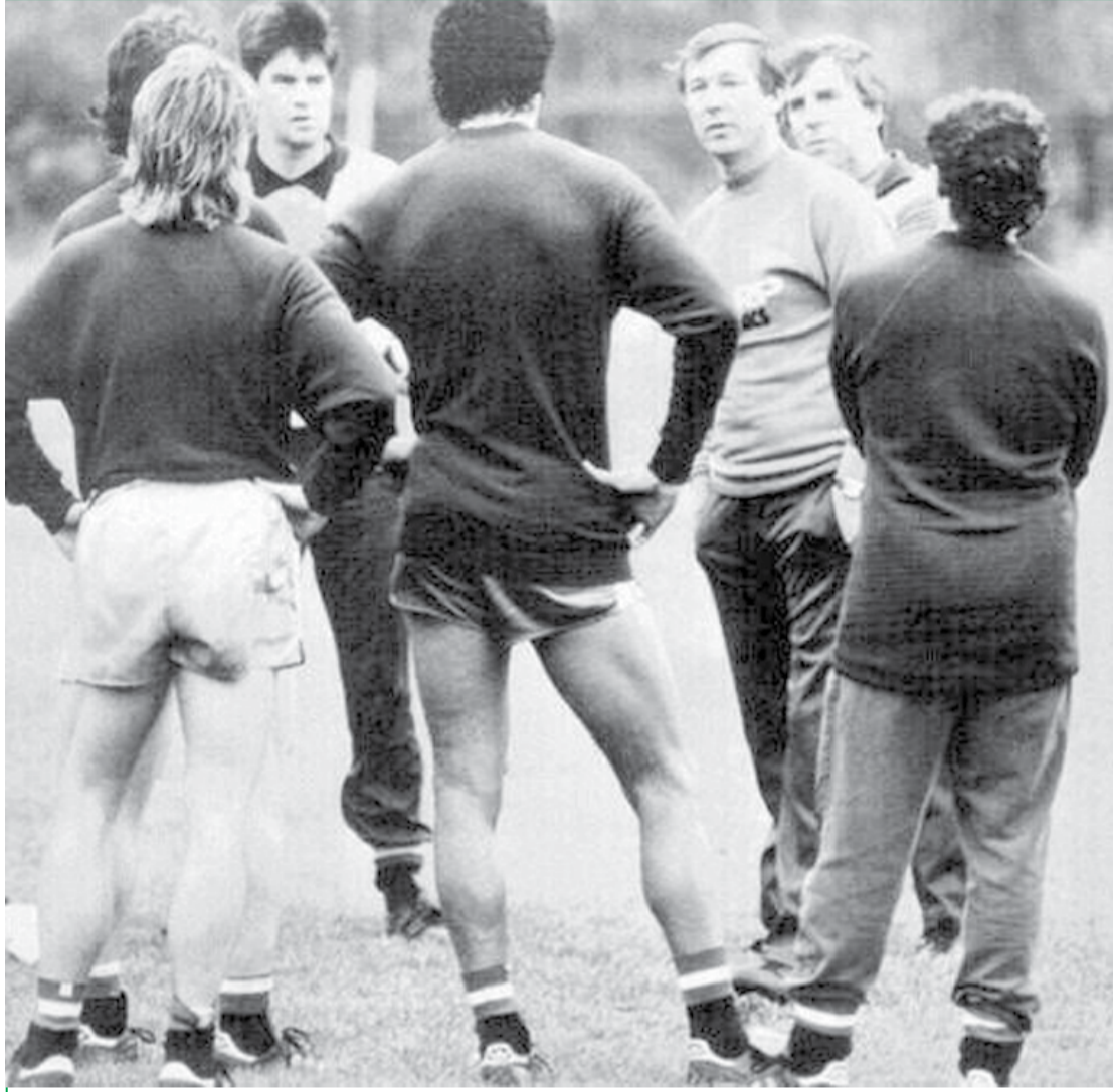
الإسكتلندي «الكس فيرغسون» مدرب مانشستر يونايتد الإنجليزي في أول يوم تمرين له مع الفريق.. الصورة يعود تاريخها لـ ١٩٨٦.

أحد المحللين عبر موقع التواصل الاجتماعي يرى بأن الوحدات هذا الموسم بقيادة جمال محمود سيكون مرعباً للغاية ولن يرحم أحد من الفرق، إلا أنه حذر من أن يكون هنالك نوع من الغرور إن أصاب الفريق فإنه سيصيبه في مقتل ولن يجعله قادراً على مجاراة فريق درجة أولى.