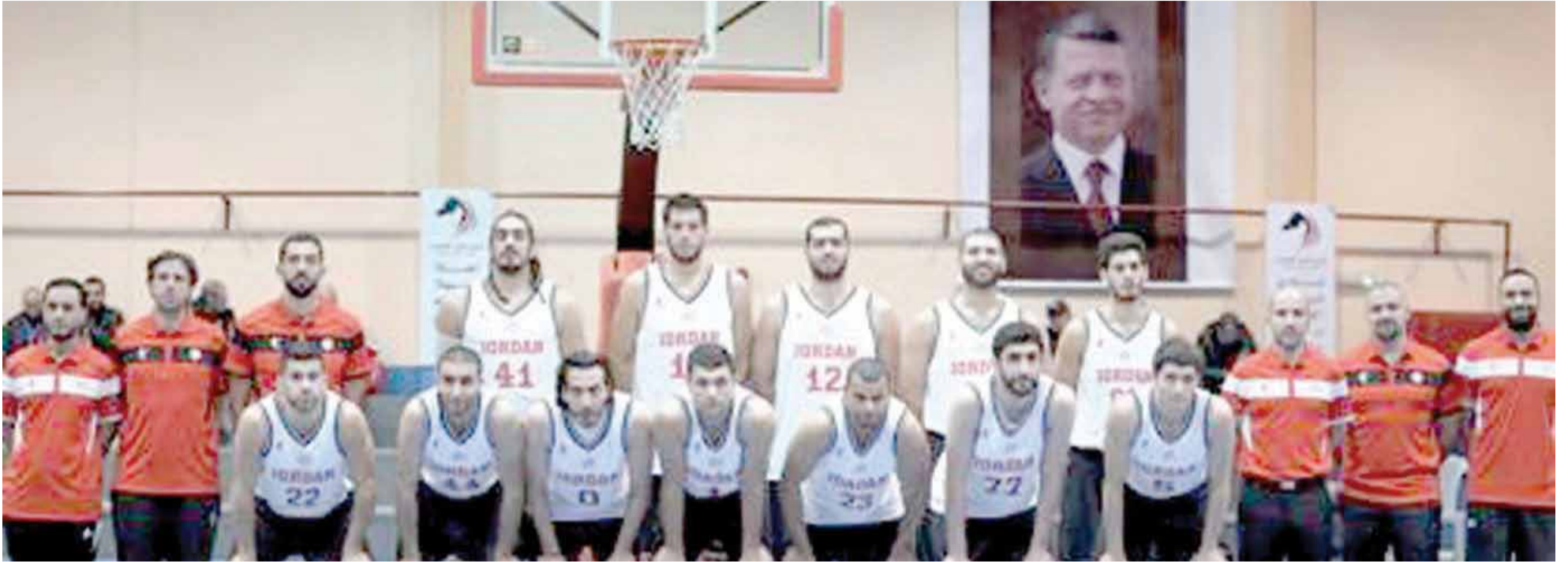
لقطة أرشيفية لمنتخب كرة السلة