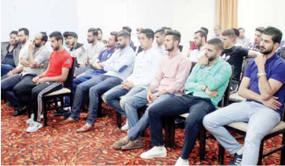
لاعبو فريق الكرة الأول خلال الإفطار والإجتماع أول أمس