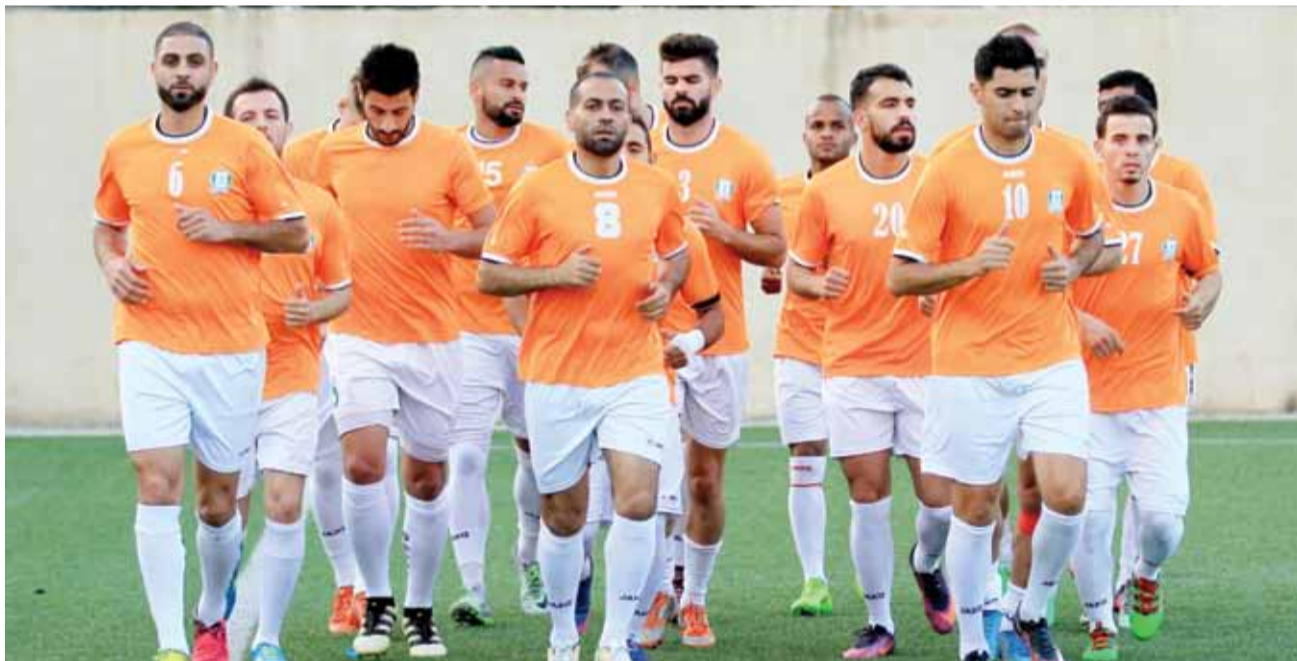
جانب من تدريبات سابقة لفريق الكرة الأول