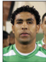
○ يس السهل