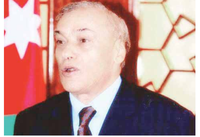
العين د.كمال ناصر يرعى حفل إفطار الفتيان الأيتام