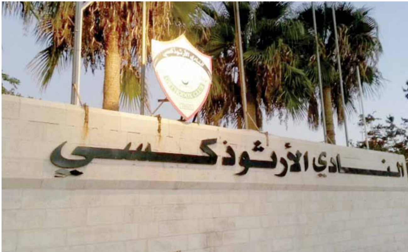
صورة جامعة لمقر النادي الأرثوذكسي

وكانت إدارة الأرثوذكسي التي اتخذت قرار تجميد نشاط كرة الطاولة قبل شهر ألمحت أنها ستتخذ قرارات مشابهة في ألعاب رياضية أخرى، في حال لم يكن النادي ممثلا في مجالس إدارات الاتحادات الرياضية، احتراما وتقديرا لدوره في دعم الرياضة الأردنية.