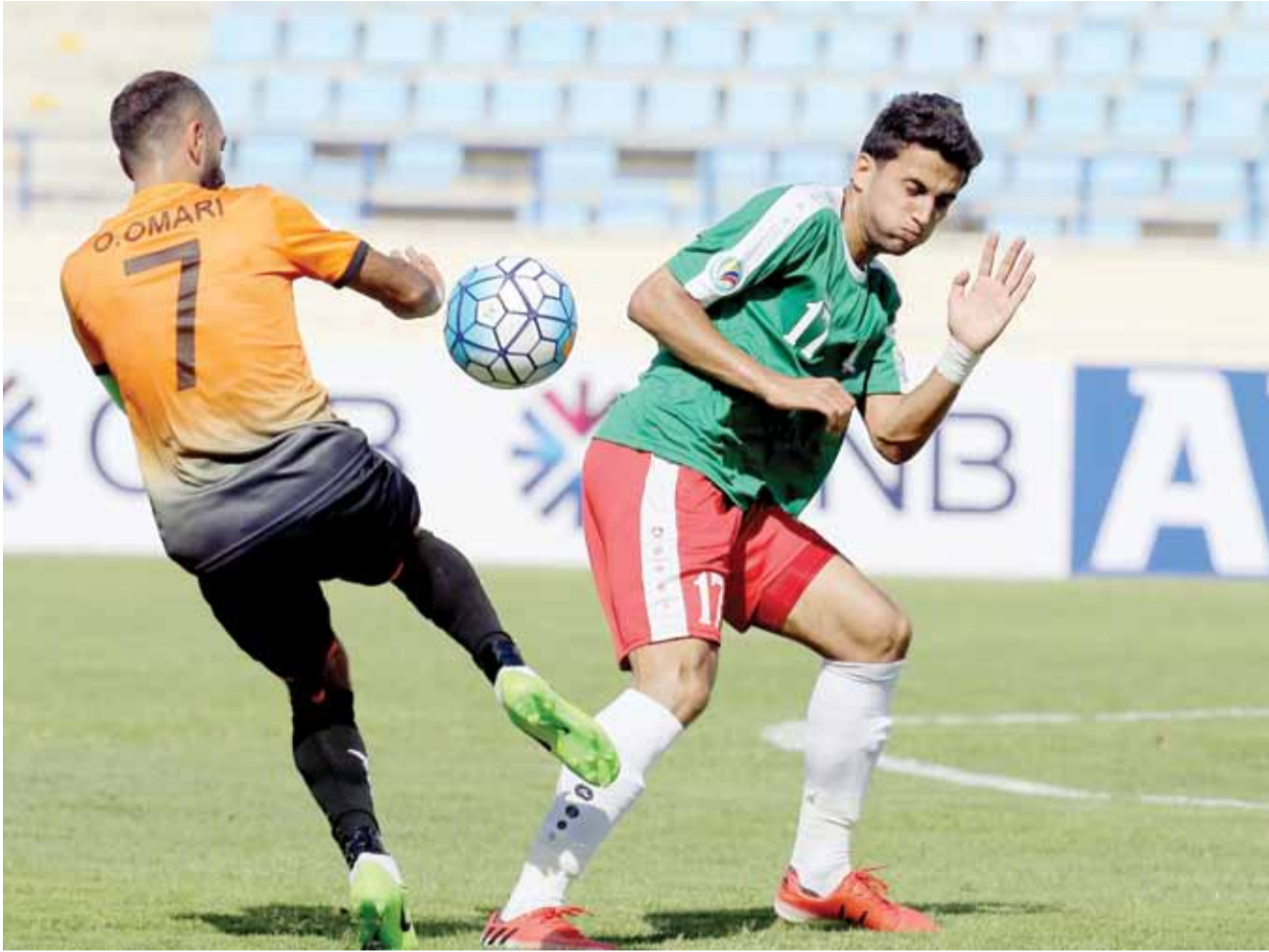
جانب من لقاء الوحدات والوحدة في ذهاب دور الارباع لكأس الاتحاد الآسيوي