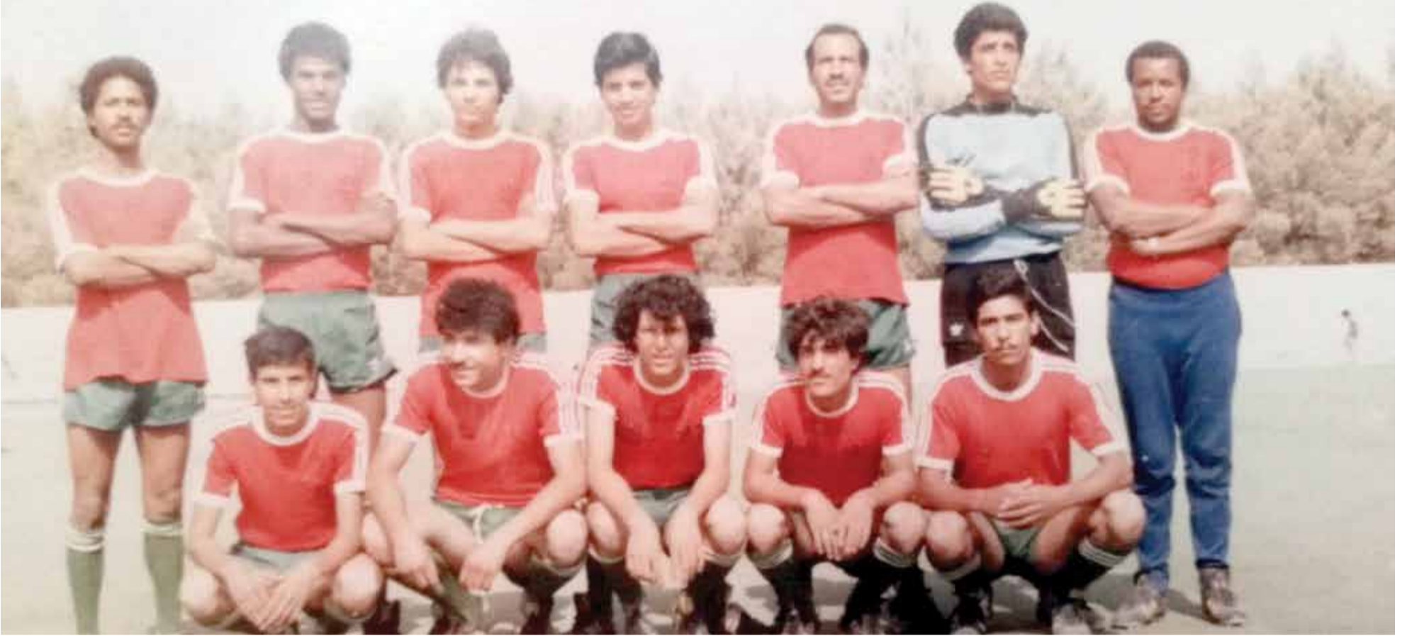
لاعبو الجيل الذهبي لفرق الطلبة ونداءاتهم تتواصل للعودة بروح المخيم

قرار "حكيم" وراء دمج أهم (مؤسستين رياضيتين) في جسم واحد