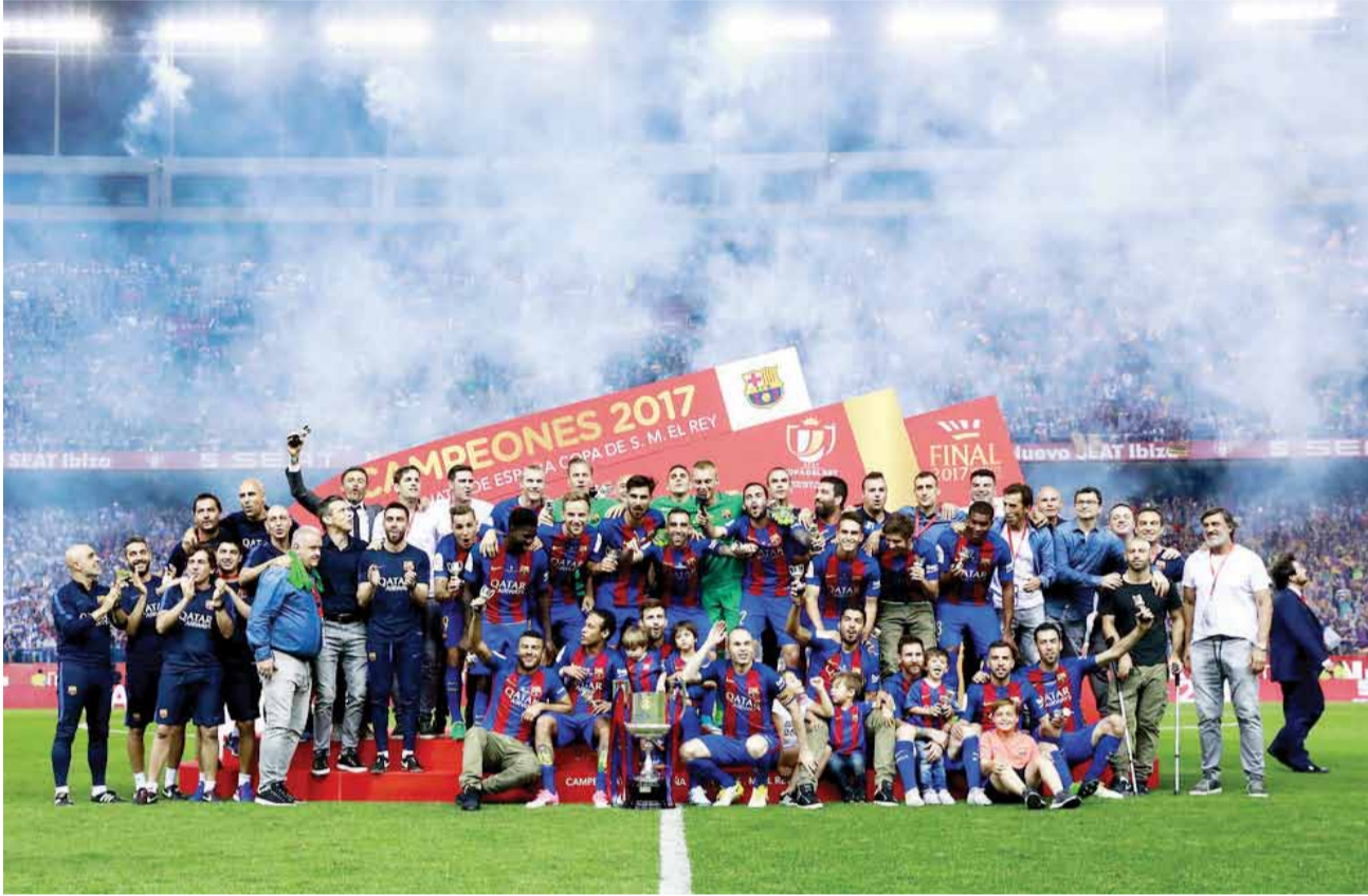
فريق برشلونة يتوج بكأس ملك اسبانيا