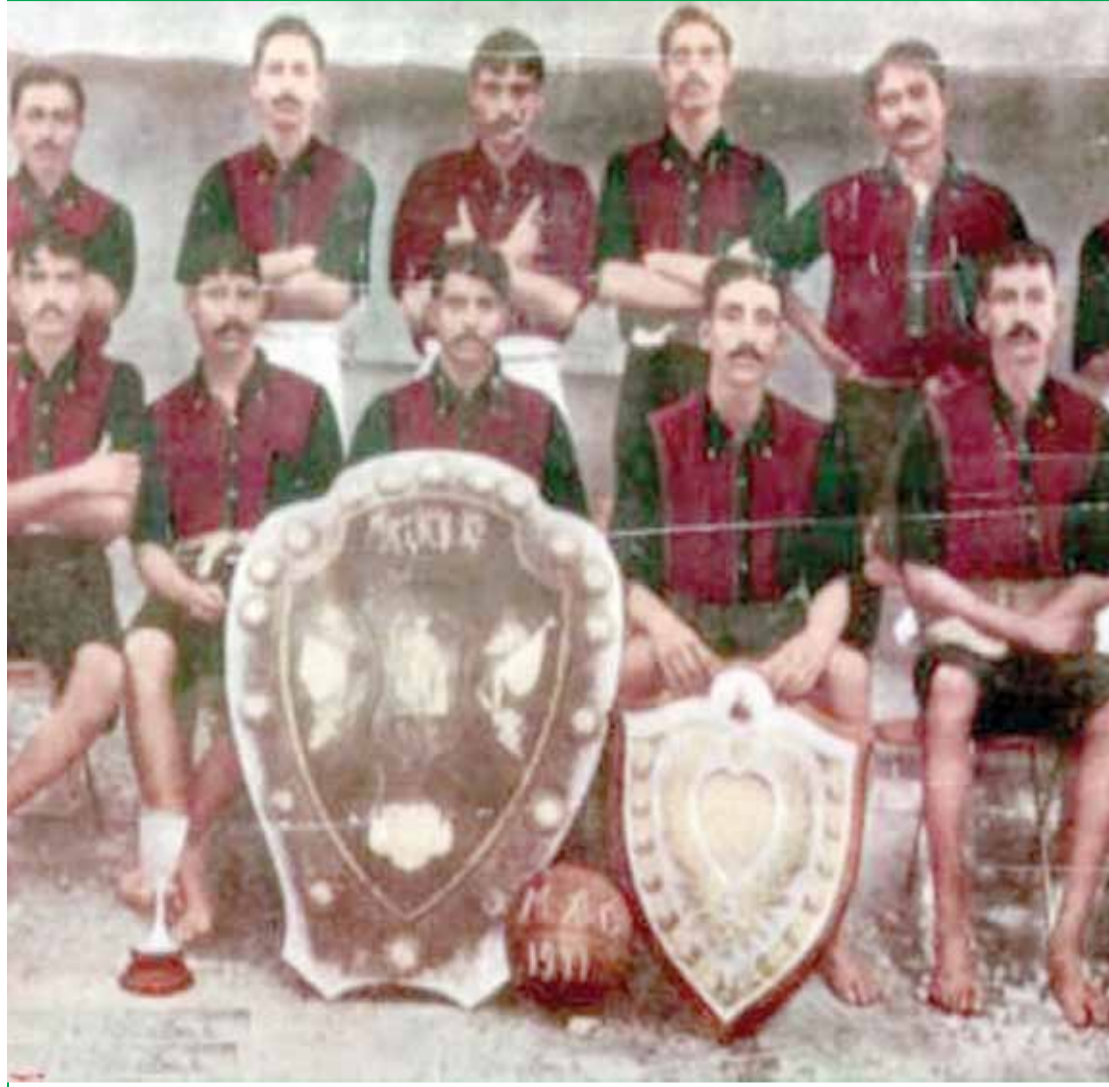
صورة المنتخب الهندي الذي رفض دعوة الاتحاد الدولي FIFA باللعب بمونديال 1950 لأنهم كانوا يريدون اللعب من دون حذاء!

أحد المحللين عبر موقع التواصل الاجتماعي يرى بأن اللجنة التأديبية باتحاد الكرة يجب أن يتم حلها على الفور وإنشاء لجنة العقوبات مع تسمية اعضائها من خارج الأردن بهدف أن يكونوا محايدين في اتخاذ قراراتهم بحق المخطئ.