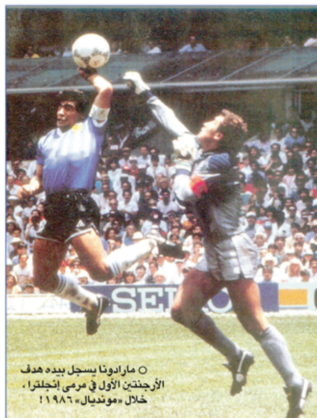
○ مارادونا يسجل بيده هدف الأرجنتين الأول في مرمى إنجلترا، خلال «موندبالي» ١٩٨٦!

مارادونا «غش» نفسه ووطنه وزملاءه وضميره والصحافة، والحكم «علي ابن ناصر» التونسي الذي لم يتأكد من «الحركة» فاحتسب الهدف!