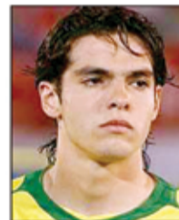
○ كاكّا ..