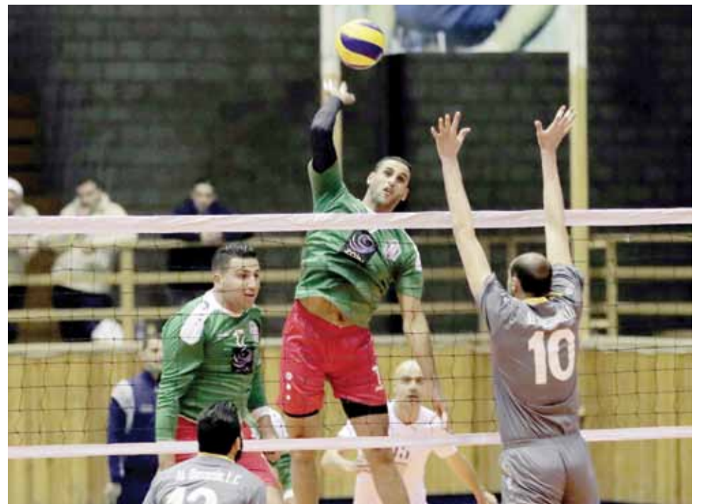
العواملة برز في توجيه الكرات الساحقة لأرض المنافسين وساهم في إنجازات طائرة الوحدات بالموسم الماضي