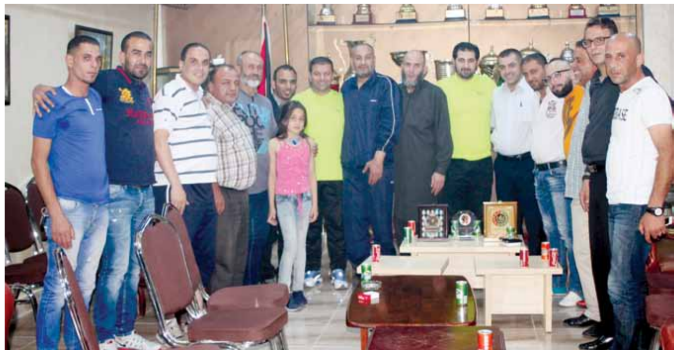
لقطة جامعة لوفد الوحدة السوري لدى زيارته مقر نادي الوحدات

وبين مستو خلال الزيارة عن اعتزاز إدارة الفريق السوري وجماهيره لحفاوة الاستقبال التي قوبلوا بها مؤكداً أن هذا الأمر ليس بالجديد على نادي الوحدات وجماهيره والتي لطالما عبرت عن طيب أصلها ورقبها الكبير من خلال التشجيع المثالي والحضاري وهو ما يؤكد بأن هذه الجماهير جماهير واعية