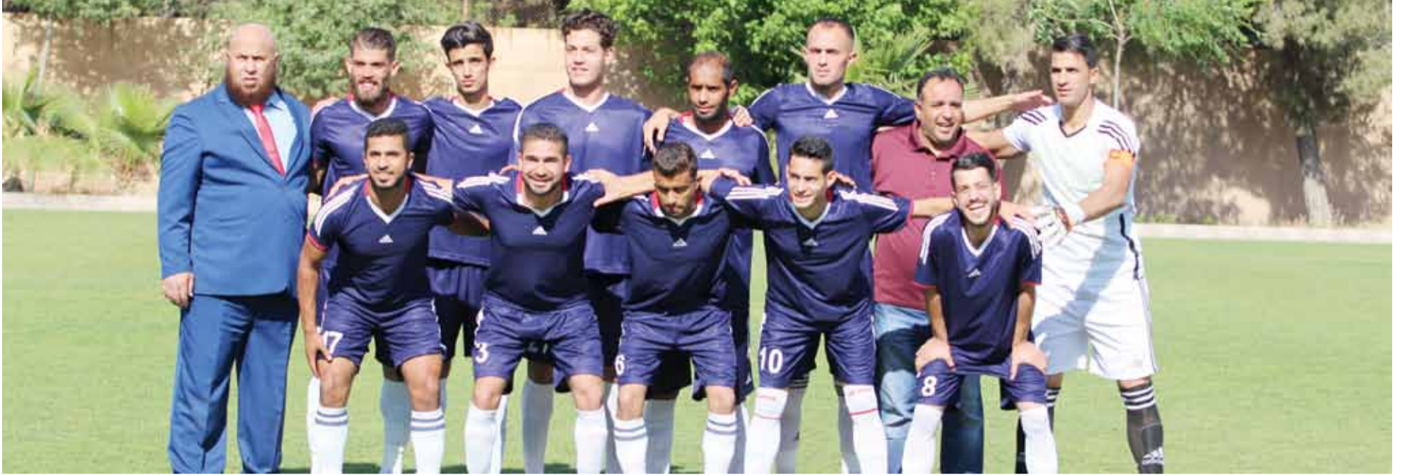
فريق شباب الحسين نجح بالخطوة الأولى نحو الأضواء