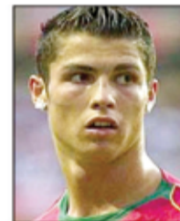
○ كريستيانو ..