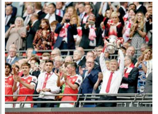
لحظة تتويج ارسنال بلقب كأس انجلترا

أكد المدير الفني السابق لفريق برشلونة لويس إنريكي أن الأرجنتيني ليونيل ميسي سيبقى في النادي الكتالوني لسنوات طويلة مقبلة في امسية تتويج ميسي بلقبه الثلاثين، ولم يبلغ بعد عامه الثلاثين، وأكد إنريكي ان البقاء في القمة لا يتطلب فقط أن يكون لديك قدرات، ولكن قوة جسدية أيضاً، وميسي لديه ذلك، وأنه «ظاهرة» بعد أن سجل هدفاً وصنع آخر في نهائي كأس الملك، لتضاف الاقب برشلونة التسعة الى ستضاف الى ٤ الاقب اخرى حققا لويس انريكي. الى ذلك، أعلن نادي برشلونة الاسباني لكرة القدم الاثنان ان حارس مرماه الدولي الألماني مارك-أندريه تير شتيغن مدد عقده حتى سنة ٢٠٢٢، ما يطيل مسيرته مع النادي الى ثمانية أعوام. وأوضح النادي الكتالوني، ان قيمة الاستغناء عن الحارس البالغ من العمر ٢٥ عاماً قبل نهاية عقده رفعت الى ١٨٠ مليون يورو.