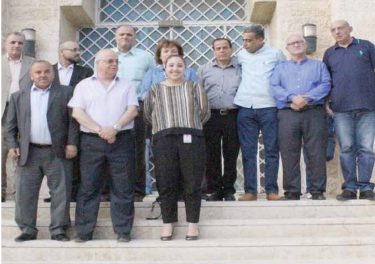
لقطة جامعة لاعضاء الهيئة العامة في تحاد كرة السلة

ولعل تلك الأجواء التي تغلف كرة السلة حالياً، وسبق لها أن وأدت إبداعات ألعاب القوى، ورحمت الرياضة الأردنية من إنجازات وجرت اللعبة في سنوات من الضياع، يجب أن تنتبه لها اللجنة الأولمبية، وتتخذ كافة الإجراءات لوقف المهزلة الحالية وإنقاذ كرة السلة الأردنية.