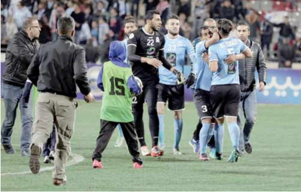
جانب من لقاء الفيصلي والجزيرة

وتأخذ عقوبات رادعة بحق الجماهير المسيئة. أضف إلى ذلك ضرورة تفعيل كاميرات المراقبة في الملاعب المختلفة وإبعاد أي مشجع لا يحترم نفسه وناديه، ومنعه من دخول الملاعب لأكثر من موسم حتى يكون عبءه لغيره. لنبتعد ونرتقي بـ«الشعارات» التي نرفعها، ولا بد أن تكون أكثر حرصاً على سمعة الكرة الأردنية التي يقودها أمير شاب متمكن هو سمو الأمير علي بن الحسين الحريص كل الحرص على رفعة المنتخب والأندية وإيصالها إلى أعلى درجات التميز.