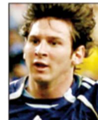
○ ميسي ..

حيث أن لكل منهم طريقته الخاصة بل وأسلوب مميز في إصابة الهدف. كريستيانو يسرعه الخارقة وتسديداته الصاروخية «الخارقة».