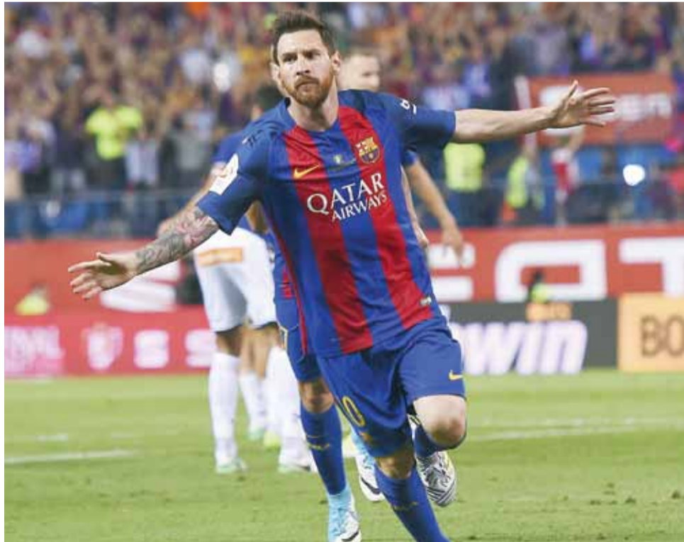
البرغوث ميسي باق في صفوف الفريق الكتالوني

أكد المدير الفني السابق لفريق برشلونة لويس إنريكي أن الأرجنتيني ليونيل ميسي سيبقى في النادي الكتالوني لسنوات طويلة مقبلة في امسية تتويج ميسي بلقبه الثلاثين، ولم يبلغ بعد عامه الثلاثين، وأكد إنريكي ان البقاء في القمة لا يتطلب فقط أن يكون لديك قدرات، ولكن قوة جسدية أيضاً، وميسي لديه ذلك، وأنه «ظاهرة» بعد أن سجل هدفاً وصنع آخر في نهائي كأس الملك، لتضاف الاقب برشلونة التسعة الى ستضاف الى ٤ الاقب اخرى حققا لويس انريكي. الى ذلك، أعلن نادي برشلونة الاسباني لكرة القدم الاثنان ان حارس مرماه الدولي الألماني مارك-أندريه تير شتيغن مدد عقده حتى سنة ٢٠٢٢، ما يطيل مسيرته مع النادي الى ثمانية أعوام. وأوضح النادي الكتالوني، ان قيمة الاستغناء عن الحارس البالغ من العمر ٢٥ عاماً قبل نهاية عقده رفعت الى ١٨٠ مليون يورو.