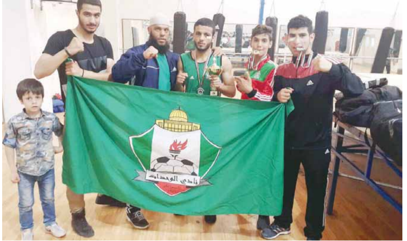
تألق وحداتي في بطولة الموتاي الأولى