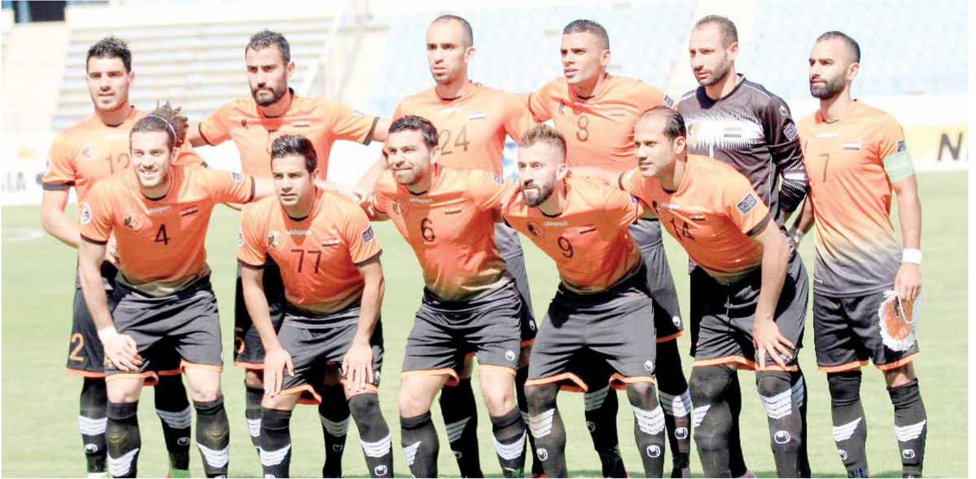
فريق الوحدة لكرة القدم