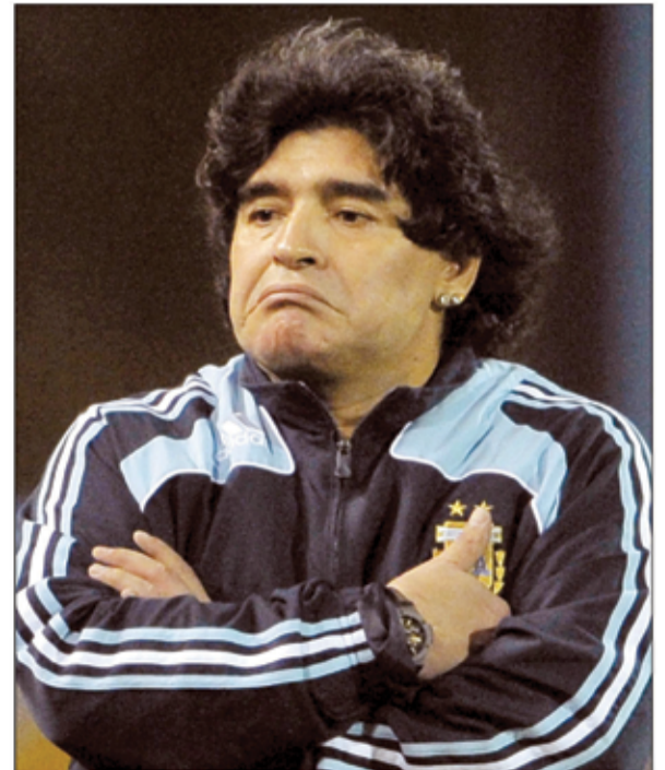
○ مارادونا «زعلان» .. على الوضع الحرج للأرجنتين !

كان مارادونا نجماً فريداً لم يتكرر .. لكنه لن يظهر كمدرّب بارز.