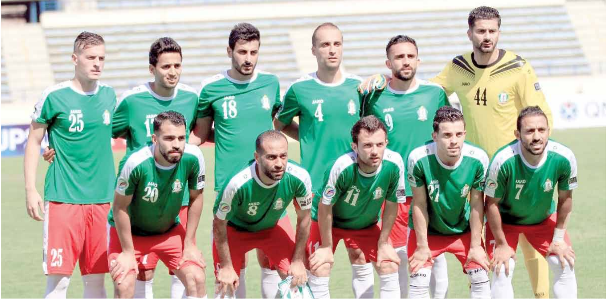
فريق الوحدات لكرة القدم