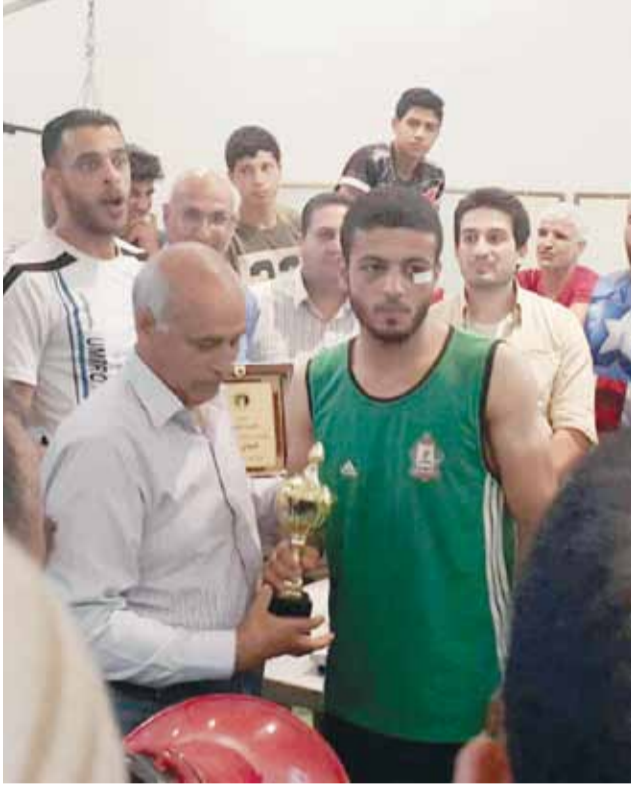
البطل كامل صبحي يصل إلى نهائي الرجال ويقلد بالفضة