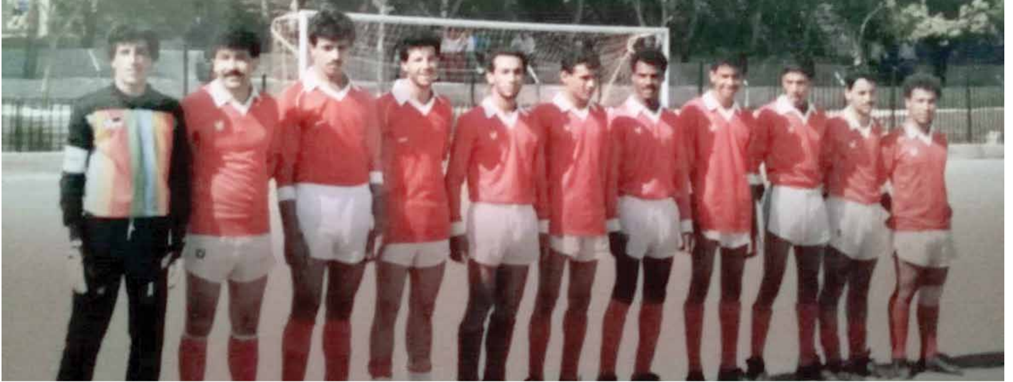
الجيل الذهبي لفريق نادي الطالبة... يبكي حال كرتته اليوم