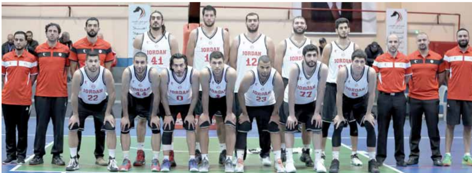
المنتخب الوطني لكرة السلة

وقع المنتخب الوطني لكرة السلة في المجموعة الثالثة في تصفيات آسيا المؤهلة الى بطولة كأس العالم التي ستقام في الصين خلال الفترة من ٣١ آب إلى ١٥ أيلول للعام ٢٠١٩، الى جانب منتخبات سوريا، لبنان والهند، فيما ضمت المجموعة الأولى منتخبات الصين، نيوزلندا، كوريا الجنوبية وهونج كونج، وضمت المجموعة الثانية منتخبات اليابان، الصين تايبيه، أستراليا والفلبين، وفي الرابعة منتخبات العراق، قطر، كازاخستان وإيران، وتتأهل المنتخبات التي تحتل المراكز الثلاث الأولى في المجموعات الأربع إلى الدور الثاني، سيتم توزيع المنتخبات المتأهلة إلى مجموعتين يتأهل منها أصحاب المراكز الثلاث الأولى من كل مجموعة إلى النهائيات إضافة إلى صاحب أفضل مركز رابع، ويستهل المنتخب مبارياته بلقاء سوريا يوم ٢٣ تشرين الثاني المقبل.