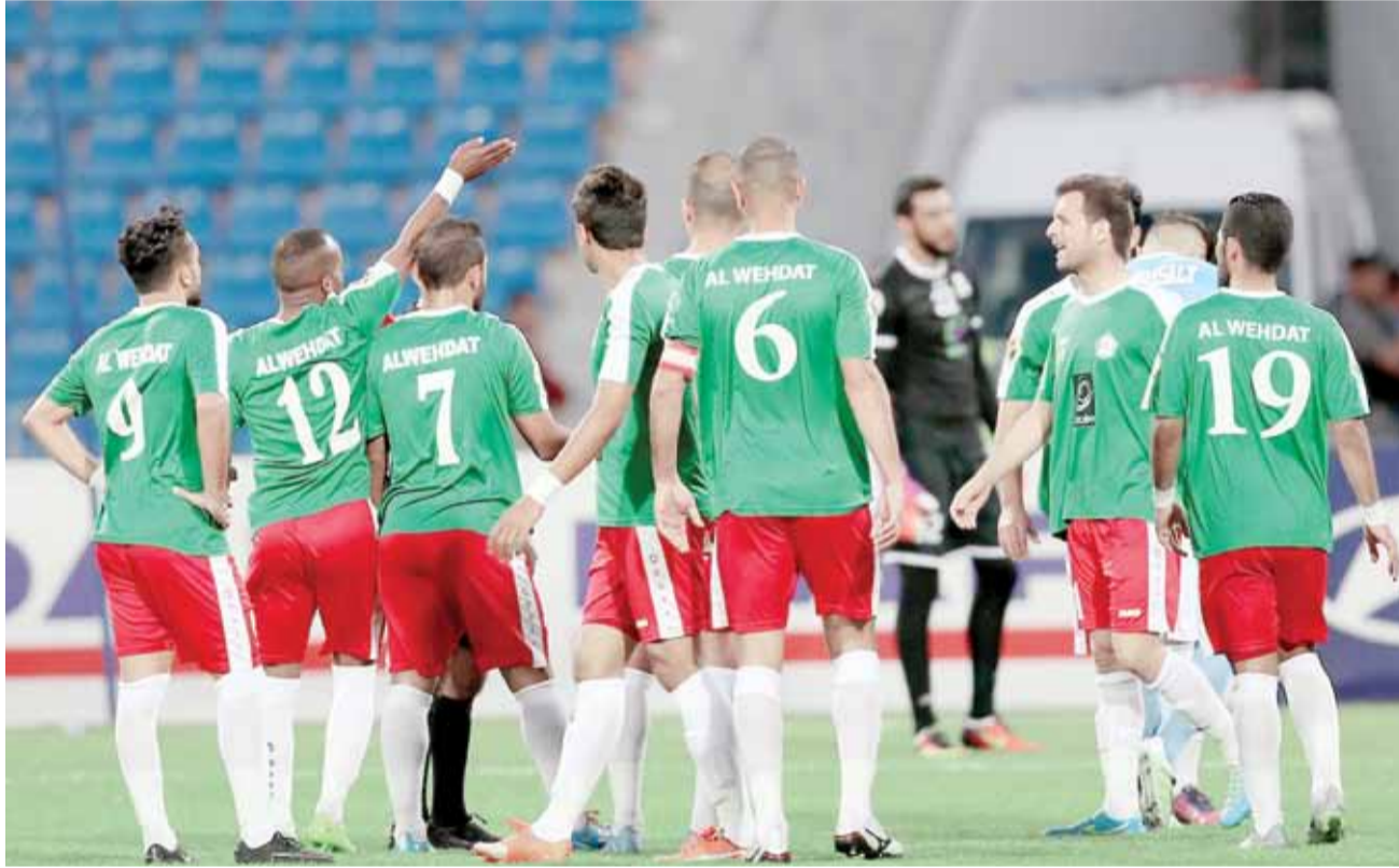
نجوم فريق الوحدات بحاجة إلى تأكيد نجوميتهم على أرض الواقع

كانت بمثابة الصدمة، والرسالة التي صيغت مبكرا، وتوجهت الى الطموحات الوحدانية بشكل مباشر، وردمت الهالة الاعلامية والاحلام الورديّة التي غلفت الوحداتيين فور التعاقد مع المدير الفني العراقي عدنان حمد وفريقه المعاون في اكبر صفقة تدريبية في تاريخ الوحدات والكرة الاردنية.