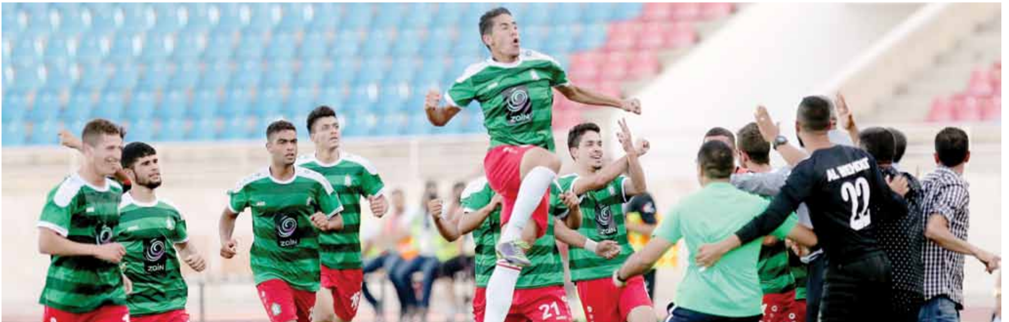
فرحة مستحقة للاعبينا بالفوز واللقب