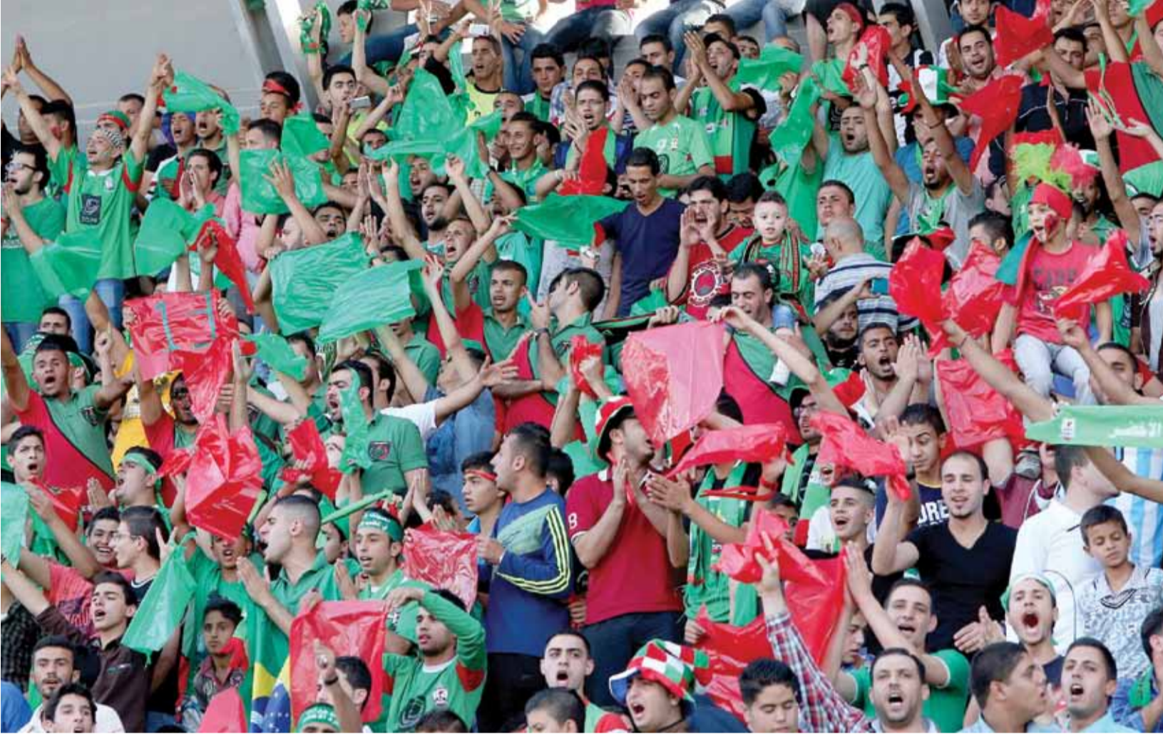
جماهير الوحدات مازالت واثقة من قدرة فريقها على العودة حتى لو طال الزمن

اجابة لدى الاسماء التي تشرفت بارتداء القميص الأخضر، ولماذا جسدت اجسامها ضد الحرارة الوحدانية، ولم يسمعو نداءات الجماهير الوفية بالانتصار للصرح والهوية، او القوا آذانهم بأهازيج الفرح، ونداءات التحفيز في اغلب المباريات من مجموع ٤٣ محلية وقارية. اين ذهبت الروح، ويوازيها اين من يصنع تلك الروح؟، وان كان نادي الوحدات بتفاصيل قصة كفاحه، والوانه التي تعج بصور المخيم، هو من يصنع الروح، الا انه لم يجد من يستحق ان يحمل تلك الروح في فريق الكرة الحالي، اعذورني ايها اللاعبين، ولكن احوالكم، ادانكم، انخفاض مؤشر اداءكم، تذبذب مستوى انتماءكم لقميص العز الوحداني، ضربكم لوقفات جماهيركم الوفية عرض الحائط، تخليكم عن الحمية والروح حتى فيما تبقى لكم من ماء وجهكم، عندما ادميتم القلوب بخسارة مريرة امام المنافس التقليدي، منحه السطوة والمضي الى الألقا، تارة بالدوري واخرى نحو كأس الاردن.