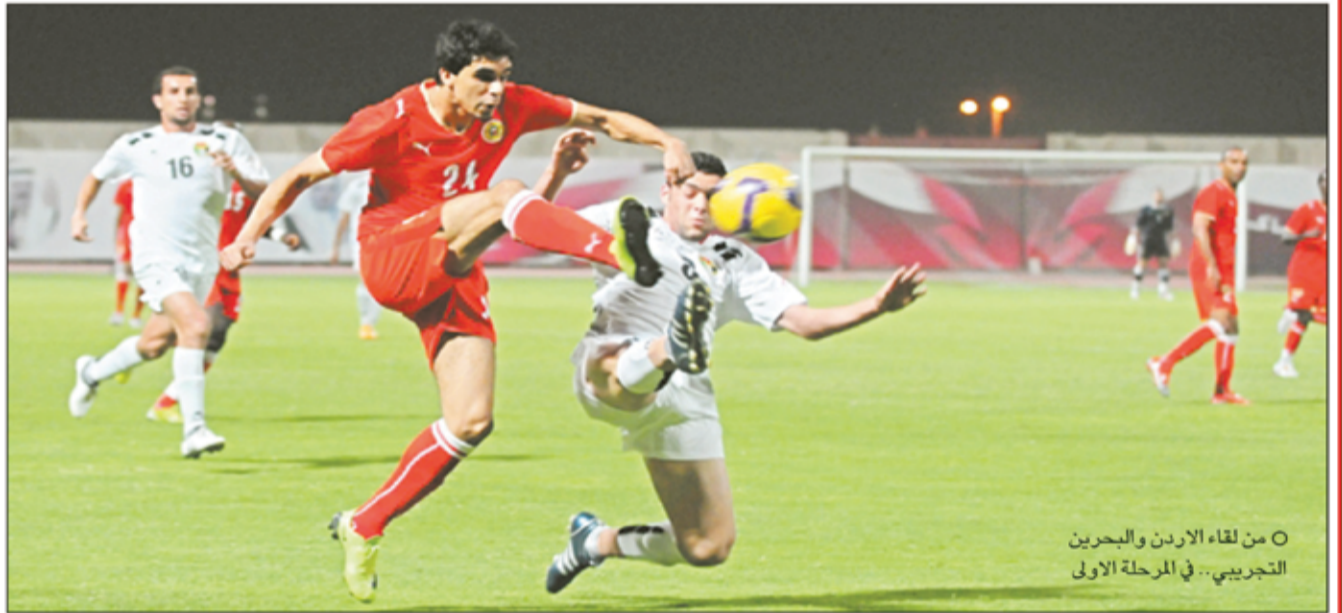
○ من لقاء الاردن والبحرين التجريبي .. في المرحلة الاولى