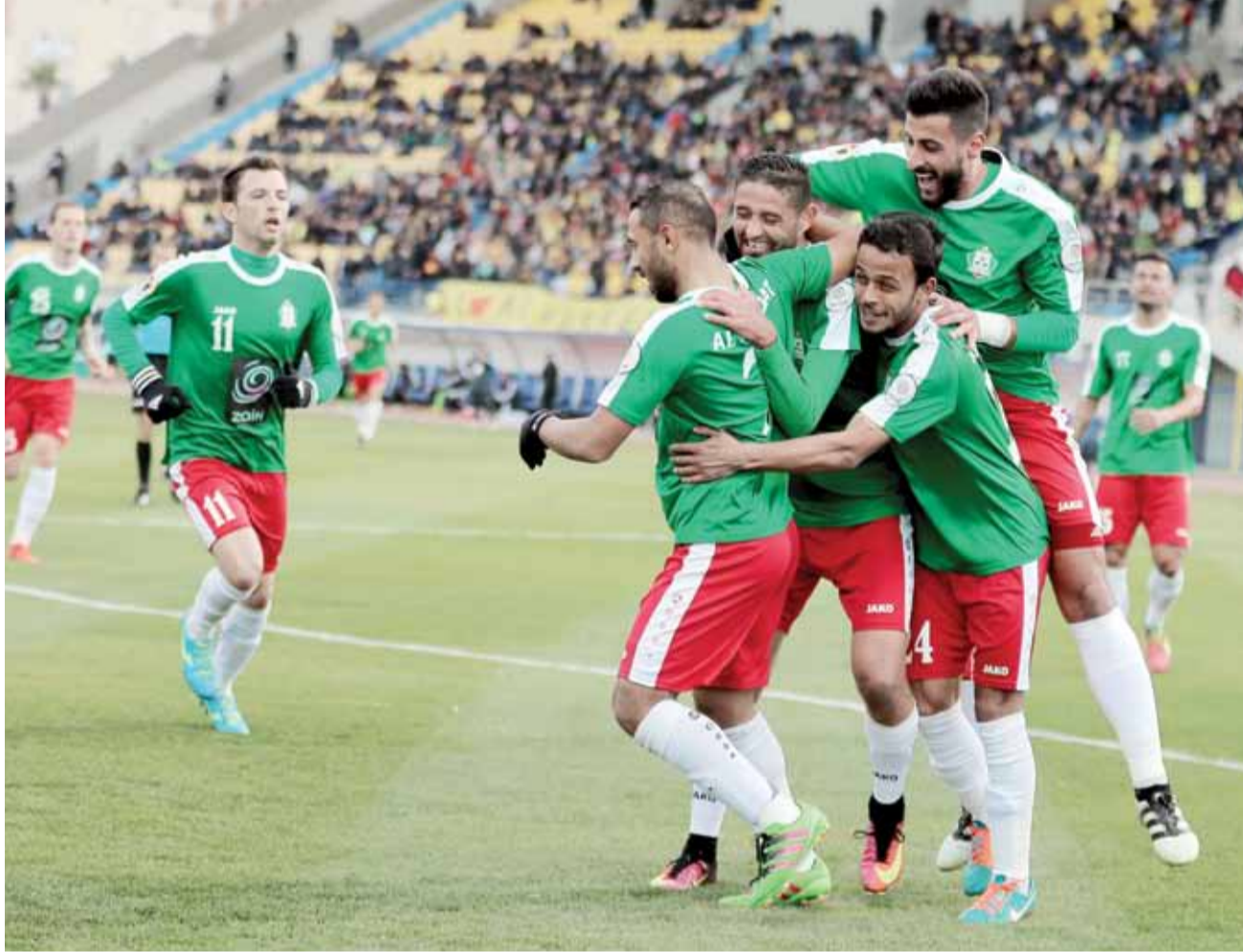
فرحة وحدائية تتمنى أن تتكرر أمام الحسين إربد بالكأس

الأول، وثبتت الوحدات بالمركز الثاني بذات الرصيد، الجزيرة ثالثاً برصيد 7 نقاط، متقدماً بفارق الأهداف عن شباب الأردن صاحب ذات الرصيد، ويبقى لقاء مباشر للوحدات مع منافسه الحسين إربد في الجولة الأخيرة من الدور الأول، والذي يظهر فيها الحسم على بطاقتي التأهل-الأول والثاني عن المجموعة، حين يلتقي ذات راس مع شباب الأردن الساعة الثالثة على ملعب الأمير فيصل بالكر، الجزيرة مع الصريح الساعة الخامسة والنصف على ملعب الأمير محمد بالزرقاء، وهي المباريات الحاسمة بين الفرق الطامحة بعبور بوابة التأهل الى الدور الثاني من المسابقة، فيما خرج فريقاً الصريح وذات راس من حسابات التأهل.