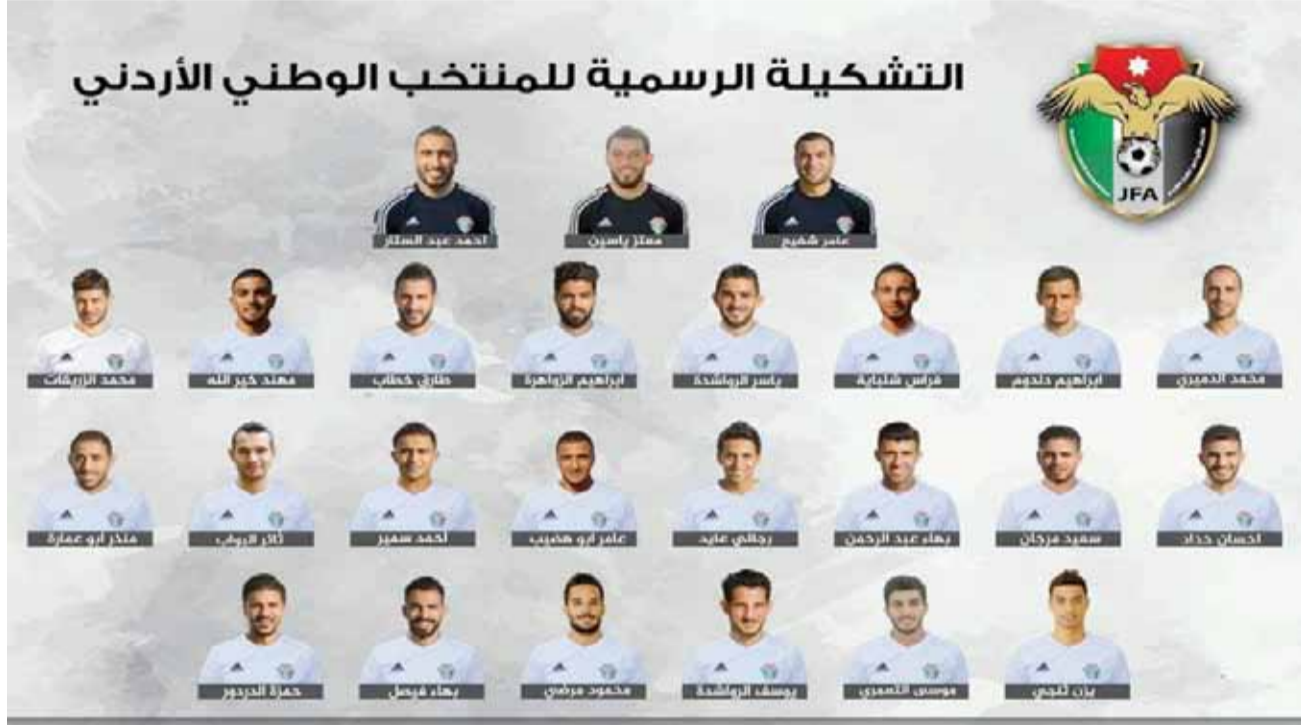
تشكيلة المنتخب الوطني الجديدة تطمح لتقديم الأفضل بقيادة المسفر

عموماً، خيارات وأوراق الإماراتي المسفر مقبولة إلى حد كبير، ولديه فرصة كبيرة وفريقه المعاون في ترتيب أوراق المنتخب بالشكل الذي يلي طموح الأردنيين، ويتناسب مع آمال الظهور والمنافسة في النهائيات القارية. وكان المسفر أكد في تصريحات صحفية، أنه يأمل أن يخرج المعسكر التدريبي بالإمارات، بالفوائد المرجوة، فضلاً عن معرفته بكل صغيرة وكبيرة عن حاجيات اللاعب الأردني، مبدياً الثقة بجهازه المعاون لتحقيق آمال الكرة الأردنية.