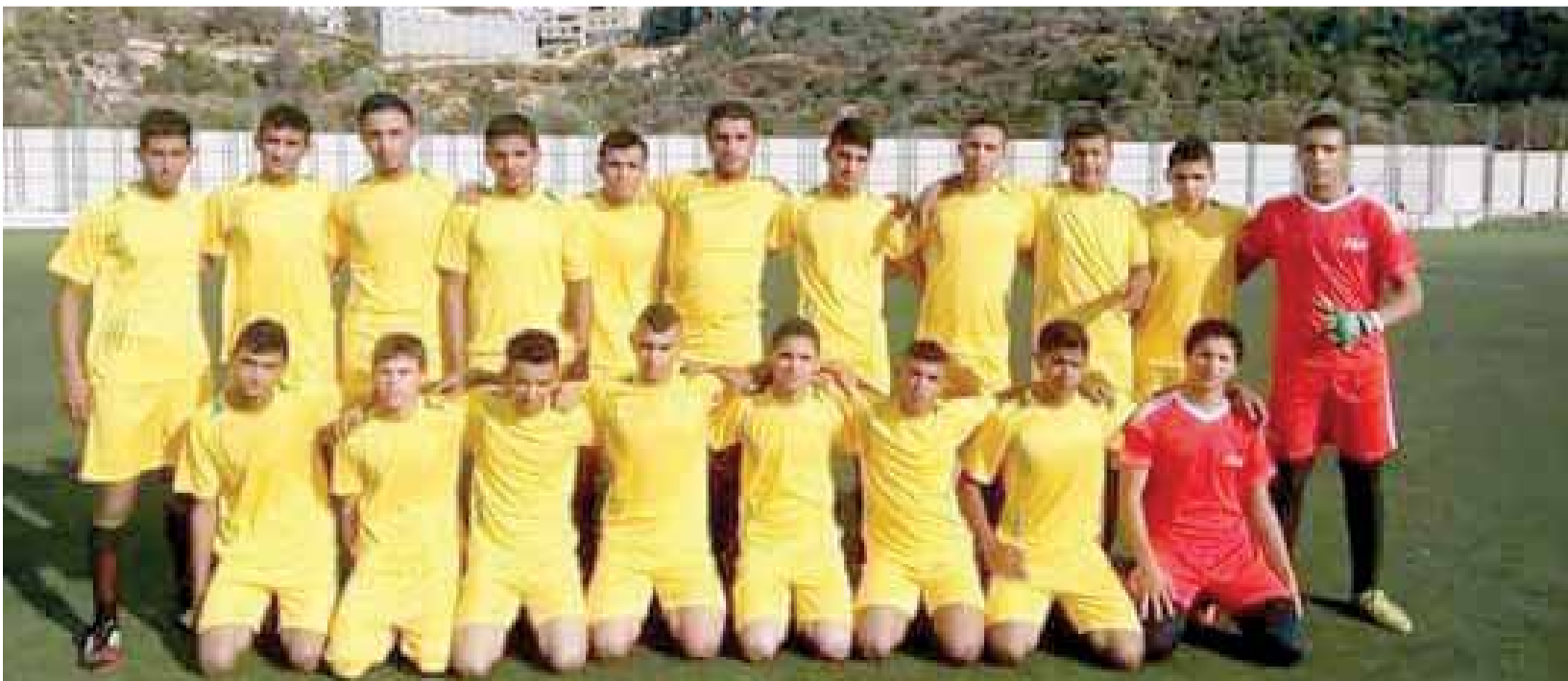
فريق غزة هاشم.. طموح ليس له حدود

وسلط الضوء عبد الكريم على فريقنا الرياضي الذي لم يحالفه الحظ رغم إننا وصلنا نهاية البطولة برصيد صفر (رقم حافظ منزله) ووضعنا ما يقارب ١٤٠٠٠ الف دينار على تقدمنا كرويا ليكون نادينا كما هو حاله كرويا ورغم هذه الاغلاقات إلا إننا نسعى بمواصلة الطريق للوصول إلى طموحاتنا