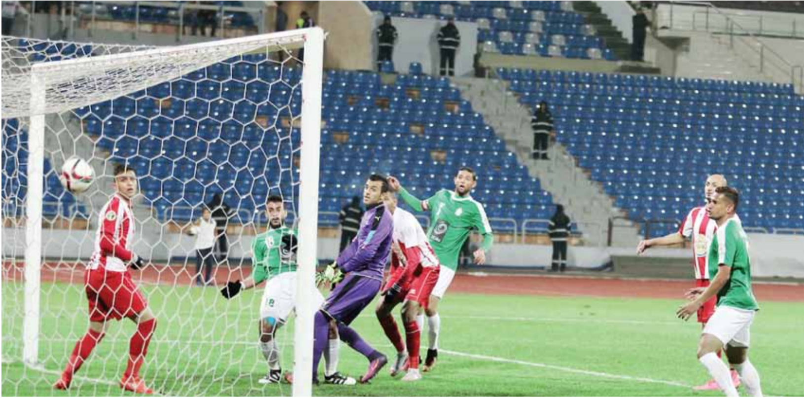
الوحدات قدم مباراة كبيرة أمام شباب الأردن وخرج فائزاً