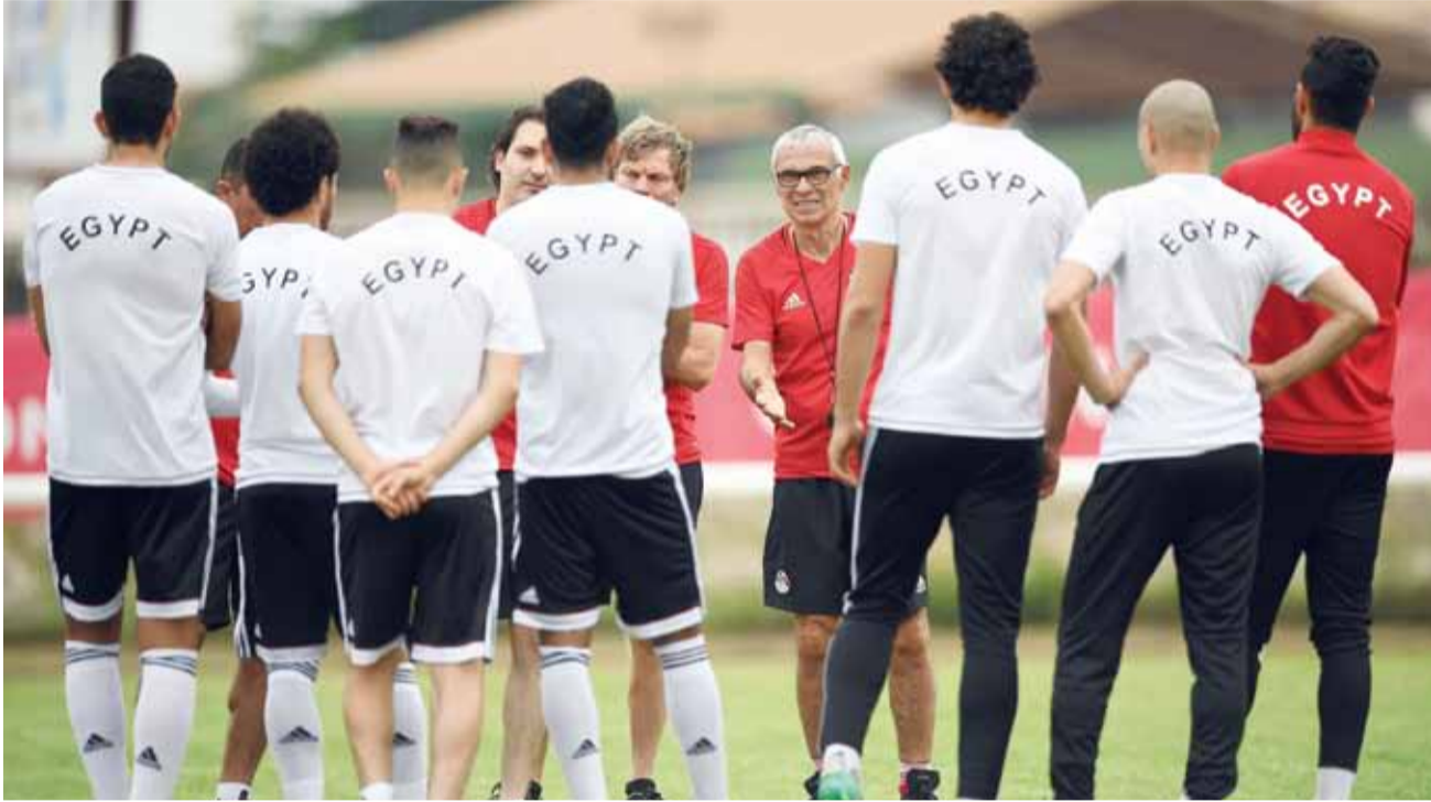
مدرب منتخب مصر الأرجنتيني هكتور كوبر يعطي تعليماتة الاخيرة قبل خوض المباراة امام مالي.

وتلعب أوغندا ضد غانا في نفس المجموعة وهما مع مصر في تصفيات كأس العالم أيضا.