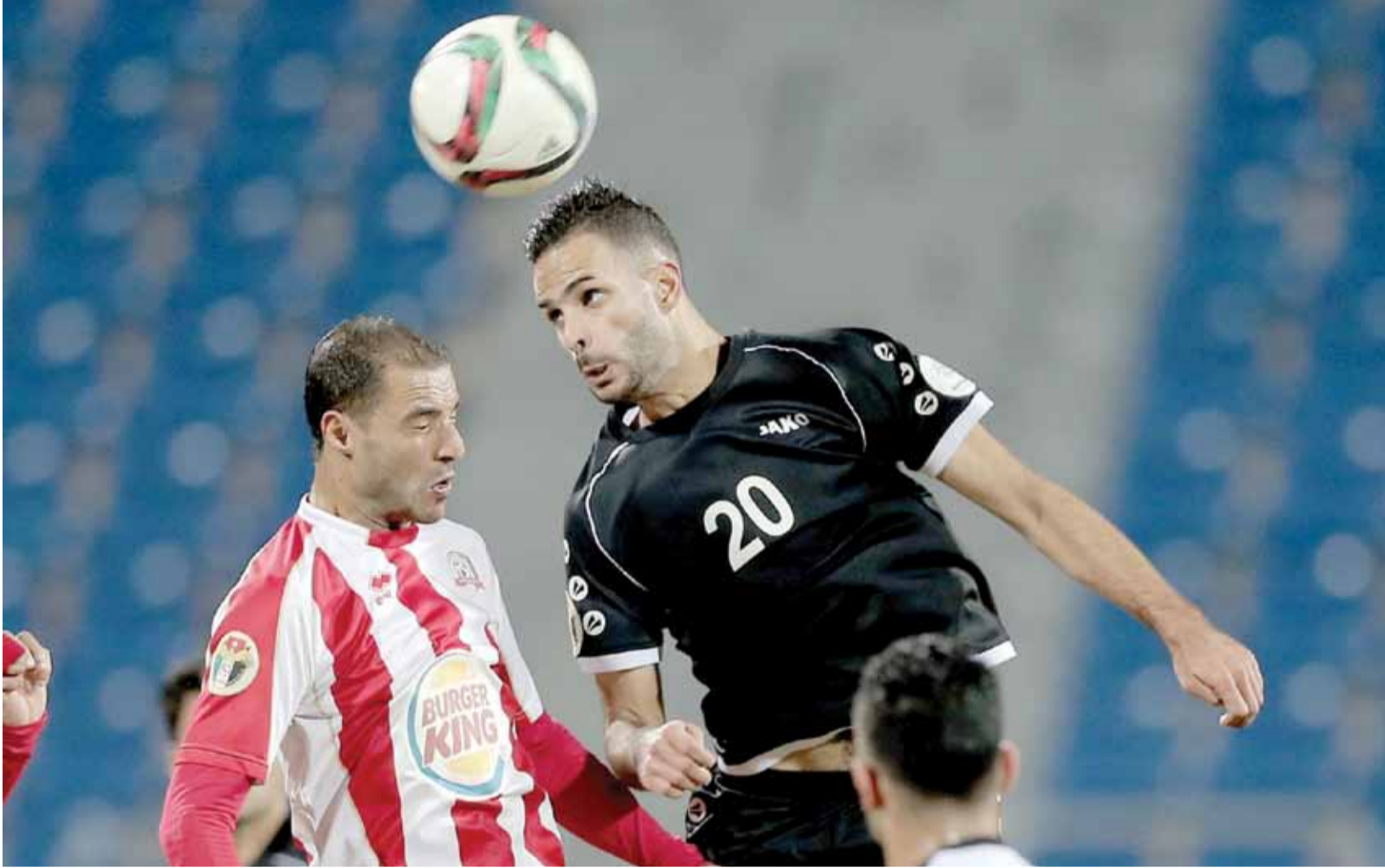
نقطة التعادل لم ترو ضماً البقعة وشباب الأردن

ولن يكون حال أندية سحاب والصريح وذات راس والبقعة مشابها لما كان عليه الحال في مرحلة الذهاب لأن بقاء الأمور كما هي تعني قطعياً هبوط اثنين من هؤلاء إلى مصاف أندية الدرجة الأولى، لذا سيكون العمل كبيراً خلال فترة التوقف الحالية عبر تعزيز الصفوف والتعاقد مع أجهزة فنية جديدة إذا ارتأت إدارات الأندية ذلك وهي تتحمل جزءاً كبيراً من المسؤولية لأنها هي من استقطبت المدربين واللاعبين قبل بداية مشوارها في