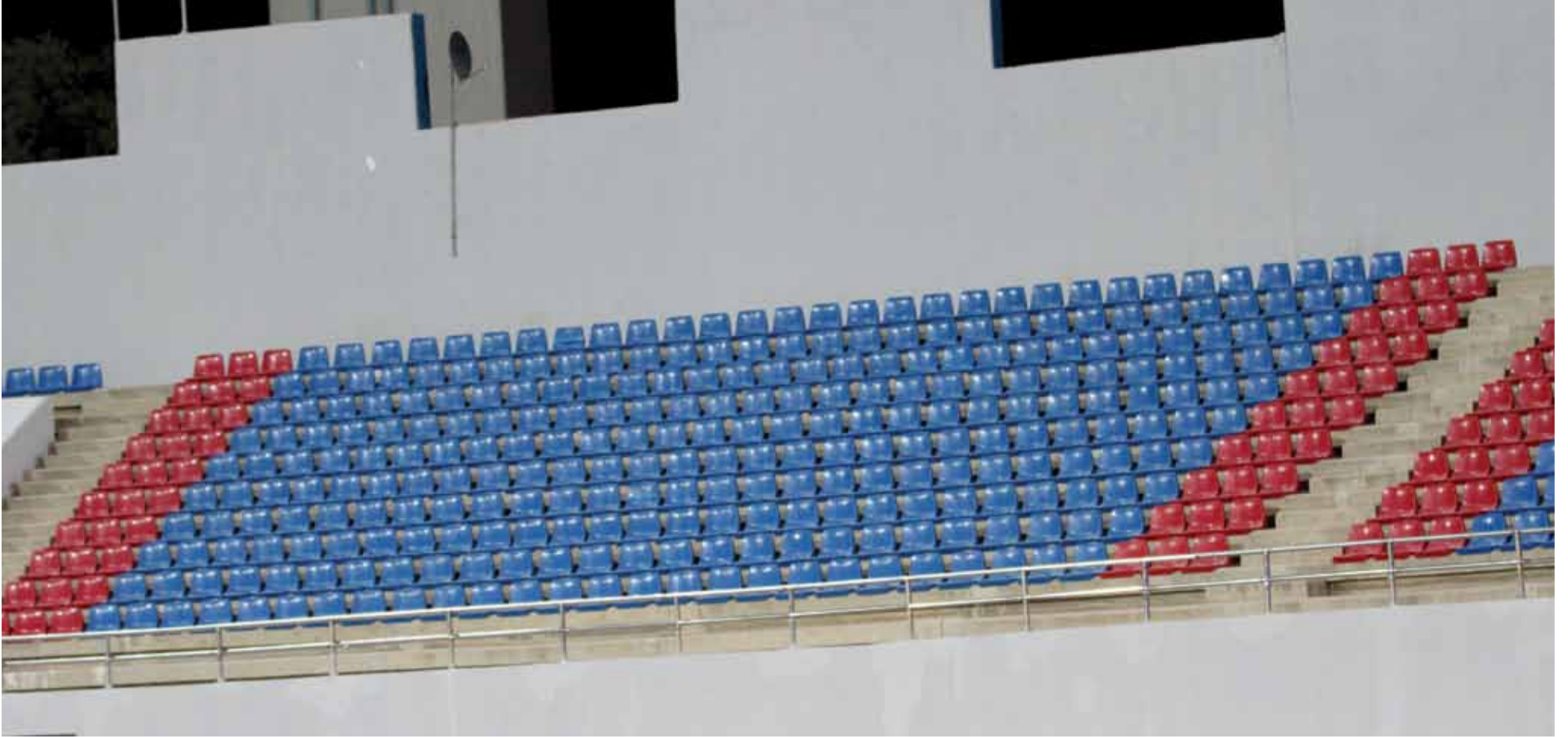
مدرجات ملعب الأمير محمد في الزرقاء شهدت غياب تام لجماهير الوحدات