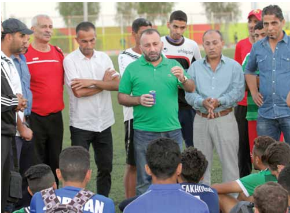
نجوم فريق الشباب يحظون بدعم إداري وجماهيري

هذه النتيجة ضمنت لـ«الأخضر» صدارة دوري الشباب لأسبوع آخر إذا ما علمنا أن هناك مطاردة مستمرة من قبل شباب الأردن والأهلي، وهذا يعني أن المطلوب تحقيق الفوز في المباريات الثلاث المقبلة بداية من موقعة الحسين والمقررة يوم بعد