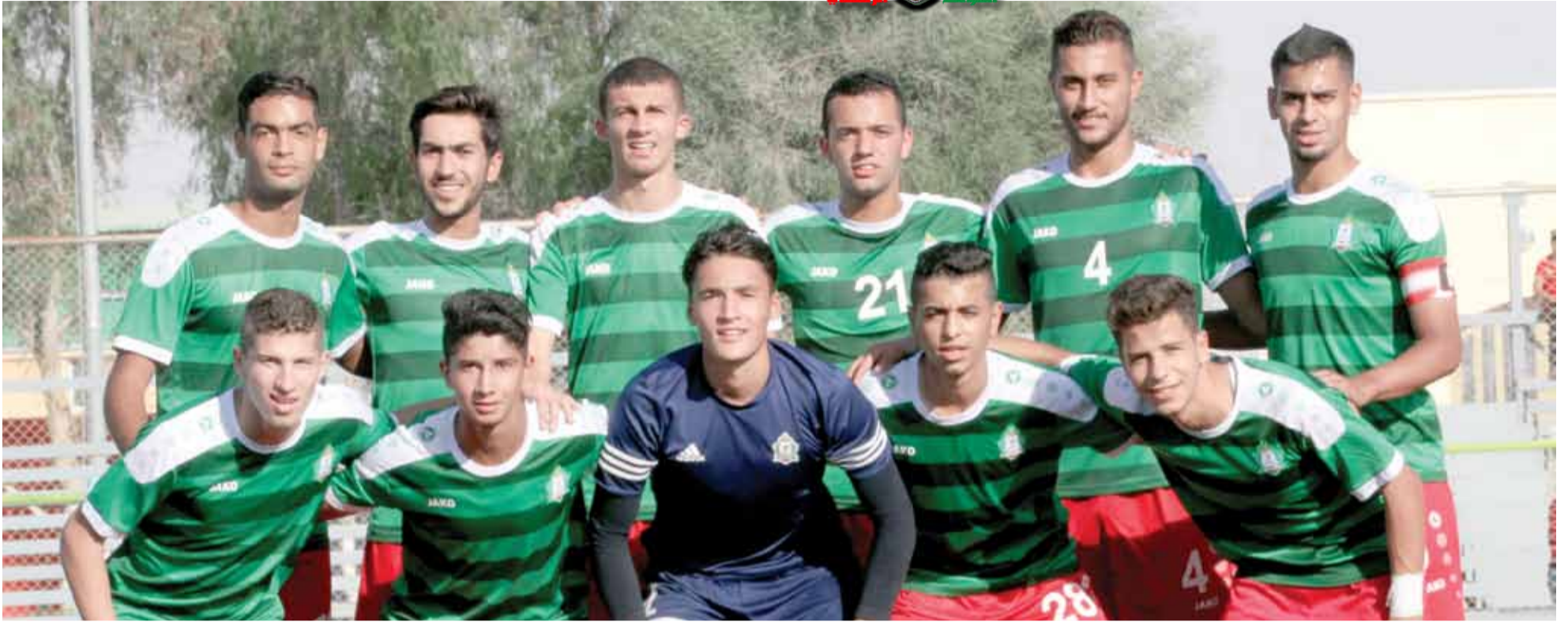
فريق الشباب كان على الموعد أمام الفيصلي وانتصر بهدفين