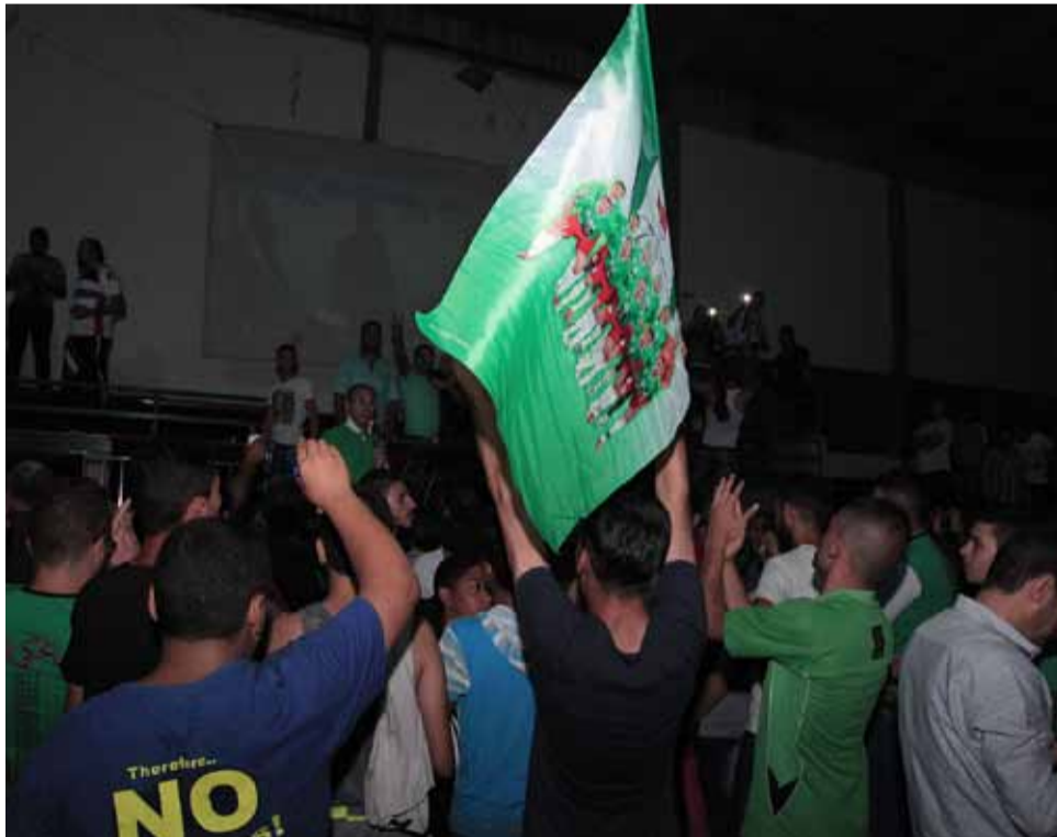
خرجت جماهيرنا حزينة لعدم قدرة الوحدات على الوصول إلى نهائي الدرع

الاعتداء تم على مرأى الجميع، ووثقته عدسات المصورين المتواجدين «الفوتوغرافية والفيديو»، الا ان تلك المشاهد غابت عن اتحاد الكرة الذي زج نفسه طرفا في المشكلة بدون حيادية، واكدته اللجنة التأديبية التي لم تأخذ التسجيلات التي وثقها نادي الوحدات عن الاعتداء الذي تم بحق الجماهير وسلوكيات لاعبي