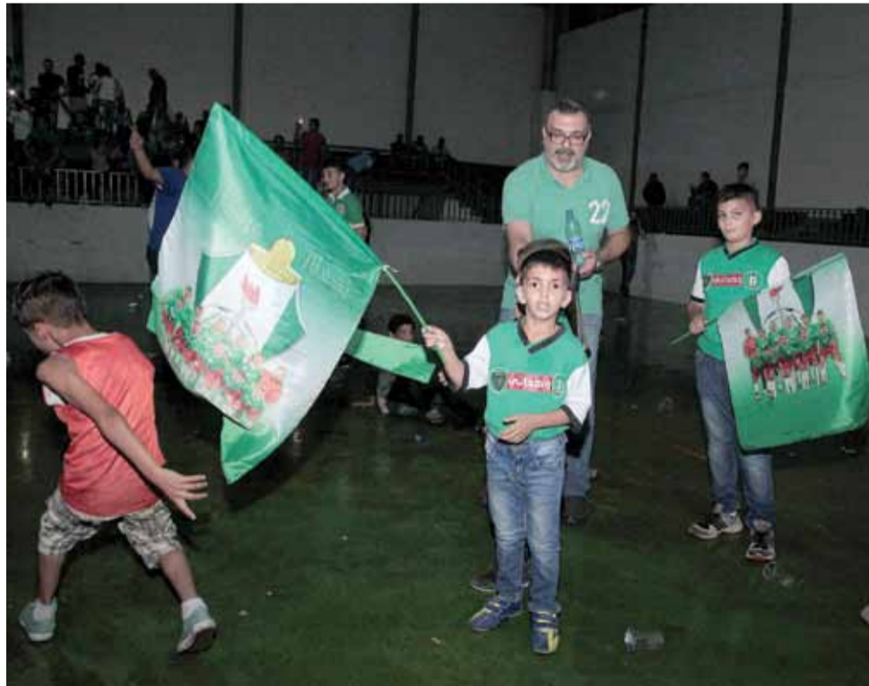
حتى الأطفال حضروا إلى ناديهم لتشجيع ناديهم

ولعل المسؤولية الكبيرة تقع على المسؤولين في قوات الدرك، خاصة وان عدسات المصورين «الفتوغرافية والفيديو»، وثقت الاعتداء الذي نفذه نفر من قوات الدرك اتجاه عدد من جماهير الوحدات، والذي اجبر عددا منهم على مراجعة المستشفى-مستشفى الزرقاء الحكومي-، واجبرت قوة الاصابات على ملازمة ٤ حالات المستشفى، مما يدفعهم الى مراجعة حساباتهم، وتقييم الموقف خاصة وان الوحدات كان موضوعيا وشفافا في تشخيص الحالة، عندما انصف نفر من قوات الدرك-الذين يرتدون الزي الرياضي-، والذي يضع امام المسؤولين في قوات الدرك، تفسير هذه الحالة، الانطلاق منها لمعالجة الخطأ وعدم تكراره، من خلال التوجه الى عقد