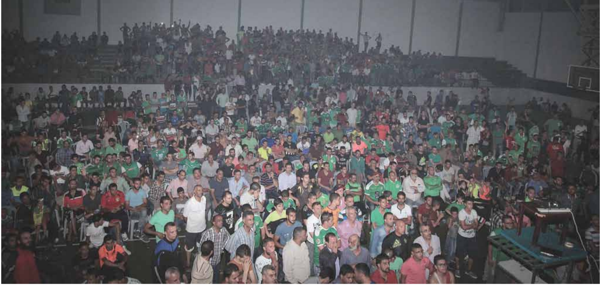
حضرت جماهيرنا بكثافة إلى صالة النادي لمؤازرة فريقها المحبوب