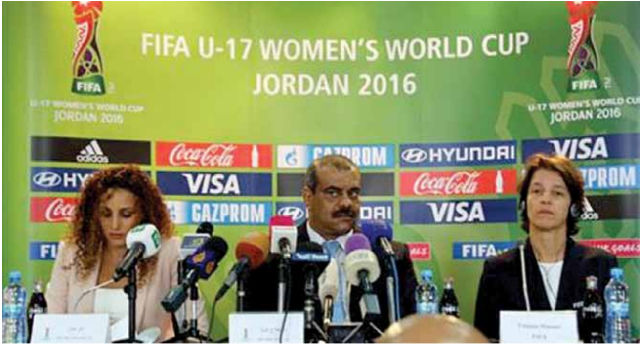
جانب من تحضيرات اللجنة المنظمة العليا لبطولة كأس العالم للشابات

ووصلت بعثة المنتخب الفنزويلي-بطل أميركا الجنوبية- في وقت متأخر من مساء السبت وهو اول الواصلين من المنتخبات المشاركة في المونديال.