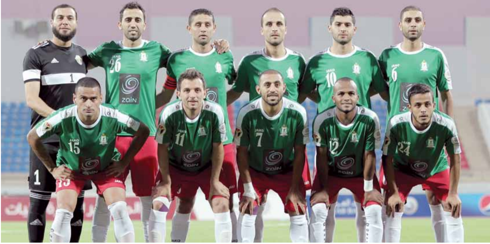
فريق الوحدات ينتظر معسكراً خارجياً إذا سمحت له الظروف بذلك