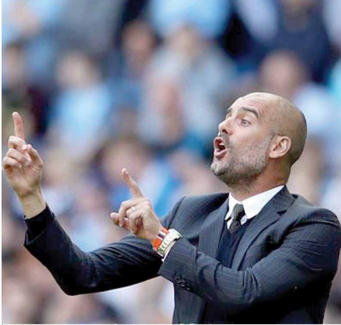
غوار ديولا يلعب بالنار: جدد المدير الفني الإسباني لفريق مانشيستر سيتي جوسيب غوار ديولا تصريحاته حول نيته ضم نجمي نادي برشلونة الإسباني ليونيل ميسي ونيمار دار سيلفا في سعيه الدؤوب لبناء أسطورة كروية جديد في الدوري الإنجليزي، هذا التصريح قابله استنكار واضح من إدارة البرشا التي دعت المدرب للكف عن مثل هذه التصريحات والاهتمام بفريقه فقط.

في سياقٍ اخر لاقت خطوة التبرع من مجموعة «وحداتي» لنادي الوحدات الأثر الكبير بين الجماهير التي قابلت الفكرة بالفخر والاعتزاز، مطالبة بأن يكون هنالك حملات شبيهة بحملة «وحداتي» لدعم نادي الوحدات.