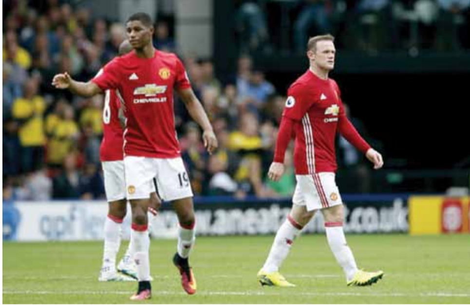
18 ركلة جزاء

اثبت ابناء جوارديولا انهم مرشحون فوق العادة للظفر بالدوري الانجليزي، فاستهل الفريق مشواره بالفوز على سنديلاندا 2-1، ثم ستوك سيتي 4-1، وانقض على غريمه اليونائيد وهزمه 3-1 وانهي الاسبوع الخامس بالفوز على بورنموث، ويتحضر الفريق لمواجهات أكثر صعوبة في قادم المباريات. الفريق يملك أقوى خط هجوم