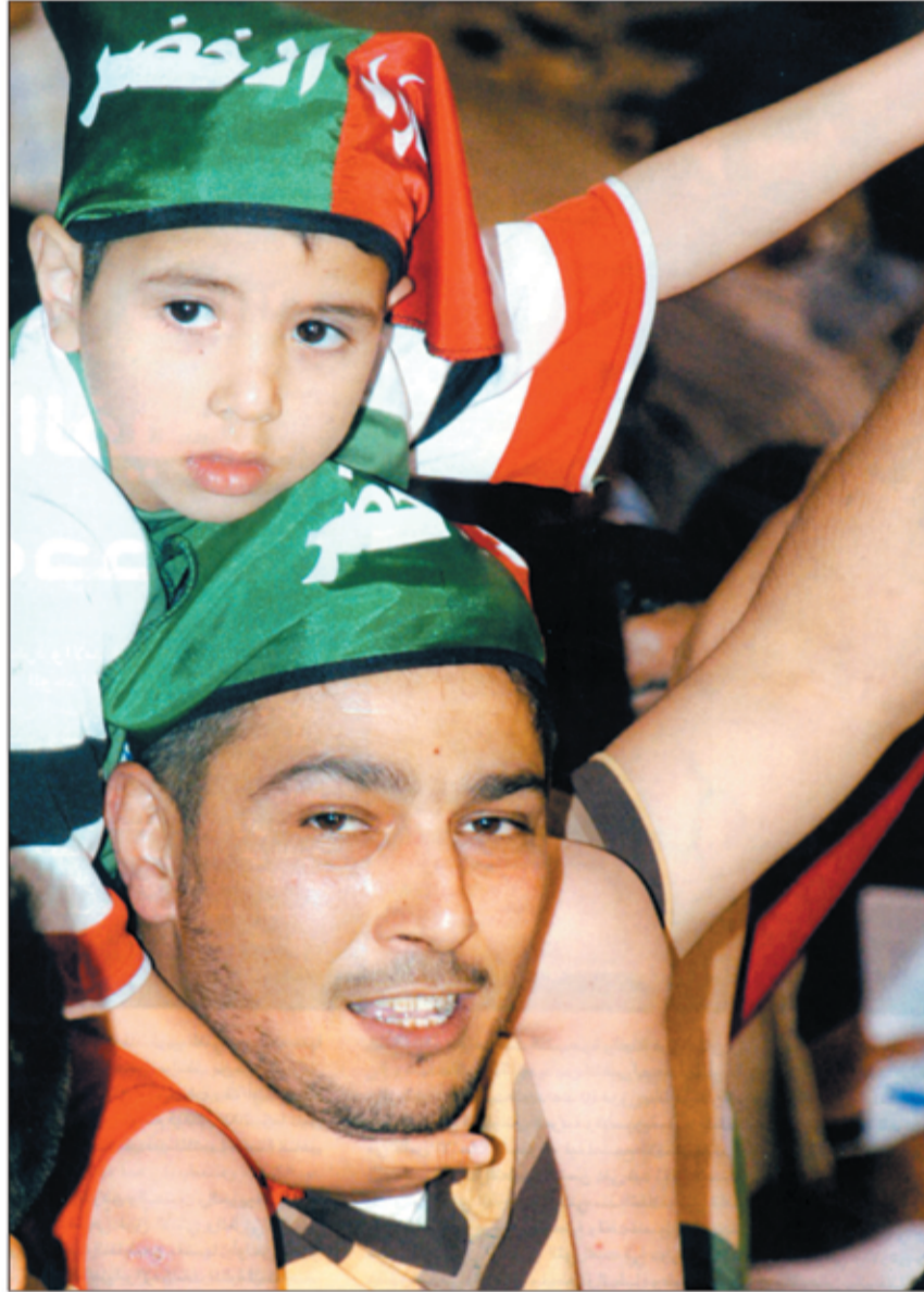
○ لماذا يحمل هذا الرجل طفله على كتفه.. ويتجه بعيداً عن الملعب؟

عبارات نارية، هم فعلاً سُخفاء سفهاء، يستغلون طيبة وحماسة شبابنا لشحنهم وتوجيههم الى حيث الإساءة والبذاءة.