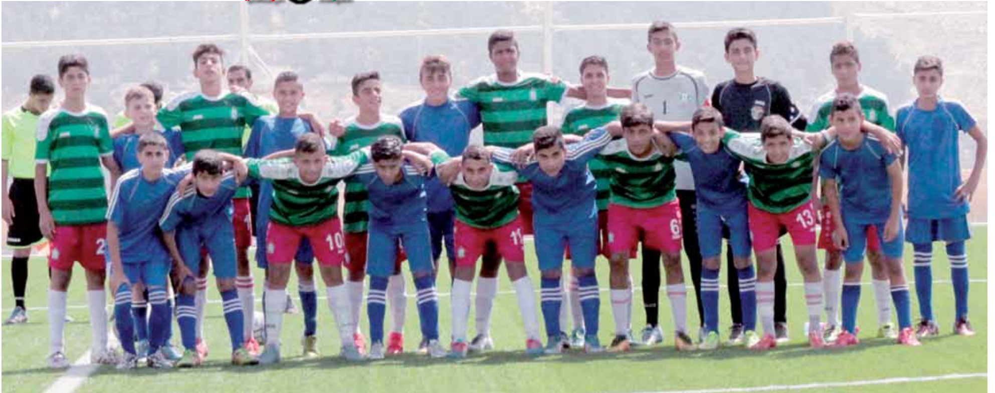
لقطة جامعة لفريقي الوحدات والرمثا