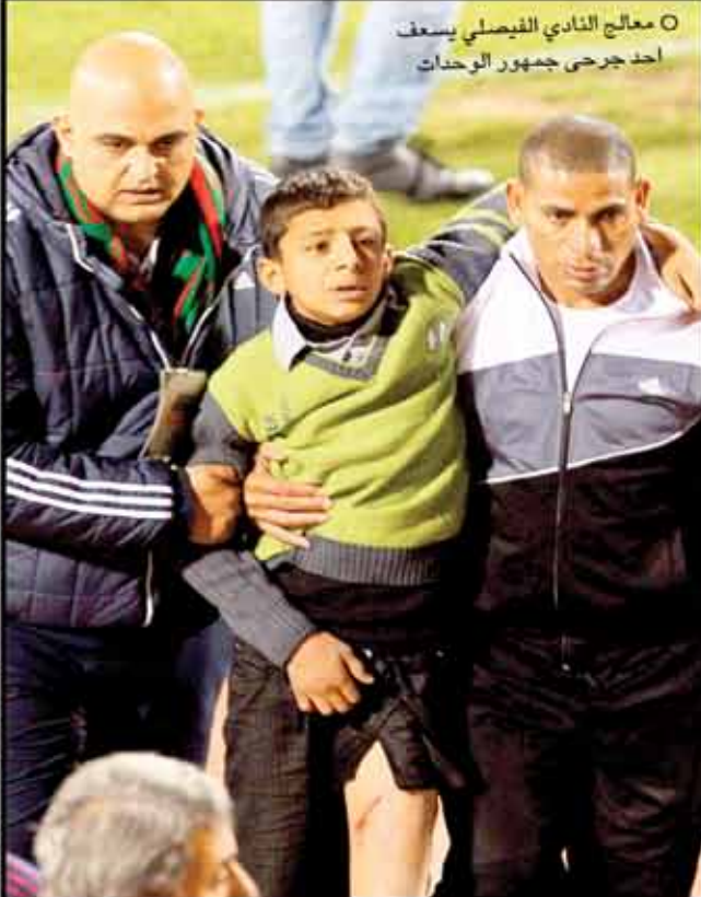
○ معالج النادي الفيصلي يسعف احد جرحى جمهور الوحدات