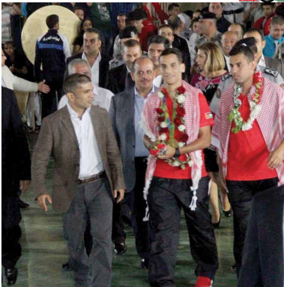
استقبال رسمي وشعبي إستحققه البطل الأولمبي أبو غوش