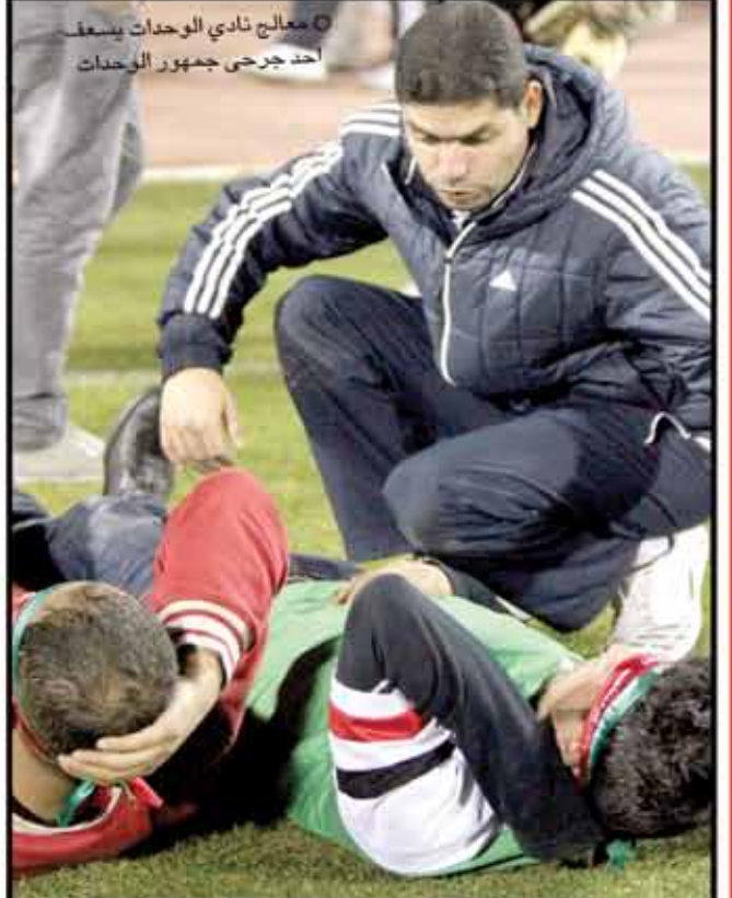
○ معالج نادي الوحدات يسعف احد جرحى جمهور الوحدات