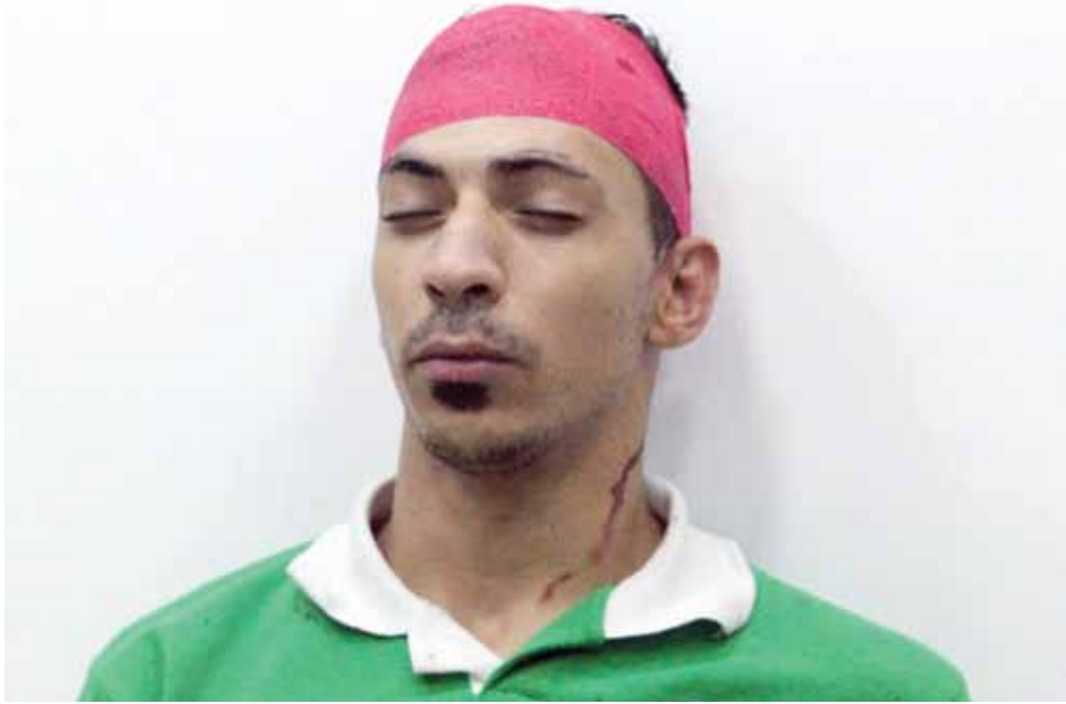
أحد الجماهير التي أصيبت في حادثة لقاء الوحدات والرمثا

فقط، فبعض جماهير الأندية الأخرى زادت أفعالها عن المسموح به وأصبحت تفتعل المشاكل بشكل مقصود بهدف «التخريب» ويجب أن تتحمل إدارات أنديةهم المسؤولية عبر فرض عقوبات مالية قاسية، أو خصم للنقاط لعل وعسى أن يتهذب سلوك جماهيرها قليلاً. اتحاد الكرة الآن أمام اختبار صعب يتمثل في إصدار قرارات صارمة تمنح صاحب الحق حقه، بما أن مجلس الإدارة قرر تعليق مشاركته في بطولة الدرغ حتى تظهر الحقيقة كاملة وبعد ذلك يبقى لكل حادث حديث.