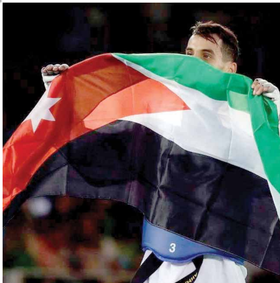
البطل الذهبي أحمد أبو غوش يحمل علم الوطن بعد إنجازه اللافت في أولمبياد البرازيل