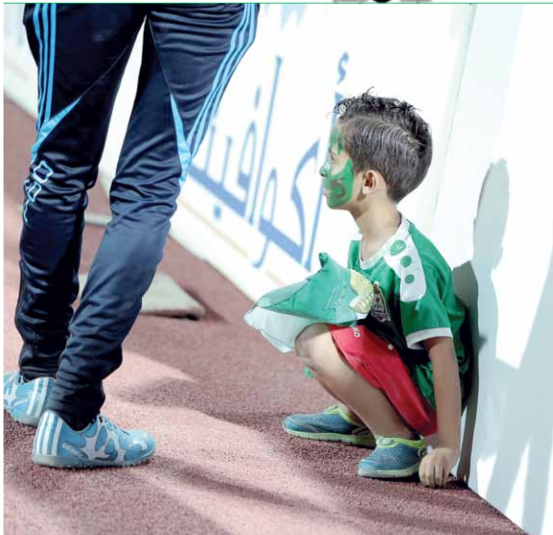
براءة الأطفال: طفل من جماهير الوحدات حضر لقاء معشوقه الأخضر وفي النهاية لم يكن يدرك انه سيعيش اسوء لحظات الطفولة وحينما يكبر سيبقى هذا الموقف عالقاً في ذهنه.

أحد الإعلاميين العرب غرد عبر صفحته الشخصية حول الحادثة متسائلاً كيف يمكن للأردن أن تتمكن من استضافة كأس العالم للسيدات تحت سن ١٧ عاماً بعد شهر من الآن ولا يوجد من قبل الجهات المعنية أي إدراك أو احساس بالمسؤولية التنظيمية للجماهير من خلال عملية الدخول والخروج حفاظاً على سلامتهم.