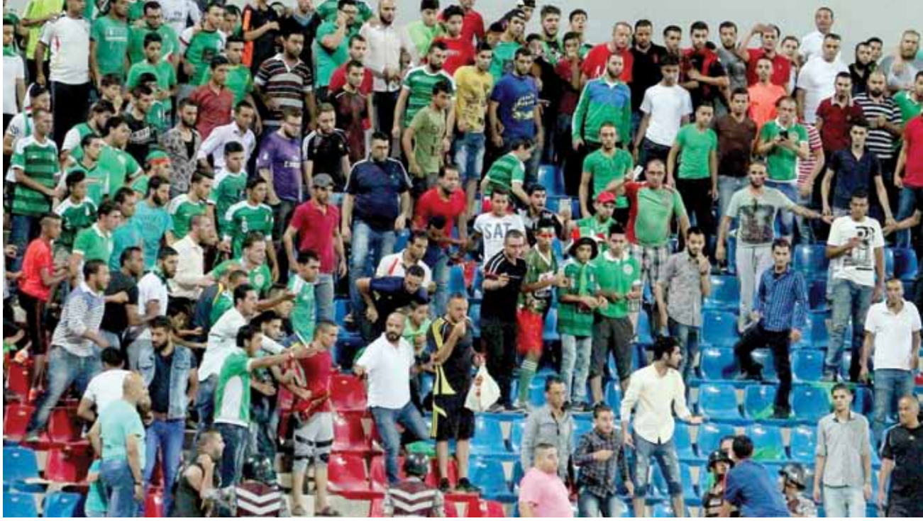
جماهير الوحدات بانتظار قرارات اللجنة التأديبية