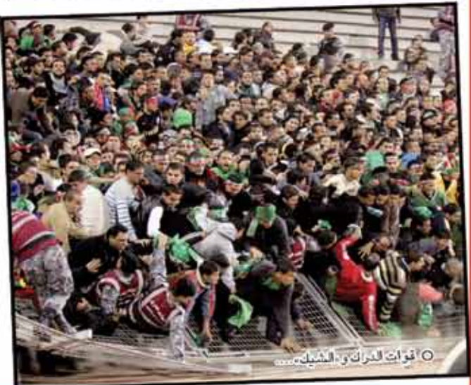
○ قوات الدرك والشبك