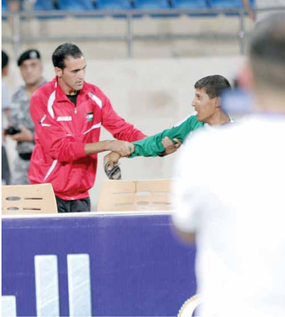
أحد رجال الدرك يمسك بأحد جماهير الوحدات

ما جسده الصور الفوتوغرافية للمصورين الصحفيين، وما نقله مسؤولين في ادارة نادي الوحدات، وجماهير نادي الوحدات - مواطنين اردنيين - بالصوت والصورة عبر مقاطع «الفيديو» التي ضجت بها المواقع الاخبارية ووسائل الاتصال الاجتماعي، يؤكد