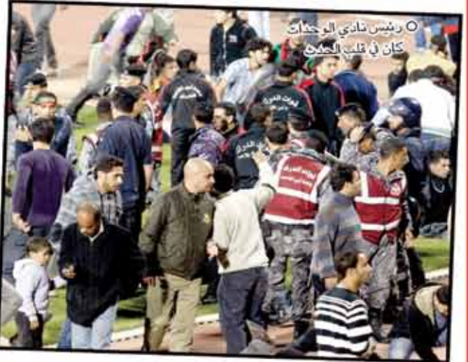
○ رئيس نادي الوحدات كان في قلب الحدث