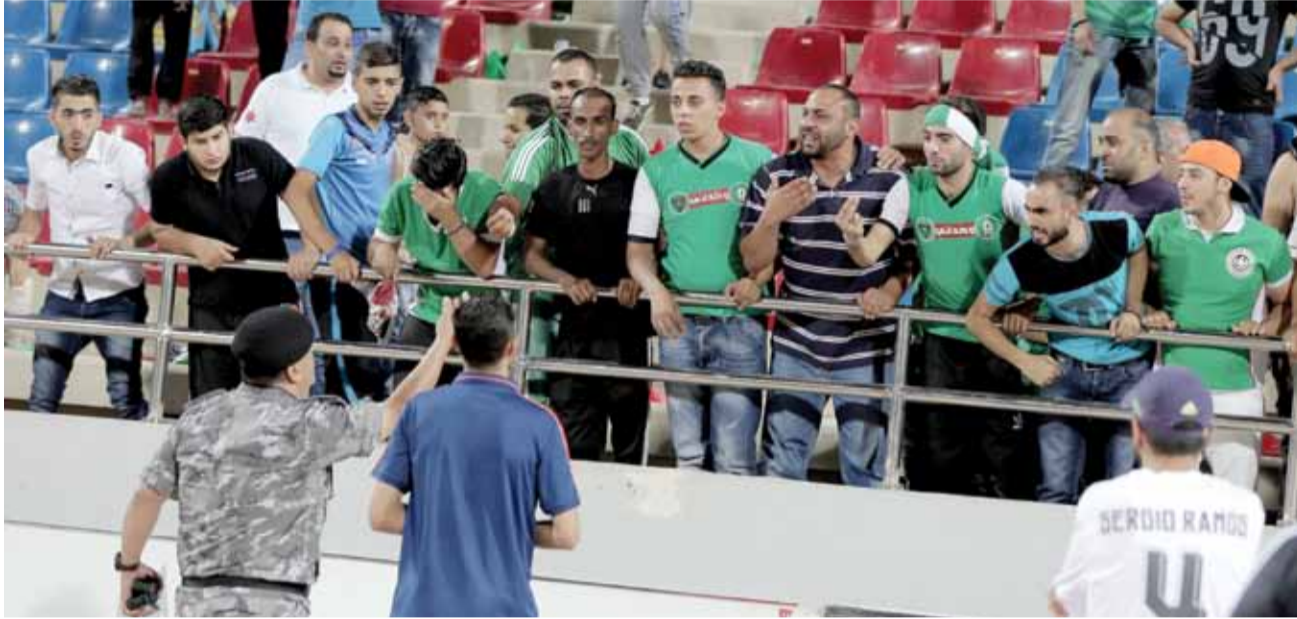
جانب من الاحداث التي اعقبت مباراة الوحدات والرمثا في درع اتحاد الكرة