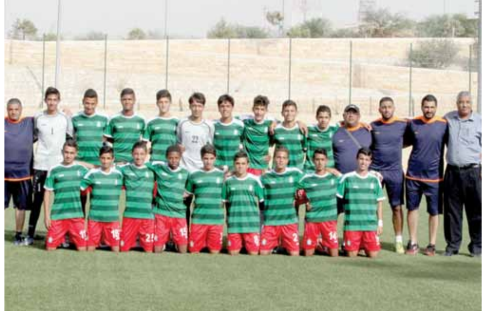
الوحدات .. كبة أدت إلى خسارة لقب كان في متناول اليد