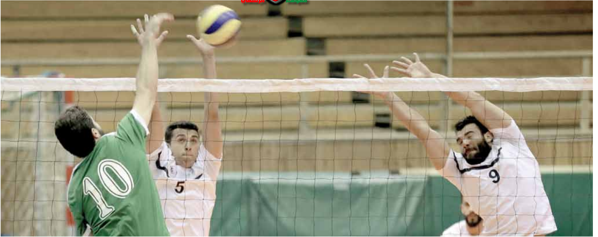
الطائرة الوحدانية بحاجة إلى ترتيب أوراقها من جديد