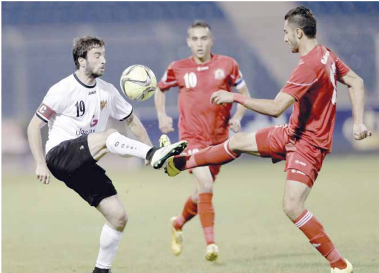
الجزيرة يستقطب محروس مدرباً والأهلي يواصل سعيه لمزيد من الألقاب

البحري الموسم الجديد بتحقيق الفوز على الوحدات وبالتالي قيادة فريقه للظفر بكأس السوبر وهو أيضاً أول لقب بتاريخ النادي.