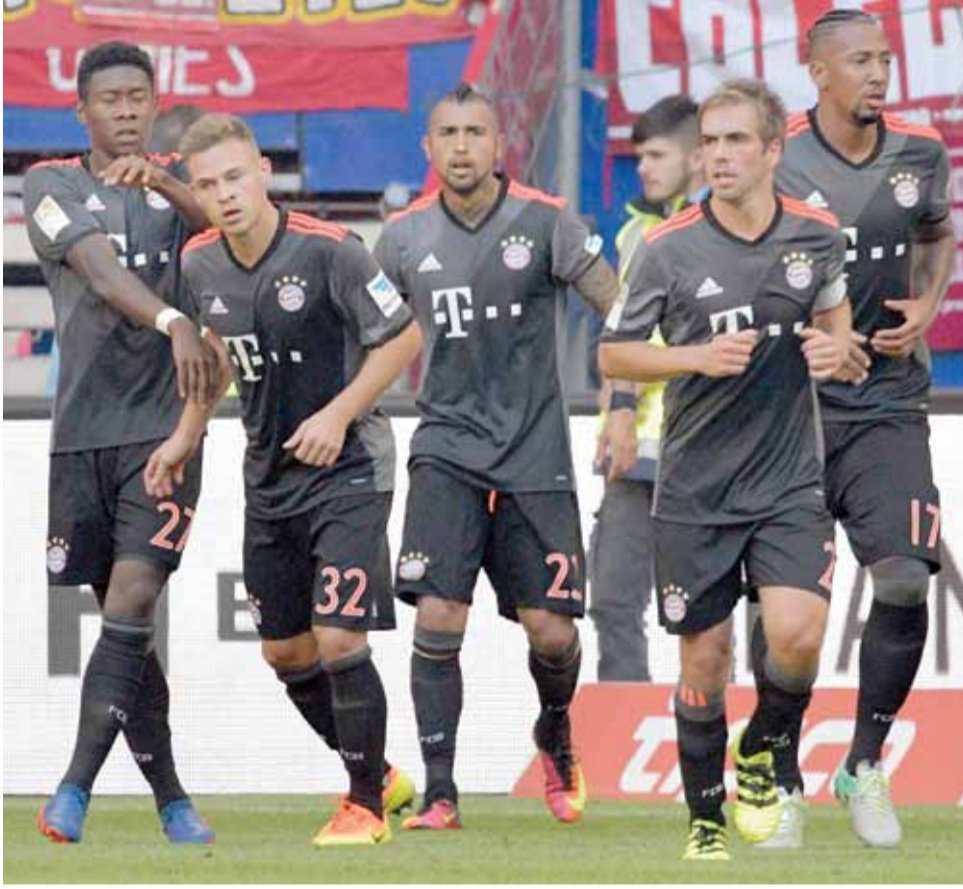
مباريات الاسبوع السادس

يلتقي يوم الجمعة هوفنهايم مع شالكة ٠٤، وكلون مع لايبزيغ، ويوم السبت يلتقي بايرن ميونخ مع كولن، هرتا برلين مع هامبورغ، فايبورج مع اينتراخت فرانكفورت، دارم شتات مع فيدر بريمن، انغولشات ٠٤ مع هوفنهايم وبايرن ليفركوزن مع بروسيا دورتموند، ويوم الاحد يلتقي فوفلسبورغ مع ماينز ٠٥ وشالكة ٠٤ مع بروسيا مونشنغلاباخ.