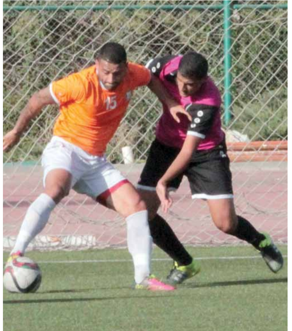
مايزال البرازيلي توريس غائباً عن التسجيل حتى في المباريات الودية