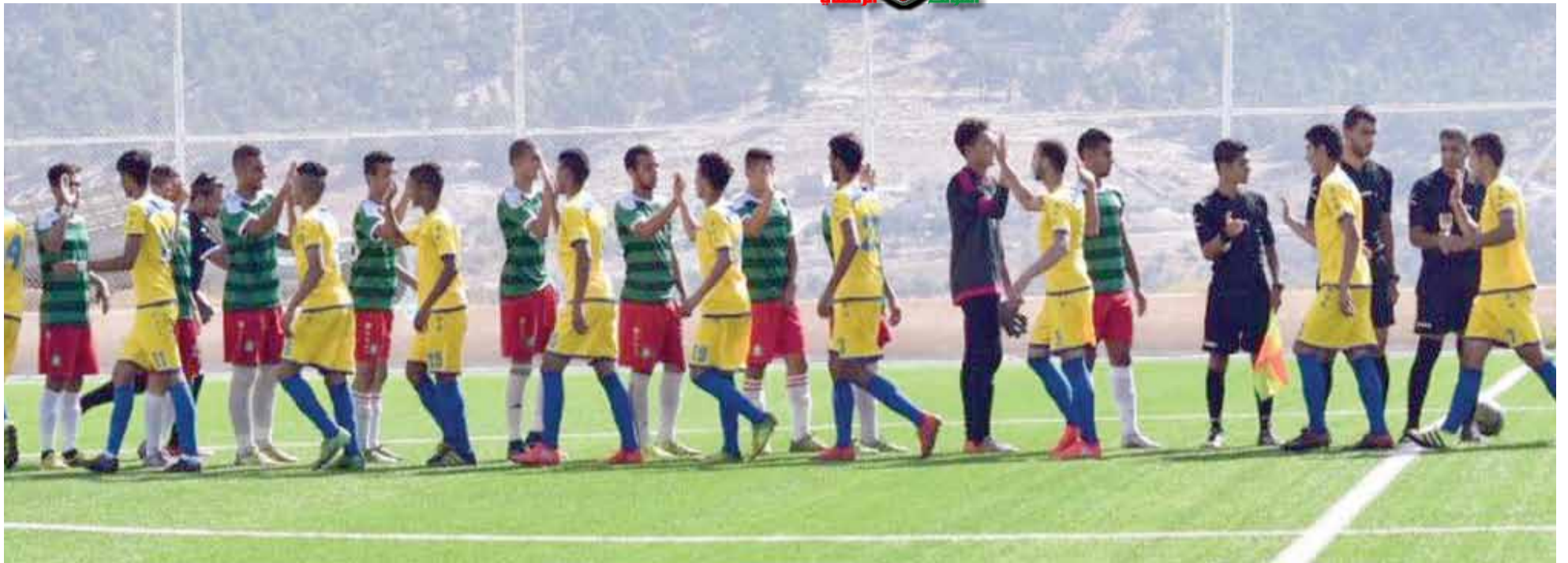
الوحداتي الشاب واصل إبداعاته بانتظار حسم اللقب اليوم