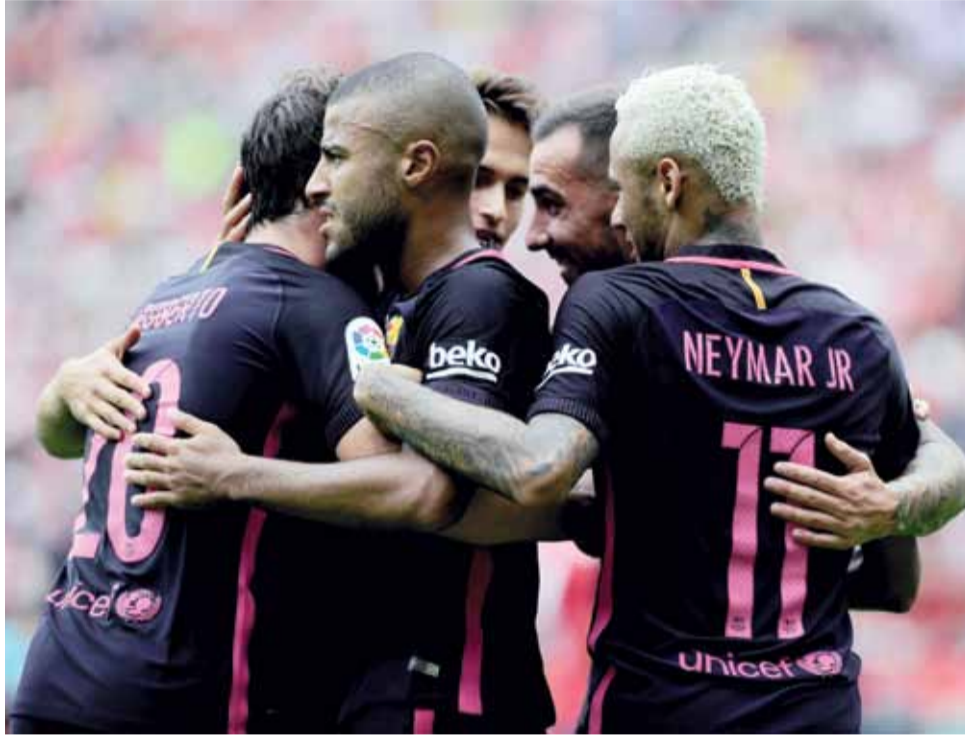
برشلونة يقلص الفارق مع مدريد المتصدر إلى نقطة واحدة

لاكورديا هدفا في مرماه في مباراة فريقه مع فلنسيا، وسجل لاعب ريال سوسيداد اسبير ايرامندي هدف لفريق ايبار بالخطأ في مرمى فريقه في المباراة التي فاز فيها ايبار 2-0.