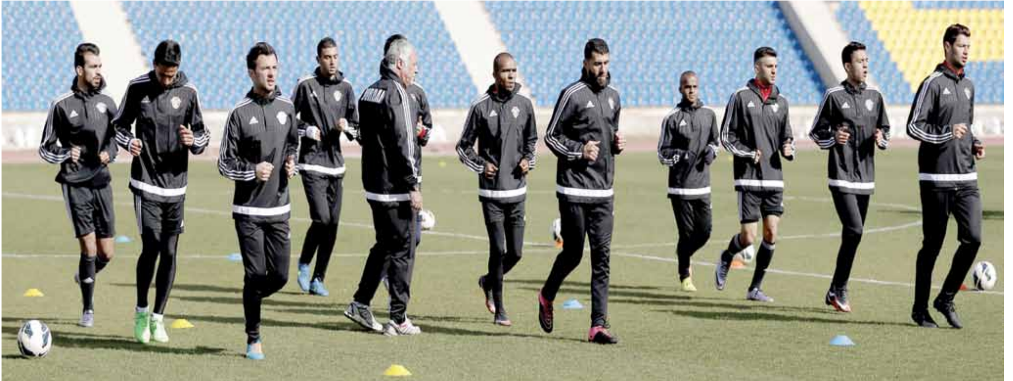
منتخب الكرة يتوجه إلى العقبة الخميس لإقامة معسكر تدريبي