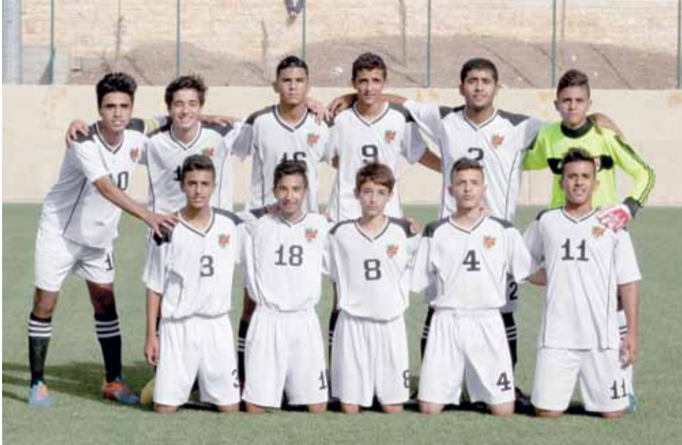
الأهلي حاز على لقب دوري الناشئين مستثمراً عثرات الوحدات