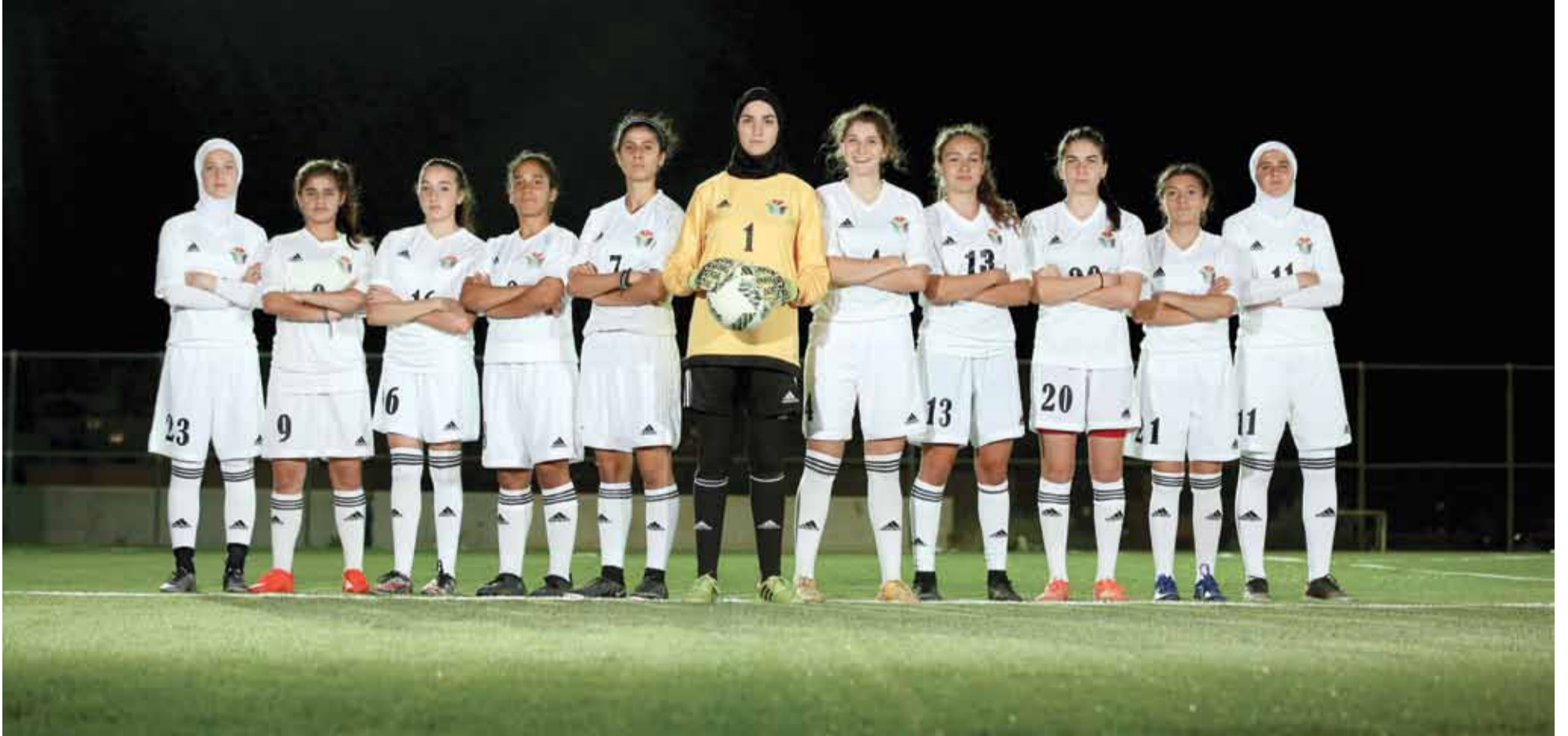
منتخب النشريات يستعد بكل قوته لإفتتاح مشواره في مونديال الشابات