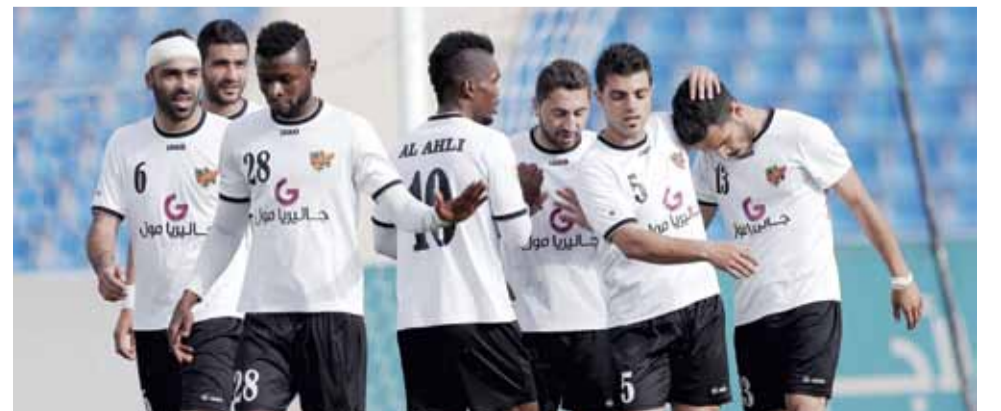
عدد من لاعبي فريق الأهلي المتوج بلقب كأس المناسير في الموسم الماضي