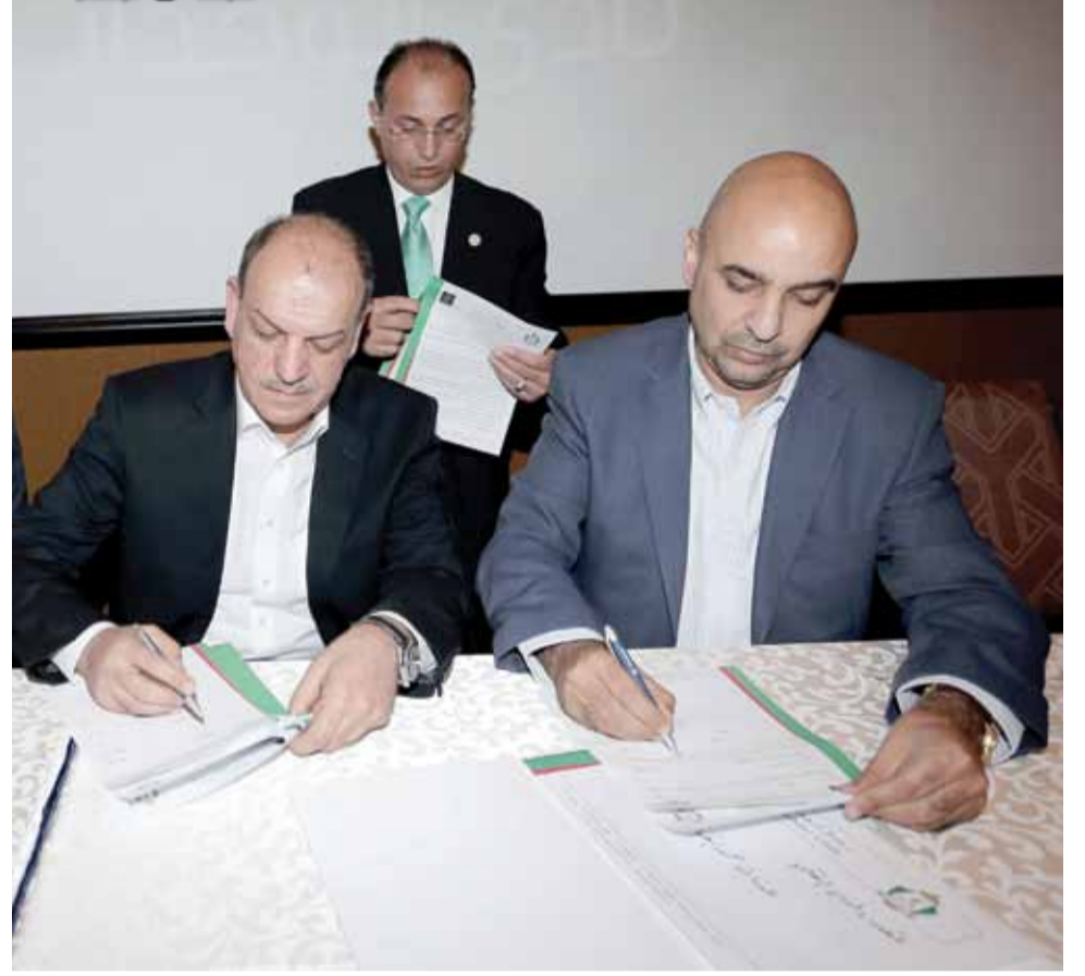
جانب من حفل التوقيع