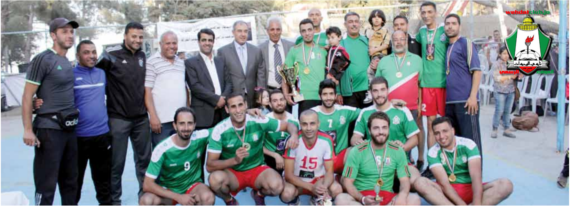
فريق الوحدات لكرة الطائرة بحلته الجديدة المتوج بلقب بطولة نادي التعاون مؤخراً