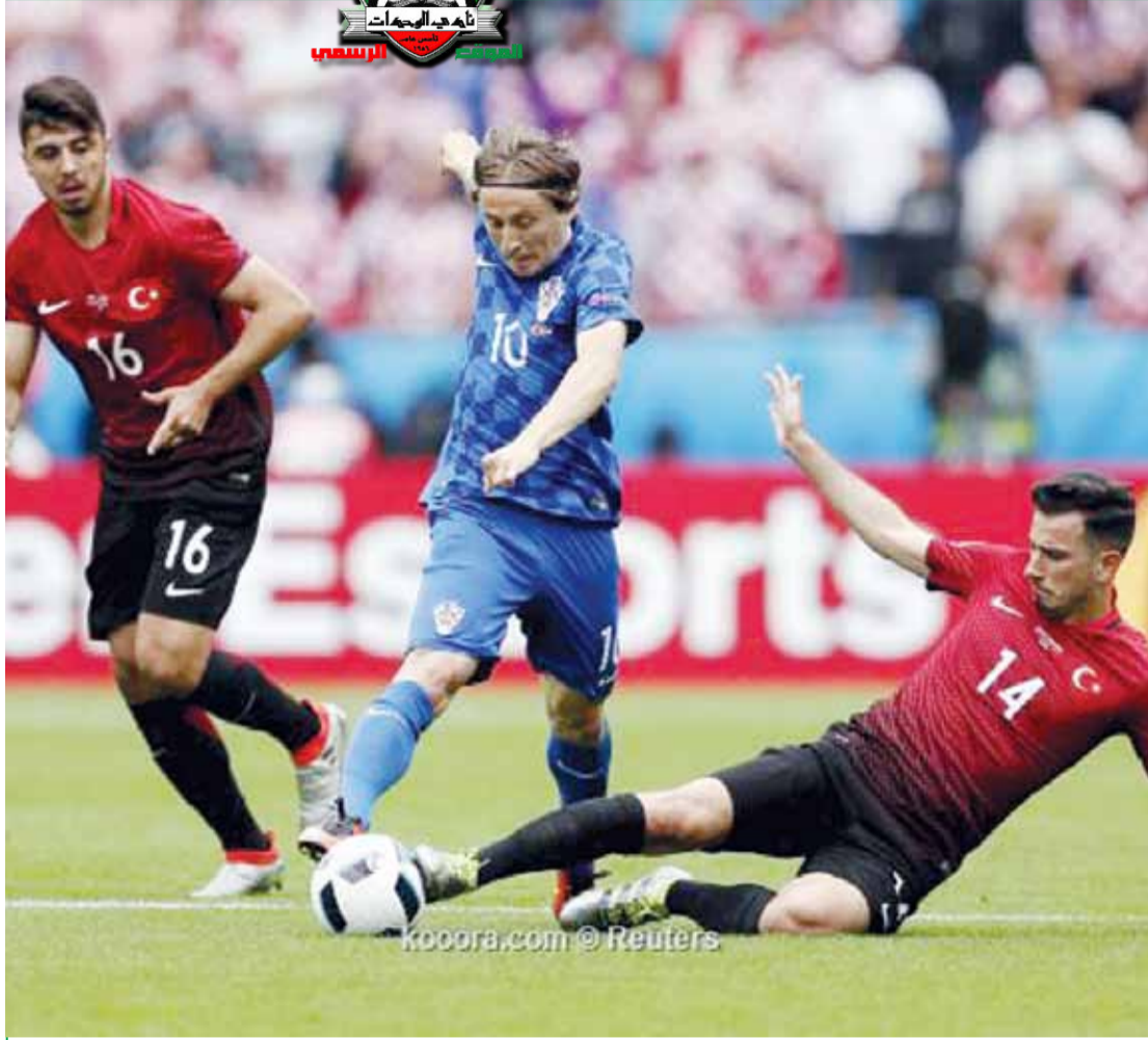
مورديتش بطل العمليات: حصد نجم المنتخب الكرواتي وريال مدريد الإسباني لوكا مورديتش لقب أفضل لاعب في لقاء منتخب كرواتيا وتركيا ضمن لقاءات يورو 2016 في فرنسا وذلك بعدما استطاع ان يكون أكثر اللاعبين لمسا للكرة بـ٧٦ مرة، وبلغت دقة تمريراته ٨٨,١٪، وتمكن من وضع تمريرتين حاسمتين وقطعه الكرة أربع مرات وتشتيته ثلاث مرات، وتسجيله هدف المباراة الوحيد.

في المقابل بدأت سهام النقد والتجريح تطل برأسها محاولة التقزيم من الإنجاز الذي حققه مجلس الإدارة بالتوقيع مع حمد وجهازه المعاون من خلال التباكي بأن قيمة الصفقة المالية من شأنها أن تكلف خزينة النادي كثيراً متناسين بان العراقي حمد قادم لحصد الإنجازات وتدعيم خزينة النادي بمكافآت البطولات. إلى ذلك عبر عدد من المدربين الوطنيين المحليين عبر مواقع التواصل الاجتماعي عن عدم رضاهم واستيائهم من قرار الاتحاد بإبعادهم عن صفوف المنتخبات الوطنية والاستعانة بعدد من المدربين الذين سبق وأن فشلوا في مهماتهم السابقة. وفي سياق آخر تفاعلت الجماهير العربية مع أحداث الشغب التي ضربت يورو 2016 في فرنسا حيث حملت التغريدات نوع من التهكم على الجماهير الأوروبية واصفة إياها بأنها غير حضارية.