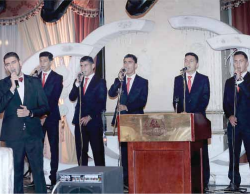
كورال فتيان نادي الوحدات قدمت وصلة غنائية ملتزمة تفاعل معها الجمهور