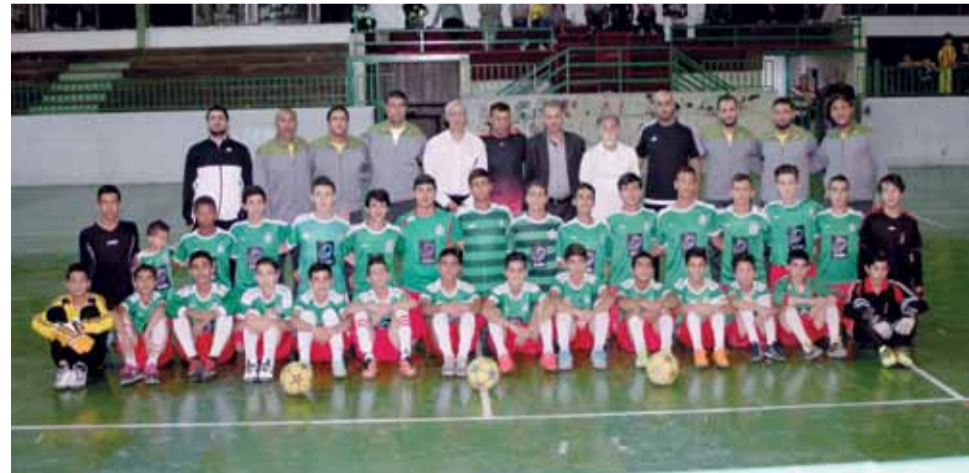
لقطة جامعة لأعضاء مجلس الإدارة والجهازين الفني والإداري ولاعبي أكاديمية الوحدات لكرة القدم