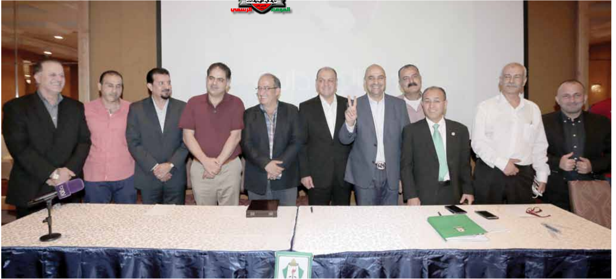
عدد من أعضاء مجلس الإدارة والجهاز الفني الجديد لفريق الكرة الأول عقب حفل التوقيع